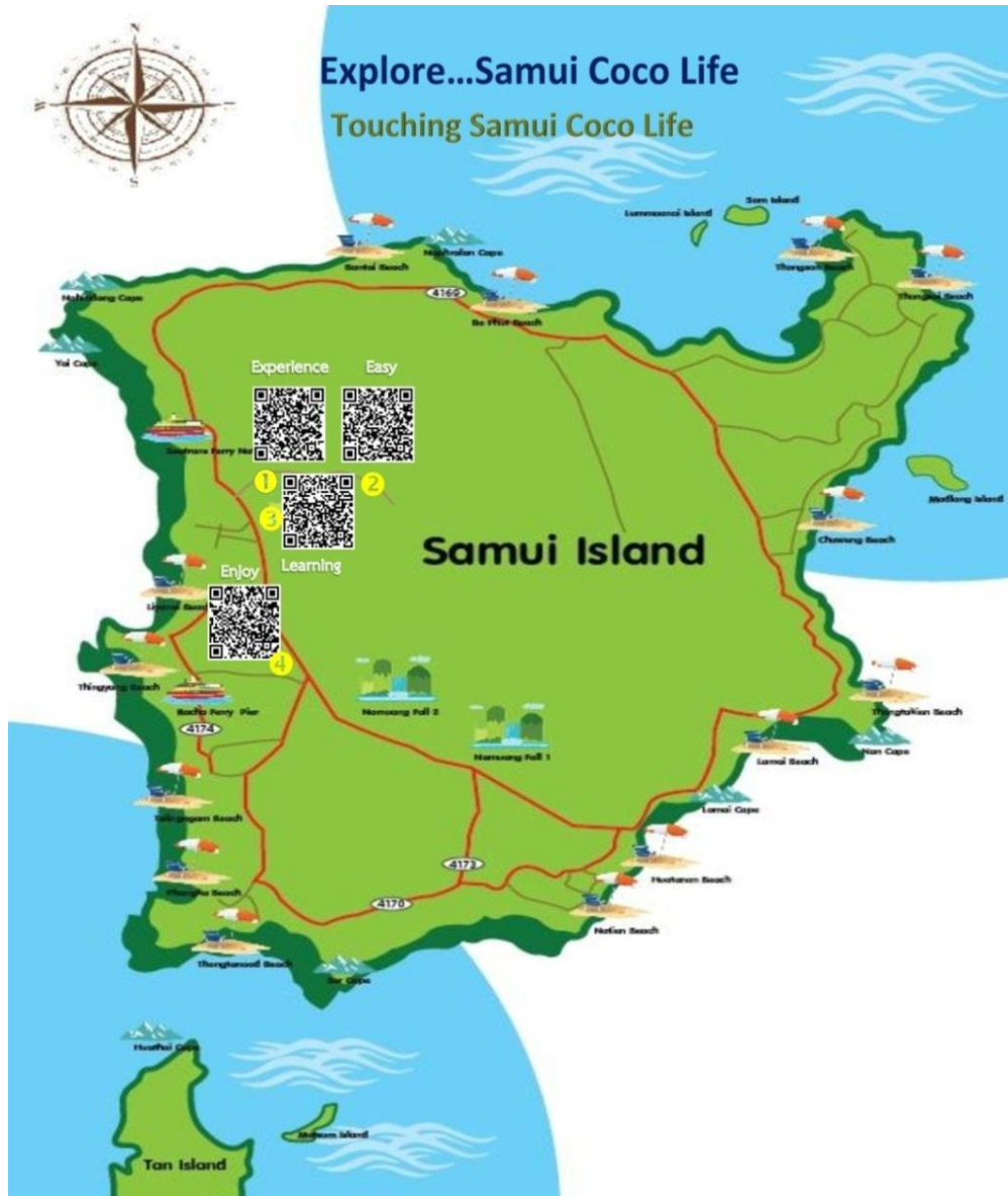
ภาพที่ 4.1 ตัวอย่าง QR Code และแผนที่เส้นทางท่องเที่ยวเชิงสร้างสรรค์มะพร้าวสมุย เส้นที่1“Touching Samui Coco Life”

สำหรับแผนที่เส้นทางท่องเที่ยวเชิงสร้างสรรค์มะพร้าวสมุยใน เส้นที่1“Touching Samui Coco Life” มี QR Code สถานที่จัดกิจกรรมในเส้นทางแสดงไว้บนแผนที่ 4 จุด โดยข้อมูลใน QR Code แต่ละจุดมีรายละเอียดดังนี้