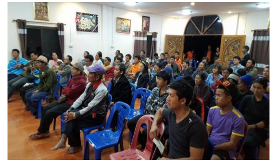
รูปภาพชุดที่ 4 สร้างความรู้ความเข้าใจเกี่ยวกับการดำเนินงานแผนงานวิจัย และการจัดการการท่องเที่ยวโดยชุมชน ให้กับผู้นำและประชาชนบ้านนาโต บ้านโป่งไฮ และบ้านห้วยกระ