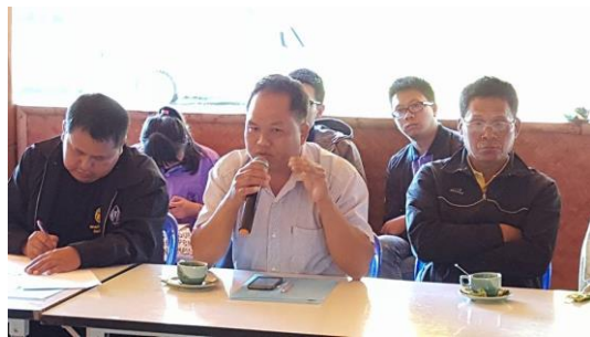
รูปภาพชุดที่ 2 สร้างความรู้ความเข้าใจเกี่ยวกับการดำเนินงานแผนงานวิจัย และการจัดการการท่องเที่ยวโดยชุมชน ให้กับกลุ่มเป้าหมายในพื้นที่