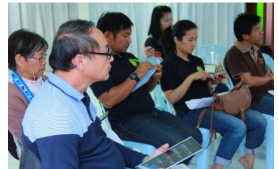
รูปภาพชุดที่ 11 การประชุมทีมวิจัยเพื่อวางแผนเตรียมให้ชุมชนนำเสนอ ประสบการณ์การศึกษาดูงานให้กับประชาชนในพื้นที่ของตนเอง