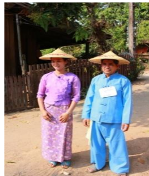
รูปภาพชุดที่ 7 กิจกรรมการศึกษาดูงานในพื้นที่บ้านแพมบก (ชาติพันธุ์ไทยใหญ่) อำเภอลำปาง จังหวัดแม่ฮ่องสอน