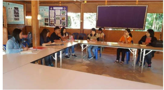
รูปภาพชุดที่ 1 การประชุมเตรียมความพร้อมร่วมกันของหัวหน้า โครงการวิจัยเพื่อสร้างความเข้าใจ วิธีการทำงาน