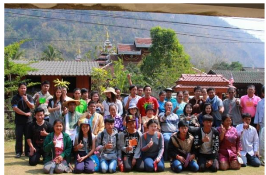
รูปภาพชุดที่ 8 กิจกรรมการศึกษาดูงานในพื้นที่บ้านแม่ละนา (ชาติพันธุ์ไทยใหญ่) อำเภอปางมะผ้า จังหวัดแม่ฮ่องสอน