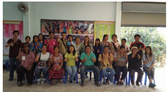
รูปภาพชุดที่ 13 ลงพื้นที่ติดตามการจัดกิจกรรมการอบรมนักร้องสื่อความหมาย เพื่อค้นหาของดีในชุมชน