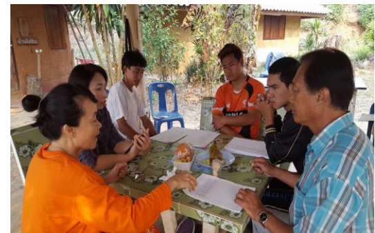
รูปภาพชุดที่ 16 ติดตามแกนนำในชุมชนที่มีส่วนร่วมในการจัดเก็บข้อมูล ทรัพยากรชุมชนเพื่อการจัดการท่องเที่ยวโดยชุมชน