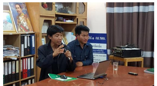
รูปภาพชุดที่ 12 ชุมชนที่ร่วมศึกษาดูงานถ่ายทอดประสบการณ์แก่ประชาชน ในหมู่บ้านของตนเอง