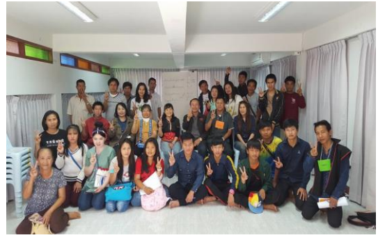
รูปภาพชุดที่ 10 การสรุปบทเรียนของผู้เข้าร่วมกิจกรรมการศึกษาดูงาน ร่วมกับคณะผู้วิจัย