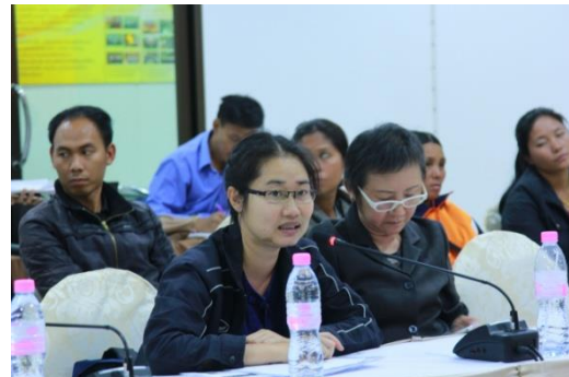
รูปภาพชุดที่ 18 การประชุมเสวนานำเสนอผลการดำเนินงานตาม แผนงานวิจัย