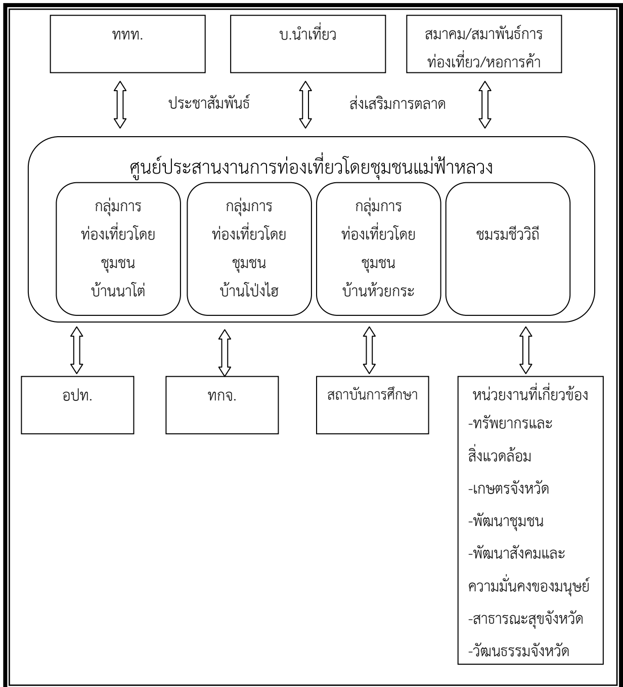
แผนภาพที่ 3 เครือข่ายและรูปแบบการจัดการการท่องเที่ยวโดยชุมชน ในเขตบริการศูนย์การเรียนรู้บ้านนาโต้ อำเภอแม่ฟ้าหลวง จังหวัดเชียงราย

เชียงราย ส่วนหน่วยงานสนับสนุนด้านการพัฒนาศักยภาพของคนในกลุ่มท่องเที่ยว ได้แก่ องค์กรปกครองส่วนท้องถิ่น สำนักงานการท่องเที่ยวและกีฬาจังหวัด สถาบันการศึกษา รวมถึงหน่วยงานต่างๆ ที่เกี่ยวข้อง เช่น พัฒนาชุมชนจังหวัด สำนักงานเกษตรจังหวัด เป็นต้น