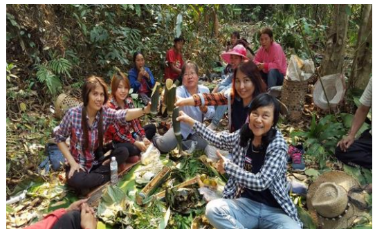
รูปภาพชุดที่ 14 ลงพื้นที่ติดตามการจัดกิจกรรมการสำรวจเส้นทางท่องเที่ยว