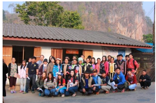
รูปภาพชุดที่ 9 กิจกรรมการศึกษาดูงานในพื้นที่บ้านจำโป้ (ชาติพันธุ์ลาหู่) อำเภอปางมะผ้า จังหวัดแม่ฮ่องสอน