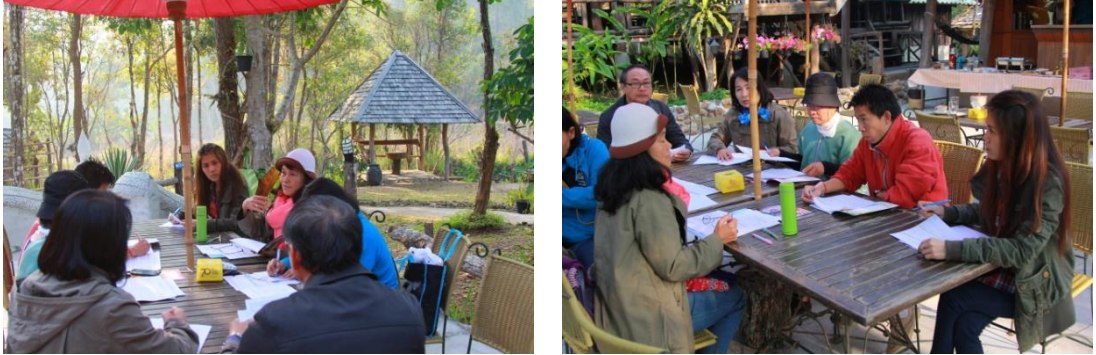
รูปภาพชุดที่ 5 การประชุมหัวหน้าโครงการวิจัยและทีมวิจัยเพื่อเตรียมความพร้อมก่อนกิจกรรมศึกษาดูงาน