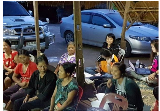
รูปภาพชุดที่ 17 ติดตามการเก็บรวบรวมข้อมูลของชุมชนและทบทวนข้อมูล ที่ได้มาผ่านเวทีประชาคม บ้านนาโต บ้านโป่งไฮ บ้านห้วยกระ และชมรมชีววิถี