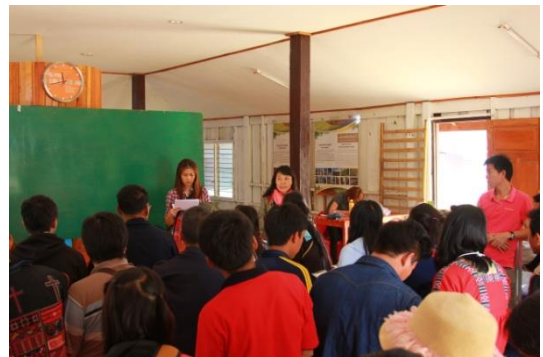
รูปภาพชุดที่ 6 กิจกรรมการศึกษาดูงานในพื้นที่เครือข่ายการท่องเที่ยวโดยชุมชน อำเภอภักดีชุมพล จังหวัดชัยภูมิ