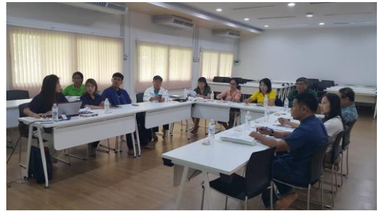
รูปภาพชุดที่ 15 การประชุมทำความเข้าใจและติดตามความก้าวหน้าการ จัดทำรายงานวิจัยรอบ 2 เดือน