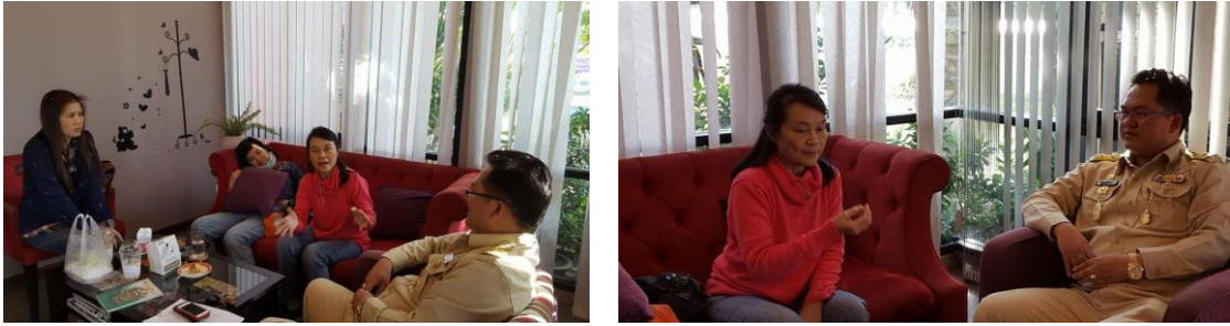
รูปภาพชุดที่ 3 สร้างความเข้าใจเกี่ยวกับการดำเนินงานตามแผนงานวิจัยฯ กับนายกองค์การบริหารส่วนตำบลแม่สลองใน