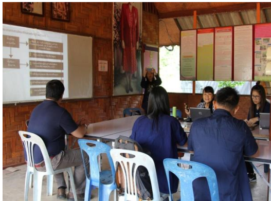
รูปภาพชุดที่ 19 ประชุมทีมวิจัยเพื่อสรุปแนวทางการสร้างความเข้มแข็งให้ชุมชนบนพื้นที่สูง