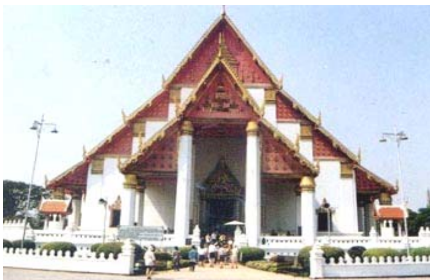
ภาพประกอบ 6 วิหารพระมงคลบพิตร

การสัมภาษณ์ผู้มาเที่ยวชมนครประวัติศาสตร์ ณ วิหารพระมงคลบพิตร ดังแสดงในภาพประกอบ 6