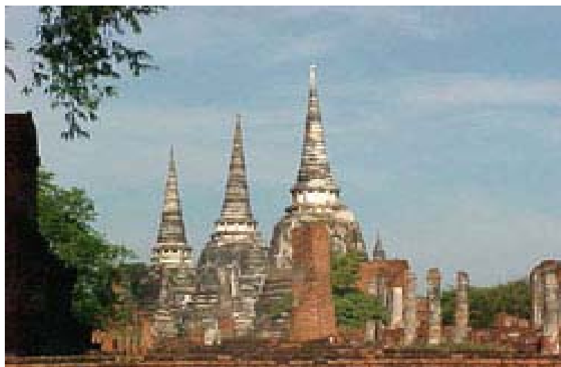
ภาพประกอบ 3 วัดพระศรีสรรเพชญ์

การสัมภาษณ์ครั้งนี้ได้ดำเนินการสัมภาษณ์ ณ วัดพระศรีสรรเพชญ์ ดังแสดงในภาพประกอบ 3