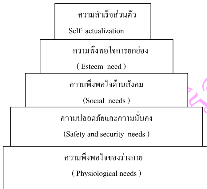
ภาพประกอบ 1 แสดงลำดับขั้นของความพึงพอใจตามทฤษฎีของมาสโลว์