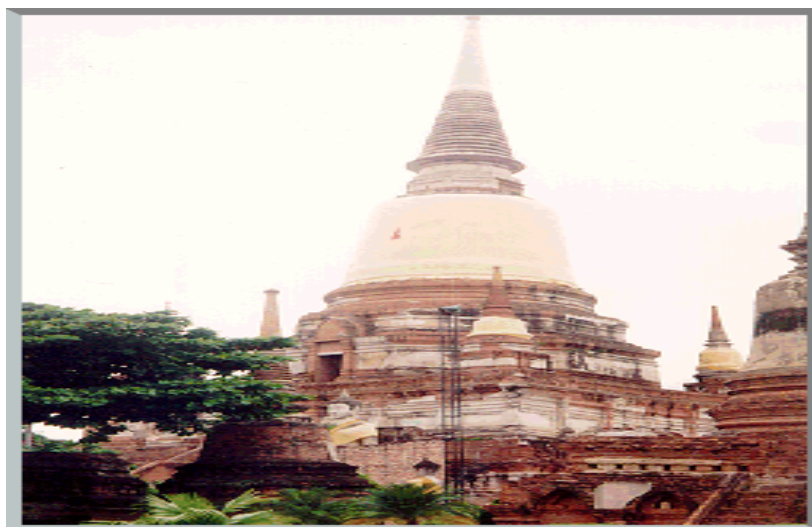
ภาพประกอบ 7 วัดใหญ่ชัยมงคล

การสัมภาษณ์ผู้มาเที่ยวชมนครประวัติศาสตร์ ณ วัดใหญ่ชัยมงคล ดังแสดงใน ภาพประกอบ 7