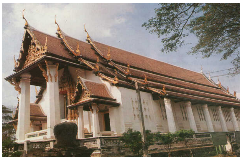
ภาพประกอบ 4 วัดหน้าพระเมรุ

การสัมภาษณ์ผู้มาเที่ยวชมนครประวัติศาสตร์ ณ วิหารพระมงคลบพิตร ดังแสดงใน ภาพประกอบ 4