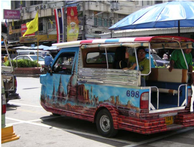
ภาพที่ 21-22 แสดงรถสามล้อเครื่องรับจ้างที่พ่นสีเป็นรูปโบราณสถานในเกาะเมืองพระนครศรีอยุธยา