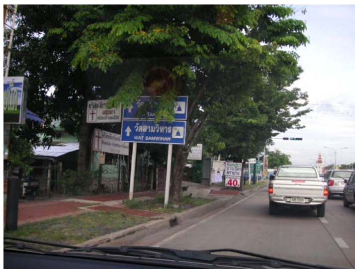
ภาพที่ 4 แสดงเส้นทางหลักที่เข้าสู่พื้นที่ท่องเที่ยวเกาะเมืองพระนครศรีอยุธยา

สำหรับพื้นที่ข้างต้นเป็นพื้นที่ซึ่งไม่มีบ้านเรือนประชาชน เนื่องจากได้ถูกกรมศิลปากรย้าย ไปพื้นที่อื่น ทิวทัศน์บริเวณนี้เดิมค่อนข้างร่มรื่นจากต้นไม้ยืนต้นเช่น ตะแบก กล้วยและทรงบาดาล เรียงราย ตลอดกลางถนนและริมถนนสองข้าง และในปีพ.ศ. 2548 เทศบาลนครพระนครศรีอยุธยา มีโครงการปรับปรุงทัศนียภาพถนนหลายสายในเกาะเมือง ทำให้ต้นไม้บนเกาะกลางถนน โรจนะ ถูกรื้อถอนเป็นสวนหย่อมและมีเสาไฟตั้งเป็นระยะ ส่วนด้านข้างถนนระหว่างสะพานถึงศาลากลาง เก่าจะมีเสาหงส์สี่ทอน(เสาสี่เขียว)ปากหงส์มีโคมไฟห้อย(สูงเท่าเสาไฟ)ตั้งเรียงรายตลอดข้างถนน สลับกับไม้ยืนต้นนานาพันธุ์