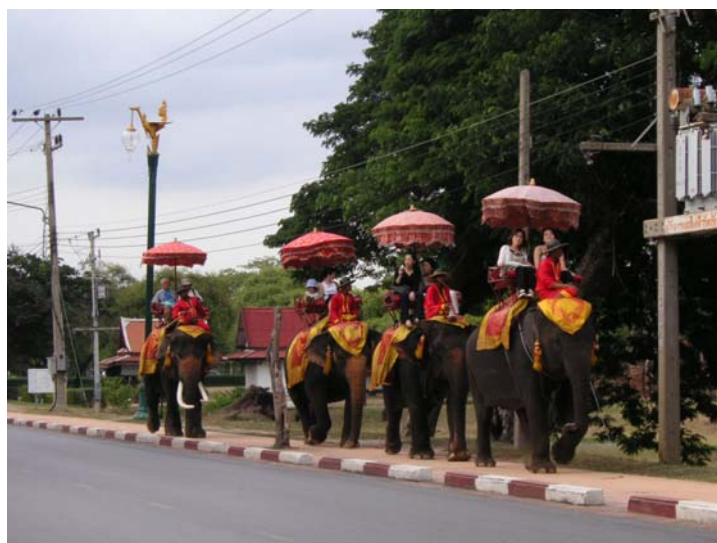
ภาพที่ 5-8 แสดงกิจกรรมการท่องเที่ยวในพื้นที่เกาะเมืองพระนครศรีอยุธยา

ถัดจากปางช้างแลเพนียดด้านขวาคือ ซากวัดเกษที่ได้รับการบูรณะแล้วและกลุ่มขุนแผนซึ่งเป็นเรือนทรงไทยสมัยโบราณซึ่งมีสนามหญ้าสีเขียวสดและต้นก้ามปูต้นใหญ่ รอบกลุ่มขุนแผนมีคูคลองรอบๆ บางฤดูกาลน้ำในคูคลองแห่งนี้มีสีเขียวขุ่น ส่วนในช่วงฤดูฝนจะใสขึ้น เมื่อลมพัดมาจะมองเห็นน้ำในคูคลองเหล่านี้เป็นละลอกคลื่นเล็กๆ ด้านหน้ากลุ่มขุนแผนมีแพ(หลังคาไทยโบราณ)ลอยกลางสระน้ำทำให้บรรยากาศบริเวณนี้รื่นรมย์ กลุ่มขุนแผนจึงเป็นสถานที่หนึ่งที่มีนักท่องเที่ยวมาแวะเวียนเสมอ ถัดจากด้านขวาของกลุ่มขุนแผนคือวิหารพระมงคลบพิตรและพื้นที่ของโบราณสถานที่เคยเป็นพระราชวังหลวง