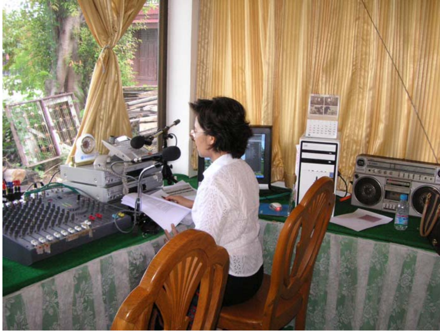
ภาพที่ 24 แสดงการเผยแพร่ผลการศึกษาทางวิทยุชุมชน

3.2 ระยะที่ 2 นักวิจัยได้ติดตามแผนงานและโครงการจากเทศบาลฯ ของเทศบาลนครพระนครศรีอยุธยาปีงบประมาณ 2550-2552 พบว่ามีโครงการที่เกี่ยวข้องดังนี้