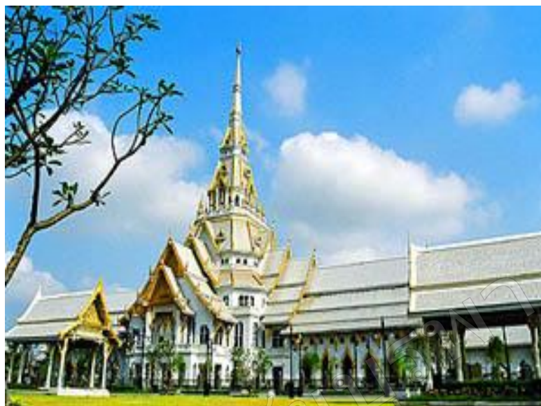
ภาพที่ 2 วัดโสธรวรารามวรวิหาร

กล่าวกันว่าประชาชนจำนวนมากทำการนุดลากขึ้น โดยได้มีอาจารย์ผู้มีความรู้ทางไสยศาสตร์กระทำตามพิธีการอันถูกต้อง แล้วเอาด้านสายสิญจน์คล้องกับพระหัตถ์หลวงพ่อโสธร อัญเชิญขึ้นมาบนฝั่ง นำมาประดิษฐานในวิหารสำเร็จตามความประสงค์ แล้วก็จัดให้มีการฉลองสมโภช และให้นามหลวงพ่อกว่า “หลวงพ่อโสธร” องค์หลวงพ่อโสธรจริง ๆ นั้นในสมัยที่ลองลอยนำมาเดิม ป็นพระพุทธรูปที่หล่อด้วยทองสัมฤทธิ์ปางสมาธิเพชร หน้าตักกว้างประมาณ 1 ศอกเศษ รูปทรงสวยงามมาก