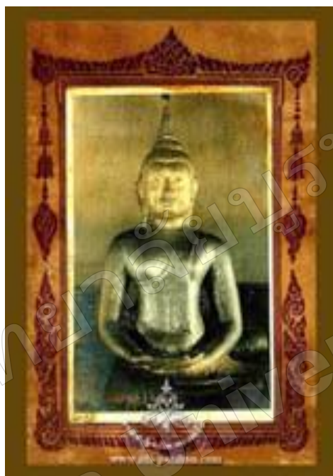
ภาพที่ 1 หลวงพ่อโสธร

ประวัติหลวงพ่อโสธร วัดโสธรวรารามวรวิหาร หลวงพ่อโสธรเป็นหลวงพ่องค์หนึ่งที่ทรงอนุภาพศักดิ์สิทธิ์มือกนิหาร เป็นพระพุทธรูปที่ทรงอนุภาพศักดิ์สิทธิ์ เป็นมิ่งขวัญของชาวจังหวัดฉะเชิงเทรา และเป็นที่รู้จักเคารพบูชาของประชาชนทั้งหลาย หลวงพ่อโสธรเป็นพระพุทธรูปที่หล่อด้วยทองสัมฤทธิ์ หน้าตักกว้างประมาณ 1 ศอกเศษ ปรากฏชัดสมาธิเพชร แต่ได้เสริมแต่งขึ้นจากเดิมโดยพอกปูนลงลักปิดทองให้เป็นพระพุทธรูปปางสมาธิ หน้าตักกว้าง 3 ศอก 5 นิ้ว พระเนตรเนื้อเลียนแบบพระสมัขลานช้าง หรือเรียกกัน สามัญว่า พระลาว