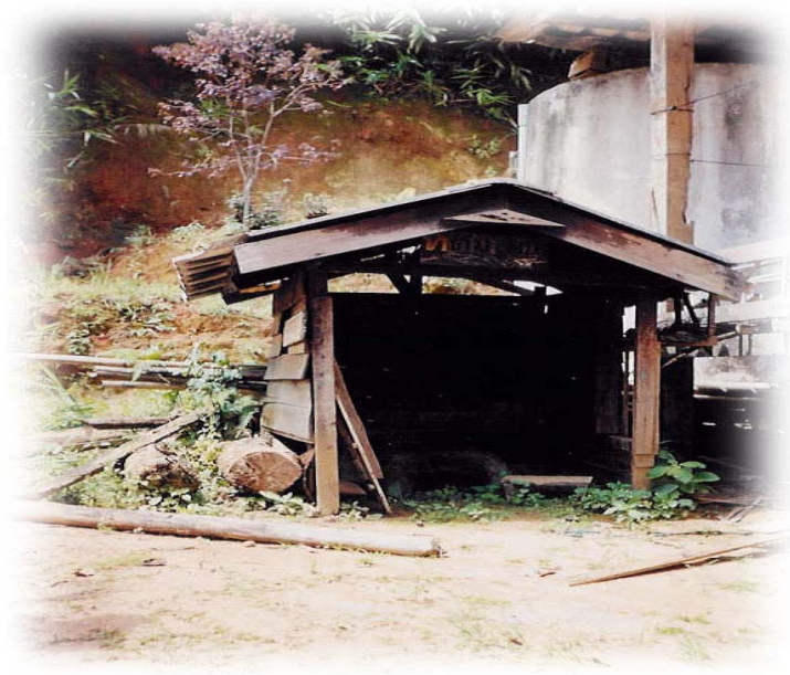
ภาพที่ 11 ภาพที่ต็มน้ำสมุนไพร สมัยครั้งที่เจ้าอาวาสวัดอรุณจอมเมฆ ไร่ต็ม ให้พุทธศาสนิกชน