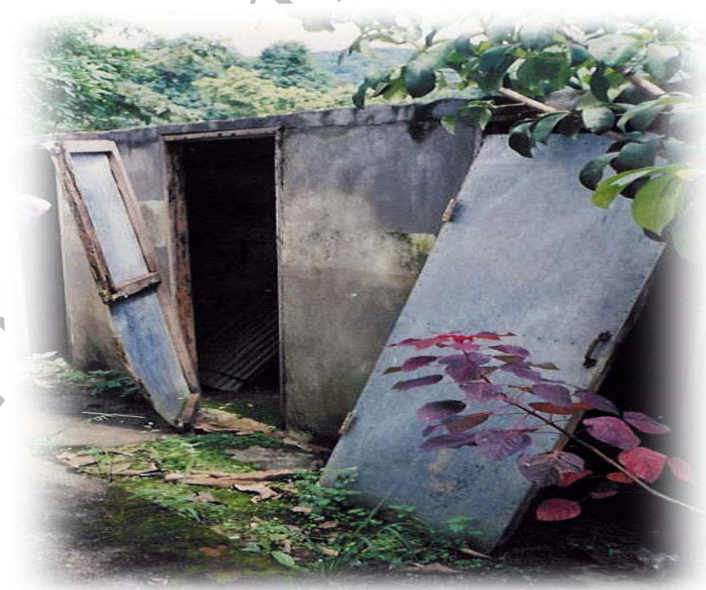
ภาพที่ 8 ภาพภายนอกของห้องอบสมุนไพรที่ถูกปล่อยให้รกร้าง ขาดคนดูแล