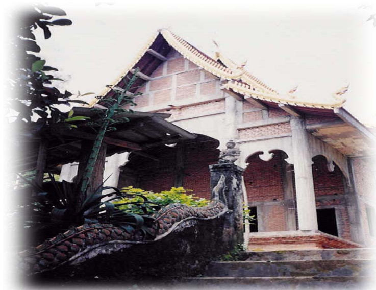
ภาพที่ 2 ภาพวัดอรุณจอมเมฆ หรือวัดปางมะโอ วัดประจำหมู่บ้านปางมะโอ