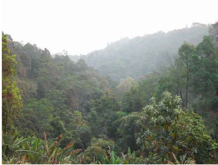
ภาพที่ 3 ภาพพระอาทิตย์กำลังจะขึ้น เป็นจุดชมวิวที่สวยงามอีกแห่งของ หมู่บ้านปางมะโอ ตอนเช้ามีหมอกลงและอากาศหนาวเย็น