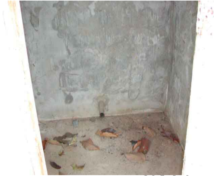
ภาพที่ 9 ภาพภายในของห้องอบสุมไพร วัดอรุณจอมเมฆ หมู่บ้านปางมะโอ