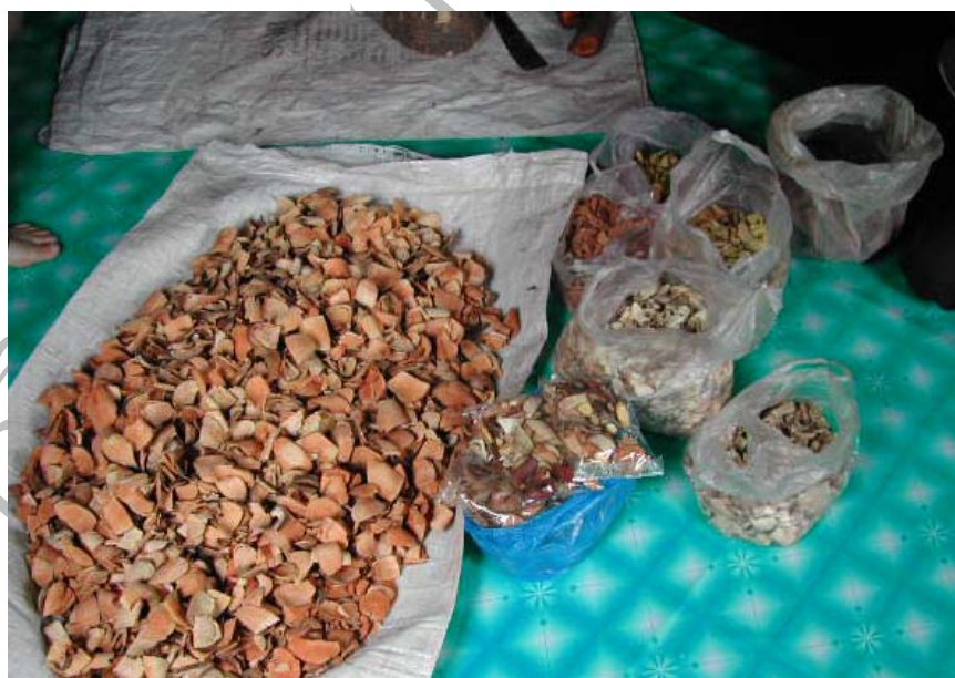
ภาพที่ 16 ภาพสมุนไพรแห้งของหมู่บ้านปางมะโอที่ใช้รักษาโรคต่างๆได้