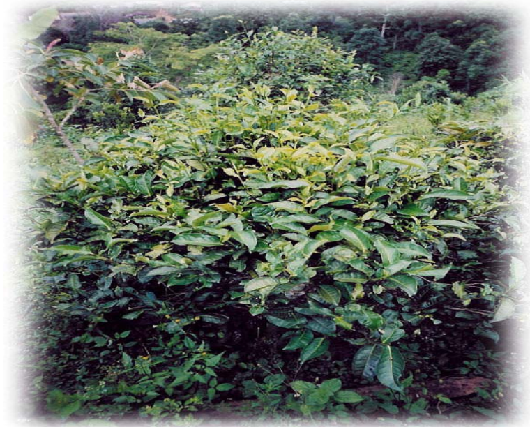
ภาพที่ 7 ภาพต้นชาที่ชาวบ้านปลูก เป็นสมุนไพรที่สามารถนำมาต้มดื่มเพื่อ สุขภาพได้