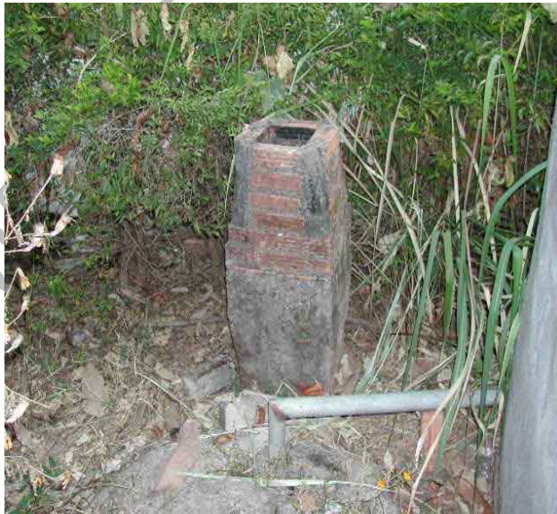
ภาพที่ 10 ภาพที่ใส่สุมไพรเพื่อใช้ในการอบตัว ให้ไอระเหยผ่านท่อไปยังห้องอบสุมไพร