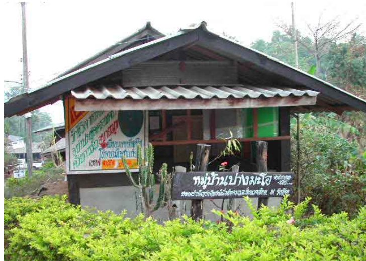
ภาพที่ 1 ภาพทางเข้าสู่หมู่บ้านปางมะโอ มีป้ายบอกไว้ชัดเจน