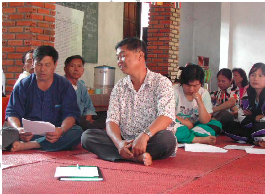
ภาพที่ 14 ภาพการประชุมเพื่อหารูปแบบที่เหมาะสมในการให้บริการ การท่องเที่ยวเพื่อ สุขภาพโดยการใช้สมุนไพรท้องถิ่นของหมู่บ้านปางมะโอ เมื่อวันที่ 17 กุมภาพันธ์ พ.ศ. 2547 (2)