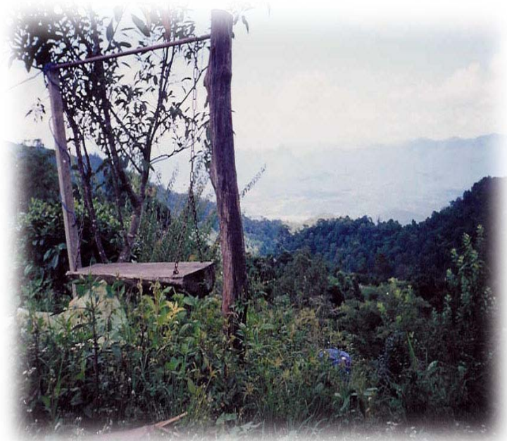
ภาพที่ 6 ภาพจุดชมวิวยานไร่ชาของหมู่บ้านปางมะโอ สามารถมองเห็นทิวทัศน์ที่