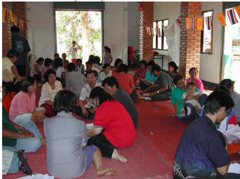
ภาพที่ 12 ภาพผู้เข้าร่วมประชุมและตอบแบบสัมภาษณ์ เรื่องการท่องเที่ยวเพื่อ สุขภาพโดยการใช้สมุนไพรท้องถิ่น เมื่อวันที่ 24 กรกฎาคม พ.ศ. 2546