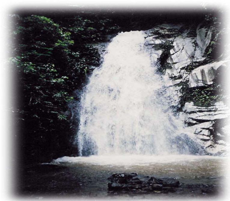
ภาพที่ 5 ภาพน้ำตกธรรมชาติ ในพื้นที่หมู่บ้านปางมะโอมีน้ำไหลตลอดปี สามารถใช้กระแสน้ำตกบำบัดสุขภาพได้