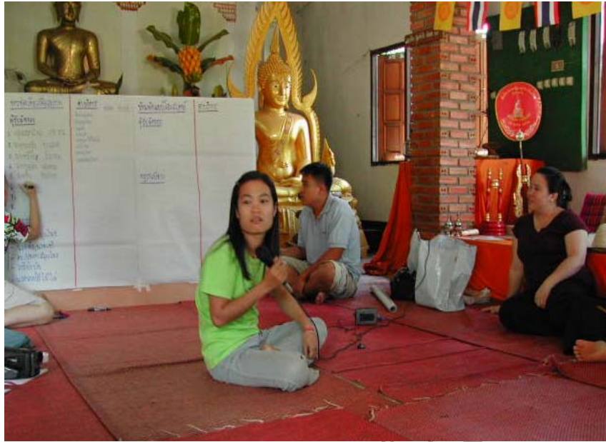
ภาพที่ 13 ภาพการประชุมเพื่อหารูปแบบที่เหมาะสมในการให้บริการ การท่องเที่ยวเพื่อ สุขภาพโดยการใช้สมุนไพรท้องถิ่นของหมู่บ้านปางมะโอ เมื่อวันที่ 17 กุมภาพันธ์ พ.ศ. 2547 (1)