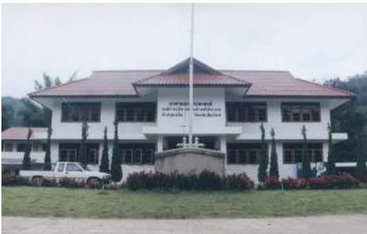
องค์การบริหารส่วนตำบลโป่งแยง ผู้ดูแลในพื้นที่