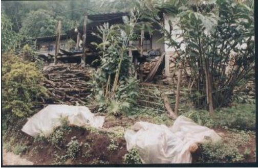
บริเวณบ้านของชาวม้ง