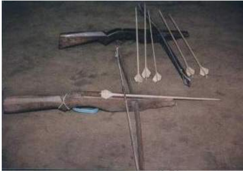
ภาพที่ 4.12 “หน้าไม้” อาวุธคู่กายของชายม้ง