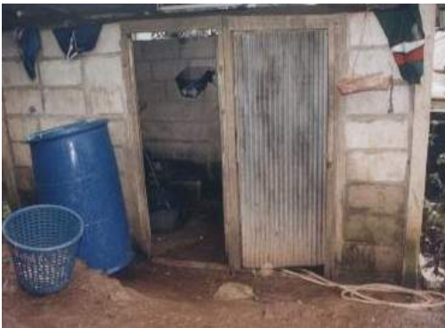
ลักษณะห้องน้ำในหมู่บ้าน