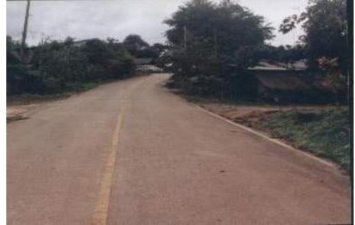
บริเวณถนนทางเข้าหมู่บ้าน