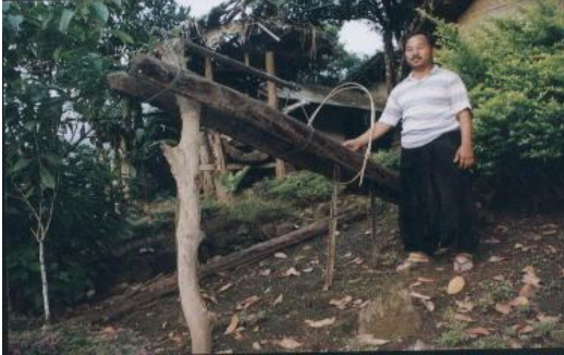
ผู้ใหญ่บ้านสาธิตการใช้กั๊บดักเสือ