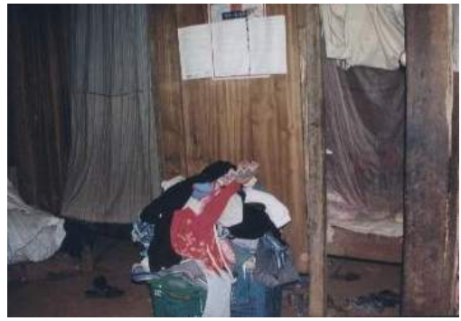
บริเวณห้องนอนภายในบ้าน