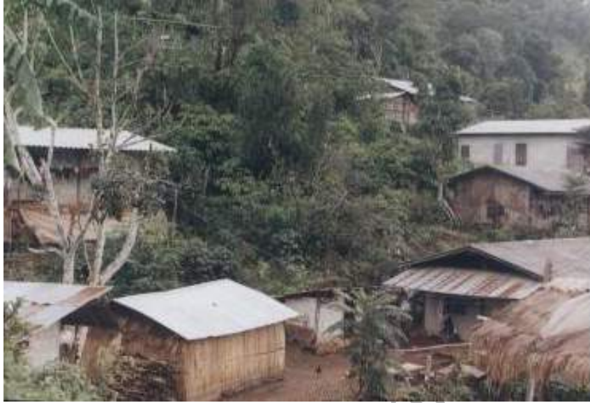
ภาพที่ 4.4 ลักษณะการสร้างบ้านเรือนอยู่อาศัยของม้งผานกกก ที่มา : หมู่บ้านม้งผานกกก วันที่ 16 พ.ย. 2546