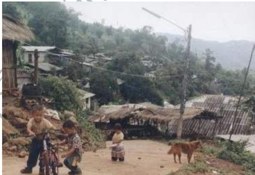
ภาพที่ 4.5 เด็กชาวม้งกำลังเล่นกันอย่างสนุกสนาน ที่มา : หมู่บ้านม้งผานกกก วันที่ 16 พ.ย. 2546