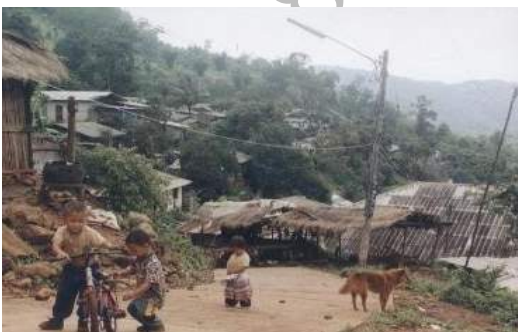
สภาพโดยทั่วไปของหมู่บ้าน