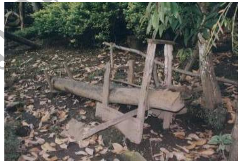
“กั๊บดักอีเห็น” สำหรับโชว์นั๊กท่องเที่ยว