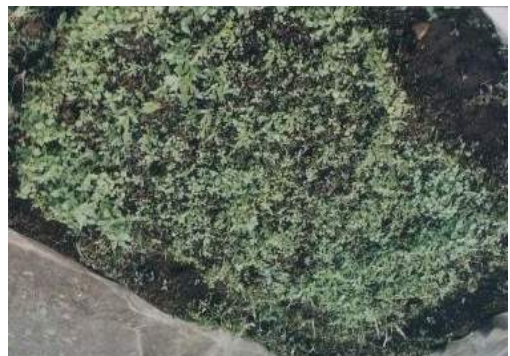
แปลงกัญชาปลูกแสดงโชว์สำหรับ นักท่องเที่ยว