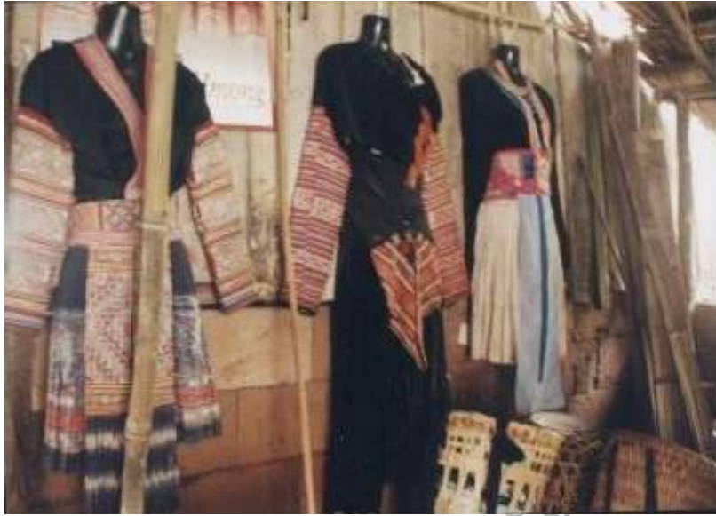
ภาพที่ 4.3 ชุดการแต่งกายของชาวม้ง