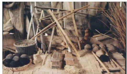
อุปกรณ์ เครื่องมือต่าง ๆ ของม้ง