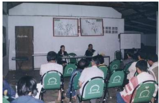
ผู้วิจัยทำการสนทนาร่วมกับชาวบ้าน