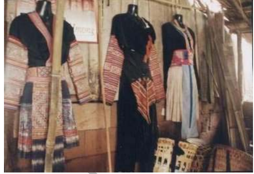
ชุดการแต่งกายของชาวม้งที่แสดงโชว์ไว้