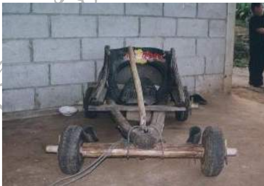
ภาพที่ 4.10 “ล้อเลื่อน” เครื่องเล่นของชาวม้ง