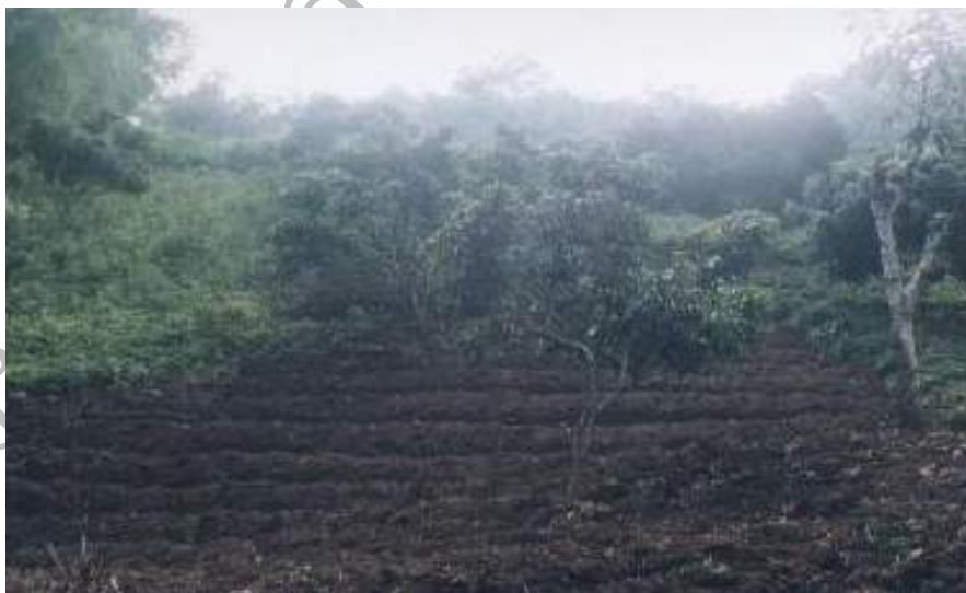
ภาพที่ 4.6 ลักษณะการปลูกพืชของชาวม้ง

ชาวม้งบ้านผานกกก มีจำนวน 98 ครอบครัว 67 หลังคาเรือน มีทะเบียนบ้านถูกต้องตามกฎหมาย ลักษณะความเป็นครอบครัวของม้งนั้น บ้านหลังหนึ่งอาจมีหลายครอบครัวอยู่รวมกันในบ้าน เช่น 2-3 หรือ 5 ครอบครัวในบ้านเดียวกัน แต่ปัจจุบันส่วนใหญ่จะเป็น 1 ครอบครัว ในบ้าน 1 หลัง มีสมาชิกในครอบครัวประมาณ 2-3 คนเท่านั้น