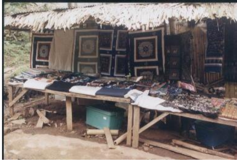
ภาพที่ 4.7 ร้านค้าจำหน่ายผลิตภัณฑ์และของที่ระลึกในหมู่บ้าน

ชาวเมืองส่วนใหญ่จะเป็นวัยรุ่น ซึ่งออกไปเรียนหนังสือนอกหมู่บ้านและจะกลับมาที่บ้านในช่วงมีพิธีกรรมหรืองานสำคัญต่างๆ ส่วนเมืองที่เป็นเด็กเล็กก็มีจำนวนมากพอสมควร ประมาณ 90 คน เด็กเมืองเหล่านี้ออกไปเรียนหนังสือที่โรงเรียนโป่งแยงนอก โป่งแยงใน สังกัดของสำนักงานคณะกรรมการการศึกษาขั้นพื้นฐาน