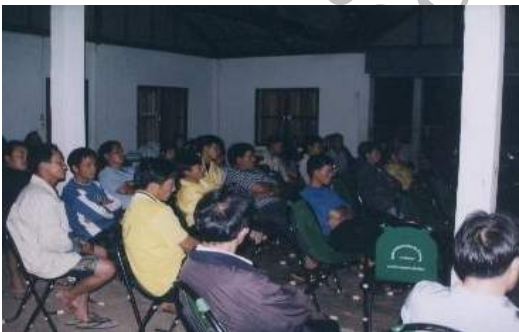
ชาวบ้านร่วมกันสนทนาเกี่ยวกับการท่องเที่ยว