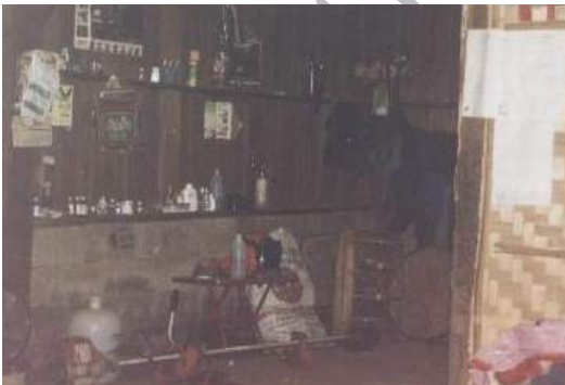
บริเวณห้องรับแขกภายในบ้าน