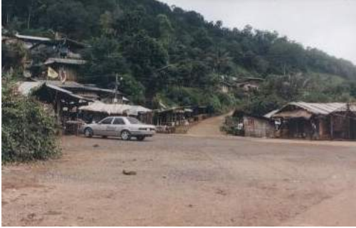
บริเวณลานจอดรถสำหรับนักท่องเที่ยว และผู้ที่เข้ามาเยี่ยมชม