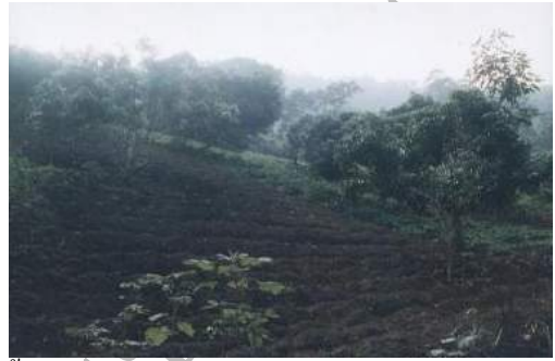
วิธีการปลูกพืชบนพื้นที่สูงของชาวม้ง