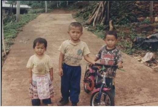
เด็กชาวม้งในหมู่บ้าน