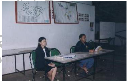
ผู้วิจัยทำการสนทนากลุ่มร่วมกับชาวบ้าน