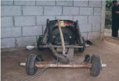
“ล้อเลื่อน” เครื่องเล่นของชาวม้ง