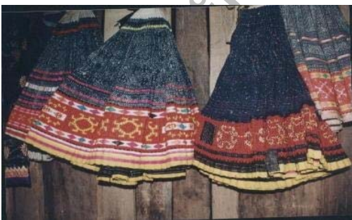
ชุดแต่งกายของหญิงชาวม้ง