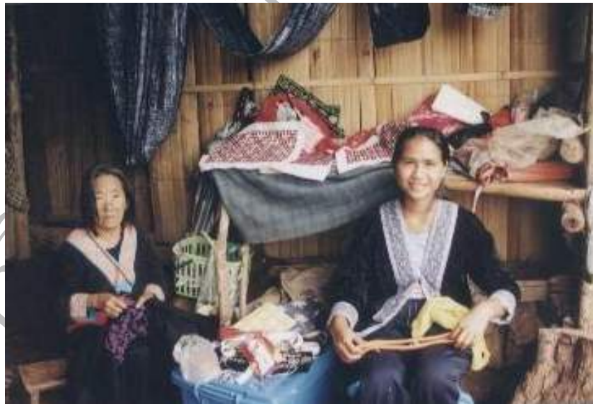
ภาพที่ 4.13 หญิงชาวม้งกำลังเย็บปักเสื้อผ้าเพื่อจำหน่ายแก่นักท่องเที่ยว ที่มา : หมู่บ้านม้งผานกกก วันที่ 20 ธ.ค. 2546