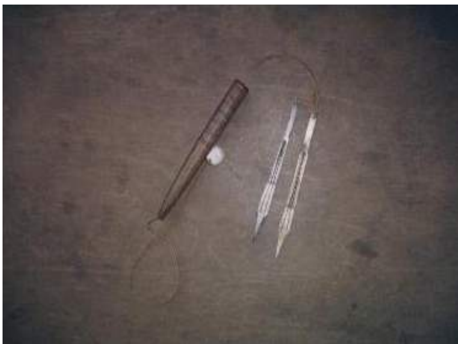
ภาพที่ 4.9 “ลิ้นทอง” เครื่องเป่าของชาวม้ง