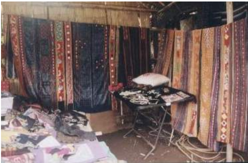
ร้านจำหน่ายสินค้าและของที่ระลึก