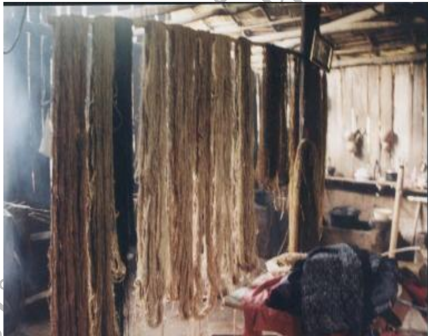
ภาพที่ 4.11 การผลิตผ้าใยกันซงของชาวม้งบ้านผานกกก