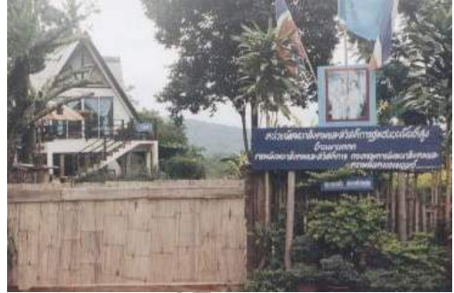
บริเวณหน้าบ้านพักสำหรับนักท่องเที่ยว