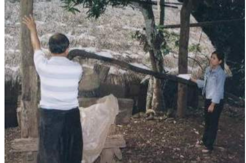
เครื่องมือข้าวและข้าวโพดของชาวม้ง