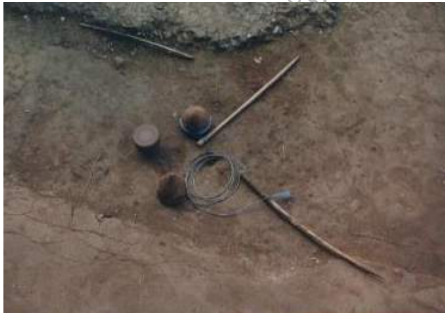
ภาพที่ 4.8 “ลูกข่าง” เครื่องเล่นของชาวม้ง

การละเล่นของม้งนั้นมีหลายชนิด เช่น การเดินรำม้ง ซอ ม้ง เป่าแคน เป่าปี่ เป่าขลุ่ย เป่าลิ้นทอง การเล่นล้อเลื่อนไม้ การเล่นลูกข่าง ลูกช่วง