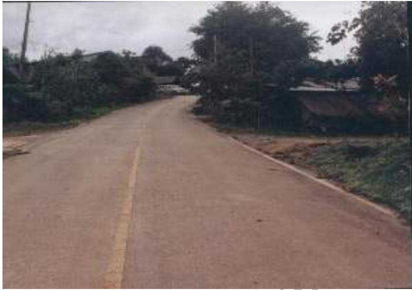
ภาพที่ 4.14 ลักษณะถนนทางเข้าหมู่บ้านผานกกก