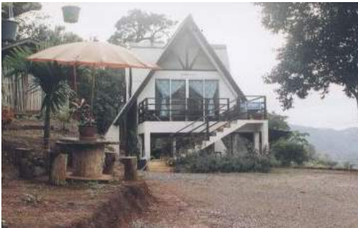
บริเวณบ้านพักสำหรับนักท่องเที่ยว