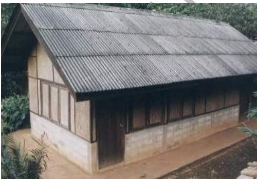
อาคารศูนย์วัฒนธรรมของหมู่บ้าน