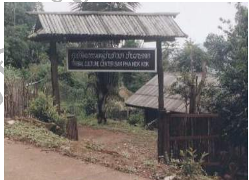
ศูนย์วัฒนธรรมชาวเขา บ้านม้งผานกก