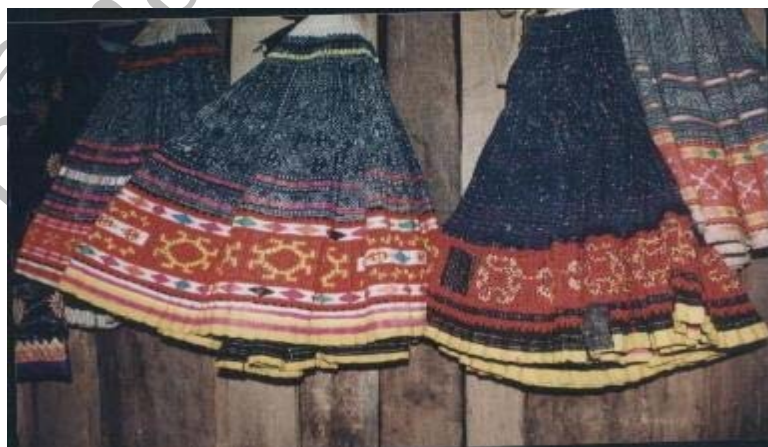
ภาพที่ 4.2 ชุดการแต่งกาย กระโปรงของหญิงมั้ง

ในกรณีที่หญิงมั้งจะต้องเข้าพิธีแต่งงาน จะไม่สวมชุดที่มีเงินหรือทองตกแต่ง ไม่สวมรองเท้าว ด้วยความเชื่อว่า เงินทองและรองเท้าจะทำให้หนัก และทำให้สะพานการทํามหาหินหัก อีกทั้งมีลูกยากอีกด้วย ชายมั้งสวมชุดธรรมดาและใช้ผ้าสีดำพันหัวเท่านั้น (สัมภาษณ์นางเลจ้า แซ่ย่าง, 19 พ.ย. 2546)