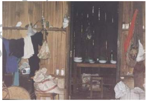
ลักษณะภายในบ้านของม้งผานกก