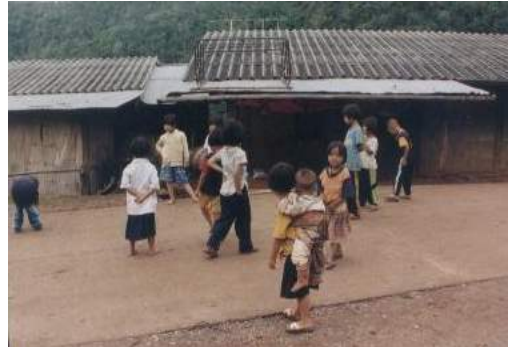
เด็กม้งกำลังเล่นกันอย่างสนุกสนาน