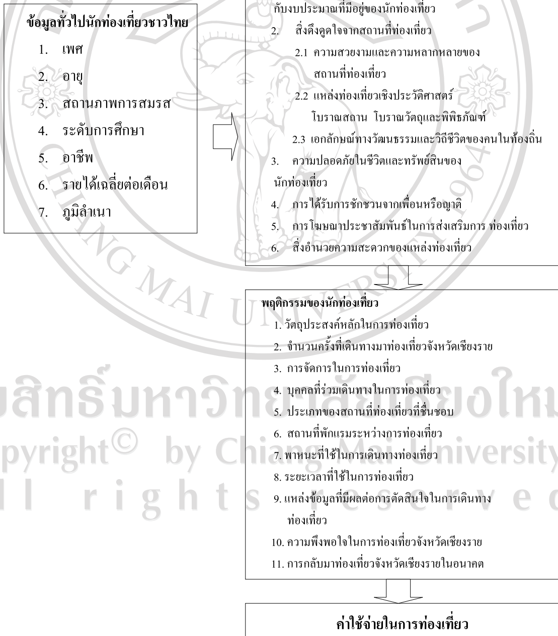
รูปที่ 3.1 กรอบแนวคิดที่ใช้ในการศึกษา