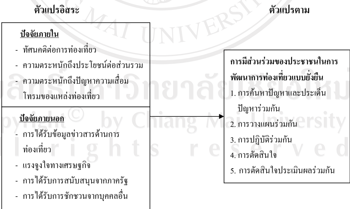
ภาพที่ 2.1 กรอบแนวคิดที่ใช้ในการศึกษา

จากการทบทวนแนวคิดทฤษฎีและเอกสารที่เกี่ยวข้อง สามารถนำมาเขียนกรอบแนวคิดที่ใช้ในการศึกษาการมีส่วนร่วมของประชาชนในการพัฒนาการท่องเที่ยวแบบยั่งยืนได้ดังนี้