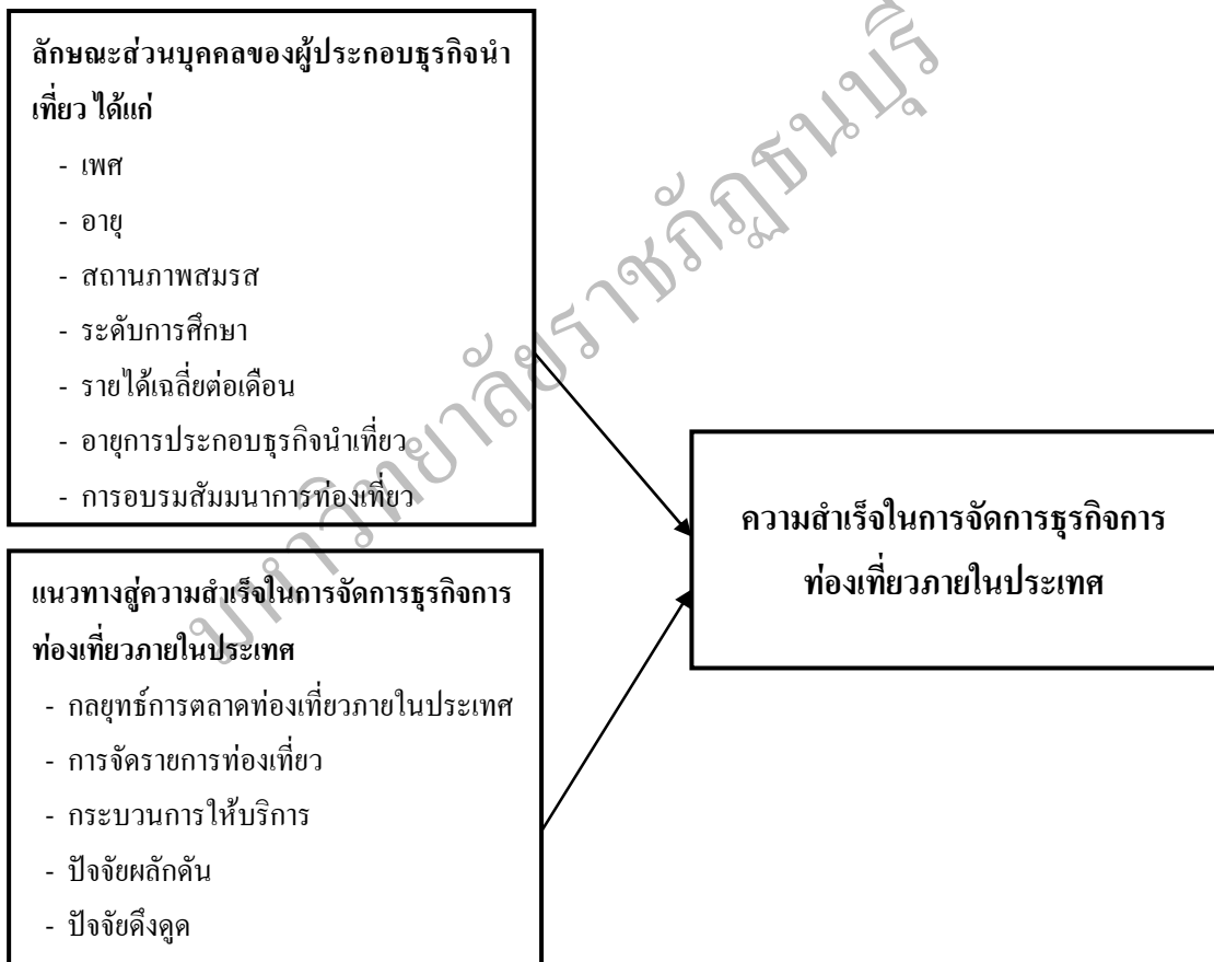
ภาพที่ 1.1 กรอบแนวคิดในการวิจัย