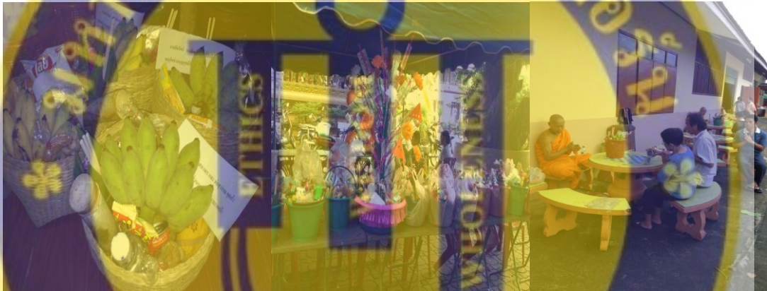
รูปที่ 15 ประเพณีตานก้วยสลาก

สิ่งอับมงคลออกไปจากชีวิต ในวันปากปีชาวบ้านภายในชุมชนหนองแฝกก็จะมีพิธีการถวายไม้ค้ำศรี (สะหลี) ที่มีการจัดเตรียมไม้มีง่ามขนาดใหญ่แห่แหนนำไปค้ำต้นโพธิ์ที่วัด เป็นงานมงคลที่ชาวบ้านต่างให้ความสำคัญ บางบ้านอาจจัดทำเป็นเฉพาะครอบครัวใหญ่ บางบ้านจัดเป็นไม้ค้ำของป๊อก (เป็นกลุ่ม) ต่างตกแต่งไม้ค้ำสะหร้อย่างสวยงาม พร้อมทั้งร่วมกันทำตื้นเงินเพื่อเป็นการทำบุญถวายวัดในคราวเดียวกัน เพราะเชื่อว่าเป็นพิธีที่จะทำให้เกิดการค้ำจุนพระศาสนาและกลายเป็นกุศลผลบุญค้ำจุนชีวิตของผู้จัดในภายภาคหน้าด้วย โดยรวมแล้วงานสงกรานต์ปีใหม่ของชาวล้านนาเป็นเรื่องของการเริ่มต้นชีวิตใหม่ การรำลึกถึงบรรพชนผู้เฒ่าผู้แก่ ผู้อาวุโส การทำบุญสร้างกุศลส่งไปให้ญาติพี่น้องที่ล่วงลับไปแล้ว และเป็นการสะเดาะเคราะห์ของส่วนบุคคลและชุมชน