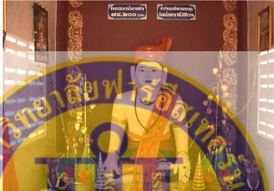
รูปที่ 9 หอพ่อปู่กุมการเศรษฐี (เดิม)

เชียงใหม่ หมอลงความเห็นเห็นว่าเส้นประสาทคู่ที่ 7 หยุดการทำงาน ทำให้ไม่ไปหล่อเลี้ยงด้านอีกข้าง หนึ่ง ถ้าจะรักษาก็เป็นอันยาก จึงหมดจนทาง ทำใจในโรคที่เกิดขึ้นในช่วงอายุเข้าสู่เบญจเพส