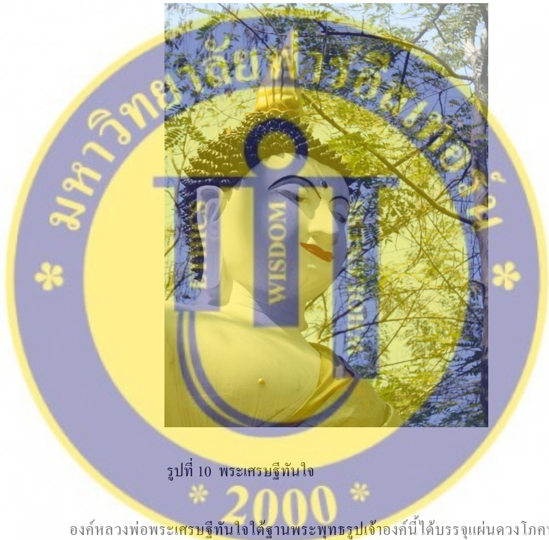
รูปที่ 10 พระเศรษฐีทันใจ

กุมภการเศรษฐี อาสภย์ หลวงเวียงเศรษฐี (ภูษานคร) ตามสัญญาที่ข้าพเจ้าได้บนบานศาลกล่าวเอาไว้ ปัจจุบันศาลนี้เป็นที่เคารพสักการบูชาแก่พี่น้องชาวดำบลหนองแฝกและใกล้เคียงตลอดมา ได้ฐานองค์พ่อปู่ได้บรรจุเหรียญเจ้าเมือง 8 จังหวัดในภาคเหนือ ดิน 9 เวียง องค์ตุคามรามเทพหลายสำนักที่มีผู้นำมาบริจาค