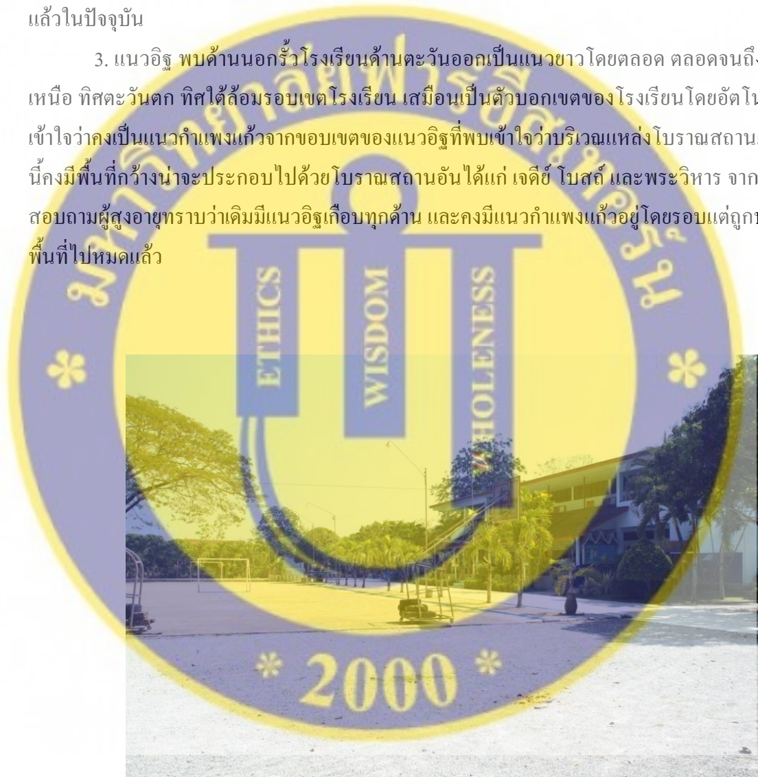
รูปที่ 5 บริเวณภายในโรงเรียนเวียงศรีวิทย์วิทยาปัจจุบัน

3. แนวอิฐ พบด้านนอกรั้วโรงเรียนด้านตะวันออกเป็นแนวยาวโดยตลอด ตลอดจนถึงทิศเหนือ ทิศตะวันตก ทิศใต้ล้อมรอบเขตโรงเรียน เสมือนเป็นตัวบอเขตของโรงเรียนโดยอัตโนมัติ เข้าใจว่าคงเป็นแนวกำแพงแก้วจากขอบเขตของแนวอิฐที่พบเข้าใจว่าบริเวณแหล่งโบราณสถานแห่งนี้คงมีพื้นที่กว้างน่าจะประกอบด้วยโบราณสถานอันได้แก่ เจดีย์ โบสถ์ และพระวิหาร จากการสอบถามผู้สูงอายุทราบว่าเดิมมีแนวอิฐเกือบทุกด้าน และคงมีแนวกำแพงแก้วอยู่โดยรอบแต่ถูกปรับพื้นที่ไปหมดแล้ว