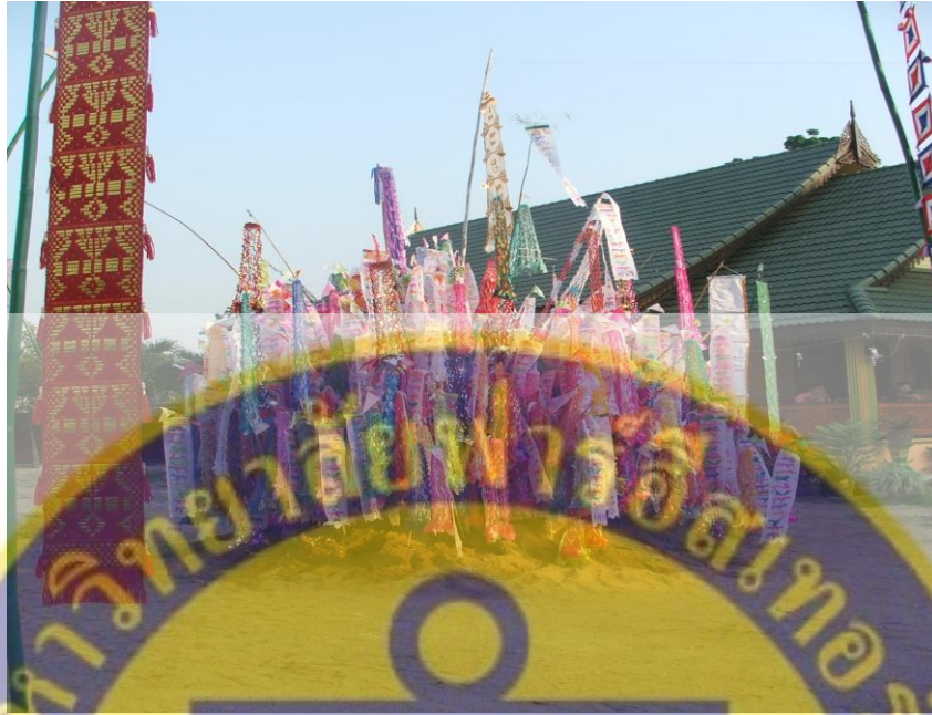
รูปที่ 13 กองทรายปักตุง

วันที่ 15 เมษายน เป็นวันพญาวัน คือวันที่พระอาทิตย์เคลื่อนเข้าถึงราศีเมษ ในล้านนาจะมีการเปลี่ยนแปลงตัวเลขของจุลศักราชในวันนี้ชาวบ้านจะตื่นกันแต่เช้า นึ่งข้าวและทำอาหาร เมื่อทุกอย่างพร้อมก็ยกไปประเคนถวายพระสงฆ์ที่วัด เพื่ออุทิศส่วนกุศลแก่บรรพชนที่ล่วงลับไป เมื่อเสร็จจากการทำบุญที่วัด จะเตรียมข้าวปลาอาหารไปมอบให้กับญาติที่มีอายุ มีพ่อแม่ ปู่ย่า ตายาย เป็นต้น เมื่อถึงเวลาก่อนเที่ยงต่างคนต่างนำเครื่องไทยทาน น้ำส้มป่อย และตุ๊กกระดาดไปรวมกันที่วัดอีกครั้งหนึ่ง เพื่อนำเอาตุงไปปักที่กองเจดีย์ทราย จากนั้นนำน้ำส้มป่อยขึ้นไปเทรวมกันในภาชนะที่ตั้งไว้กลางวิหาร แล้วรอฟังธรรมที่ชื่อ“อานิสงส์ไป๋หม่มและอานิสงส์เจดีย์ทราย” เมื่อฟังธรรมจบ นำน้ำส้มป่อยที่เทรวมกันในภาชนะ ส่วนหนึ่งไปสร่งพระพุทธรูปที่เป็นองค์ประธานและองค์เล็ก องค์น้อย ส่วนหนึ่งนำไปสร่งพระเจดีย์และต้นโพธิ์ ส่วนหนึ่งเอาไปประเคนให้พระสงฆ์เป็นการ “สระเกล้าดำหัว ขอมมาลาโทษ” ต่อ จากนั้นบางคนจะมีการปล่อยสัตว์ ซึ่งถือว่าได้อานิสงส์มาก วันพญาวันเป็นอีกวันหนึ่งที่ชาวบ้านชุมชนหนองแฝกนิยมที่จะไปรดน้ำดำหัวผู้ใหญ่ หรือผู้เฒ่าผู้แก่ ที่ชาวบ้านให้ความเคารพนับถือ โดยของที่นำไปก้าน้ำให้ยังผู้ใหญ่สมัยก่อนนิยมนำเป็นผลหมากรากไม้ หอมกระเทียม อาหารแห้งต่างๆ แต่ปัจจุบันตามสมัยนิยม อาทิเช่น กระเช้าเครื่องดื่มนำมาวางกำลังต่างๆ นม รังนก หรืออาจเป็นกระเช้าอาหาร เช่น ปลากระป๋อง ผลไม้กระป๋อง ขนมต่างๆ หรืออาจเป็นของใช้ต่างๆ ที่จำเป็นในชีวิตประจำวัน เช่น ยาสิฟีน แปรงสิฟีน ยาสระผม เป็นต้น แต่สิ่งที่ขาดไม่ได้ในการเข้าไปรดน้ำดำหัวผู้ใหญ่หรือผู้เฒ่าผู้แก่ก็คือ ผ้าไหว้ หรือเสื้อผ้าชุดใหม่สำหรับมอบให้ผู้