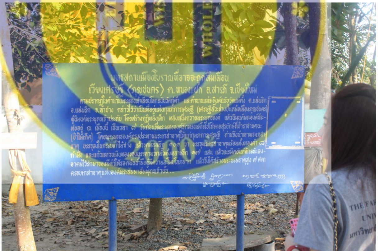
รูปที่ 17 ป้ายประวัติ ตำนานโบราณสถานวัดเวียงเศรษฐี (ร้าง)

การประชาสัมพันธ์จากป้ายบอกเส้นทางหรือแนะนำแหล่งท่องเที่ยว จะไม่มีเลยในแหล่งท่องเที่ยว ซึ่งต้องให้นักท่องเที่ยวที่สนใจเดินทางมา ต้องเรียนรู้เส้นทางก่อนการเดินทางท่องเที่ยวมายังโบราณสถานวัดเวียงเศรษฐี (ร้าง) แต่เมื่อมาถึงยังโบราณสถานวัดเวียงเศรษฐี(ร้าง) แล้วสามารถดูประวัติอย่างย่อได้ที่แหล่งท่องเที่ยวได้เลย