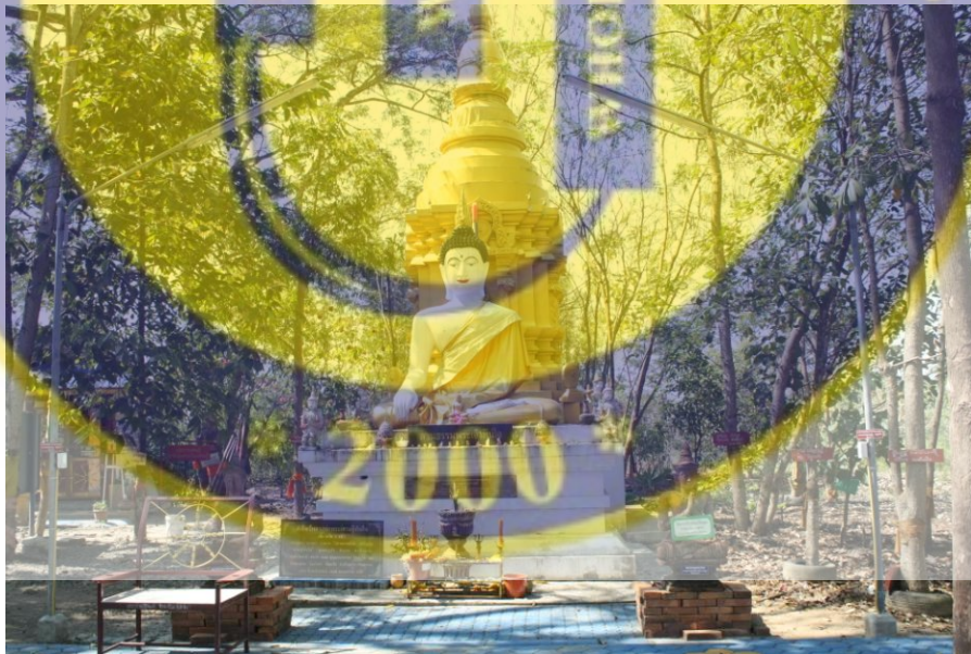
รูปที่ 1 บริเวณลานธรรมวัดเวียงเศรษฐีร้าง

ประวัติความเป็นมา ตำนานเมืองโบราณสถาน วัดเวียงเศรษฐี(ร้าง)