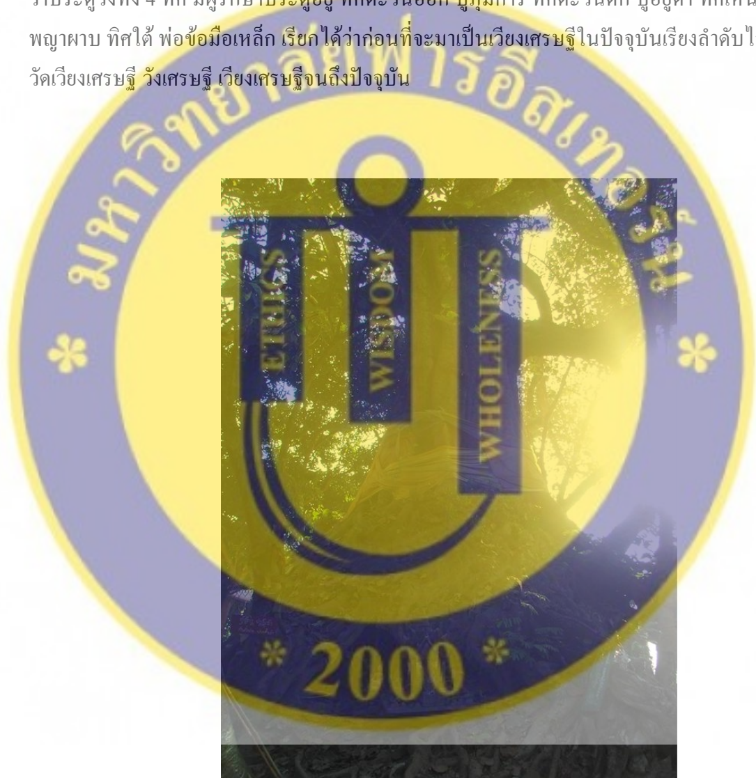
รูปที่ 2 พระธาตุโพธิ์คุ่มโบราณสถานอายุ 700 กว่า ปี

เรือน” ฝังไว้ข้างบนของสมบัติคน เพื่อป้องกันการขโมยและหากตนเอง(เจ้าของสมบัติตายไปสมบัติของตนก็จะยังคงอยู่หรือไม่ ถ้ามีคนขโมยขุด ก็จะขุดเจอ “จ้อ” ก่อน สุดท้ายคนที่ขโมยของก็จะตายไม่ได้สมบัตินั้น แล้วต่างก็เรียกกันว่า “เวียงเศรษฐีขี้ตุ๋ด” แต่ถ้าคนไหนคิดดี ทำดี ก็จะได้ดีได้ไป แต่ถ้าคนไหนไปขุดเพื่อหวังสมบัติที่ไม่ใช่ของตนก็จะเป็น โรคเรื้อนและอีกตำนานหนึ่งที่ว่าไว้ว่า เวียงเศรษฐีเป็นเมืองลึกลับใครเข้าไปก็จะหลงทาง หาทางออกไม่เจอ 1 คืน 1 วัน ปัจจุบันมีความเชื่อว่าประตู่วังทั้ง 4 ทิศ มีผู้รักษาประตูอยู่ ทิศตะวันออก ปูมการ ทิศตะวันตก ปูอยู่คำ ทิศเหนือ พ่อพญาผาบ ทิศใต้ พ่อข้อมือเหล็ก เรียกได้ว่าก่อนที่จะมาเป็นเวียงเศรษฐีในปัจจุบันเรียงลำดับไว้ดังนี้ วัดเวียงเศรษฐี วังเศรษฐี เวียงเศรษฐีจนถึงปัจจุบัน