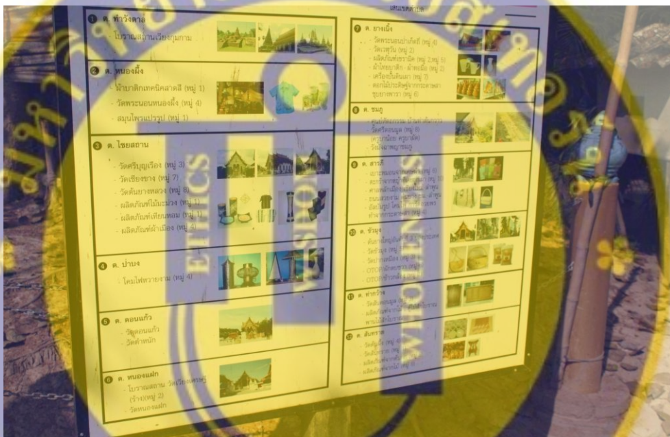
รูปที่ 16 ป้ายประชาสัมพันธ์แหล่งท่องเที่ยวภายในอำเภอสาร์ภี

โบราณสถานวัดเวียงเศรษฐี(ร้าง) ยังไม่เป็นที่รู้จักของนักท่องเที่ยว และอีกทั้งในการประชาสัมพันธ์ยังมีน้อยมาก ประชาชนในพื้นที่เองยังไม่รู้จักและเข้าใจเกี่ยวกับตำนาน ประวัติความเป็นมาของโบราณสถานวัดเวียงเศรษฐี(ร้าง) จึงเป็นอุปสรรคในการที่จะส่งเสริมให้เป็นแหล่งท่องเที่ยวของอำเภอได้ ในปีประชาสัมพันธ์แหล่งท่องเที่ยวของทางอำเภอสาร์ภีมีระบบโบราณสถานวัดเวียงเศรษฐี (ร้าง) ตำบลหนองแฝก แต่ทางเทศบาลตำบลหนองแฝกในระบบฐานข้อมูลแหล่งท่องเที่ยวไม่มี ทำในคณะผู้วิจัยสืบสน