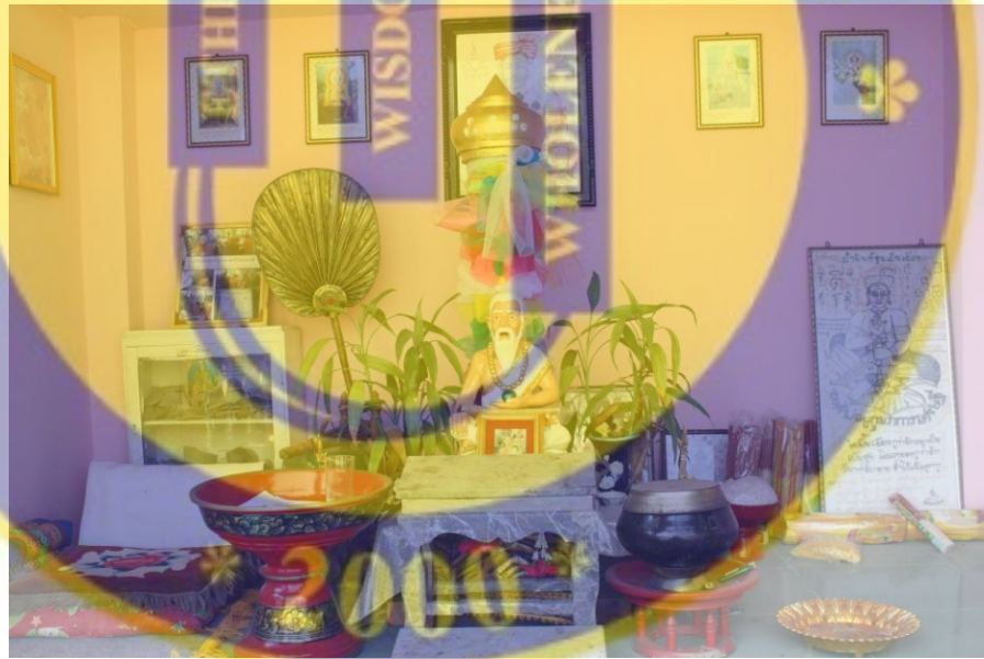
รูปที่ 3 หอพ่อปู่กุมารเศรษฐี (ใหม่)

คนไทยเป็นของลี้ละมาสร้าง เมื่อเวลาเปลี่ยนแปลงไปทำให้เจดีย์ทรุดตัว สังเกตดูใต้ต้นโพธิ์จะเป็นอุโมงค์ลึกลงไป บริเวณนั้นเป็นบริเวณที่ฝังสมบัติเก่ามีประวัติเล่ากันว่ามีคนมาขุดเอาสมบัติที่ฝังอยู่ไป ทำให้คนคนนั้นกลายเป็น “จิ้งจูด” หรือ “โรคเรื้อน” และจากที่สูงประมาณ 170 กว่า กว่ำ กลับกลายเป็นคนตัวเล็ก เหลือความสูงเพียง 140 เป็นตำนานเล่าขานที่ทำให้เวียงเศรษฐีไม่มีคนเข้าไป เนื่องจากกลัว ที่ดินบริเวณเวียงเศรษฐีเป็นธรณีสงฆ์ ครั้งหนึ่งบังเอิญมีเด็กนักเรียนชายคนหนึ่งเตะลูกบอลถูกศาลพ่อปู่ ครั้งที่หนึ่ง ครั้งที่สองเตะโดนอีก โดยไม่สนใจ ตอนโรงเรียนเลิก นักเรียนคนนี้หายไป ค่ำแล้วผู้ปกครองก็ออกตามหามาเจอที่โรงเรียน นักเรียนชายไม่สบายไข้ขึ้นสูง พ่อแม่จึงพาไปหาหมอ ไข้ก็ไม่ยอมลดลง พ่อแม่จึงถามนักเรียนชายคนนั้นว่าวันนี้ไปเล่นที่ไหน ทำอะไรมาบาง เขาเล่าให้ฟัง พ่อแม่คิดได้ก็ตอนเที่ยงคืน ถีอกรวยดอกไม้ไปขอขมาศาลพ่อปู่ ปรากฏว่ายังไม่ทันเดินออกพ้นโรงเรียนไป ไข้ที่สูงมากของนักเรียนชายก็ลดลงหายเป็นปกติ จึงเป็นตำนานเล่าขานกันต่อๆมา ถึงความศักดิ์สิทธิ์ของสถานที่ และศาลพ่อปู่