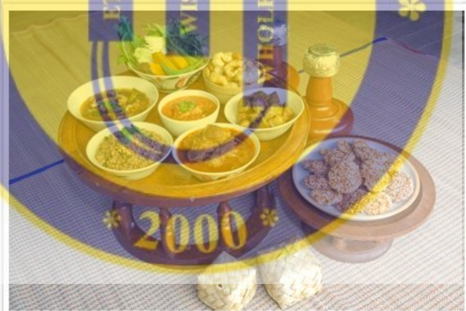
รูปที่ 12 ชั้นโตกอาหารพื้นเมือง

ชาวล้านนา ตำบลหนองแฝก นิยมกินข้าวเหนียวเป็นอาหารหลัก บางครั้งนักวิชาการจึงเรียกชาวล้านนาว่าเป็นสังคม วัฒนธรรมข้าวเหนียว นอกเหนือจากนั้นวัฒนธรรมสายแม่ที่ชาวล้านนายังคงปฏิบัติยึดถืออย่างต่อเนื่องมาจนถึงทุกวันนี้ก็คือ การนับถือผีบรรพบุรุษ บางที่เรียกว่า ผีปู่ย่า หรือเทวดาเฮือน หรือ ผีบ้านผีเฮือน เป็นผู้ช่วยปกป้องรักษาความอยู่ดีกินดีของลูกหลานและญาติพี่น้อง ทำให้รอดพ้นจากการเจ็บไข้ได้ป่วยและความอัปมงคลต่างๆ ผีปู่ย่าจะลงโทษลูกหลานที่ทำผิดจารีตประเพณีหรือที่เรียกว่า ผิดผี และจำเป็นต้องมาเสียผี แก่ผี หรือ เลี้ยงผี แต่ปัจจุบันความเชื่อเหล่านี้เริ่มมีการเปลี่ยนแปลงไปตามความพัฒนาของสังคมที่เชื่อในหลักวิทยาศาสตร์มากกว่าความเชื่อเรื่องผี