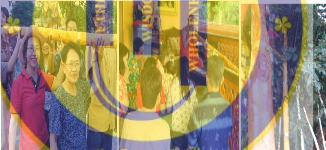
รูปที่ 14 พิธีการถวายไม้คำศรี (สะหลี)

วันพญาวันจึงเป็นอีกวันหนึ่งที่สำคัญของชุมชนหนองแฝก เนื่องจากลูกหลานที่อยู่ไกลๆ ทำงานจากต่างจังหวัด หรือ แม้กระทั่งอยู่ในจังหวัดเดียวกันแต่ไม่มีเวลาไปมาหาสู่กันก็จะได้พบหน้ากันในวันนี้จึงเรียกได้ว่าเป็นวันรวมญาติ บางครอบครัวเป็นครอบครัวใหญ่มีผู้เฒ่าผู้แก่หลายคน เขาก็จะจัดงานรดน้ำคำหัวเป็นของวงศ์ตระกูล ทำให้ญาติพี่น้องที่ไม่ค่อยได้พบปะสังสรรค์บ่อยนัก ก็มักจะมาพบปะพูดคุยกันในพิธีรดน้ำคำหัวผู้ใหญ่ โดยเมื่อลูกหลานญาติมิตรมาพร้อมกันแล้วก็จะนำเอาสิ่งต่างๆ ใส่พานใส่ขันประเคนให้ผู้ใหญ่ พร้อมกับกล่าวคำขอมาที่อาจได้ล่วงเกินผู้ใหญ่อาวุโสทั้งหลายด้วยทักทาย หรือวาจา ใจ ผู้ใหญ่ก็จะลาดปลดโทษให้พร้อมทั้งอำนวยการปีใหม่นี้แก่ลูกหลานทุกคน ผู้ใหญ่จะแต่น้ำขมิ้นส้มป่อยแล้วลูบศีรษะตนเอง ซึ่งถือว่าเป็นการทำพิธีคำหัวที่ถูกต้องตามประเพณี บางทีผู้ใหญ่อาจใช้น้ำนั้นประพรมให้ลูกหลาน พร้อมให้ศีลให้พร หลังจากนั้นทุกคนก็จะสังสรรค์สนุกสนานกัน