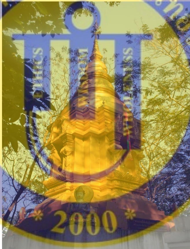
รูปที่ 7 พระเจดีย์เสถียรนิยกร

ปัจจุบันปรากฏว่า บ่อน้ำแห่งนั้น ได้ถูกปิดไปแล้ว ด้วยวิธีพรุนดินปิดปากบ่อขึ้นมาเองของ บ่อน้ำโดยไม่มีใครนำมาถม ไม่เชื่อก็อเลื่อเชื่อ ชาวบ้านเชื่อว่า เมื่อใครที่เข้าไปเอาของมีค่าในเมือง เก่านี้ขึ้นมา จะทำให้เป็นโรคเรื้อน หรือที่ชาวบ้านเรียกกันตามภาษาพื้นบ้านท้องถิ่นว่าเป็น “จี๊ดู๊ด” จึงไม่ค่อยมีใครกล้าเข้าไปเอา ณ เวียงเศรษฐีแห่งนี้ก็เลย จนพ่อขุนหนองแฝกใฝ่กิจ พร้อมกับ พระสงฆ์องค์เจ้าและชาวบ้านในสมัยนั้นเห็นว่าเนื้อที่เวียงแห่งนี้มีอาณาเขตกว้างขวางจึงได้ปรึกษากัน ได้นิมนต์พระภิกษุสงฆ์มาเข้ากรรม แผ่นบุญกุศลแด่สรรพสัตว์ทั้งหลาย ร่วมกันสร้างโรงเรียน เวียงเศรษฐีวิทยาขึ้นมา เพื่อใช้เป็นสาธารณะประโยชน์ต่อลูกหลานชาวตำบลหนองแฝก ได้มีที่ศึกษาเล่าเรียน ในปี พ.ศ. 2526 เป็นต้นมาจนถึงปัจจุบันนี้