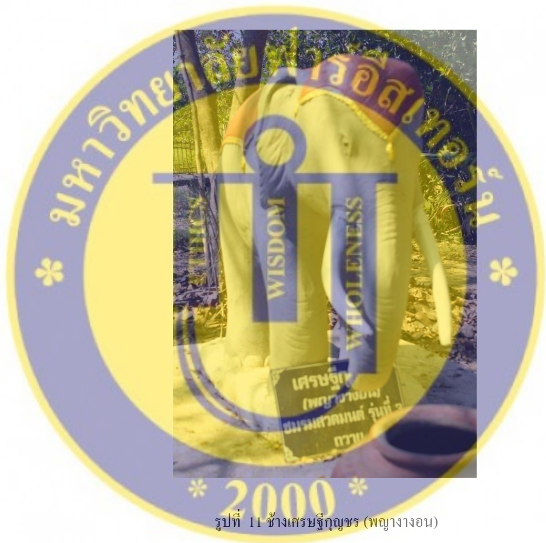
รูปที่ 11 ช้างเชษฐภคินี (พญางงอน)

เวลาในการหล่อเพียง 5 ชั่วโมงก็ทำการเปิดแม่พิมพ์ออก ในองค์พระพุทธรูปได้บรรจุพระหทัย สารีริกธาตุเจ้าและวัตถุมงคลต่างๆที่ศรัทธาผู้มีบุญได้นำมาบริจาคถวายทานจำนวนหลายร้อยองค์ เพื่อบรรจุไว้สืบทอดพระพุทธศาสนา ณ เวียงศรีษะภูแห่งนี้ ทราย 5,000 พระวัสสาและแผ่นดวงโภคทรัพย์แห่งอุบาสกอุบาสิกาผู้สืบทอดและค้ำจุนพระพุทธศาสนาหลายร้อยแผ่น แผ่นดวงยันต์สามเณรหลายวัดที่เณรนำมาบริจาค