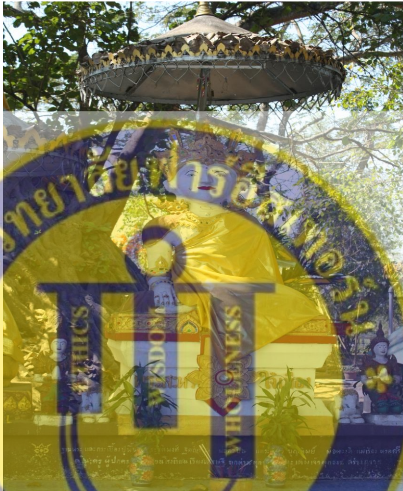
รูปที่ 8 พระสระหรีใจเมือง

พระพุทธรูปองค์นี้เป็นพระประธานลานโพธิ์ เป็นองค์แรกที่พระฐิติพงษ์ ได้ปั้นและนำมาประดิษฐาน ณ เวียงเศรษฐีเป็นองค์แรก ในพระเศียรพระพุทธรูปองค์นี้ได้บรรจุแผ่นยันต์ 9 บั้งแห่ง 9 มหาเถรจารย์สุดยอดเกจิแห่งดินแดนล้านนา พระภิกษุหนุ่ม สามเณร น้อย พ่อน้อย พ่อหนาน และของมีค่า ของมงคลลูกแก้วใจเมือง และอัฐิธาตุหลวงปู่ครูบาอินตา อินทุโร อติตที่ปรึกษาเจ้าอาวาสวัดหนองแฝก เพื่อให้ศรัทธาประชาชนได้สักการบูชา