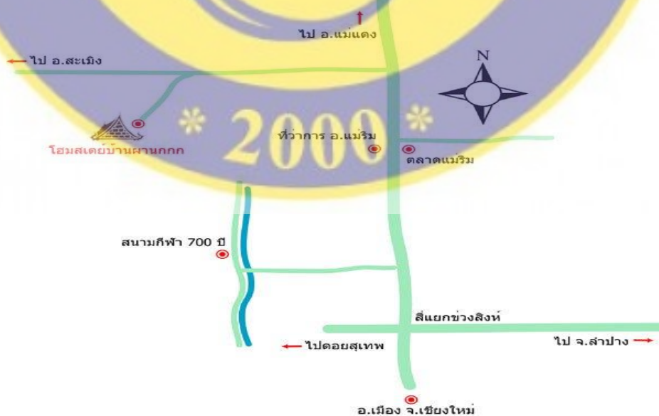
ภาพที่ 4 แผนที่บ้านผานกกก

ที่อยู่ 21/1 หมู่ 9 ต.โป่งแยง อ.แม่อริม จ.เชียงใหม่ 50180