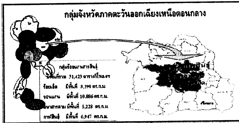
ภาพที่ 1 ภาพแสดงที่ตั้งกลุ่มจังหวัด “ร้อยแก่นสารสินธุ์”

วนอุทยานผาน้ำย้อย (ร้อยเอ็ด) พิพิธภัณฑิ์ไดโนเสาร์ศูนย์สิริธร เขื่อนลำปาว แหลมโนนวิเศษ (กาฬสินธุ์) โดยภาพแสดงที่ตั้งของกลุ่มร้อยแก่นสารสินธุ์ดังแสดงในภาพที่ 1