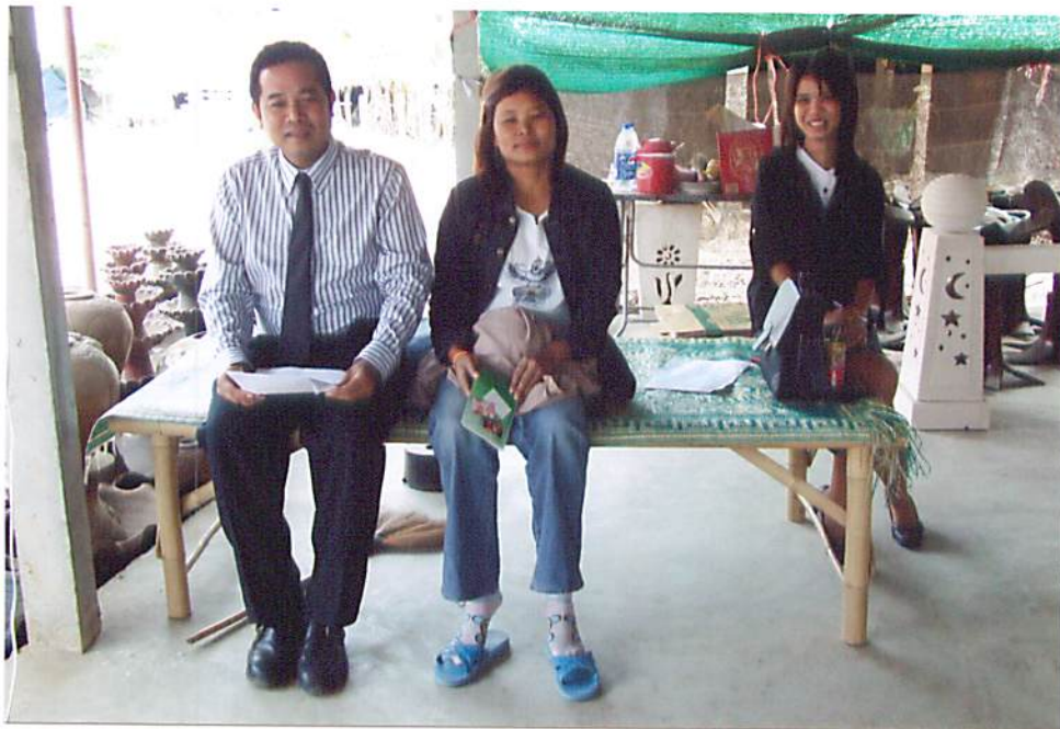
รูปที่ 2.4 ทีมเจ้าหน้าที่สัมภาษณ์เก็บข้อมูลแหล่งท่องเที่ยวด้านกล้วยนพลาซ่า อ.โชคชัย จ.นครราชสีมา