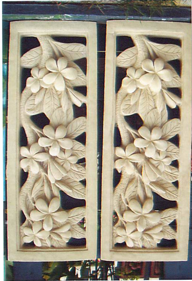
รูปที่ 2.2 รูปถ่ายผลิตภัณฑ์ประยูกต์ทำจากหินทรายที่ด่านเกวียนพลาซ่า อ.โชคชัย จ.นครราชสีมา