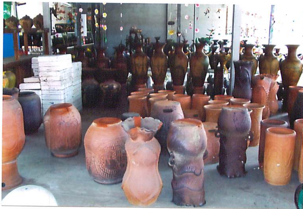
รูปที่ 2.1 ภาพถ่ายผลิตภัณฑ์เครื่องปั้นดินเผาผ่านเกวียน อ.โชคชัย จ.นครราชสีมา