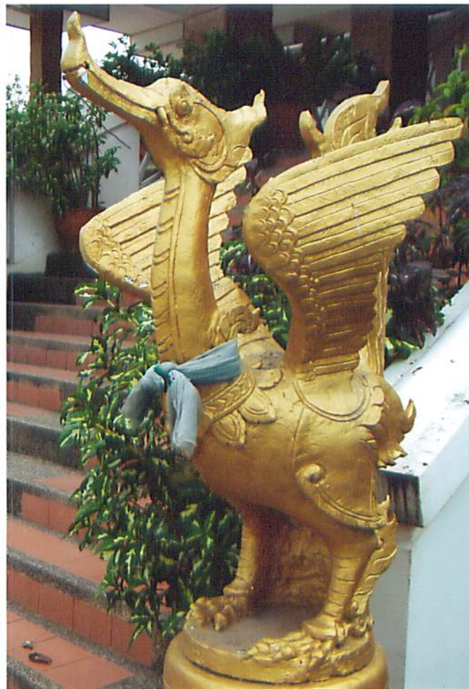
รูปที่ 2.3 รูปถ่ายผลิตภัณฑ์ที่ประยุกต์ทำจากหินทรายที่ด่านเจริญพลาซ่า อ.โชคชัย จ.นครราชสีมา