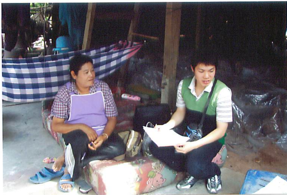
รูปที่ 2.6 ทีมเจ้าหน้าที่สัมภาษณ์เก็บข้อมูลแหล่งท่องเที่ยวด้านเกี่ยวนปลาซ่า อ.โชคชัย จ. นครราชสีมา