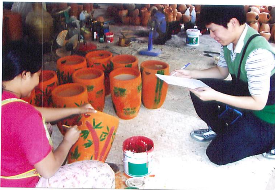
รูปที่ 2.7 ทีมเจ้าหน้าที่สัมภาษณ์เจ้าของกิจการวิธีการผลิต ขั้นตอนการผลิตเครื่องปั้นดินเผาด่าน เกวียน อ.โชคชัย จ.นครราชสีมา