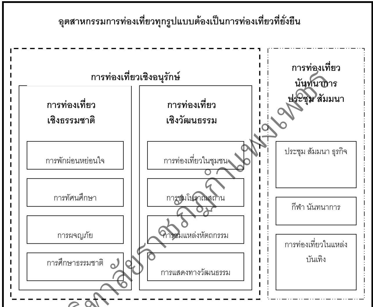
รูปที่ 2.2 รูปแบบของการท่องเที่ยว