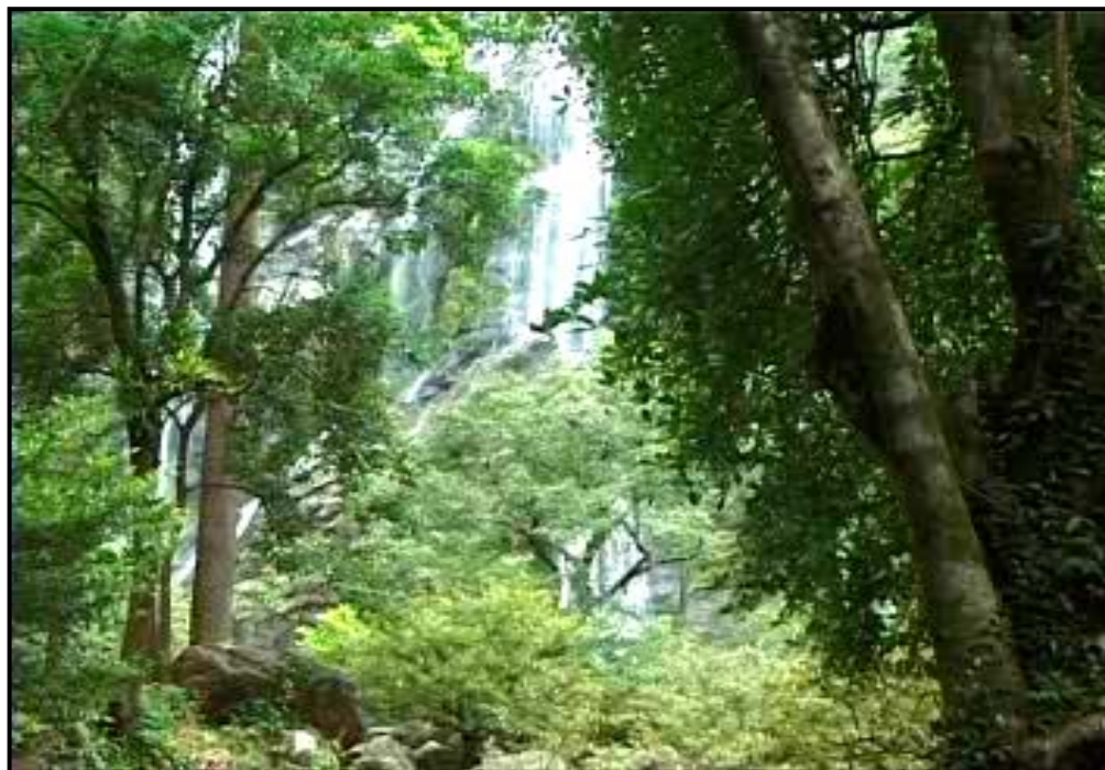
ภาพที่ 2 น้ำตกคลองลานภายในอุทยานแห่งชาติคลองลาน

น้ำตกคลองน้ำไหลหรือน้ำตกปางควาย ห่างจากที่ทำการอุทยานแห่งชาติคลองลาน ประมาณ 25 กิโลเมตร น้ำตกคลองน้ำไหล ตั้งอยู่ที่หน่วยพิทักษ์อุทยานแห่งชาติ ที่ คล. 2 (คลองน้ำไหล) เป็นน้ำตกขนาดกลาง ซึ่งมีทั้งหมด 9 ชั้น ไหลลดหลั่นกันมาแต่ละชั้นมีแอ่งน้ำและความสูงต่างกัน ชั้นที่สูงที่สุดประมาณ 60 เมตร มีลานหินกว้างเป็นสินิลาวาวับ ชั้นที่ 3 บริเวณพื้นล่างมีแอ่งน้ำขนาดใหญ่เหมาะสำหรับการลงเล่นน้ำได้