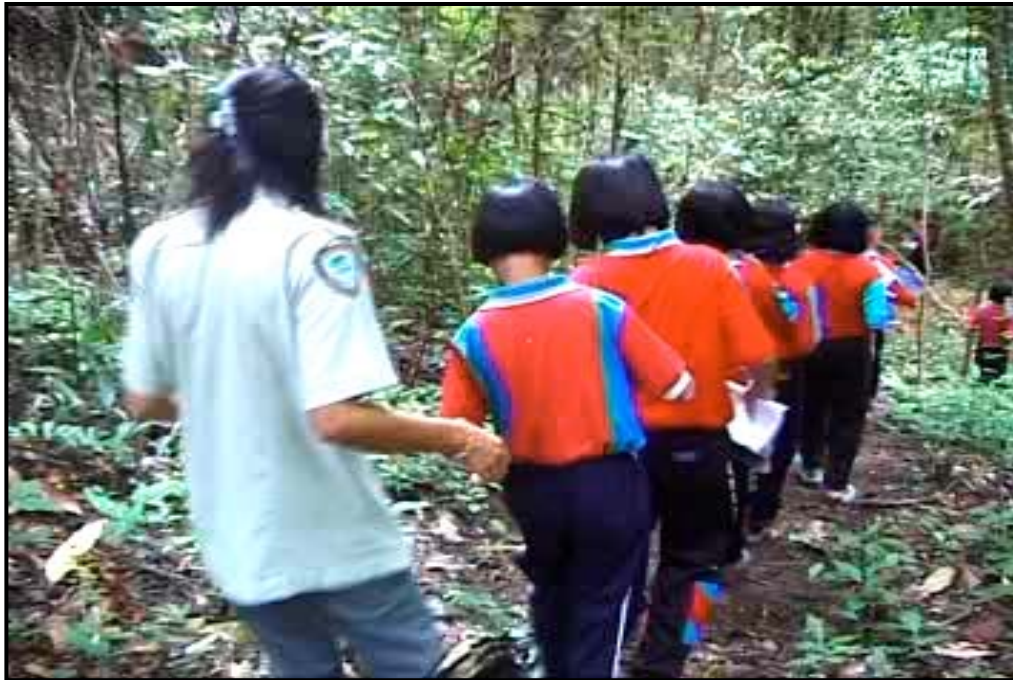
ภาพที่ 4 เส้นทางศึกษาธรรมชาติ (กิจกรรมการเดินป่า ระยะทาง 1 กิโลเมตร)