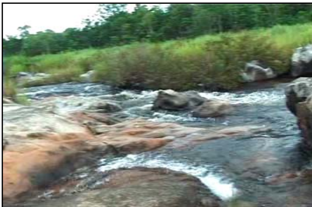
ภาพที่ 3 เกาะร้อยบริเวณคลองสวนหมาก