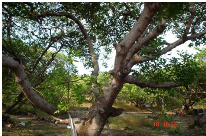
ภาพที่ 3 ลักษณะการปลูกต้นมะม่วงหิมพานต์ที่พบเห็นได้ทั่วไปในพื้นที่บ้านเกาะพยาม

พื้นที่เพื่อใช้ในการศึกษาคือ บ้านเกาะพยาม ตำบลเกาะพยาม ซึ่งเป็นตำบลหนึ่งของจังหวัดระนอง และเป็นตำบลที่อยู่ในพื้นที่เตรียมการประกาศจัดตั้งเป็นอุทยานแห่งชาติหมู่เกาะพยาม ตั้งอยู่ หมู่ที่ 1 ตำบลเกาะพยาม อำเภอเมือง จังหวัดระนอง พื้นที่ทั้งหมดของบ้านเกาะพยามจะล้อมรอบด้วยทะเลอันดามัน มีพื้นที่ประมาณ 11,000 ไร่ หรือ 17.6 ตารางกิโลเมตร สภาพพื้นที่ของเกาะพยาม มีที่ราบประมาณ ร้อยละ 70 นอกนั้นเป็นควนเขา ลักษณะดินร้อยละ 80 ดินร่วนปนทราย ซึ่งดินบนเกาะจะมีสภาพที่อุดมสมบูรณ์สูง จึงเหมาะแก่การทำอาชีพเกษตรกรรม ทำสวนมะม่วงหิมพานต์ ซึ่งก็จะพบได้ตามริมถนน หรือรอบๆ เกาะพยาม ซึ่งพันธุ์มะม่วงหิมพานต์เป็นพันธุ์ที่ดีที่สุดของจังหวัดระนอง