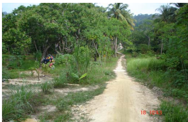
ภาพที่ 5 สภาพถนนบางแห่งที่เข้าไปยังสถานที่ท่องเที่ยวในพื้นที่บ้านเกาะพยาม

พื้นที่ของบ้านเกาะพยามล้อมรอบด้วยทะเล ในการเดินทางเข้าออกหมู่บ้านจึงจำเป็นต้องใช้เรือเป็นพาหนะ ประชาชนในบ้านเกาะพยามเดินทางโดยเรือโดยสารขนาดใหญ่ แต่มีบางกลุ่มที่ใช้เรือของตนเอง เช่น เรือเร็ว และเรือประมง เป็นต้น ท่าเทียบเรือของหมู่บ้านจะอยู่ตรงหน้าหมู่บ้านมีสภาพแข็งแรง และปลอดภัย แต่ก็มีความเล็กไปถ้าเทียบกับจำนวนนักท่องเที่ยวที่เข้ามาเที่ยว นอกจากนี้มีท่าเทียบเรือองค์การสะพานปลา ตำบลปากน้ำ อำเภอเมือง จังหวัดระนอง ซึ่งมีระยะทาง 33 กิโลเมตรจากสะพานปลา อำเภอเมือง จังหวัดระนอง ถึงบ้านเกาะพยาม สำหรับการคมนาคมบนเกาะพยาม ประชาชนใช้รถมอเตอร์ไซด์ เป็นพาหนะในการสัญจรไปมาบนเกาะ