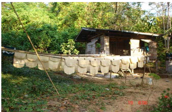
ภาพที่ 6 แสดงผลผลิตการทำอาชีพ ปลูกสวนยางพาราในพื้นที่บ้านเกาะพยาม

อาชีพหลักของประชาชนบ้านเกาะพยามทำการเกษตร คือปลูกมะม่วงหิมพานต์ ปลูกยางพารา และทำการประมง ซึ่งอาชีพรองได้แก่รับจ้างทั่วไป ค้าขาย และเป็นข้าราชการ ผลผลิตของมะม่วงหิมพานต์จะจัดทำในรูปแบบของฝากลักษณะเป็นกล่อง ทำเป็นอบแห้ง อบน้ำผึ้ง เผา และส่งขายในท้องตลาดทั่วไป ผลผลิตของยางพาราจะเป็นแผ่นยางตามวิธีการผลิตแบบดั้งเดิม โดยปราศ จากเครื่องมือที่เป็นเทคโนโลยีสมัยใหม่ หรือเรียกว่า การใช้ภูมิปัญญาชาวบ้านในการผลิตนำผลผลิตที่เป็นแผ่นยางไปส่งขายในตัวเมือง ส่วนการทำประมงชาวบ้านจะใช้เรือประมงของตัวเองไปหาปลาตามทะเลเล็กๆ เพราะเรือที่ทำประมงจะเป็นเรือขนาดเล็ก จะไม่พยายามหาไกลๆ ฝั่งเพราะเป็นการทำลายแนวปะการังของเกาะพยาม ซึ่งผลผลิตที่ได้จะนำไปขายในตัวเมืองระนองสำหรับชาวบ้านที่ทำประมงเป็นอาชีพเสริมก็จะนำมาขายให้กับชาวบ้านด้วยกันเองในราคาขอมเยาว์