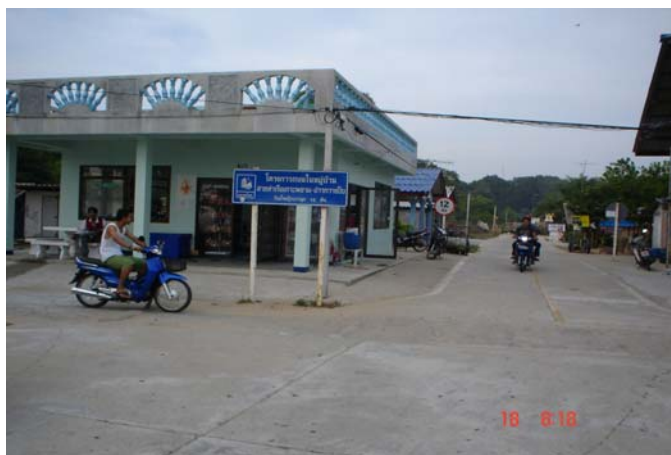
ภาพที่ 4 สภาพถนนย่านชุมชนในพื้นที่ท่องเที่ยวของบ้านเกาะพยาม