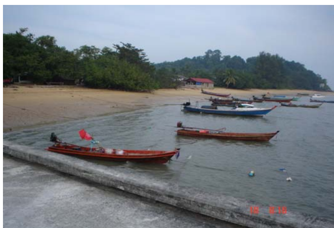
ภาพที่ 7 เรือประมงขนาดเล็กที่ชาวบ้านใช้หาปลาที่จอดหน้าหาดบ้านเกาะพยาม