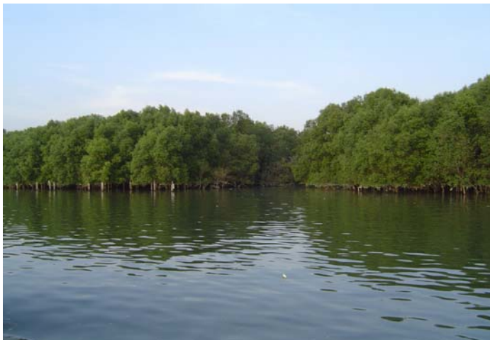
ภาพที่ 1 ป่าชายเลนที่ขึ้นอยู่ตามชายทะเล ในพื้นที่หมู่เกาะพยาม