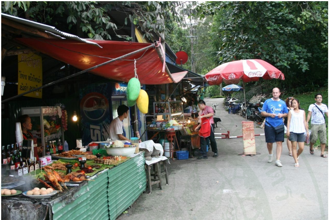
ภาพผนวกที่ ๑5 ร้านค้าบริเวณทางเข้าน้ำตกห้วยแก้ว