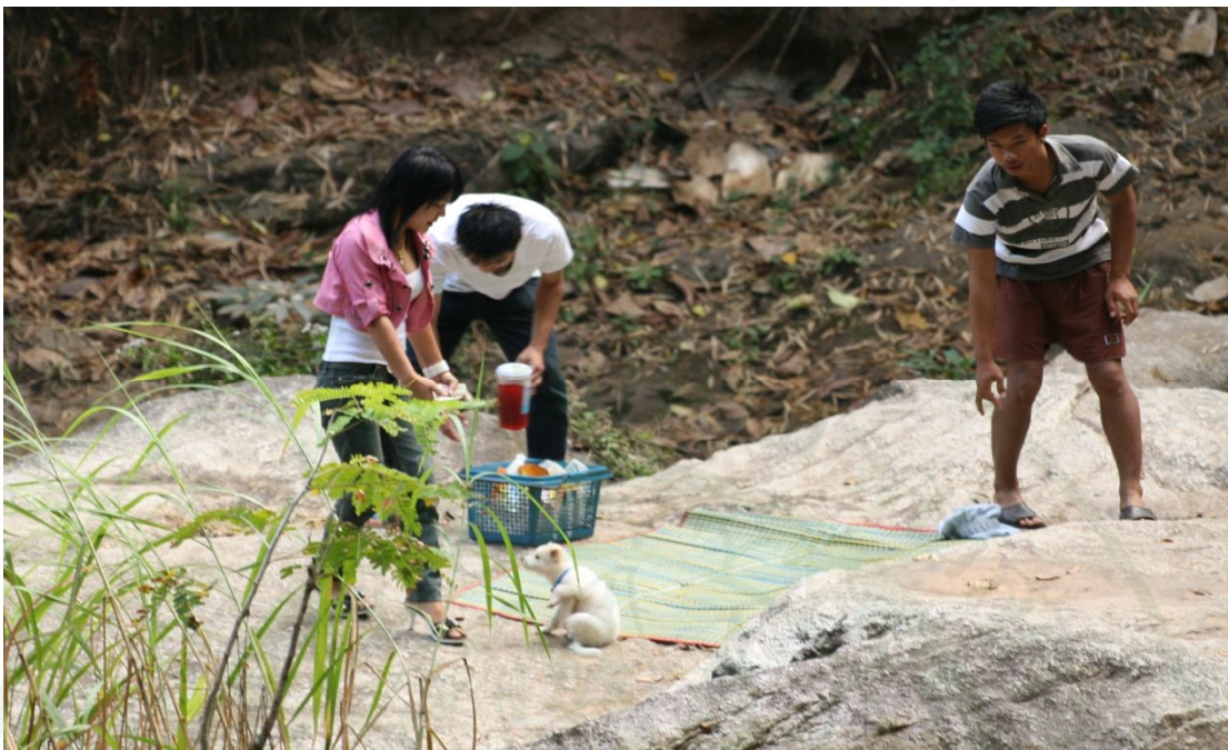
ภาพผนวกที่ ๑๑ ผู้มาเยือนนำสัตว์เลี้ยงเข้ามาในพื้นที่อุทยานแห่งชาติดอยสุเทพ-ปุย