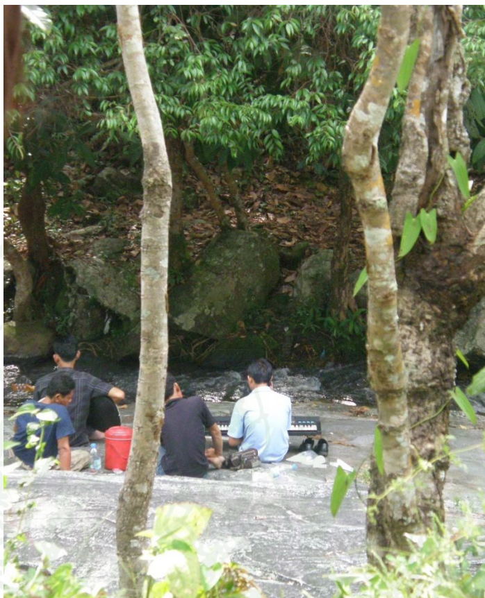
ภาพผนวกที่ ๑1 ผู้มาเยือนขณะประกอบกิจกรรมบริเวณน้ำตกวังบัวบาน