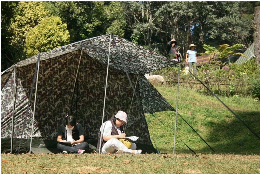
ภาพผนวกที่ ๑๗ ผู้มาเยือนขณะตอบแบบสอบถามบริเวณลานกางเต็นท์ยอดดอยปุย