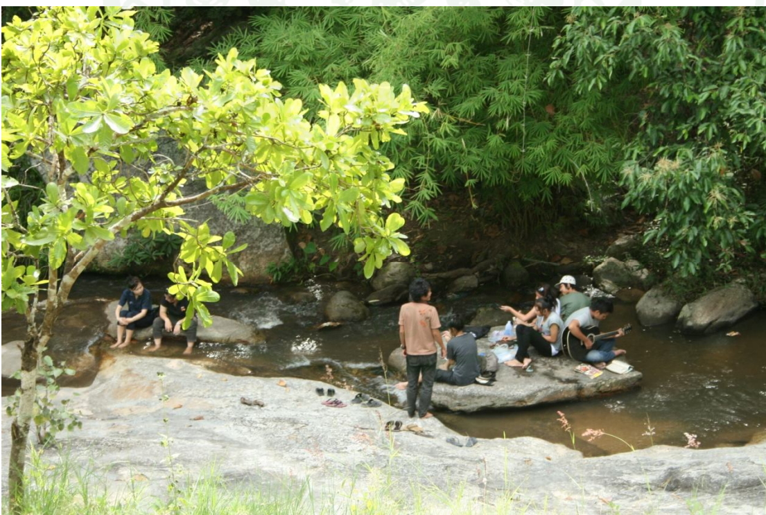
ภาพผนวกที่ ๑๑๐ ผู้มาเยือนขณะประกอบกิจกรรมนันทนาการบริเวณน้ำตกวังบัวบาน