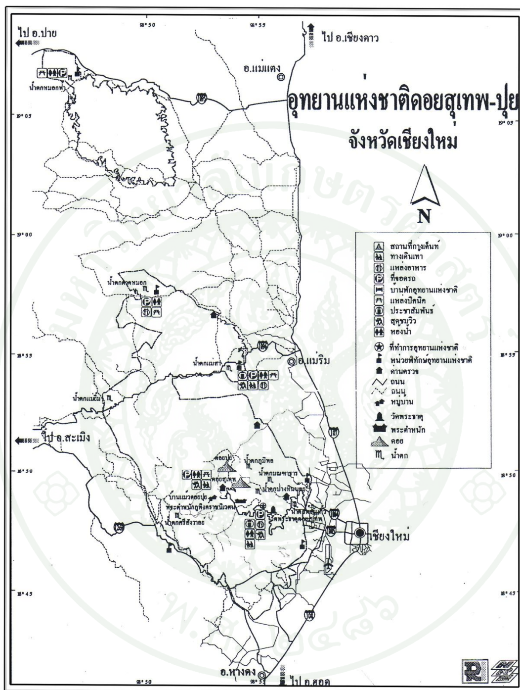
ภาพที่ 3 ที่ตั้ง และอาณาเขตติดต่อของอุทยานแห่งชาติดอยสุเทพ - ปุย