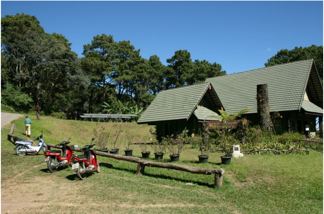
ภาพผนวกที่ ๑1 ลานกางเต็นท์ยอดดอยบุญ