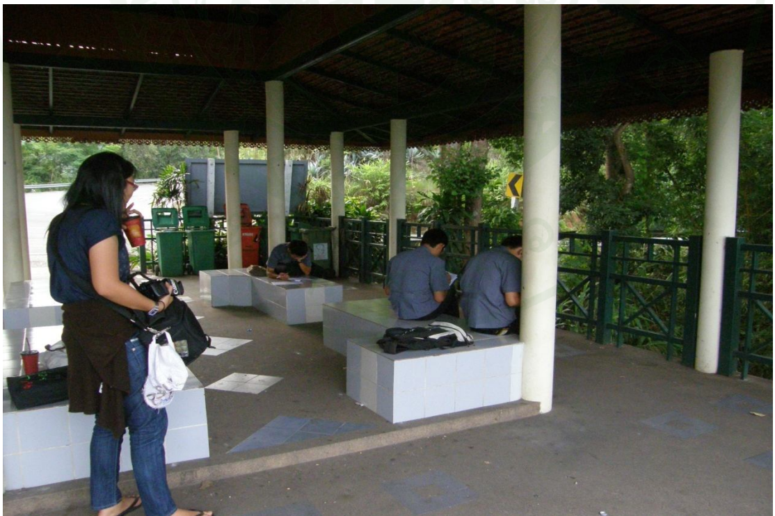
ภาพผนวกที่ ๑6 ผู้มาเยือนขณะตอบแบบสอบถามบริเวณจุดชมวิว