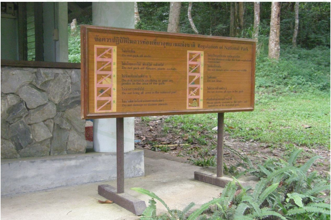
ภาพผนวกที่ ๑4 ป้ายแสดงข้อควรปฏิบัติในการท่องเที่ยวอุทยานแห่งชาติบริเวณน้ำตกมณฑาธาร