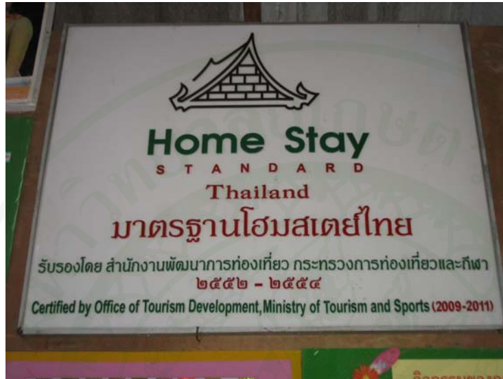
ภาพที่ 9 ป้ายการรับรองมาตรฐานโฮมสเตย์ของหมู่บ้านที่ร่วมกิจกรรมท่องเที่ยวเชิงเกษตร

สำหรับจำนวนสมาชิกในครัวเรือนพบว่า เกษตรกรร้อยละ 63.2 มีจำนวนสมาชิกในครัวเรือนระหว่าง 3 – 4 คน รองลงมาร้อยละ 17.5 มีจำนวนสมาชิกในครัวเรือนระหว่าง 5 – 6 คน โดยมีจำนวนสมาชิกในครัวเรือนสูงสุด 8 คน ต่ำสุด 1 คน เฉลี่ย 3.79 คน ซึ่งถือได้ว่าเป็นครอบครัวขนาดค่อนข้างปานกลาง