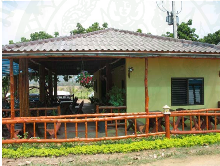
ภาพที่ 14 บ้านพักที่ให้บริการนักท่องเที่ยว

รายได้หลักของครอบครัวพบว่า ร้อยละ 31.6 รายได้หลักของครอบครัวมาจากการรับจ้างทั่วไป รองลงมา ร้อยละ 26.2 ทำสวนซึ่งได้แก่ สวนไม้ผล ไม้ยืนต้น และปลูกพืชผักเมืองหนาว ได้แก่ พืชผักธรรมชาติ และผักปลอดสารพิษ และรายได้รองของครอบครัวพบว่า ร้อยละ 64.9 มาจากการทำโฮมสเตย์ รองลงมา ร้อยละ 12.3 มาจากการรับจ้างทั่วไป ร้อยละ 7.0 มาจากการขายของที่ระลึก และการทำสวนอย่างละเท่ากันทั้งสองจำนวน สำหรับรายได้รวมทั้งหมดในปี 2551 ของครอบครัวพบว่า ร้อยละ 50.9 มีรายได้ไม่น้อยกว่าหรือเท่ากับ 100,000 บาท รองลงมา ร้อยละ 33.3 มีรายได้ระหว่าง 100,001 – 200,000 บาท โดยมีรายได้สูงสุด 1,000,000 บาท รายได้ต่ำสุด 10,000 บาท เฉลี่ย 173,912.25 บาท และกรณีที่ไม่รวมเอารายที่มีรายได้ 1,000,000 บาท มีรายได้เฉลี่ย 143,872.73 บาท ซึ่งได้มาจากรายได้หลักและรายได้รองหลายแหล่งเช่น มาจากการรับจ้างทั่วไป ทำสวน และทำไร่ นับได้ว่ารายได้เฉลี่ยต่อสมาชิก 1 คน เท่ากับ 4,576.63 บาทต่อปี ซึ่งก็ไม่ได้สูงมาก หรือต่อสมาชิกในวัยทำงานก็เพียง 6,612.62 บาทต่อปี ก็ไม่สูงแค่ 551 บาทต่อเดือน