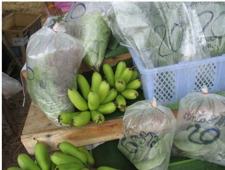
ภาพที่ 23 ผลไม้/ผักสดที่จำหน่ายให้นักท่องเที่ยว

การเปิดให้บริการท่องเที่ยวเชิงเกษตรในปี 2553 (ตารางที่ 5) พบว่า ร้อยละ 86.0 เปิดให้บริการท่องเที่ยว และร้อยละ 14.0 ไม่เปิดให้บริการท่องเที่ยว ซึ่งเกษตรกรได้ให้เหตุผลที่เปิดให้บริการ ร้อยละ 24.6 เหตุผลที่เปิดให้บริการเพราะมีผลิตภัณฑ์ต่าง ๆ ให้นักท่องเที่ยวได้ซื้อเป็นที่ระลึก รองลงมา ร้อยละ 19.3 เป็นจุดท่องเที่ยวและเผยแพร่ความรู้ และที่เหลือ ได้แก่ ให้นักท่องเที่ยวที่มาพักมีโอกาสเข้าไปเยี่ยมชมและร่วมทำงาน ให้นักท่องเที่ยวมาเยี่ยมชมและฝึกอบรมเกี่ยวกับการปลูกผักปลอดสารพิษและซื้อผักปลอดสารพิษกลับบ้าน ให้นักท่องเที่ยวได้ถ่ายภาพเป็นที่ระลึก ให้นักท่องเที่ยวเรียนรู้และได้ความรู้เกี่ยวกับวิธีการเพาะเห็ด เป็นการกระจายผลผลิตทางการเกษตรในพื้นที่และรายได้เสริม และ ให้นักท่องเที่ยวได้เยี่ยมชมการปลูกผักเมืองหนาว สำหรับเหตุผลที่ไม่เปิดให้บริการให้เหตุผลเพราะไม่มีสวนเป็นของตนเอง เนื่องจากเกษตรกรบางส่วนไม่มีที่ดินเป็นของตนเอง จึงไม่กล้าเปิดให้บริการท่องเที่ยวเชิงเกษตรในปี 2553 ทั้งนี้อาจเป็นเพราะเกรงว่าเมื่อลงทุนให้บริการท่องเที่ยวเชิงเกษตรอาจไม่คุ้มค่ากับการลงทุน เจ้าของที่ดินอาจเรียกคืน