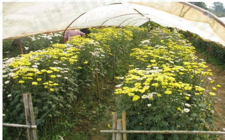
ภาพที่ 12 แปลงปลูกเบญจมาศเพื่อให้บริการนักท่องเที่ยว

รองลงมาร้อยละ 8.8 มีพื้นที่บ้านต่ำกว่า 1 ไร่ โดยมีบริเวณพื้นที่บ้านสูงสุด 50 ไร่ ต่ำสุด 1 ไร่ เฉลี่ย 2.66 ไร่ ลักษณะการถือครองที่ดินทำกิน พบว่า เกษตรกรร้อยละ 96.5 ลักษณะการถือครองที่ดินทำกิน เป็นของตนเอง และร้อยละ 3.5 ลักษณะการถือครองที่ดินทำกิน โดยการเช่า นับได้ว่าเกษตรกรส่วนใหญ่ มีที่ดินทำกินเป็นของตนเองมีเพียงส่วนน้อยที่เช่าที่ดินเพื่อทำกินเลี้ยงครอบครัว สำหรับพืชผักที่ปลูก เป็นประจำพบว่า เกษตรกรร้อยละ 3.5 มีการปลูกข้าวโพดจำนวน 2 ไร่ และ 5 ไร่ ร้อยละ 5.3 มีการปลูกมันสำปะหลัง จำนวน 5 ไร่ ร้อยละ 3.5 ปลูกไม้ผลไม้ยืนต้น จำนวน 5 ไร่ และร้อยละ 3.5 ปลูกพืชผักธรรมชาติ จำนวน 2 ไร่ ร้อยละ 8.8 ปลูกผักปลอดสารพิษ จำนวน 2 ไร่ ร้อยละ 1.8 ปลูกไม้ดอกไม้ประดับ จำนวน 4 ไร่ และร้อยละ 5.3 มีการเลี้ยงเป็ดไก่ จำนวน 10 ตัว