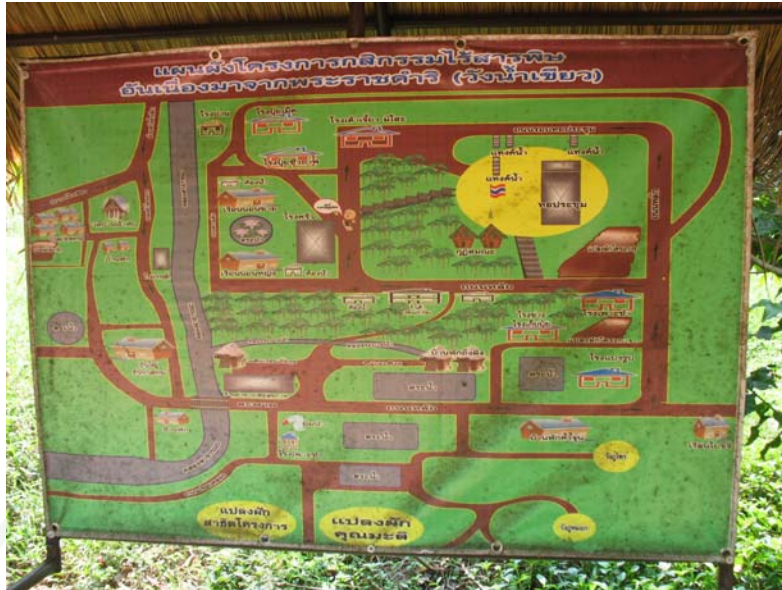
ภาพที่ 21 แผนที่บอกจุดท่องเที่ยวภายในฟาร์ม/สวนของเกษตรกร