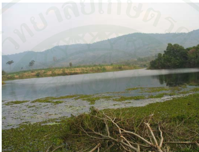
ภาพที่ 1 แหล่งน้ำในอำเภอวังน้ำเขียว

1. ตำบลวังน้ำเขียว ตั้งอยู่ตอนกลางของอำเภอวังน้ำเขียว มีเนื้อที่ประมาณ 206 ตารางกิโลเมตร เขตการปกครองครอบคลุม 19 หมู่บ้าน