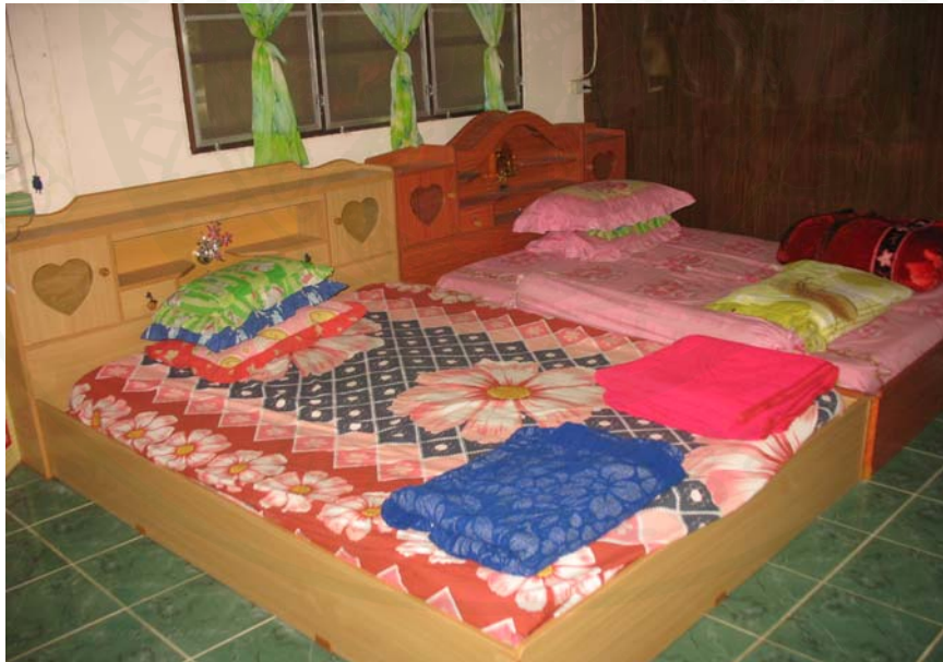
ภาพที่ 18 ห้องพักที่ให้บริการนักท่องเที่ยว