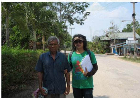
ภาพที่ 5 ผู้วิจัยและเกษตรกรผู้ร่วมกิจกรรมท่องเที่ยวเกษตร

ประชากรในอำเภอวังน้ำเขียวที่เข้าร่วมกิจกรรมการท่องเที่ยวเชิงเกษตร จำนวน 57 ครัวเรือน ในการวิจัยครั้งนี้จึงใช้วิธีสอบถามจากประชากรทั้งหมดรวม 57 ครัวเรือน สอบถามในช่วงเดือน กุมภาพันธ์ พ.ศ. 2553 แบบเจาะจง (Purposive Sampling) จากประชากรที่เข้าร่วมกิจกรรมการท่องเที่ยวเชิงเกษตร รายละเอียดดังตารางที่ 1