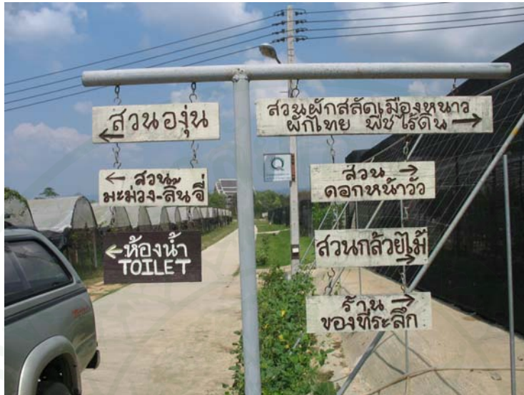
ภาพที่ 30 ป้ายบอกทางเข้าชมแหล่งท่องเที่ยว

โรงเรียน ร้อยละ 3.5 ศูนย์โภชนาการจังหวัดเชียงใหม่ และร้อยละ 1.8 มูลนิธิคุ้มครองสัตว์ป่า และ นายเดิมนทรัพย์ โพธิ์ดี ผู้ก่อตั้งสมาคมเห็ด