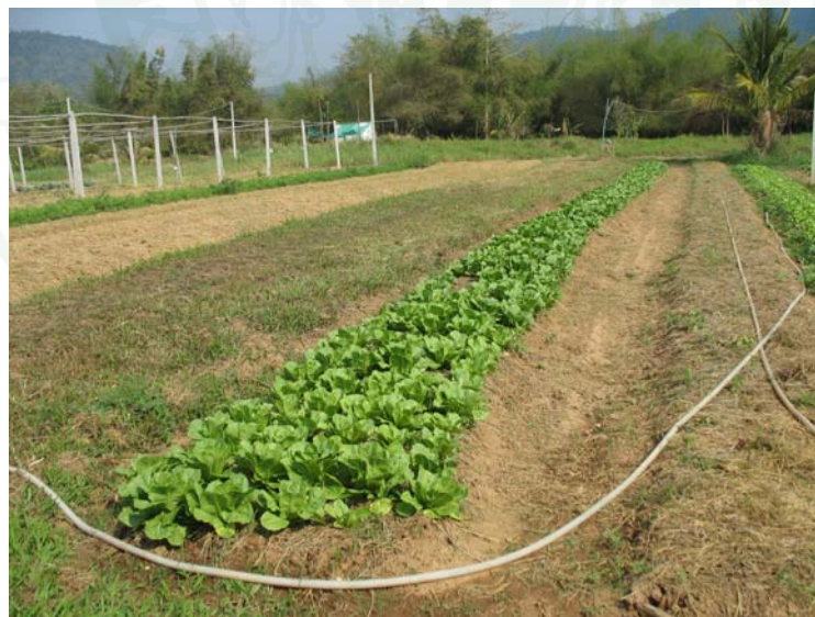
ภาพที่ 10 แปลงปลูกผักกาดขาวปลีของเกษตรกร