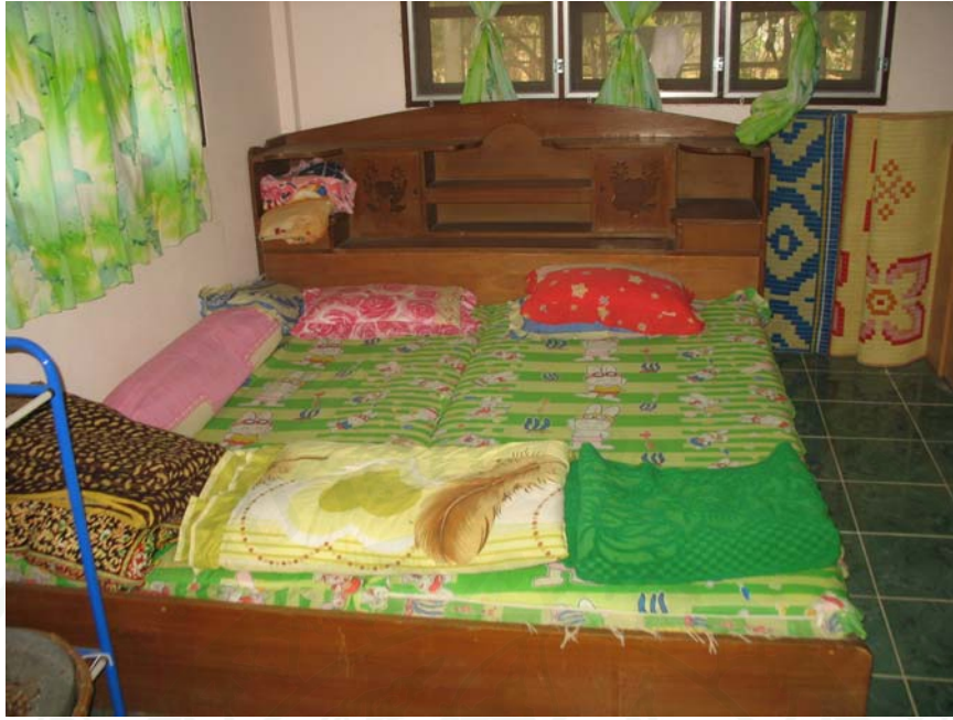
ภาพที่ 17 ห้องพักที่ให้บริการนักท่องเที่ยว