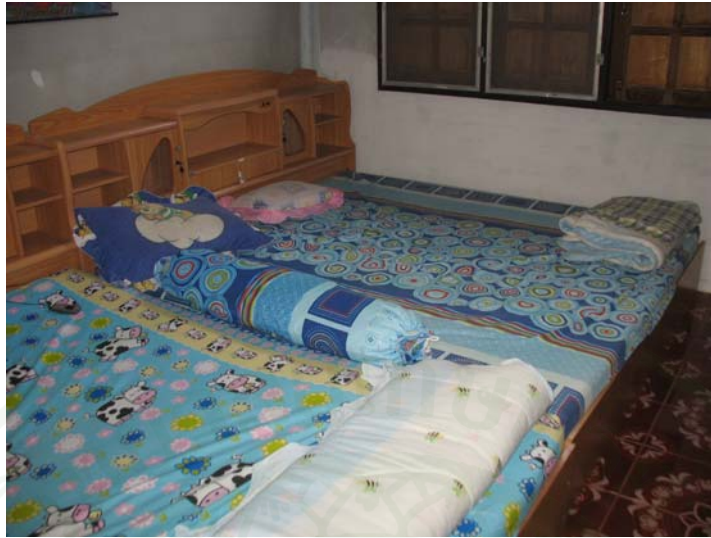
ภาพที่ 27 ห้องพักที่ให้บริการนักท่องเที่ยว

การเพิ่มห้องนอนเพื่อให้บริการนักท่องเที่ยวจากเดิมที่มีอยู่ (ตารางที่ 7) พบว่า ร้อยละ 47.4 ไม่เพิ่มห้องนอน รองลงมาร้อยละ 42.0 เพิ่มห้องนอนอีกจำนวน 2 ห้อง ร้อยละ 5.3 เพิ่มห้องนอนจำนวน 3 ห้อง ร้อยละ 3.5 เพิ่มห้องนอนจำนวน 1 ห้อง และร้อยละ 1.8 เพิ่มห้องนอนจำนวน 4 ห้อง โดยค่าใช้จ่ายในการปรับปรุงห้องนอนที่เพิ่มจากเดิมที่มีอยู่พบว่า ร้อยละ 47.4 ไม่มีค่าใช้จ่ายรองลงมา ร้อยละ 36.8 มีค่าใช้จ่ายในการปรับปรุงห้องนอนระหว่าง 20,000 – 40,000 บาท ร้อยละ 8.8 มีค่าใช้จ่ายในการปรับปรุงห้องนอน 40,001 บาทขึ้นไป และร้อยละ 7.0 น้อยกว่า 20,000 บาท โดยมีค่าใช้จ่ายปรับปรุงห้องนอนสูงสุด 300,000 บาท ต่ำสุด 8,000 บาท เฉลี่ย 24,736.84 บาท นอกจากนี้ เกษตรกรยังได้มีการปรับปรุงห้องน้ำ โดยร้อยละ 45.6 ไม่มีค่าใช้จ่าย รองลงมาร้อยละ 31.6 น้อยกว่า 12,000 บาท ร้อยละ 19.3 ระหว่าง 12,001 – 20,000 บาท และร้อยละ 3.5 20,001 บาทขึ้นไป โดยมีค่าใช้จ่ายปรับปรุงห้องน้ำสูงสุด 50,000 บาท ต่ำสุด 2,000 บาท เฉลี่ย 7,929.83 บาท นอกจากนี้ เกษตรกรยังมีการปรับปรุงด้านอื่น ๆ เช่น การซ่อมแซมโอมสเตย์ การทาสีที่พักใหม่ เพื่อให้ผู้มาพักมีความสะดวกพบว่า ร้อยละ 47.4 ไม่มีค่าใช้จ่าย รองลงมาร้อยละ 31.6 น้อยกว่า 5,000 บาท ร้อยละ 15.8 ระหว่าง 5,000 – 10,000 บาท ร้อยละ 5.3 10,001 บาทขึ้นไป โดยมีค่าใช้จ่ายปรับปรุงด้านอื่น ๆ สูงสุด 50,000 บาท ต่ำสุด 2,000 บาท เฉลี่ย 3,684.21 บาท