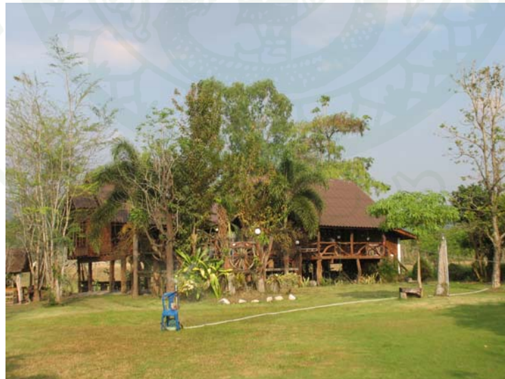
ภาพที่ 13 สภาพบ้านพักที่ให้บริการนักท่องเที่ยว