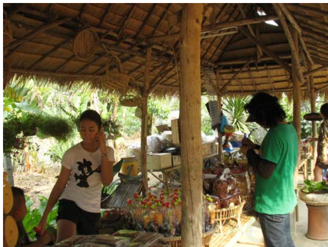
ภาพที่ 8 สัมภาษณ์เกษตรกรผู้ร่วมกิจกรรมท่องเที่ยวเชิงเกษตร