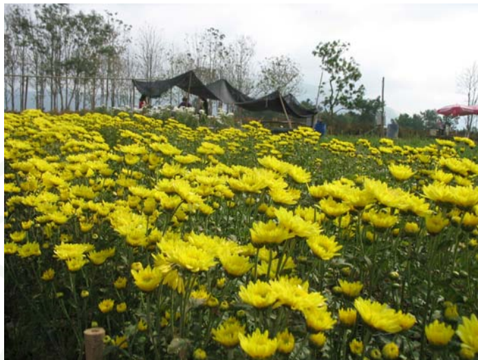
ภาพที่ 2 แปลงปลูกเบญจมาศของเกษตรกร

5. ตำบลกระเรียง อยู่ด้านเหนือของอำเภอวังน้ำเขียว มีเนื้อที่ประมาณ 99 ตารางกิโลเมตร เขตปกครองครอบคลุม 14 หมู่บ้าน ประกาศเป็นตำบลเมื่อวันที่ 30 มีนาคม 2539