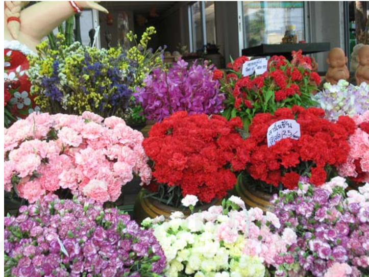
ภาพที่ 20 ไม้ดอกไม้ประดับจำหน่ายเป็นของฝาก