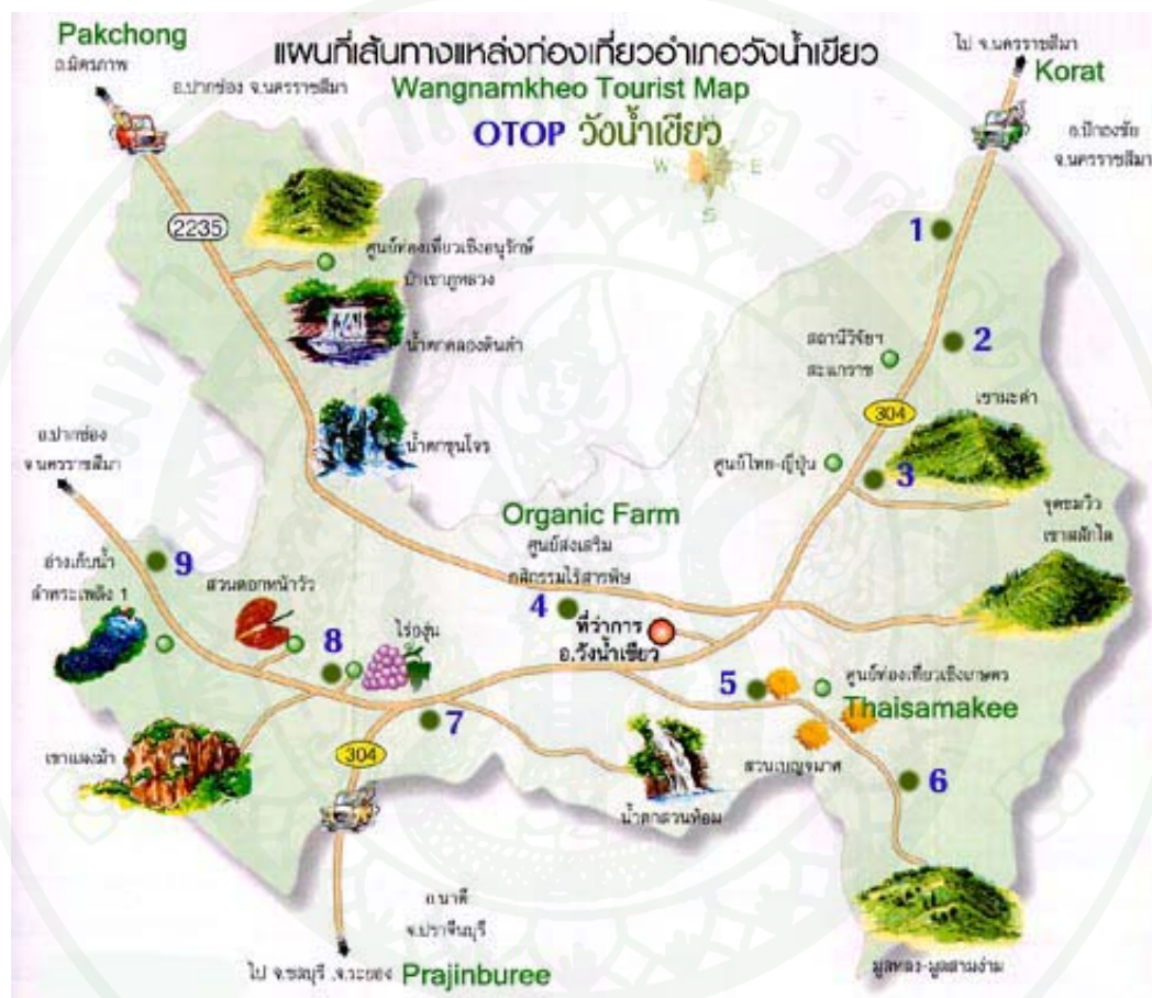
ภาพที่ 4 แผนที่อำเภอวังน้ำเขียว

จุดที่นักท่องเที่ยวโดยผู้ให้บริการท่องเที่ยวอยู่เฉพาะ 4 จุดเท่านั้น ซึ่งน่าจะมีจุดอื่นที่อยู่ใกล้เคียงท่องเที่ยวเชิงธรรมชาติ มีระบบการปลูกพืชที่หลากหลาย และสภาพภูมิประเทศที่อำนวย ทิวทัศน์สองข้างทางสวยงาม เช่น บางจุดในตำบลวังน้ำเขียวและตำบลไทยสามัคคี รวมทั้งเฉพาะจุดในตำบลวังหมี อุดมทรัพย์ ตำบลระเริง คุรายละเอียดในแผนที่ (อำเภอวังน้ำเขียว, 2550)