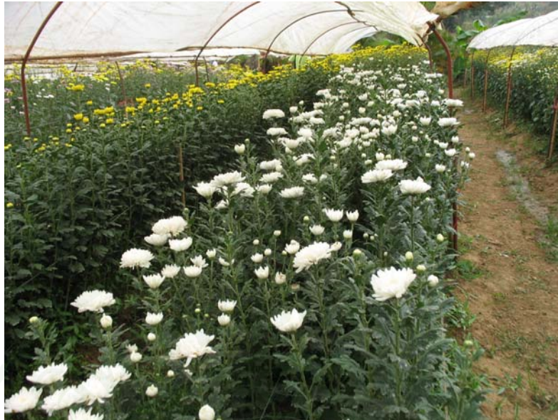
ภาพที่ 15 แปลงปลูกเบญจมาศที่ให้บริการนักท่องเที่ยว