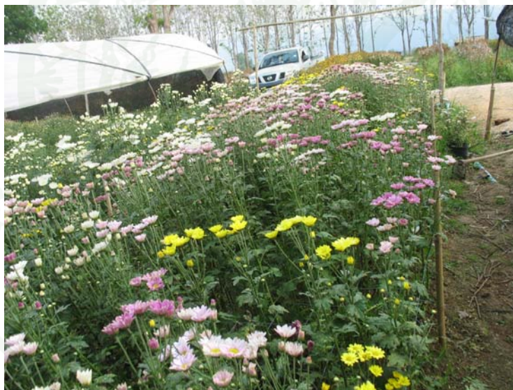
ภาพที่ 19 แปลงปลูกเบญจมาศที่ให้บริการเที่ยวชมแก่นักท่องเที่ยว

สำหรับกิจกรรมที่ให้บริการพบว่า ร้อยละ 50.9 โฮมสเตย์ รองลงมา ร้อยละ 33.3 ให้บริการที่พักแก่นักท่องเที่ยวและเข้าชมฟาร์มเห็ด และที่เหลือได้แก่ การเพาะเห็ดไว้กินในครัวเรือนและมีนักท่องเที่ยวเข้ามาเยี่ยมชม ขายของที่ระลึก ให้บริการเกี่ยวกับสินค้าเกษตร เช่น เห็ดหอม เห็ดหลินจือ และขายผลิตภัณฑ์แปรรูปเห็ดหอม และ จุดเรียนรู้เกี่ยวกับการเพาะเห็ด ปลูกกุหลาบ เบญจมาศ หน้าวัว และองุ่น และขายพืชผักปลอดสารพิษให้นักท่องเที่ยว จะเห็นได้ว่ากิจกรรมที่ให้บริการแก่นักท่องเที่ยวส่วนใหญ่คือ โฮมสเตย์ซึ่งเป็นการให้บริการที่พักแก่นักท่องเที่ยว และที่เหลือจึงเป็นการให้บริการเกี่ยวกับการชมสวนผัก ฟาร์มเห็ด สวนไม้ดอกไม้ประดับ และสวนองุ่น ช่วงเวลาในการเปิดให้บริการพบว่า ในปี 2551 เกษตรกร ร้อยละ 21.1 เปิดให้บริการในช่วงเดือนพฤศจิกายน – มกราคม รองลงมา ร้อยละ 17.5 เปิดให้บริการในช่วงเดือนมกราคม – กุมภาพันธ์ และที่เหลือเปิดให้บริการในช่วงเดือนพฤศจิกายน – กุมภาพันธ์ เดือนธันวาคม – กุมภาพันธ์ และตุลาคม – มกราคม และส่วนใหญ่ร้อยละ 54.3 เกษตรกร ไม่ได้ให้ข้อมูลเกี่ยวกับการเปิดให้บริการซึ่งในการเปิดให้บริการส่วนใหญ่เปิดให้บริการช่วงฤดูหนาวซึ่งเป็นช่วงเทศกาลท่องเที่ยวของอำเภอวังน้ำเขียว เป็นส่วนใหญ่ให้นักท่องเที่ยวจึงนิยมมาใช้บริการที่พักและท่องเที่ยวในพื้นที่ดังกล่าว