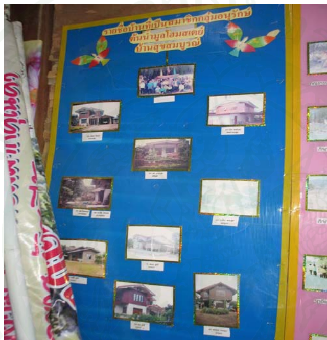
ภาพที่ 29 แหล่งบริการโฮมสเตย์แก่นักท่องเที่ยว

การให้ความรู้กับนักท่องเที่ยว (ตารางที่ 16) พบว่า ร้อยละ 100.0 ระบุว่า การให้ความรู้กับนักท่องเที่ยวคือ ป้ายบอก ณ ศูนย์บริการลูกค้าหรือทางเข้า และมีป้ายบอกเป็นระยะ ๆ ในแต่ละจุด จำนวนเท่ากันทั้ง 2 ประเด็น รองลงมาร้อยละ 52.6 อื่น ๆ เว็บไซต์ โปสเตอร์ เอกสารแนะนำ วิทยากร ร้อยละ 36.8 มีเอกสารประกอบการบรรยาย และร้อยละ 31.6 มัคคุเทศก์ ส่วนการฝึกอบรม ให้ความรู้เกี่ยวกับการท่องเที่ยวพบว่า ร้อยละ 100.0 มีการฝึกอบรม และร้อยละ 96.5 มีประสบการณ์ในการรับการฝึกอบรม