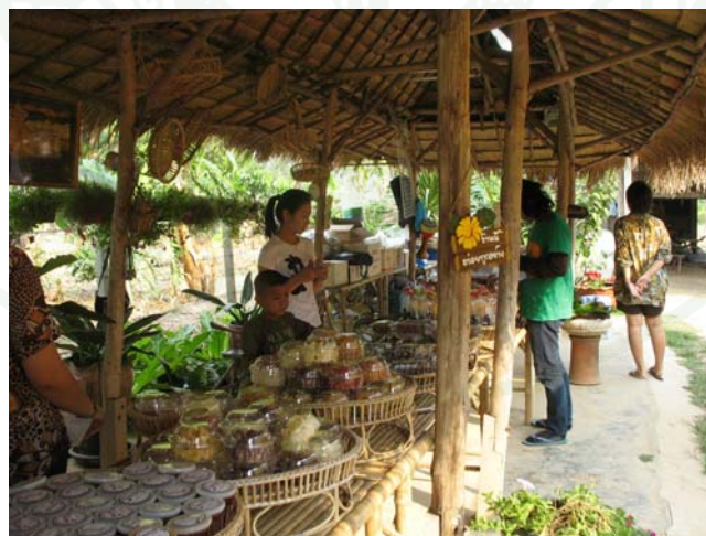
ภาพที่ 22 สถานที่จำหน่ายผลผลิต/ผลิตภัณฑ์ของเกษตรกรแก่นักท่องเที่ยว