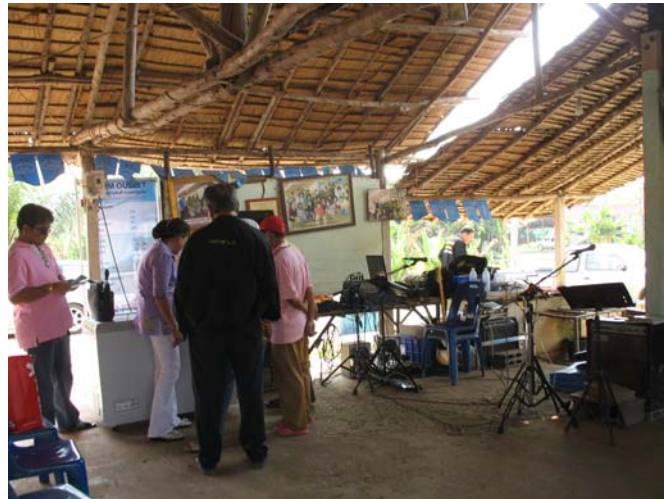
ภาพที่ 26 กิจกรรมสนทนากับเกษตรกรผู้ให้บริการท่องเที่ยวมีส่วนร่วมกับอำเภอวังน้ำเขียว

แหล่งท่องเที่ยว ส่วนการให้บริการที่พิกแก่นักท่องเที่ยว พบว่า เกษตรกรร้อยละ 75.4 ให้บริการที่พัก และร้อยละ 24.6 ไม่ให้บริการที่พัก ปีที่ให้บริการที่พิกแก่นักท่องเที่ยวพบว่า ร้อยละ 65.1 ให้บริการที่พิกแก่นักท่องเที่ยวในปี 2538 – 2550 รองลงมาร้อยละ 24.6 ไม่ระบุปีที่ให้บริการ และร้อยละ 19.3 ให้บริการที่พิกแก่นักท่องเที่ยวในปี 2551 – ปัจจุบัน จะเห็นได้ว่าเกษตรกรส่วนใหญ่ได้จัดหาสิ่งอำนวยความสะดวกในการให้บริการแก่นักท่องเที่ยวที่จะมาเยี่ยมชมสวนผัก ฟาร์มเห็ด ไม้ดอกไม้ประดับ และสวนอนุ่วไว้เป็นอย่างดีเพื่อให้บริการแก่นักท่องเที่ยวให้ประทับใจและตรงความต้องการของนักท่องเที่ยว เพื่อนักท่องเที่ยวจะได้กลับมาเยี่ยมชมและใช้บริการการท่องเที่ยวเชิงเกษตรของพื้นที่ในโอกาสต่อไป