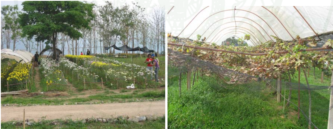
ภาพที่ 24 แปลงเบญจมาศและโรงงุ่นที่ให้บริการนักท่องเที่ยว