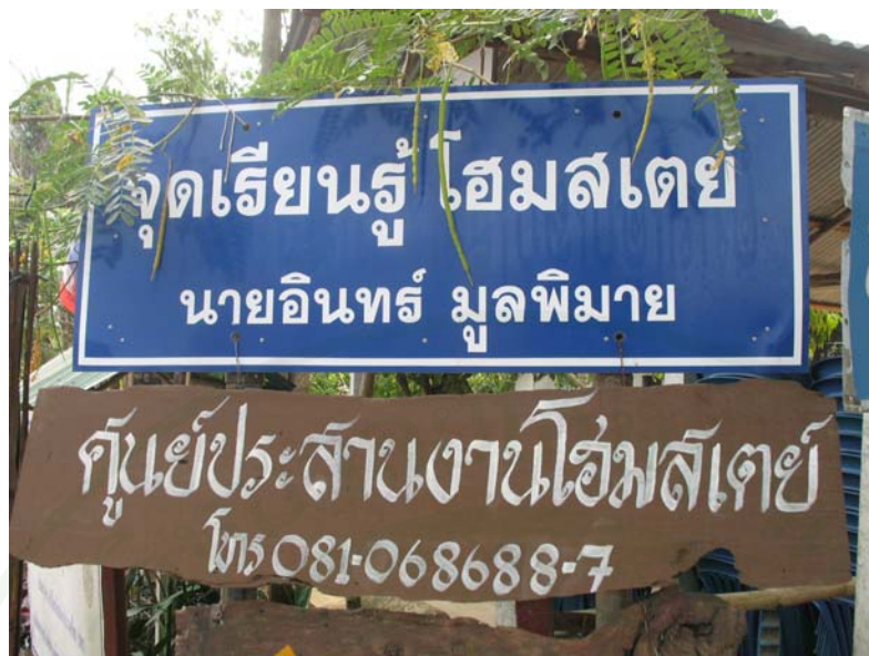
ภาพที่ 16 ศูนย์ประสานงานโฮมสเตย์ที่ให้บริการนักท่องเที่ยว

การเริ่มให้บริการครั้งแรกพบว่า เกษตรกรร้อยละ 68.4 เริ่มให้บริการครั้งแรกระหว่างปี 2546–2550 รองลงมาร้อยละ 22.8 เริ่มให้บริการครั้งแรกในปี 2551 ถึงปัจจุบัน และร้อยละ 8.8 เริ่มให้บริการครั้งแรกตั้งแต่ปี 2545 สาเหตุที่ให้บริการในปี 2546–2550 เนื่องจากเป็นช่วงที่ส่งเสริมและรณรงค์ให้มีการให้บริการท่องเที่ยวเชิงเกษตรในพื้นที่ดังกล่าวส่งผลให้เกษตรกรที่ได้ผ่านการฝึกอบรมการท่องเที่ยวนิยมสนใจและริเริ่มในการให้บริการท่องเที่ยวเชิงเกษตร โดยเริ่มจากการให้บริการที่พริกหรือโฮมสเตย์ก่อนและเริ่มให้บริการชมสวนผัก ไม้ดอกไม้ประดับ และสวนองุ่น บุคคลที่มีบทบาทสำคัญในการริเริ่มให้บริการพบว่า ร้อยละ 91.2 คือ เพื่อนบ้าน รองลงมา ร้อยละ 75.4 สมาชิกในครอบครัว ร้อยละ 71.9 ผู้ใหญ่บ้าน/ผู้นำชุมชน/กำนัน ซึ่งจะเห็นได้ว่าบุคคลที่มีบทบาทสำคัญในการริเริ่มการให้บริการคือเพื่อนบ้าน ทั้งนี้อาจเป็นเพราะ เกษตรกรส่วนใหญ่มักทำอะไรตามเพื่อนบ้านเสมอ เมื่อเห็นเพื่อนบ้านให้บริการท่องเที่ยวเชิงเกษตรได้รับรายได้เสริมก็นิยมทำตามซึ่งเป็นธรรมชาติของเกษตรกรที่เห็นผู้อื่นทำแล้วประสบความสำเร็จมักจะทำตาม นอกจากนี้เกษตรกรอาจจะได้รับการสนับสนุนจากแหล่งอื่น ๆ ด้วย