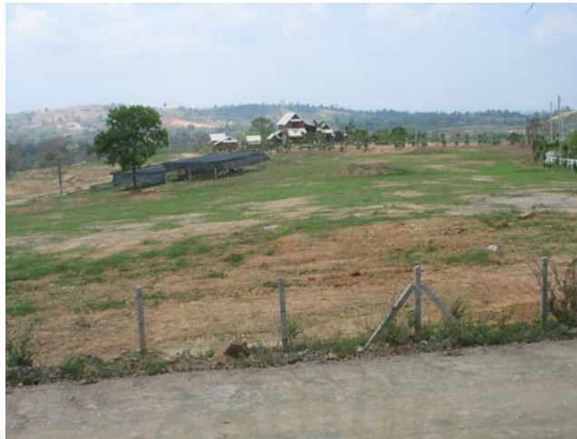
ภาพที่ 25 สภาพถนนและทางเข้าฟาร์มของเกษตรกร

ระยะทางจากตัวอำเภอถึงกิจกรรมท่องเที่ยว (ตารางที่ 6) พบว่า ร้อยละ 45.6 มีระยะทางระหว่าง 10 – 12 กิโลเมตร รองลงมาร้อยละ 36.8 ระหว่าง 13 – 15 กิโลเมตร ร้อยละ 14.0 ต่ำกว่า 10 กิโลเมตร ร้อยละ 1.8 ไม่ทราบระยะทาง และระยะทางมากกว่า 15 กิโลเมตร โดยมีระยะทางจากตัวอำเภอถึงกิจกรรมท่องเที่ยวสูงสุด 16 กิโลเมตร ต่ำสุด 8 กิโลเมตร เฉลี่ย 11.12 กิโลเมตร ลักษณะของถนนหรือทางเข้าสวน/ไร่พบว่า ร้อยละ 87.7 เป็นถนนลาดยาง รองลงมาร้อยละ 8.8 ถนนลูกรัง บดอัด และ ร้อยละ 3.5 ถนนดิน สำหรับ ยานพาหนะที่เข้าถึงสวน/ไร่ พบว่า ร้อยละ 91.2 คือ รถจักรยานยนต์ และรถจักรยานหรือการเดินเท้า รองลงมาร้อยละ 5.5 รถจักรยานหรือการเดินเท้า ร้อยละ 5.3 รถยนต์ รถจักรยานยนต์ และรถจักรยานหรือการเดินเท้า และร้อยละ 3.5 ไม่ระบุ จะเห็นได้ว่าพื้นที่ดังกล่าวอยู่ไม่ไกลจากตัวอำเภอวังน้ำเขียว อีกทั้งถนนหรือทางเข้าสวน/ไร่ส่วนใหญ่เป็นถนนลาดยาง ส่งผลให้มีความสะดวกสบายในการที่นักท่องเที่ยวจะมาเยี่ยมชม อีกทั้งยานพาหนะที่เข้าถึงสวนก็สะดวกสบายต่อการเข้าเยี่ยมชมสวนหรือไร่ของเกษตรกรดังกล่าวเป็นอย่างมาก