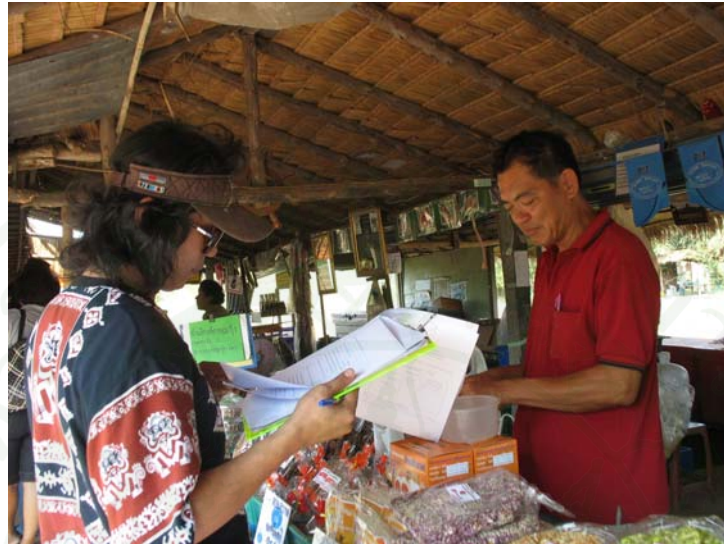
ภาพที่ 7 สัมภาษณ์เกษตรกรผู้ร่วมกิจกรรมท่องเที่ยวเชิงเกษตร

2.1 การสร้างแบบสอบถามเพื่อศึกษาการให้บริการท่องเที่ยวเชิงเกษตรโดยคนในพื้นที่อำเภอวังน้ำเขียว จังหวัดนครราชสีมา