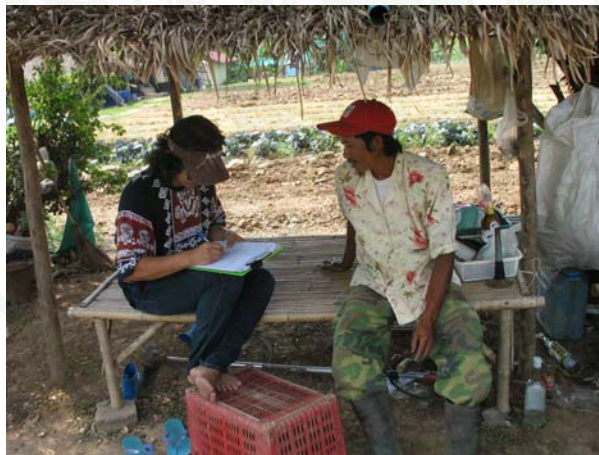
ภาพที่ 6 สัมภาษณ์เกษตรกรผู้ร่วมกิจกรรมท่องเที่ยวเชิงเกษตร

1. ข้อมูลทุติยภูมิ (secondary data) รวบรวมข้อมูลจากตำรา งานวิจัยที่เกี่ยวข้องและเอกสารต่าง ๆ ซึ่งได้แก่ แนวคิดและหลักการเกี่ยวกับการท่องเที่ยวเชิงเกษตร แนวคิดเกี่ยวกับชุมชนและการจัดการทรัพยากรของชุมชน แนวคิดเกี่ยวกับการมีส่วนร่วมของชุมชนในการจัดการท่องเที่ยว และผลงานวิจัยที่เกี่ยวข้องกับการท่องเที่ยวเชิงเกษตร