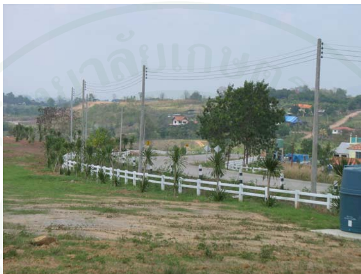
ภาพที่ 3 ถนนเข้าสู่กิจกรรมแหล่งท่องเที่ยว

อำเภอวังน้ำเขียว ได้พบเฟิร์นชนิดหนึ่งซึ่งจะขึ้นเฉพาะบริเวณพื้นที่ที่มีโอโซนในระดับสูงเท่านั้น จึงเป็นที่มาของคำกล่าวอ้างที่มีผู้กล่าวถึงอากาศที่บริสุทธิ์ของวังน้ำเขียว ฤดูหนาวของวังน้ำเขียว เริ่มต้นประมาณเดือน