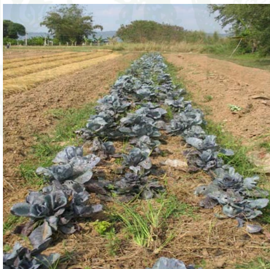
ภาพที่ 11 แปลงปลูกกะหล่ำปลีสีม่วง

ส่วนจำนวนแรงงานในครอบครัวที่มีอายุตั้งแต่ 15 ปีขึ้นไป พบว่า เกษตรกร ร้อยละ 50.8 มีแรงงานในครัวเรือนระหว่าง 3 – 4 คน รองลงมาร้อยละ 36.8 มีแรงงานในครัวเรือนระหว่าง 1 – 2 คน โดยมีจำนวนแรงงานในครัวเรือนสูงสุด 5 คน ต่ำสุด 1 คน เฉลี่ย 2.67 คน โดยสมาชิกในครัวเรือนดังกล่าวได้มีการทำงานคือ เกษตรกรร้อยละ 49.1 สมาชิกในครัวเรือนให้บริการที่พัก (โฮมสเตย์) แก่นักท่องเที่ยว รองลงมาร้อยละ 38.6 รับจ้างทั่วไปตามการจ้างงานของนายจ้างและทำโฮมสเตย์ เป็นรายได้เสริม ร้อยละ 24.6 ดูแลกิจการต่าง ๆ ภายในสวน ควบคุมดูแลการทำงานของคณงาน ร้อยละ 19.3 ปลุกผักปลอดสารพิษ พืชผักเมืองหนาว ปลุกแต่ง เพาะเห็ด ร้อยละ 15.8 ปลุกผักใส่ปุ๋ย พรวนดิน และต้อนรับนักท่องเที่ยว และทำความสะอาดและดูแลความปลอดภัย จำนวนเท่ากันทั้ง 4 ประเด็น ร้อยละ 14.0 เก็บข้อมูลเห็ด บรรยายให้นักท่องเที่ยวฟัง ร้อยละ 12.3 ช่วยงานด้านเอกสารและเตรียมงานอยู่ที่บ้าน ร้อยละ 10.5 ช่วยกันดูแลไร่อู่นุ่ บริหารจัดการและควบคุมแปรรูปผลิตภัณฑ์อู่นุ่ ปลุกผักรับประทานในครัวเรือนและขาย แนะนำแหล่งท่องเที่ยวในพื้นที่และความรู้ให้นักท่องเที่ยว ร้อยละ 8.8 ขายของชำ ร้อยละ 7.0 ดูแลด้านการฝึกอบรม และเตรียมเครื่องมือสำหรับผู้ฝึกอบรม และทำไร่มันสำปะหลังและข้าวโพด จำนวนเท่ากันทั้ง 2 ประเด็น ร้อยละ 5.3 ตกแต่งพื้นที่เพื่อให้บริการโฮมสเตย์แก่นักท่องเที่ยว และร้อยละ 3.5 ทำงานอยู่ในจังหวัดนครราชสีมา ซึ่งจะเห็นได้ว่าสมาชิกในครัวเรือนเกษตรกรส่วนใหญ่ได้ช่วยหารายได้และทำงานให้กับครอบครัว