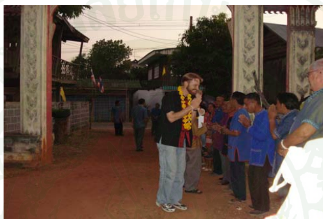
ภาพที่ 8 พิธีต้อนรับนักท่องเที่ยวผู้มาเยือน

ก. ชาวบ้านที่มาต้อนรับจะแต่งชุดไทย ยืนเข้าแถวต้อนรับที่หน้าประตูวัด มอบดอกไม้สดหรือมาลัยที่เตรียมไว้ให้นักท่องเที่ยว ผู้ใหญ่บ้านกล่าวต้อนรับเล่าถึงประวัติ หมู่บ้าน การปฏิบัติตนขณะพักอาศัยอยู่ในหมู่บ้านและแนะนำบุคลากรฝ่ายต่างๆ ทั้งชาวบ้าน อาจารย์ใหญ่ เจ้าหน้าที่อุทยานภูผาวิ้ว นัดหมายกำหนดการ เวลาที่จะทำกิจกรรม จัดทะเบียน บ้านพัก หลังจากนั้นเจ้าของบ้านพักก็จะนำนักท่องเที่ยวแยกย้ายกันไปตามบ้านพักที่จัดไว้ และไปทำกิจกรรมต่างๆ ตามความสนใจ