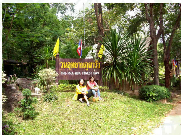
ภาพที่ 6 วนอุทยานภูผาวัว