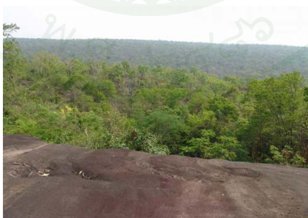
ภาพที่ 7 ผานางแอ่น