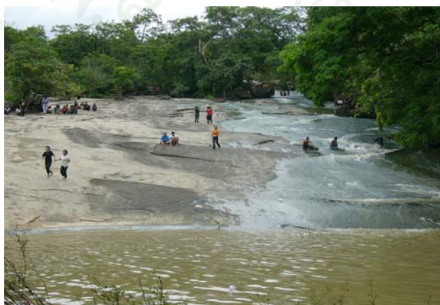
ภาพที่ 4 น้ำตกตาดยาว บ้านโคกโก่ง

ในหมู่บ้านมีแหล่งท่องเที่ยวทางธรรมชาติที่น่าสนใจ คือ ภูผาวัว ภูมะตูม ภูกอง ดานโหลง กรงนกทา เต่าฮาง ภูเขา ที่ชมวิว ผานางอ่อน ผานางคอย น้ำตกตาดสูง ตาดยาว ลานสไลเดอร์ธรรมชาติและสมุนไพร นอกจากนี้แหล่งท่องเที่ยวทางธรรมชาติแล้ว นักท่องเที่ยวยังสามารถเที่ยวชมหมู่บ้าน ลักษณะบ้านผู้ไทย วิถีชีวิต พิธีกรรม กิจกรรมทางการเกษตร และกิจกรรมต่างๆ เช่น การทอผ้า การเย็บผ้าด้วยมือ จักสาน จับปลา ทำนา การไถนา การดำนา การเกี่ยวข้าว เลี้ยงสัตว์ เก็บเห็ด หวาย ผักหวาน แหยไข่มดแดง จับแมลง กบ เขียด และการประกอบอาหารพื้นเมือง หรือของเล่นพื้นบ้าน เช่น ปี่ซังข้าว เป็นต้น กิจกรรมเหล่านี้เป็นกิจกรรมตามฤดูกาล นอกจากนี้ยังสามารถหาซื้อของฝากได้ เช่น ผ้าฝ้ายพื้นเมือง ผ้าฝ้ายลายขิด ผ้าฝ้ายพื้นเมืองย้อมสีธรรมชาติหรือผ้าฝ้ายสำเร็จรูปเย็บมือ เป็นต้น (องค์การบริหารส่วนตำบลกุดหว้า, 2552)