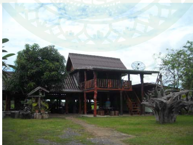
ภาพที่ 9 บ้านพักแบบโฮมสเตย์ของชุมชนบ้านโคกโก่ง