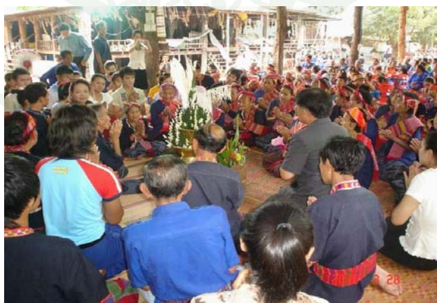
ภาพที่ 2 พิธีบายศรีสู่ขวัญแต่ผู้มาเยือน ด้วยฝ้ายมงคลผูกแขน

ประเพณีท้องถิ่นของชุมชนโคกโก่งเหมือนประเพณีของชาวไทยอีสาน กล่าวคือ การปฏิบัติตามฮีตสิบสอง คองสิบสี่ นอกจากนี้ยังมีงานประเพณีน้ำตกตาดสูง ซึ่งจะจัดขึ้นในวันเสาร์แรกของเดือนตุลาคมของทุกปี มีการทำบุญ เช่น พิธีเซ่นไหว้เจ้าปู่ การแสดงศิลปวัฒนธรรมผู้ไทย ประเพณีเลี้ยงหอมเหล็กข์ ซึ่งเป็นประเพณีที่ชาวบ้านร่วมกันจัดขึ้นเพื่อบูชาเจ้านายที่เคยปกครองเมืองไทย ช่วยปกป้องรักษาบ้านเมืองให้อยู่เย็นเป็นสุข โดยจะจัดพิธีเลี้ยงหอมเหล็กข์ ปีละครั้ง ในวันขึ้น 1 ค่ำ เดือน 6 ถึงสิ้นเดือน 7 ประเพณีลงช่วง (ลงช่วง หมายถึง ฤดูหนาวในช่วงกลางคืนชาวบ้านจะมานั่งรวมกันบริเวณลานบ้าน บ้างปั้นไผ่ บ้างปั้นฝ้าย ถ้าคืนไหนจะลงช่วงสาว ๆ จะพากันออกไปหาฝ้าย เรียกว่า ไปเอาหิ้ว หลังอาหารเย็นก็จะมานั่งรอบกองไฟ ทำงานไปคุยไป ช่วงนี้หนุ่ม ๆ ก็ถือโอกาสมาเกี้ยวพาราสี เล่นดนตรีโต้ตอบกันเป็นกลอนพื้นบ้าน ที่เรียกว่า ผญา) นอกจากนี้ยังมีพิธีจำหวนวัว จำหวนควาย สู้ขวัญข้าว พิธีแฮกนา (เดือน 6 หรือ เดือน 7)