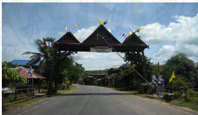
ภาพที่ 1 ชุมประตูลู่ชุมชนบ้านโคกโก่ง