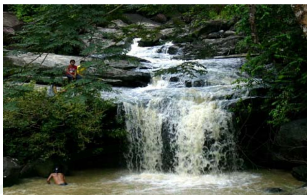
ภาพที่ 5 น้ำตกตาดสูง บ้านโคกโก่ง