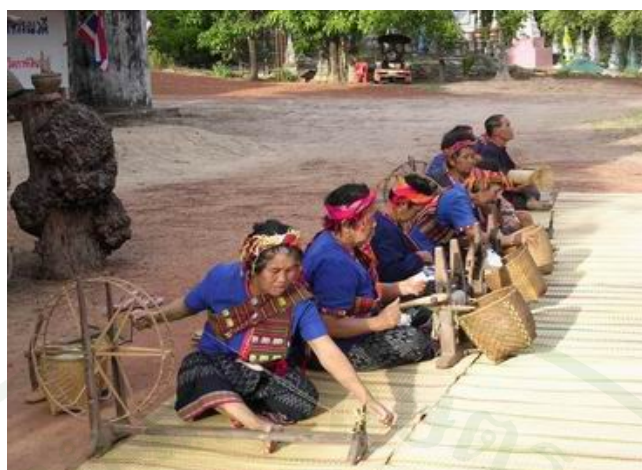
ภาพที่ 3 สถิติวิธีการได้มาเป็นผ้าเย็บมือ