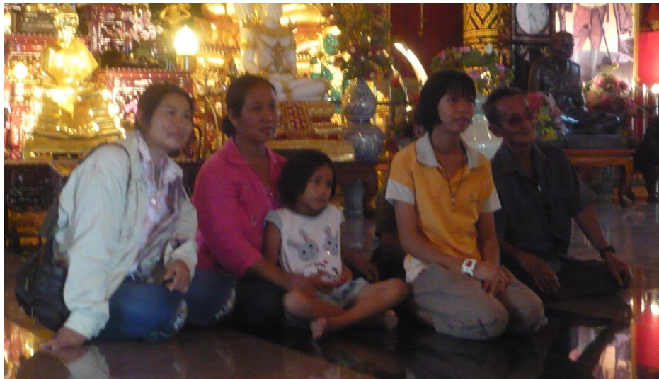
นักท่องเที่ยวจากจังหวัดสกลนคร