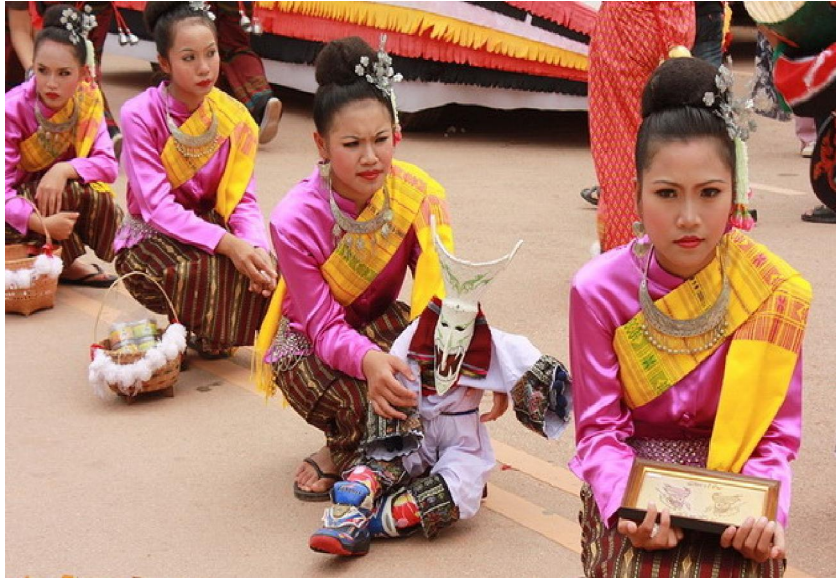
ขบวนนางรำ