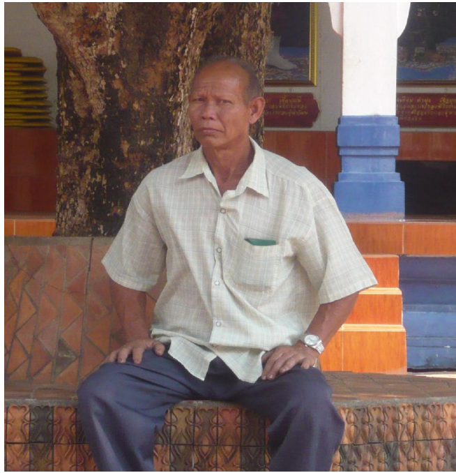
นักท่องเที่ยวจากจังหวัดหนองคาย