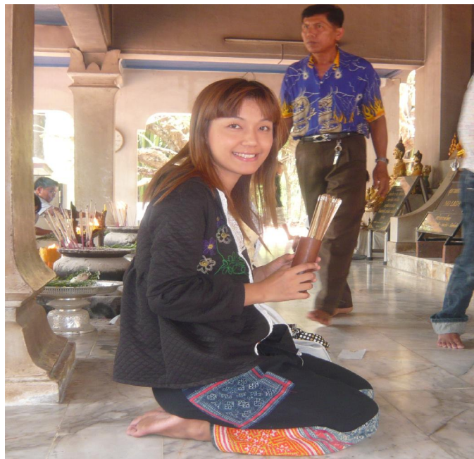
นักท่องเที่ยวจากกรุงเทพฯ