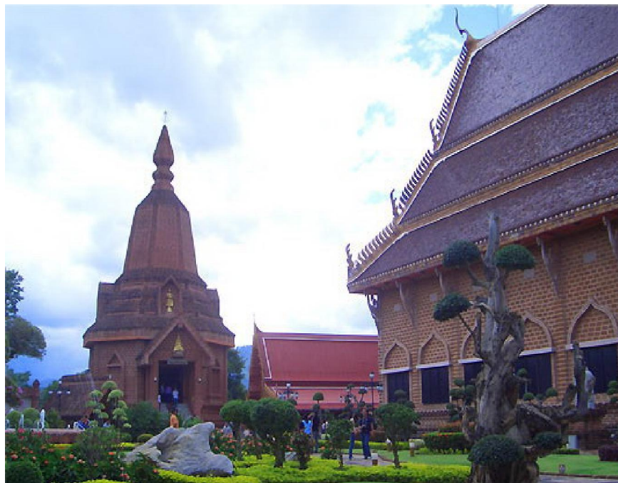
วัดเนรมิตวิปัสสนา