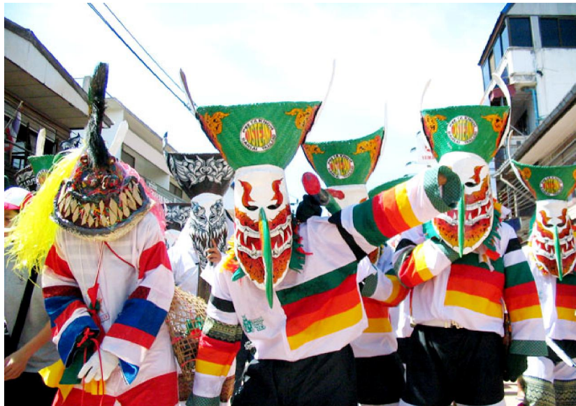
ผีตาโขนเล็ก