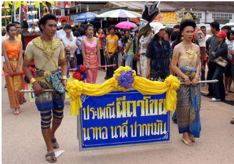
ประเพณีแห่ผีตาโขน