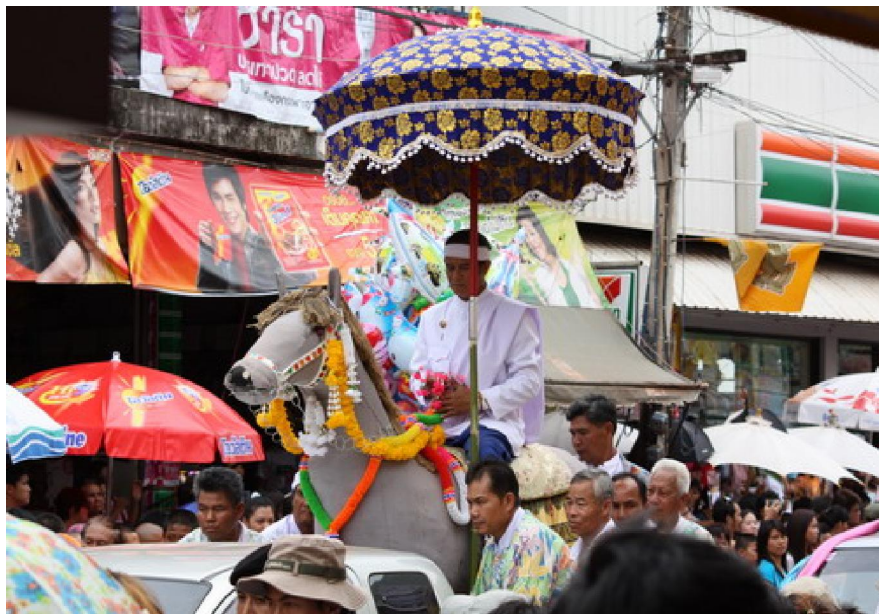
ขบวนแห่เจ้าพ่อกวน