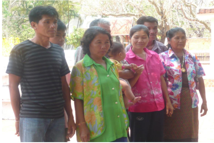
กลุ่มนักท่องเที่ยวจากจังหวัดเพชรบูรณ์