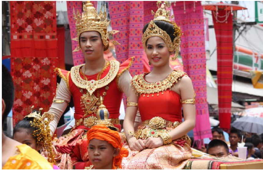
ขบวนแห่พระเวสสันดร- พระนางมัทรี