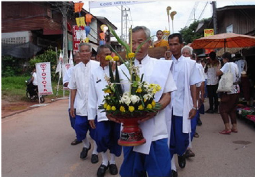
ขบวนแห่เจ้าพ่อกวน