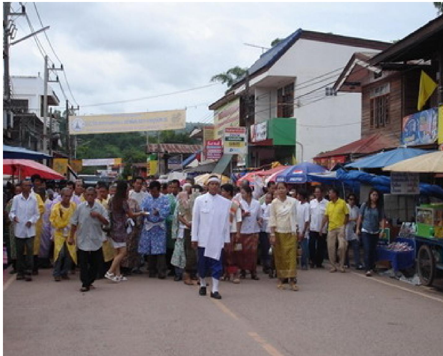
ขบวนแห่ศีดาโจน