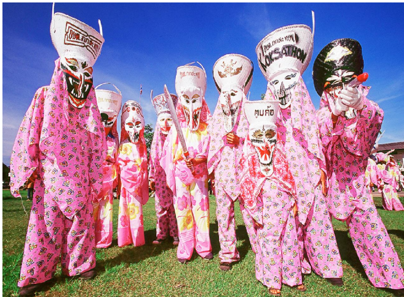
ศิตาโขนรูปแบบต่างๆ