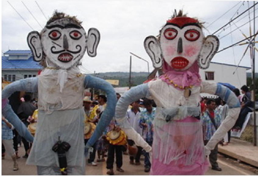
ผีตาโขนใหญ่