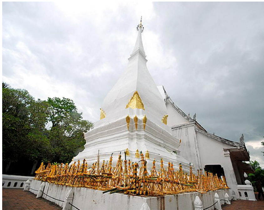
พระธาตุศรีสองรัก