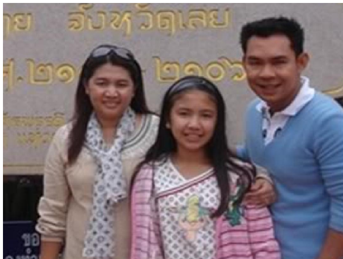
นักท่องเที่ยวจากจังหวัดนนทบุรี