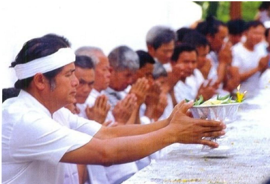
เจ้าพ่อกวน สักการะพระธาตุศรีสองรัก