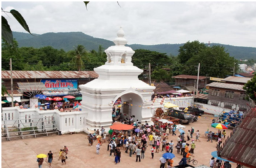
วัดโพธิ์ชัย