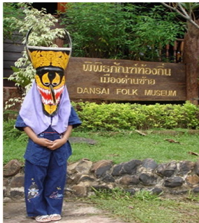
พิพิธภัณฑ์ฝึตโกน