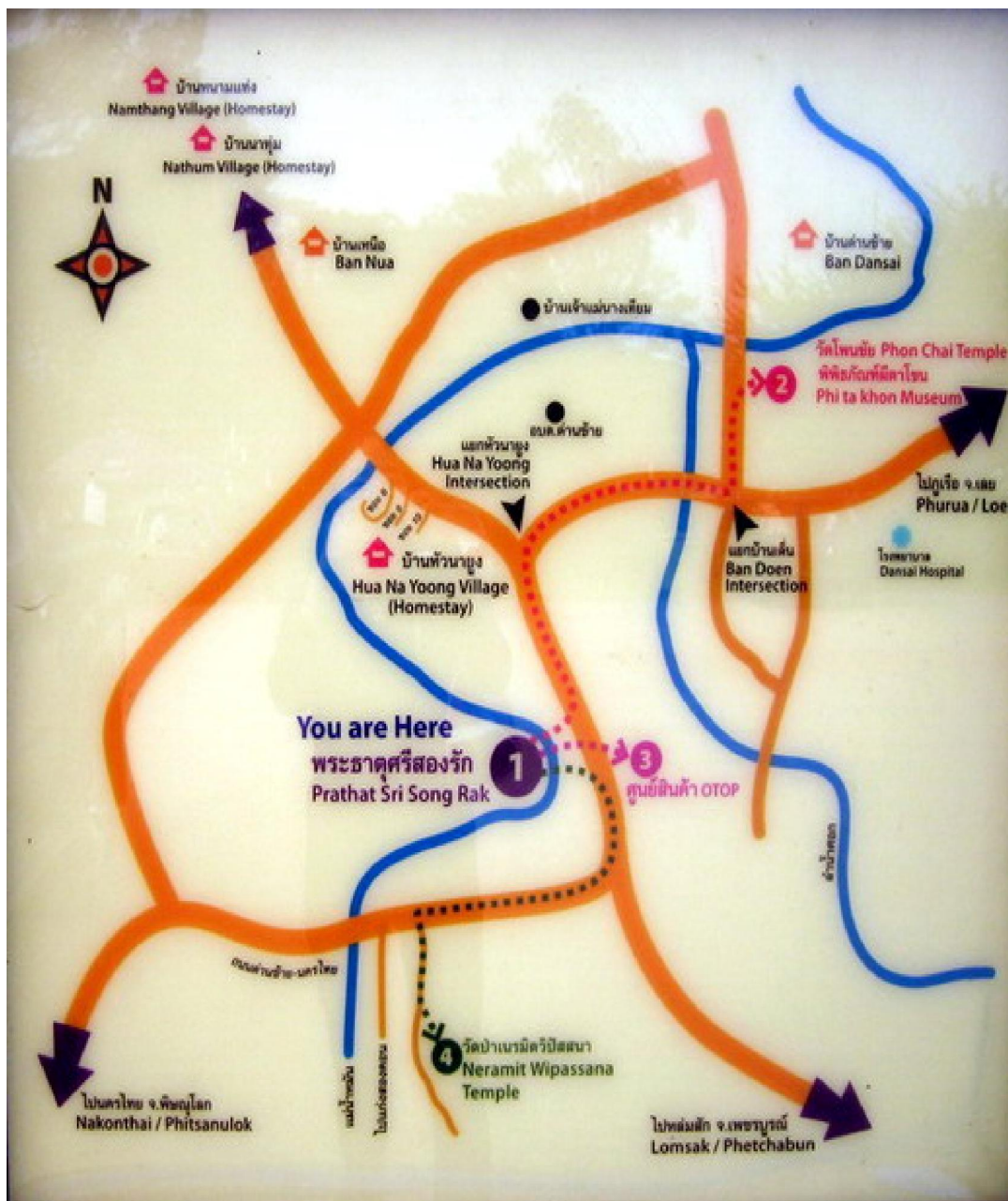
ภาพประกอบที่ 2 แผนที่แสดงเส้นทางของแหล่งท่องเที่ยวในบ้านด่านซ้าย อำเภอด่านซ้าย จังหวัดเลย