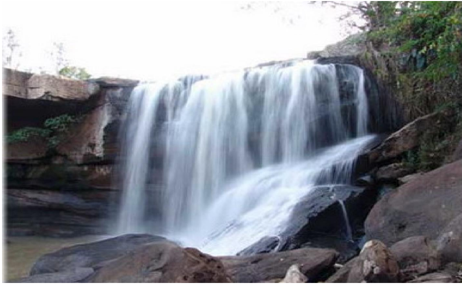
น้ำตกแก่งสองคอน