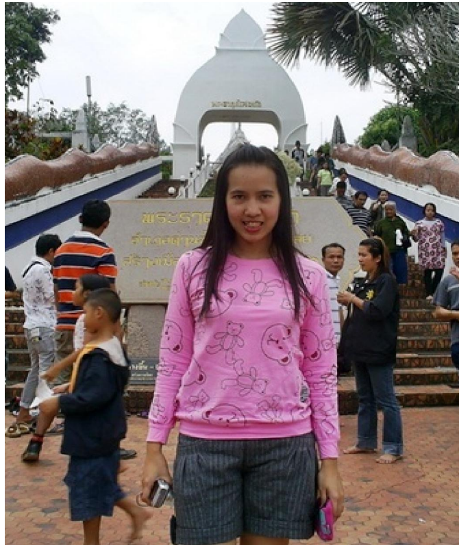
นักท่องเที่ยวกจากจังหวัดอุดรดิษฐ์