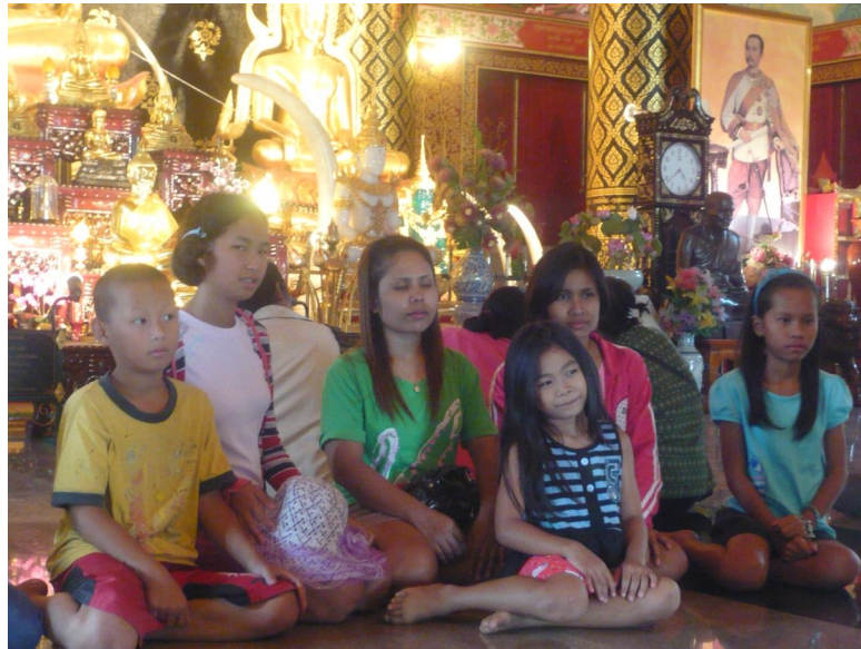
นักท่องเที่ยวจากจังหวัดตาก