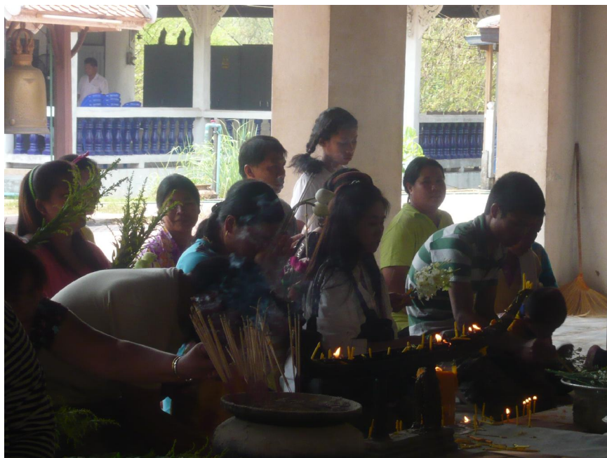
กลุ่มนักท่องเที่ยวมาสักการะพระธาตุศรีสองรัก