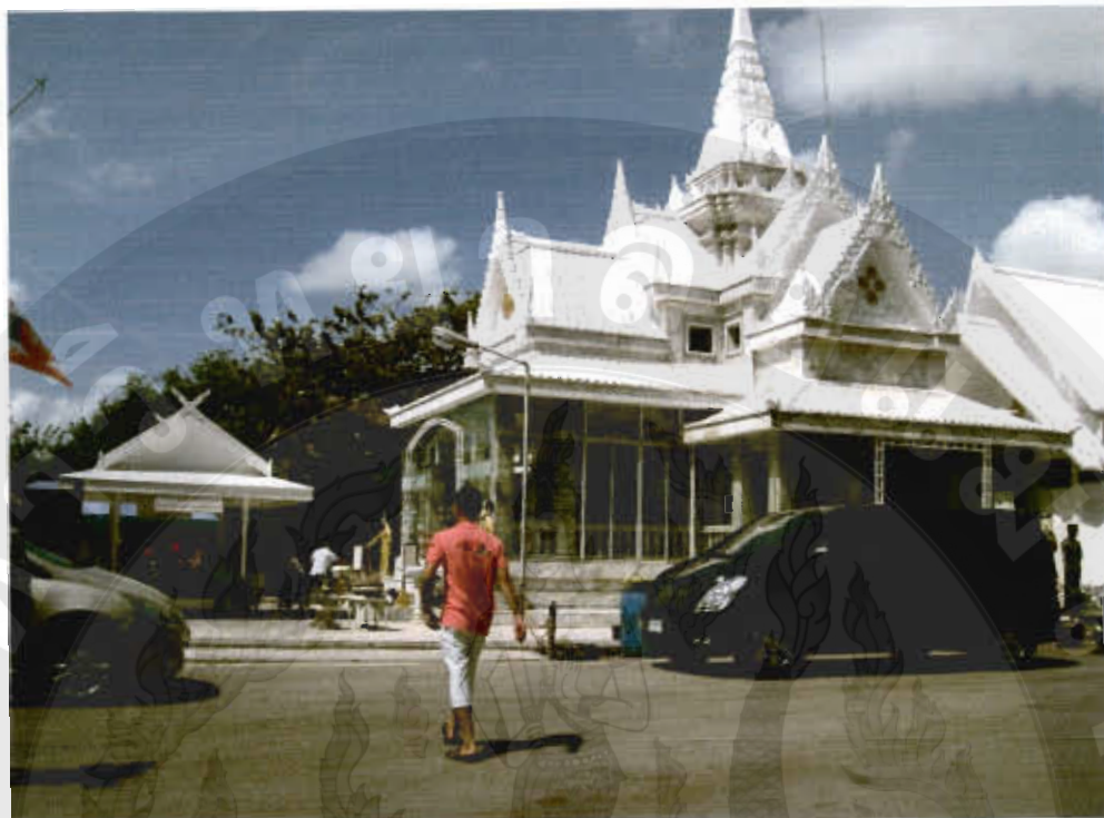
ทัศนียภาพหาดทรายรี,ศาลกรมหลวงชุมพรเขตอุดมศักดิ์