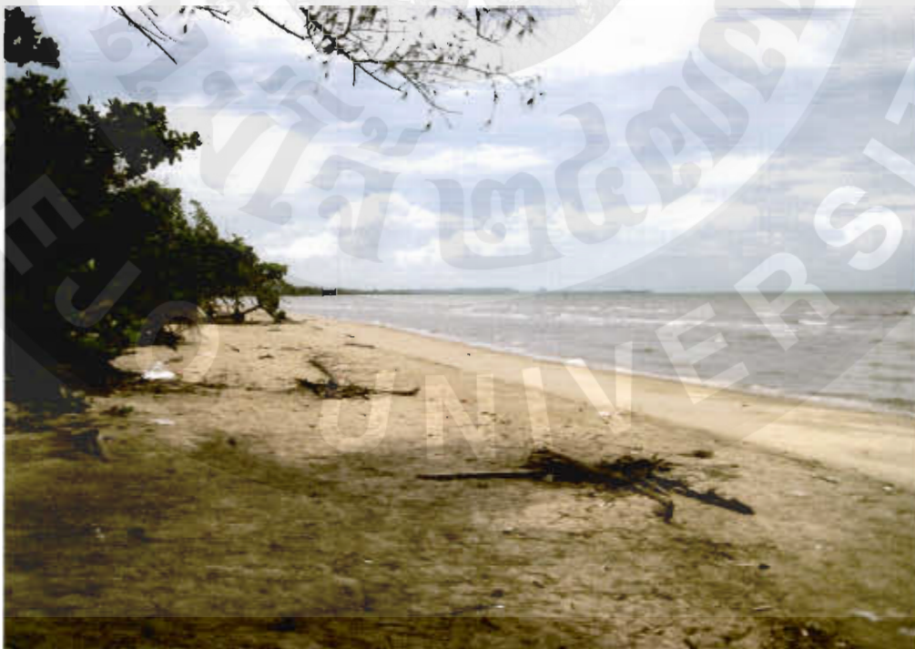
ทัศนียภาพอ่าวมะม่วง