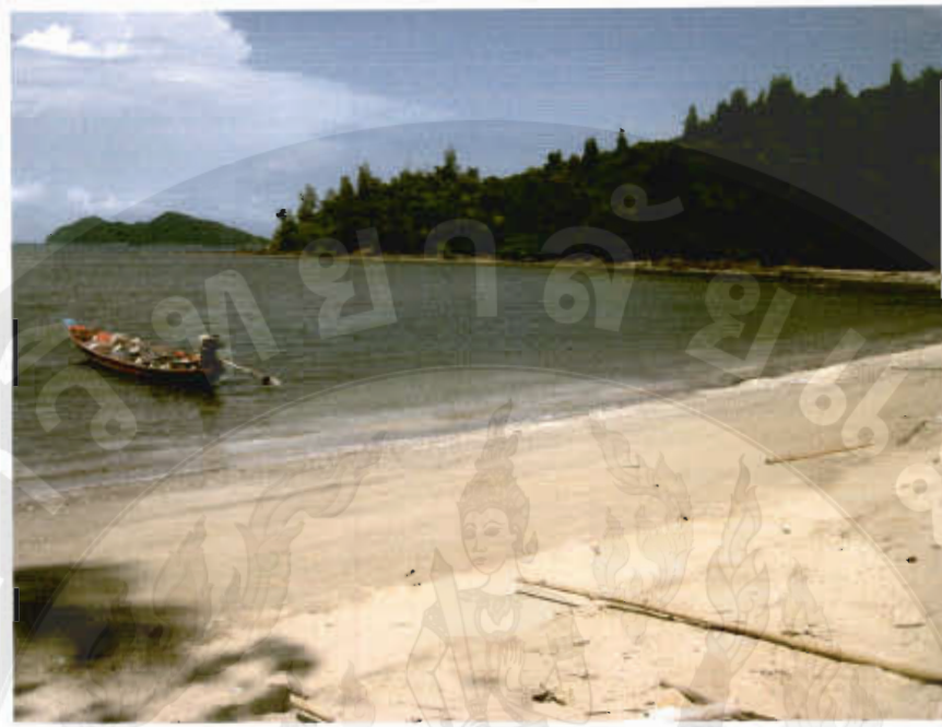
ทัศนียภาพอ่าวโดนด