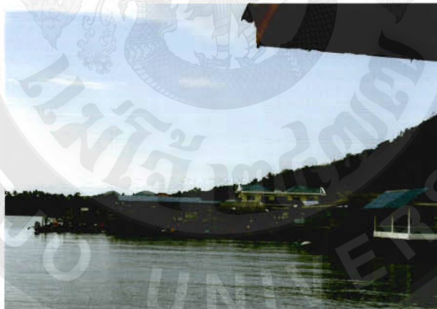
ทัศนียภาพบ้านท่องเที่ยวใหญ่