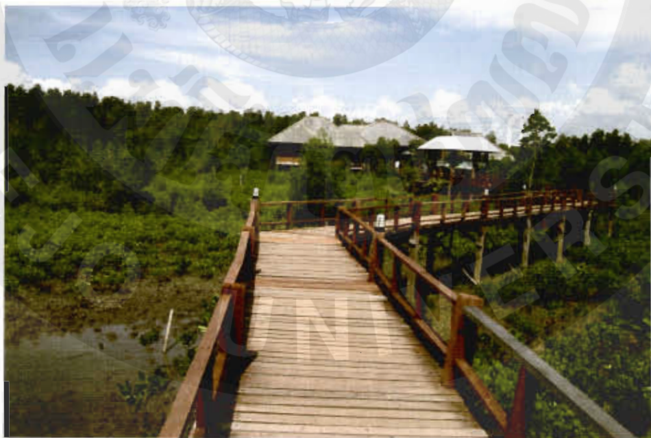
ทัศนียภาพอุทยานแห่งชาติหมู่เกาะชุมพร