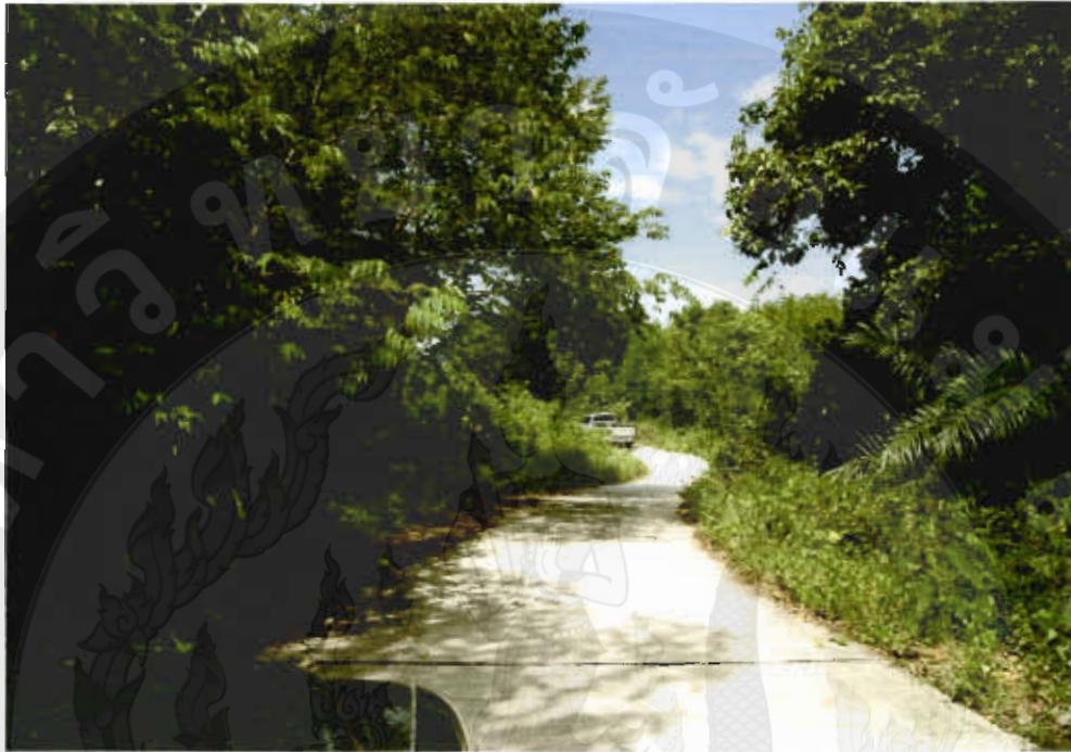
ทัศนียภาพเส้นทางเลียบทะเลอ่าวทุ่งคา-สวี