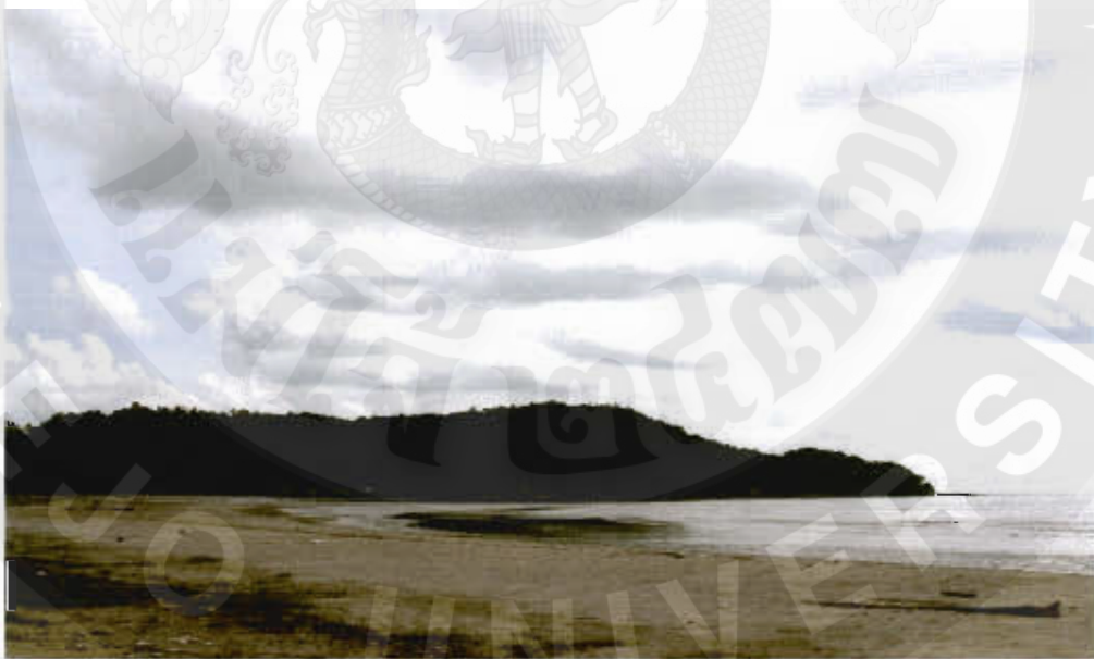
ทัศนียภาพอ่าวทองโจ