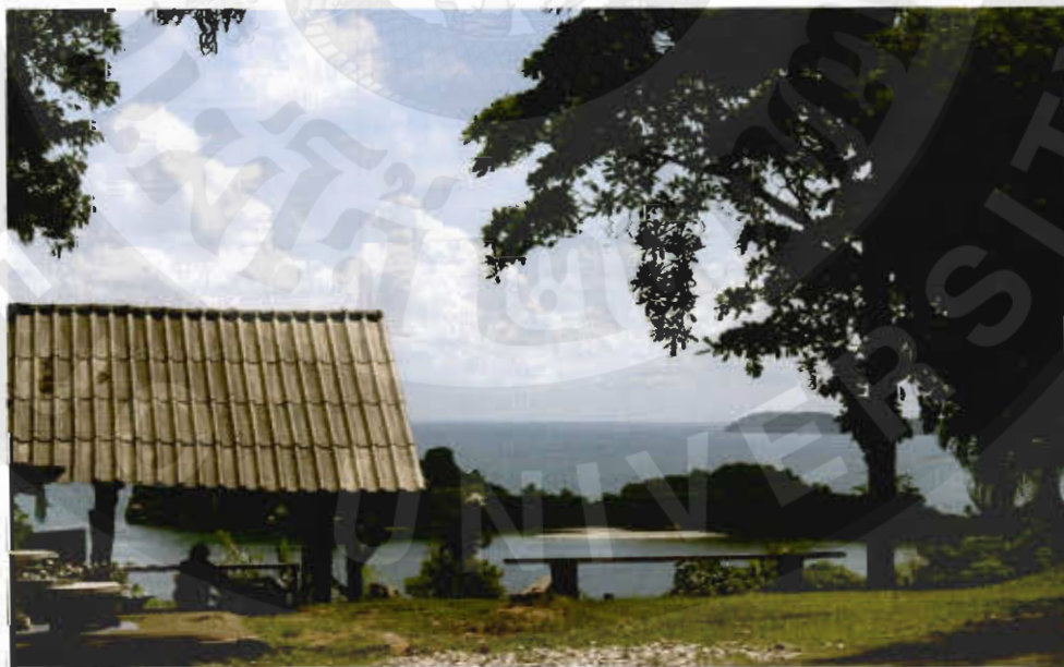
ทัศนียภาพศูนย์ศึกษาและวิจัยอุทยานแห่งชาติทางทะเลชุมพร(เขาเจ้าเมือง)