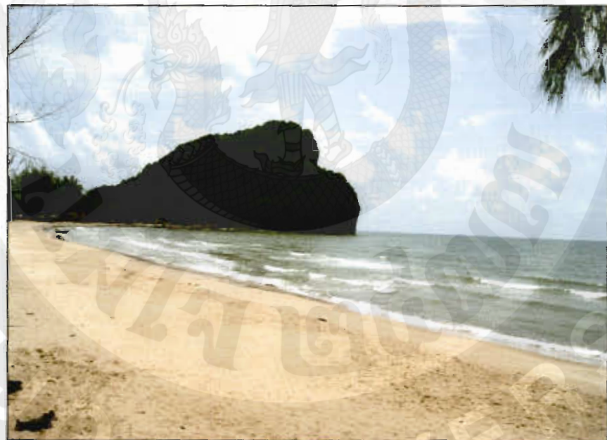
ทัศนียภาพหาดบางเบ็ด