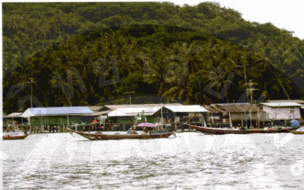
ทัศนียภาพเกาะพิทักษ์