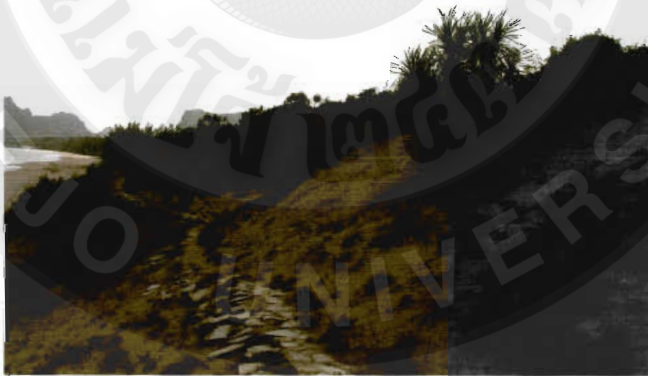
ทัศนียภาพเนินทรายงามจังหวัดชุมพร