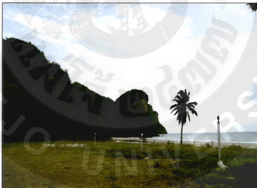
ทัศนียภาพหาดทุ่งยาง