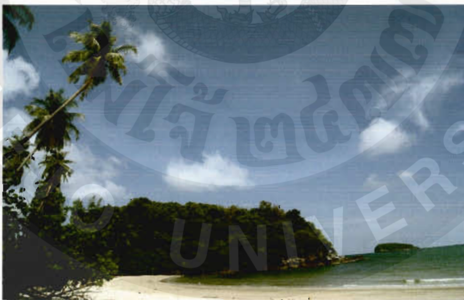
ทัศนียภาพอ่าวหลักกำ