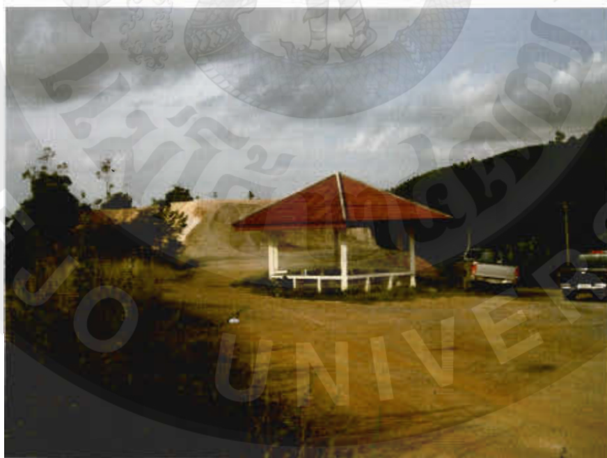
ทัศนียภาพจุดชมวิเวหาหัวถ่าน