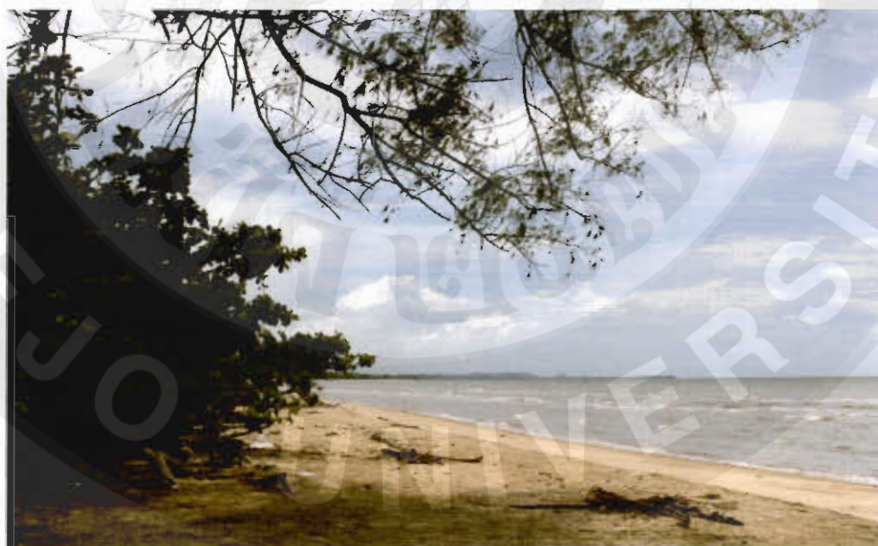
ทัศนียภาพหาดทะเลงาม