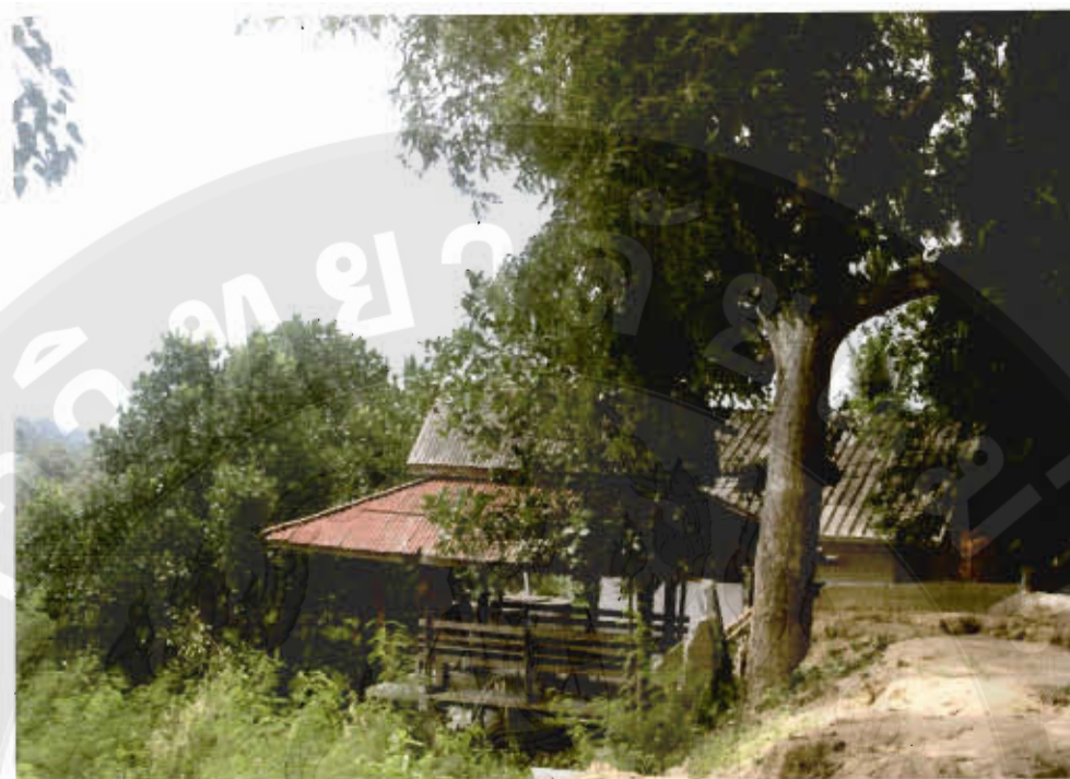
ทัศนียภาพเจดีย์เขาน้อย