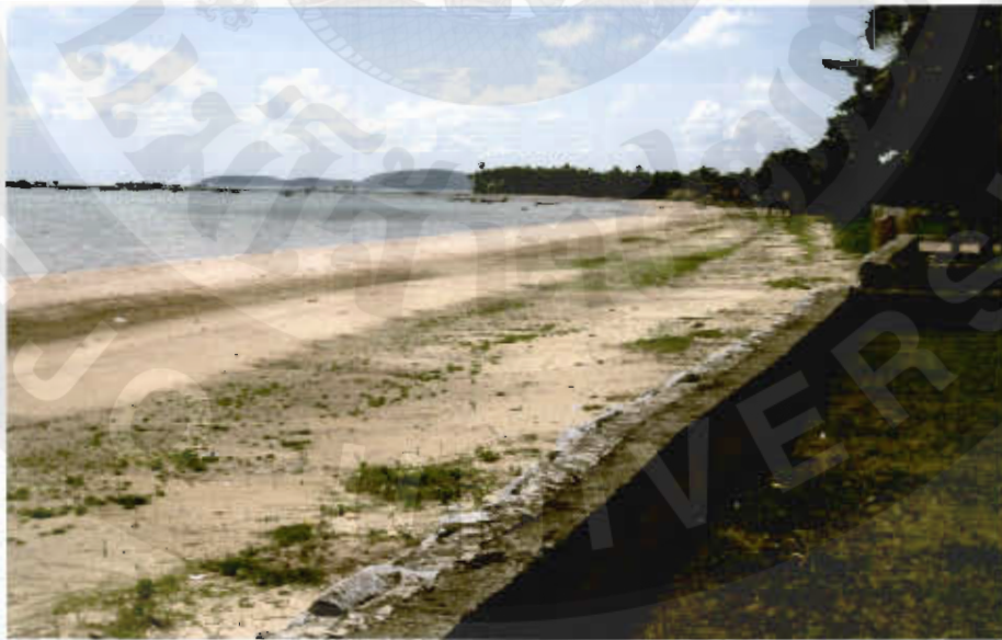
ทัศนียภาพหาดทรายครภาพ