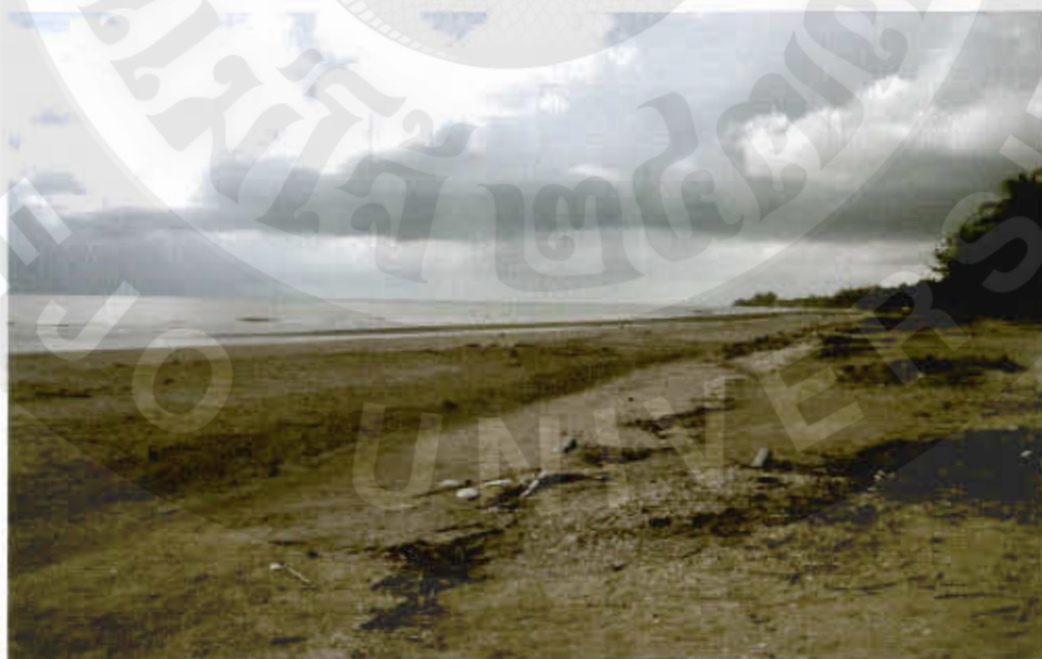
ทัศนียภาพหาดตะวันฉาย