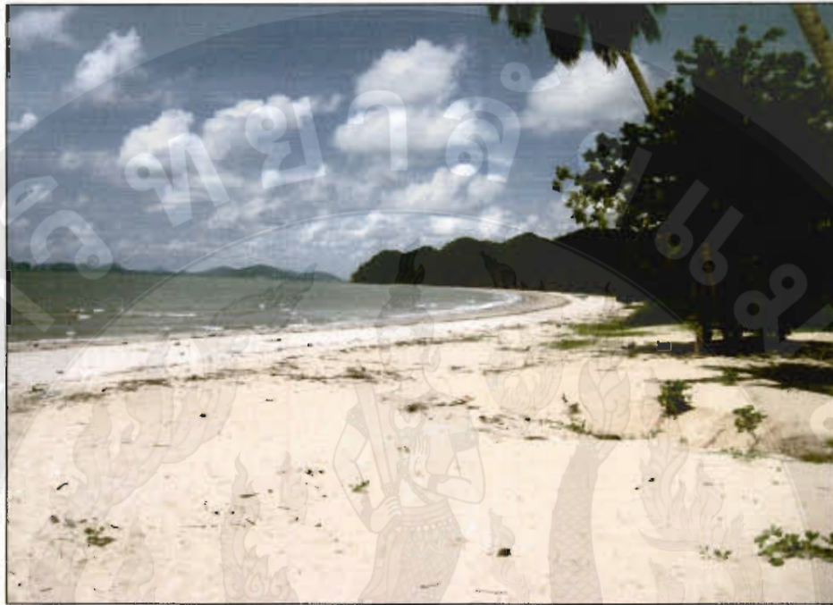
ทัศนียภาพอ่าวทุ่งมะขามใหญ่