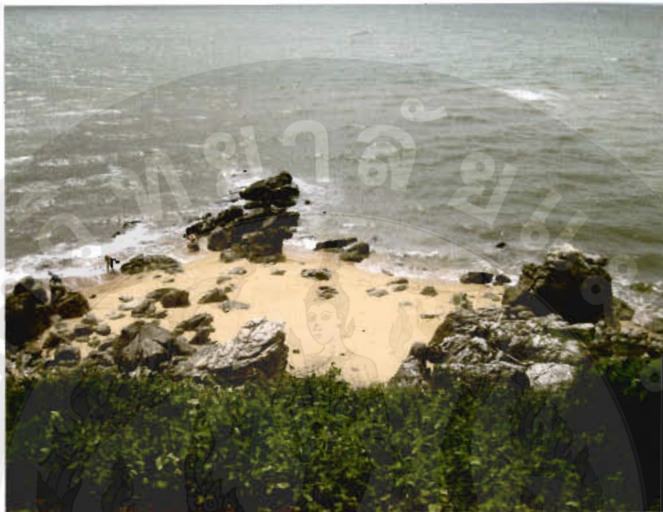
ทัศนียภาพหาดคอกเขา