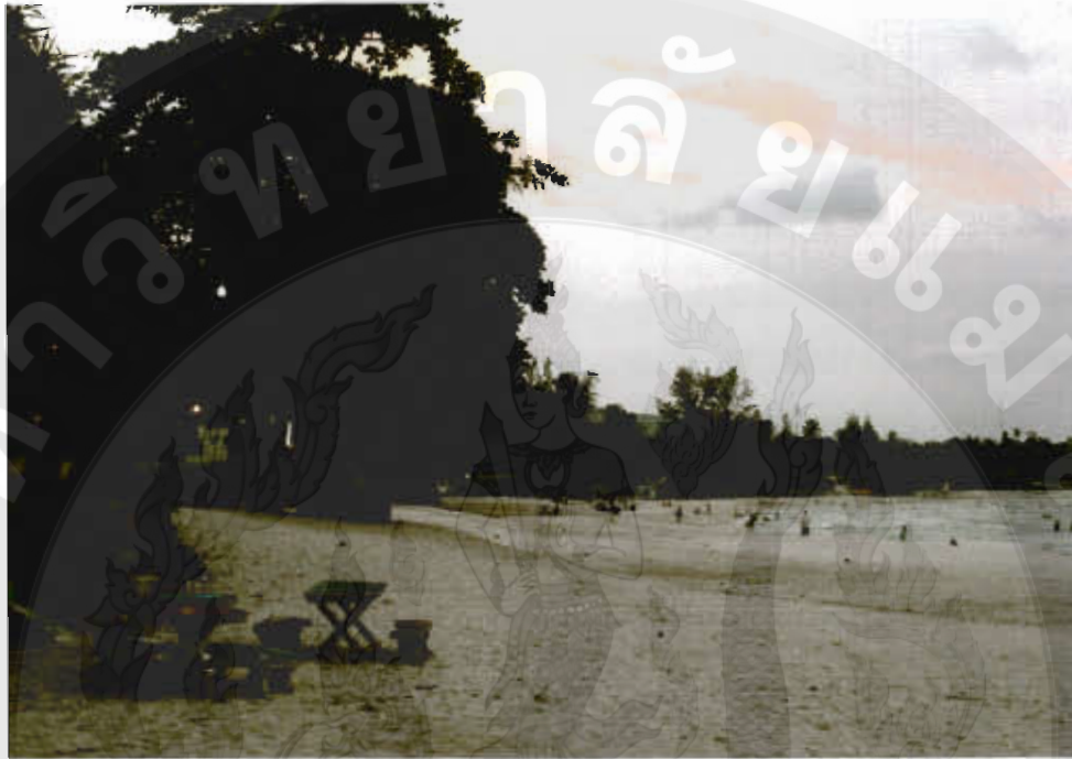
ทัศนียภาพหาดทุ่งวัวแล่น