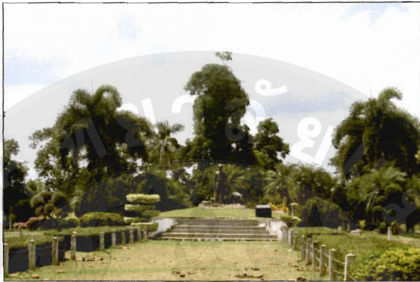
ทัศนียภาพสถานีวิจัยสิทธิพร กฤดากร