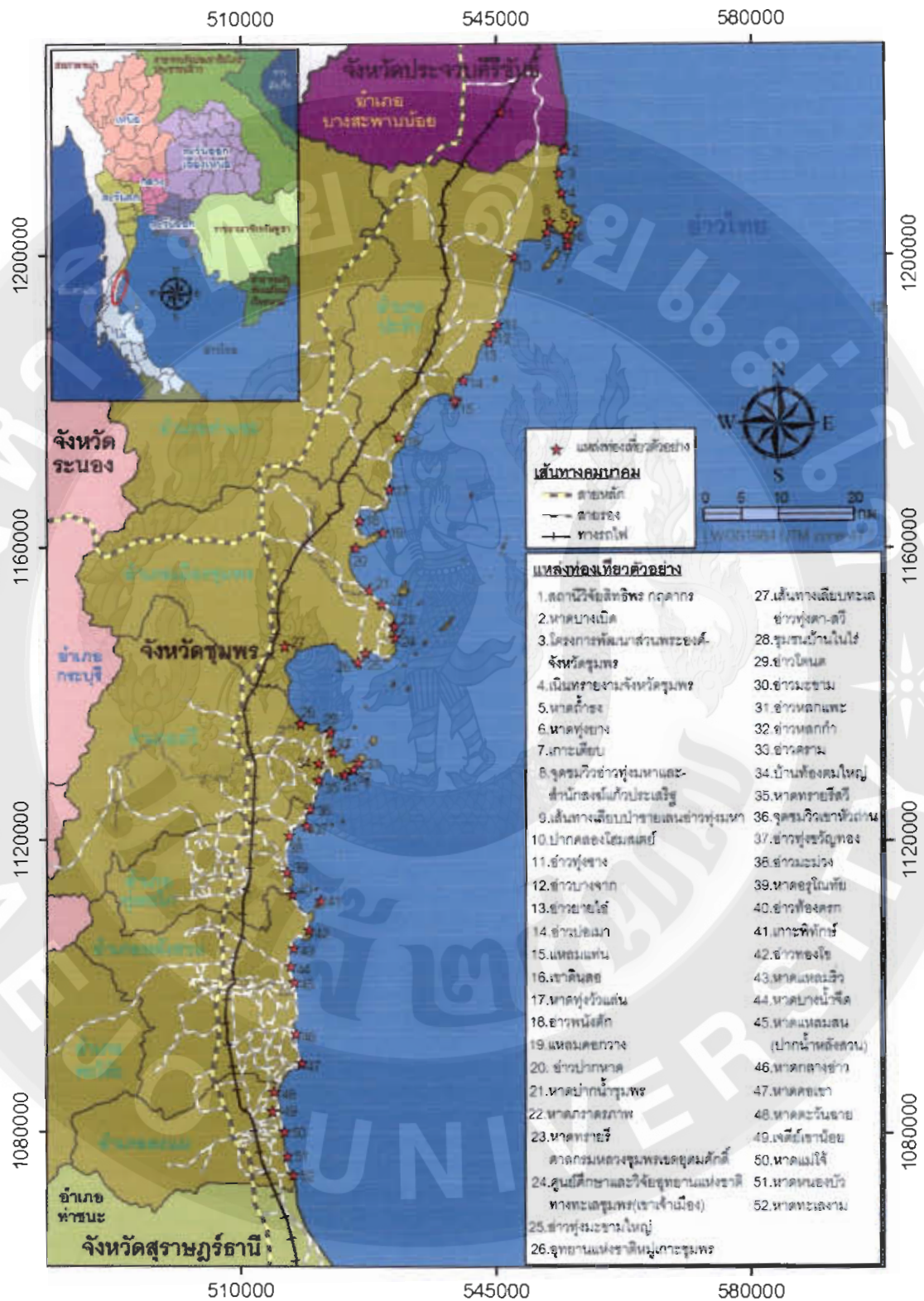
ภาพที่ 1 แหล่งท่องเที่ยวเส้นทางเลียบทะเลจังหวัดชุมพร