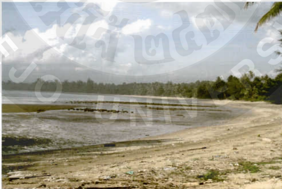
ทัศนียภาพอ่าวพั่งตัก