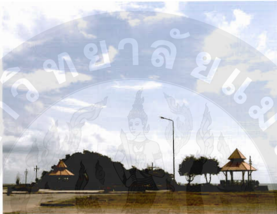
ทัศนียภาพหาดปากน้ำชุมพร