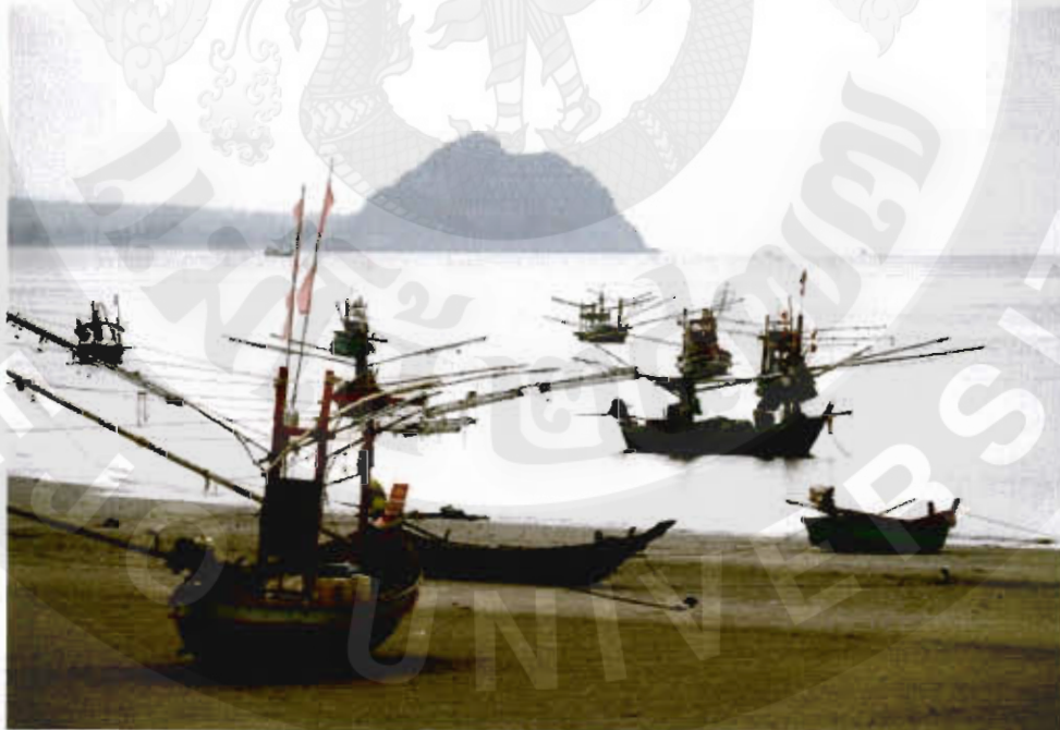
ทัศนียภาพปากคลองโฮมสเตย์