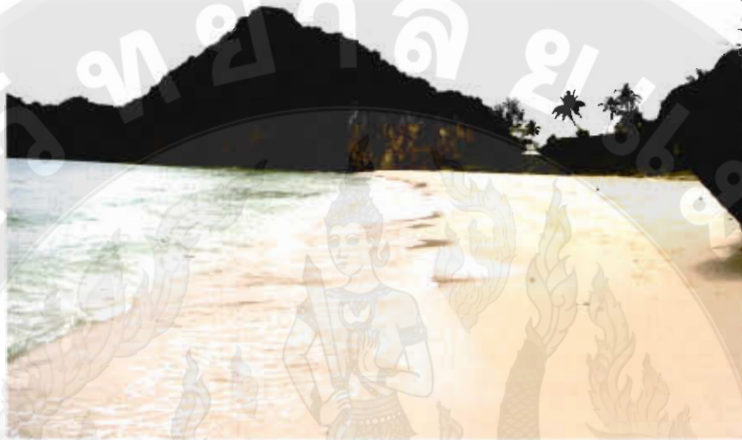
ทัศนียภาพอ่าวทุ่งช้าง