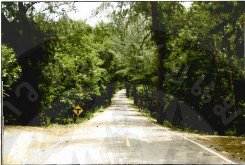
ทัศนียภาพโครงการพัฒนาส่วนพระองค์จังหวัดชุมพร