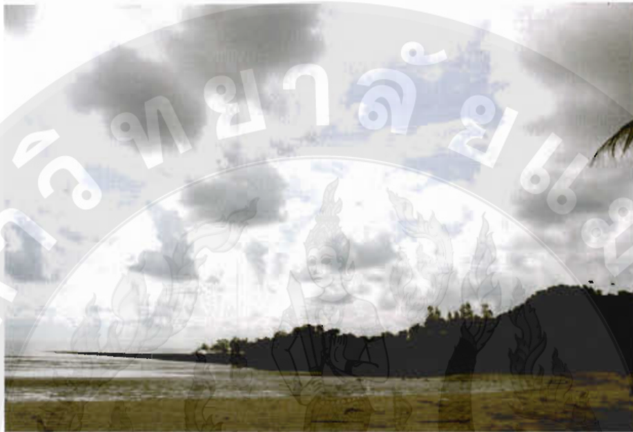
ทัศนียภาพหาดแหลมรีว