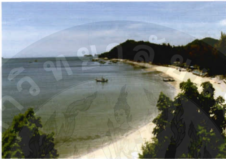
ทัศนียภาพหาดทรายรีสวี