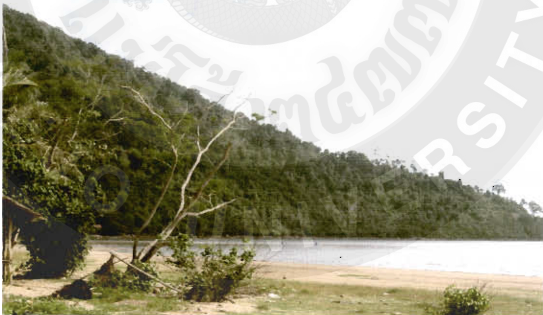
ทัศนียภาพอ่าวท้องครก