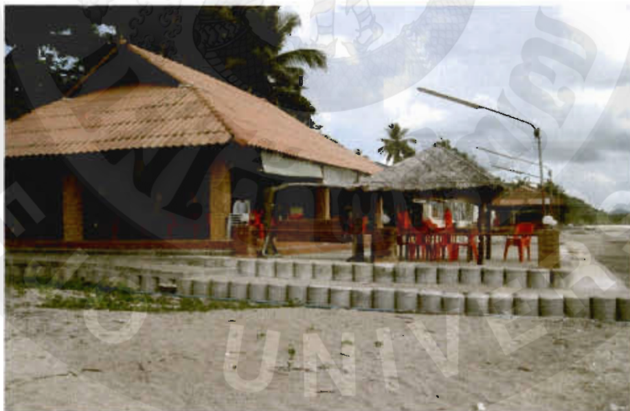
ทัศนียภาพหาดบางน้ำจืด