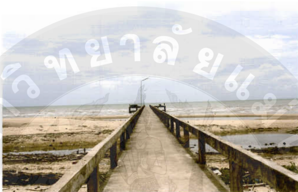
ทัศนียภาพหาดหนองบัว