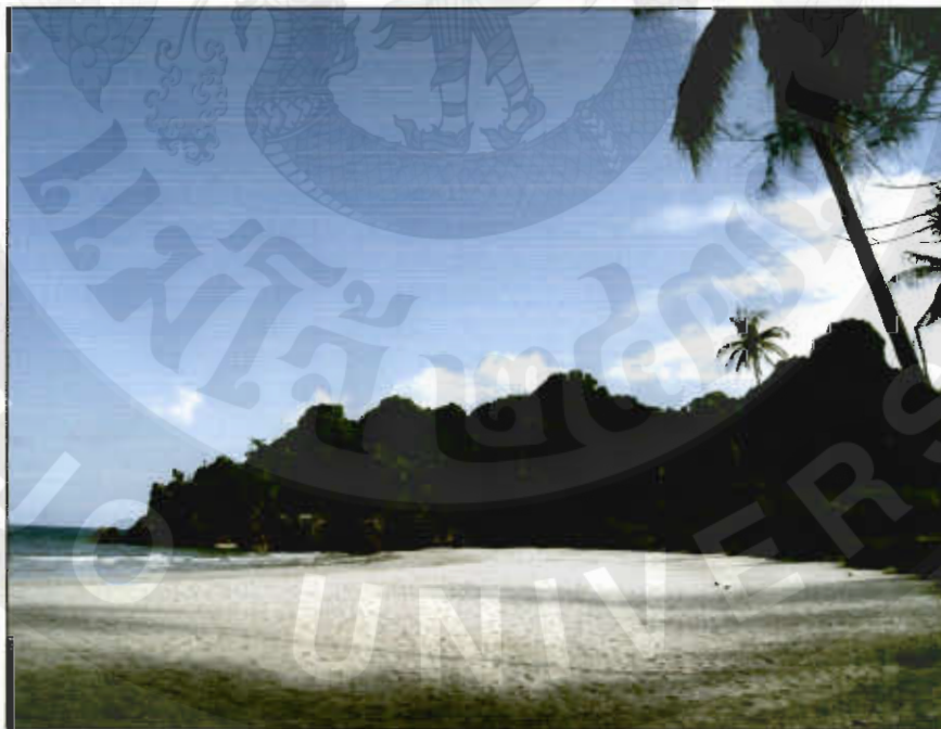
ทัศนียภาพอ่าวบางจาก