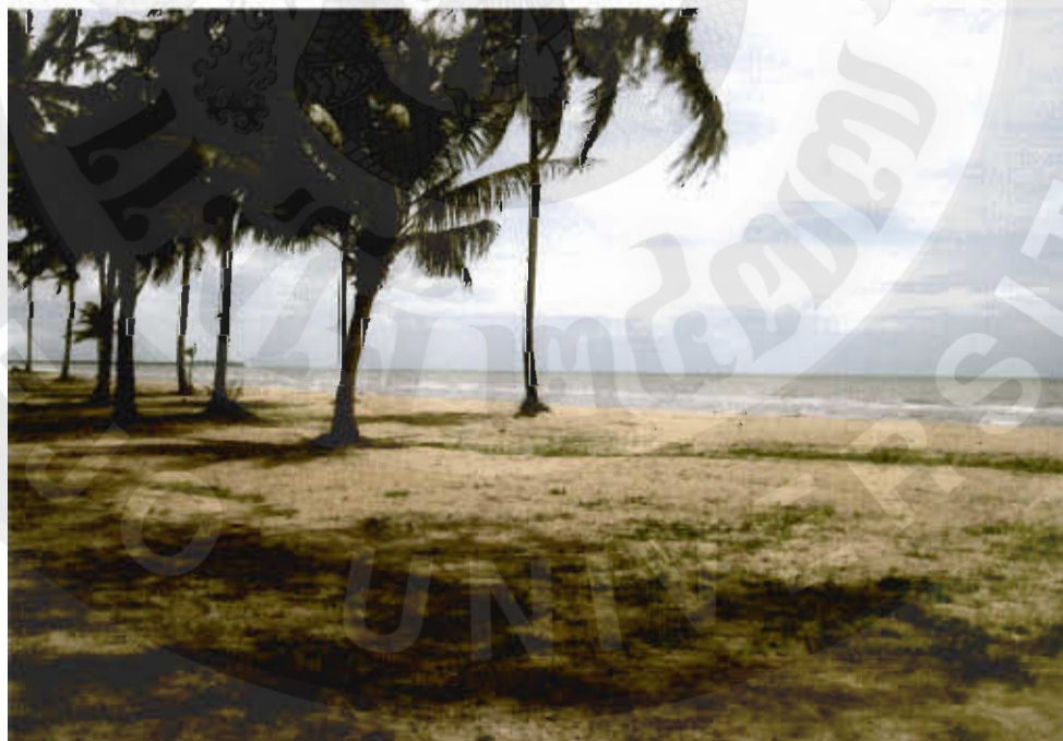
ทัศนียภาพหาดแม่โจ้