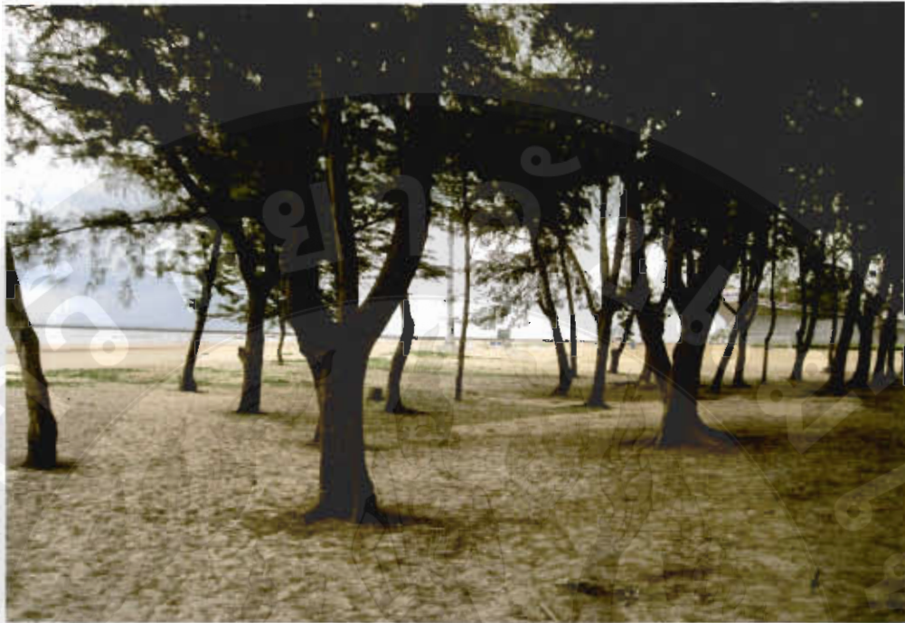
ทัศนียภาพหาดหาดแหลมสน(ปากน้ำหลังสวน)