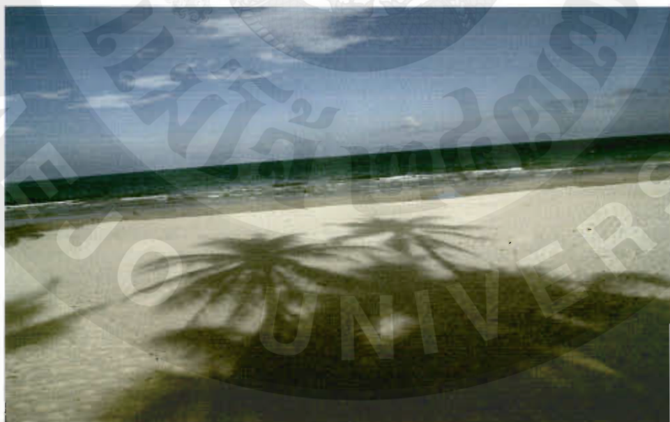
ทัศนียภาพอ่าวปากหาด