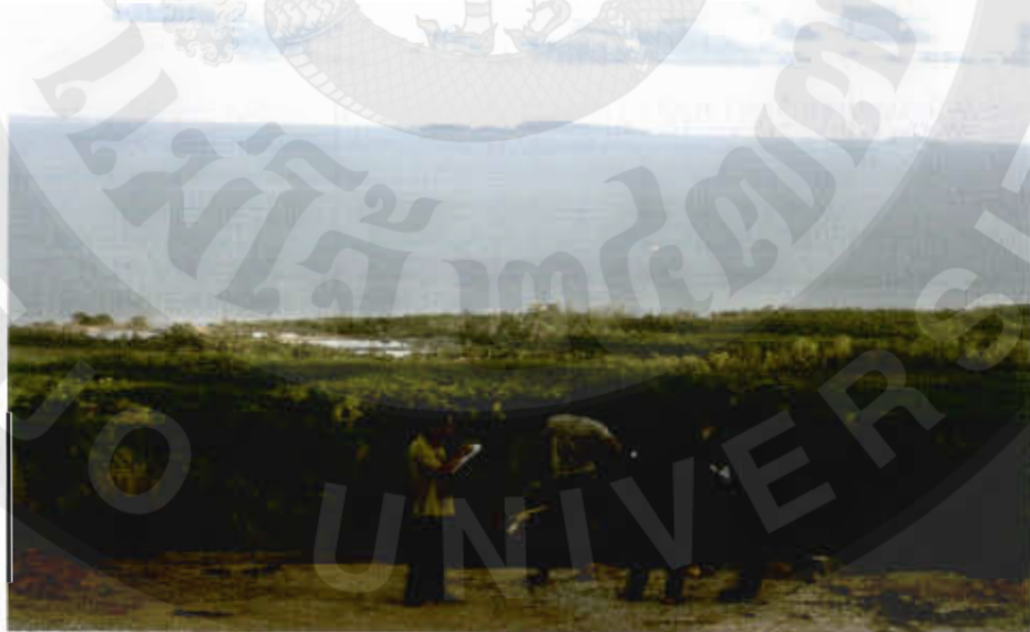
ทัศนียภาพเขาคินสอ