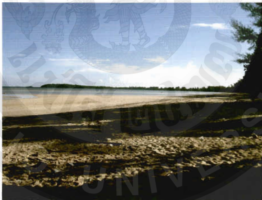
ทัศนียภาพอ่าวบ่อเมา