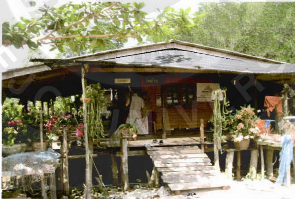
ทัศนียภาพชุมชนบ้านโนไฉ่