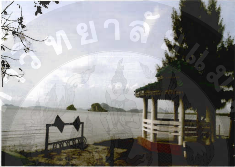
ทัศนียภาพอ่าวทุ่งขวัญทอง