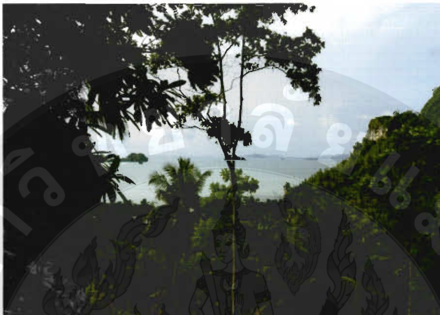
ทัศนียภาพอ่าวตราม