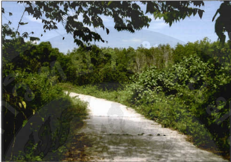
ทัศนียภาพเส้นทางเลียบป่าชายเลนอ่าวทุ่งมหา