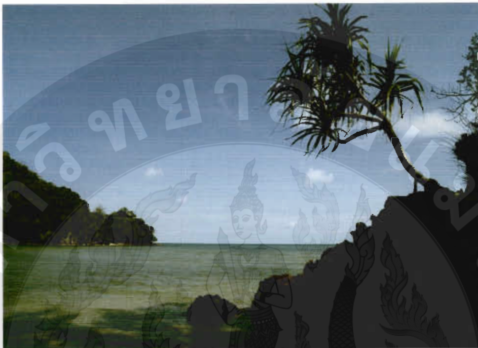
ทัศนียภาพอ่าวหลักแพะ