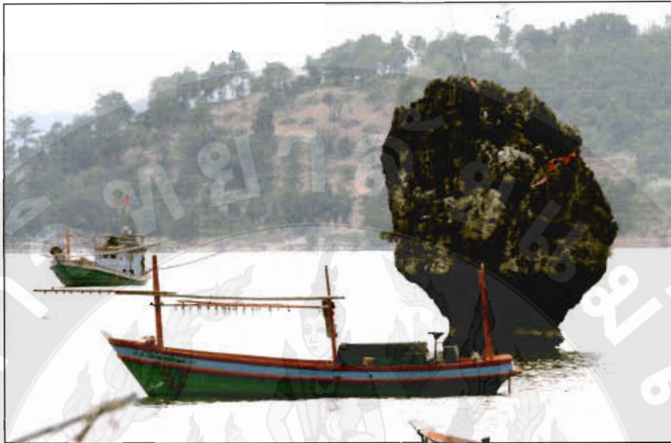
ทัศนียภาพเกาะเตียบ