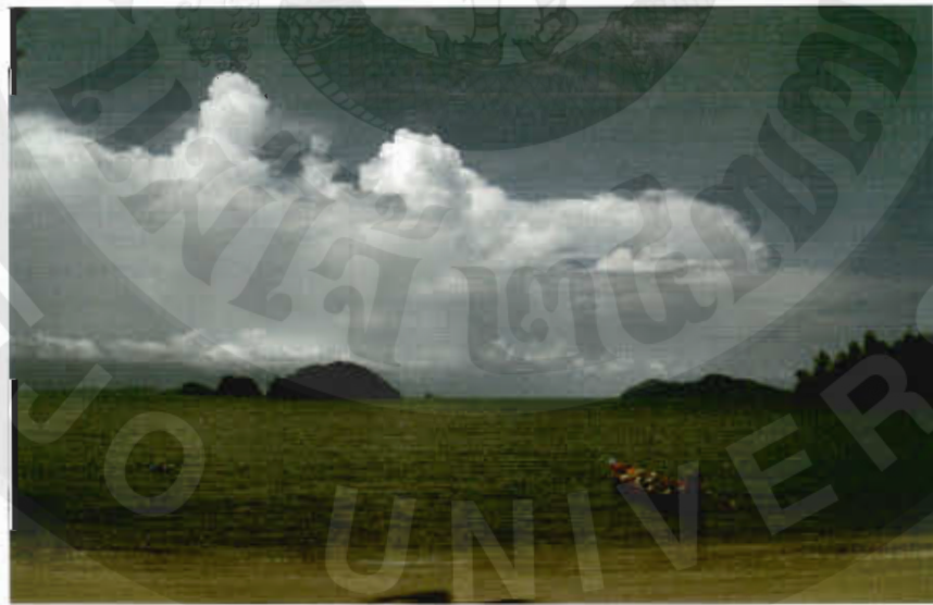
ทัศนียภาพอ่าวมะขาม