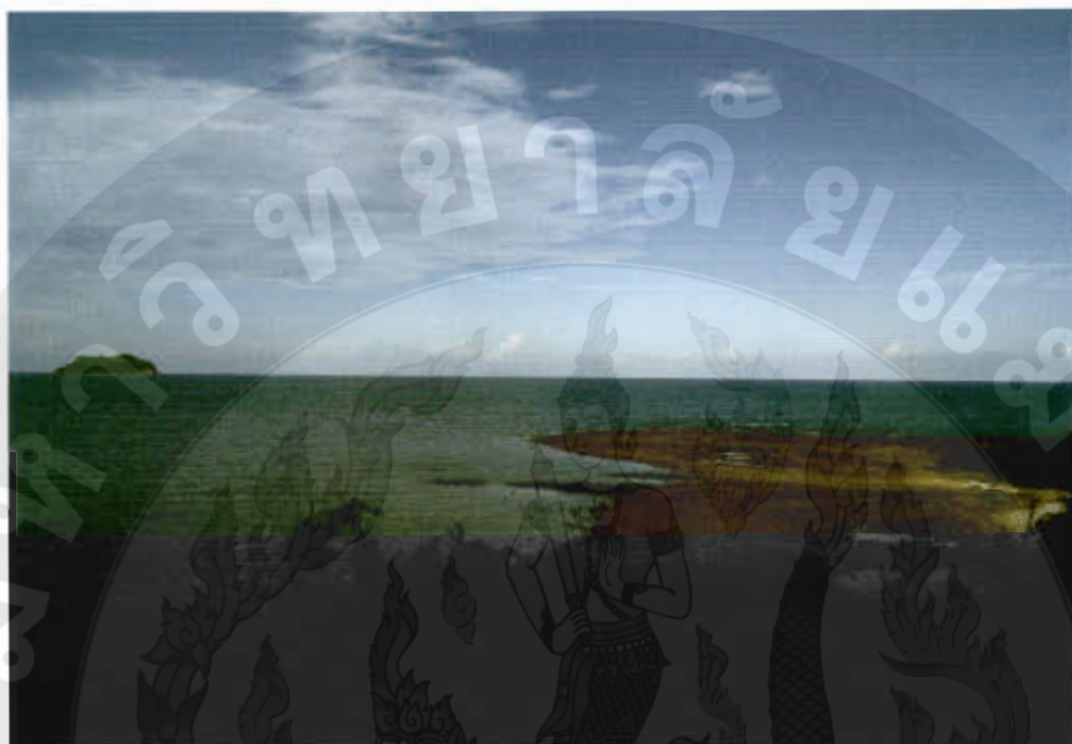
ทัศนียภาพแหลมคอกวาง