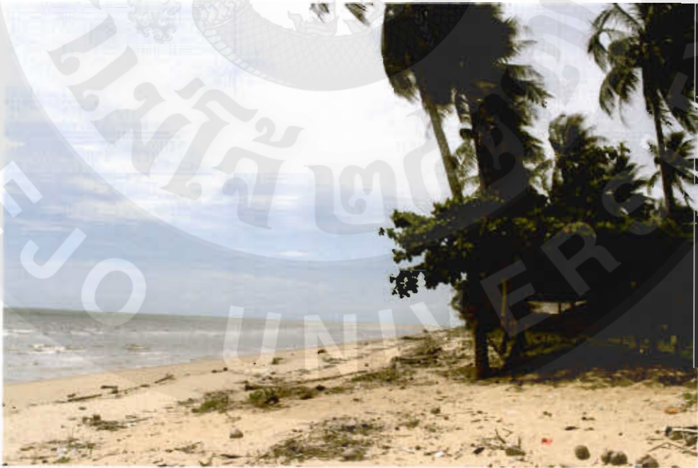
ทัศนียภาพหาดกลางอ่าว