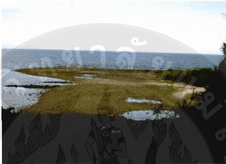
ทัศนียภาพแหลมแท่น