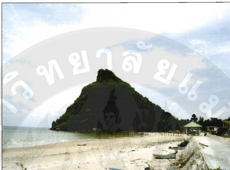
ทัศนียภาพหาดถ้ำธง