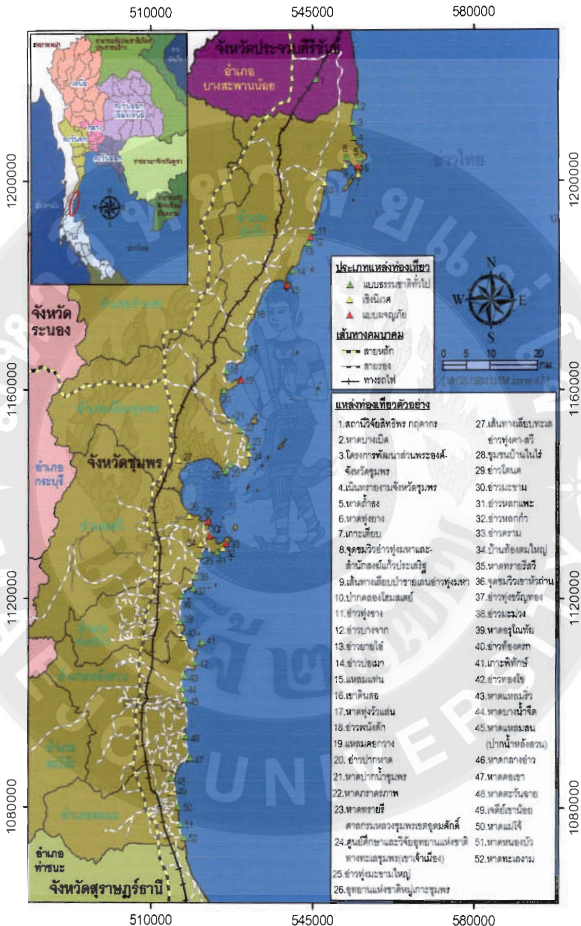
ภาพที่ 2 สถานภาพแหล่งท่องเที่ยวเส้นทางเลียบรินทะเลจังหวัดชุมพร