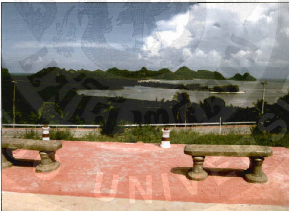
ทัศนียภาพจุดชมวิวอ่าวทุ่งมหาและสำนักสงฆ์แก้วประเสริฐ