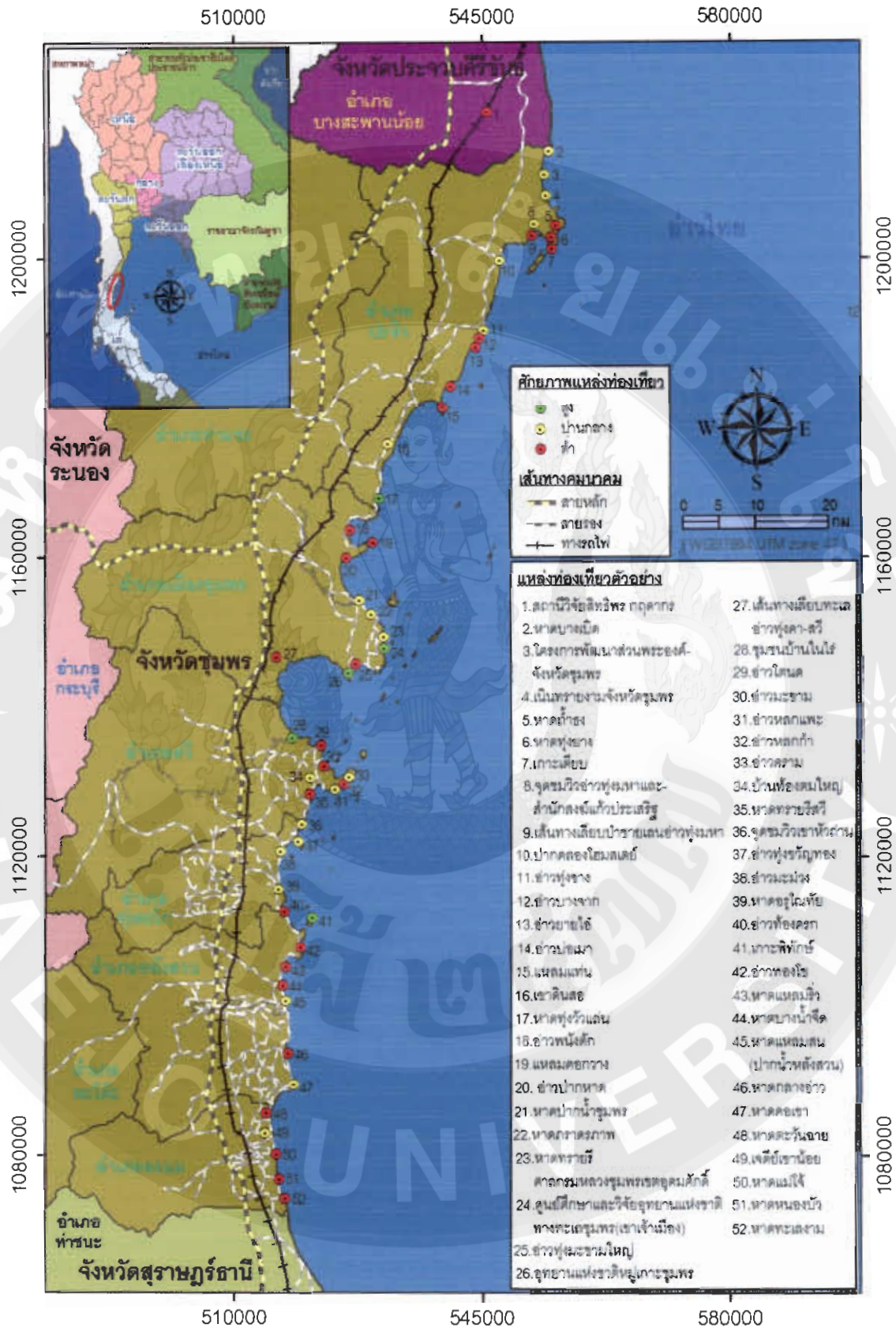
ภาพที่ 4 สัญลักษณ์ของแหล่งท่องเที่ยวเส้นทางเลียบทะเลจังหวัดชุมพร