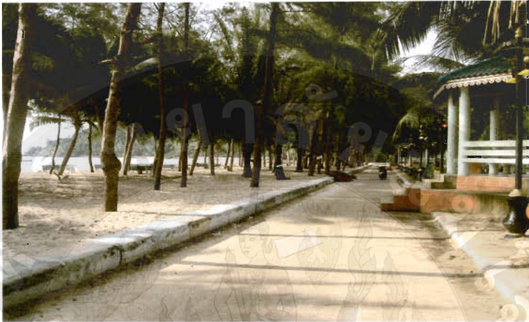
ทัศนียภาพหาดอูรุโฉทัย