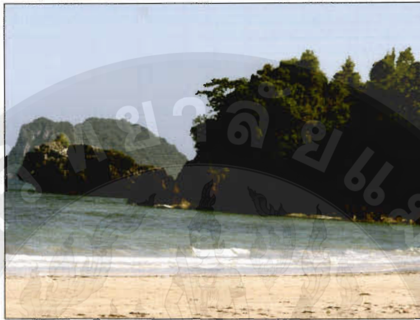
ทัศนียภาพอ่าวยายไฉ้