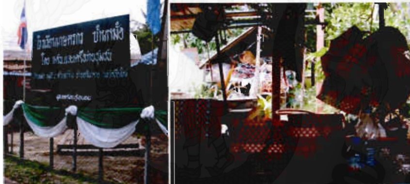
รูปที่ 13 ด้านการสร้างคุณค่าและมูลค่าของผลิตภัณฑ์