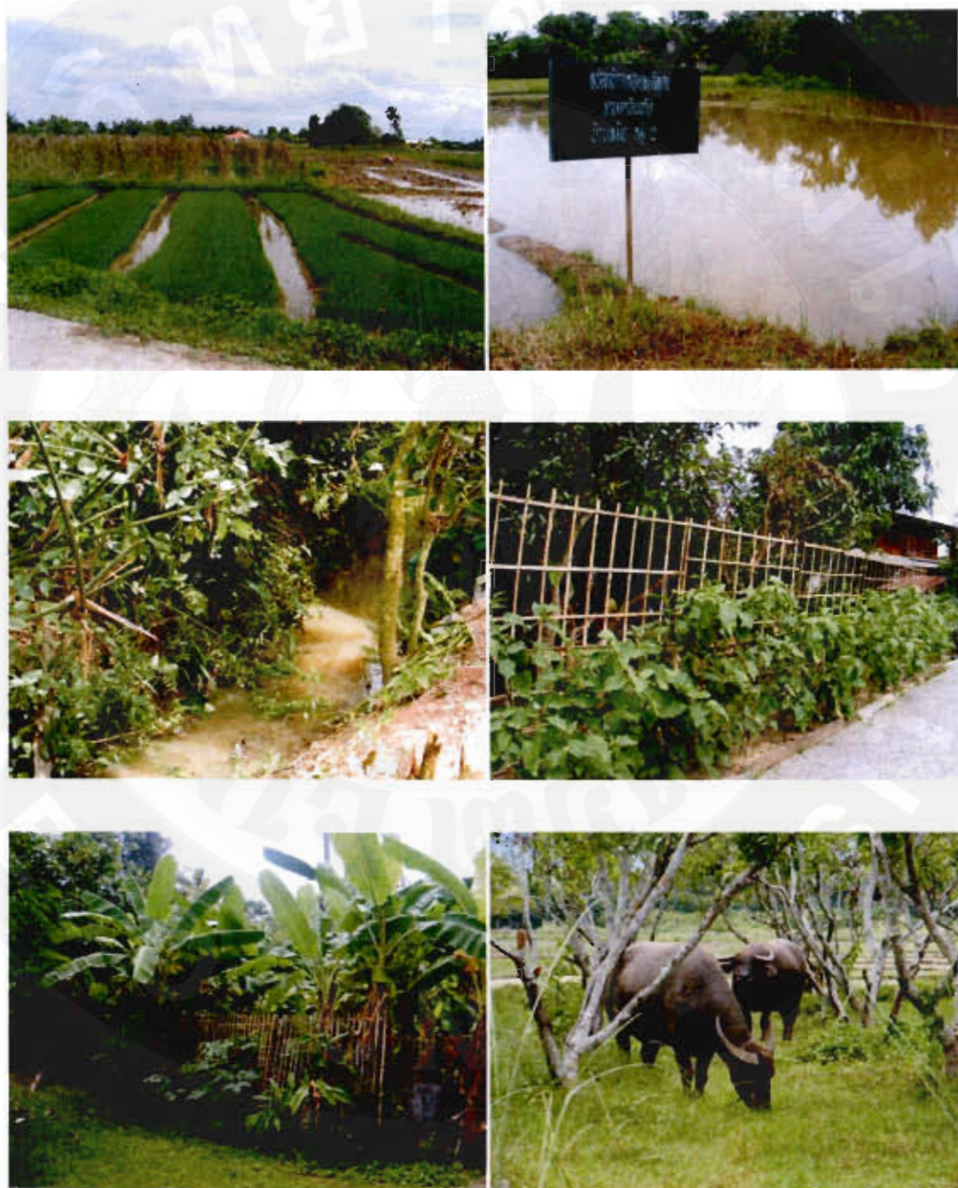
รูปที่ 3 ลักษณะของพื้นที่ และทรัพยากรสิ่งแวดล้อมรอบชุมชน

ประเภทที่พบได้น้อยแหล่งในประเทศไทย ซึ่งในหมู่บ้านบ้านหม้อนั้นจุดดึงดูดคือการทำเป็นชุมชน เศรษฐกิจพอเพียง