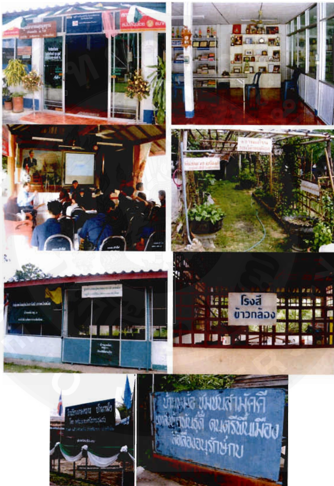
รูปที่ 4 ศูนย์เรียนรู้ชุมชนบ้านหม้อ