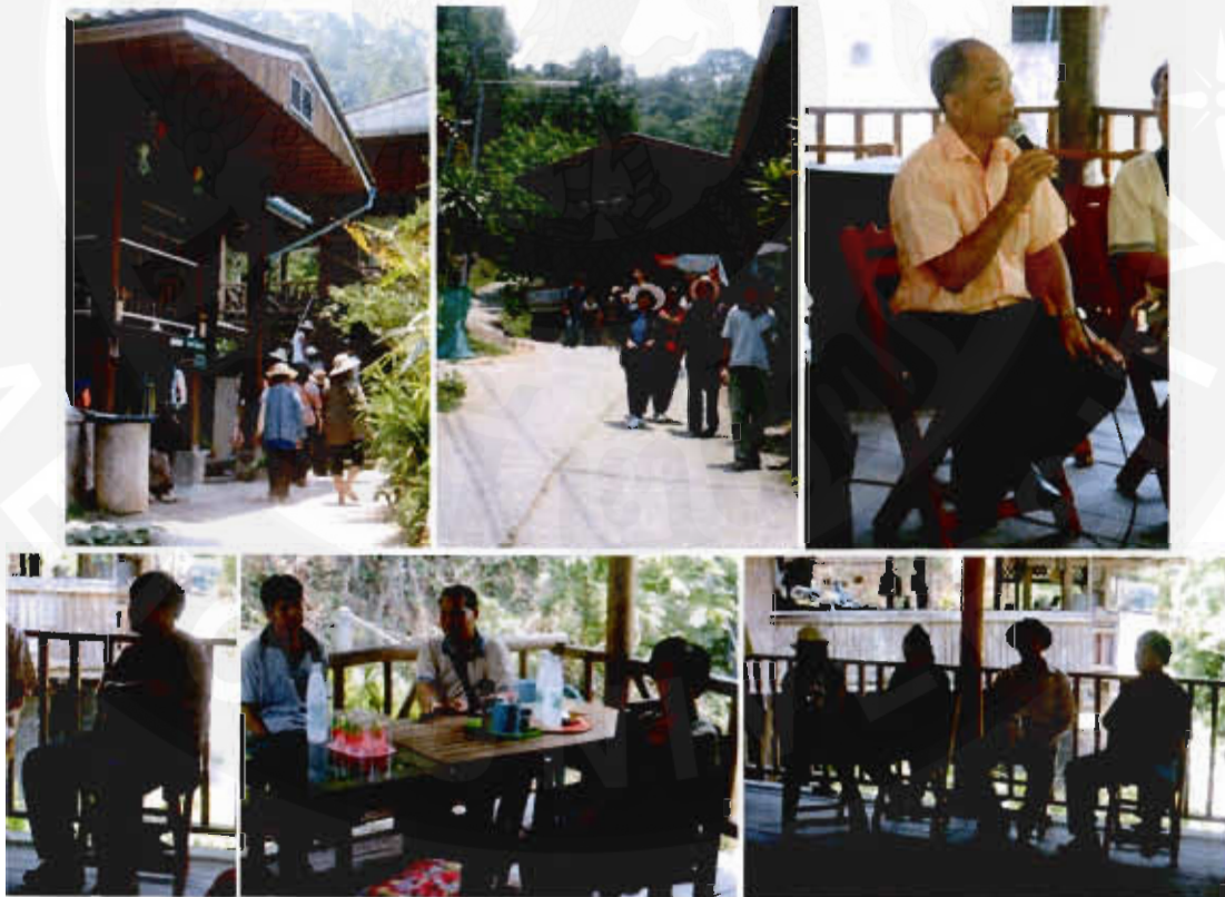
รูปที่ 7 ศึกษาดูงาน ณ หมู่บ้านแม่กำปอง

จากผลการอบรม ประโยชน์ที่ชุมชนได้รับมากที่สุดและมีความพึงพอใจสูงสุดการได้ศึกษาดูงานหมู่บ้านหรือชุมชนที่มีการบริหารจัดการโฮมสเตย์ ณ หมู่บ้านแม่กำปอง ทำให้ผู้เข้าร่วมโครงการสามารถนำไปปรับใช้ได้จริง อีกทั้งยังได้รับการแนะนำที่ดีจากผู้นำชุมชนและสามารถนำข้อมูลความรู้ที่ได้มาปรับประยุกต์ใช้ในชุมชนได้อย่างแท้จริง และได้เข้าเยี่ยมชมโฮมสเตย์ที่ได้รับมาตรฐาน โดยมีโอกาสได้เข้าพูดคุยแลกเปลี่ยนความรู้กับเจ้าของบ้าน ทำให้ได้ทราบถึงประโยชน์ในการจัดทำโฮมสเตย์ในชุมชน