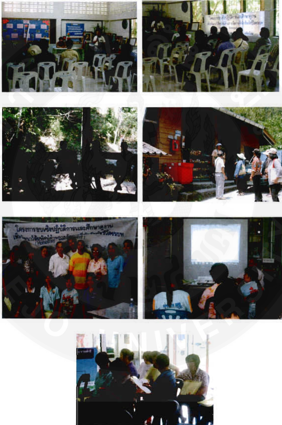
รูปที่ 8 อบรมเชิงปฏิบัติการ