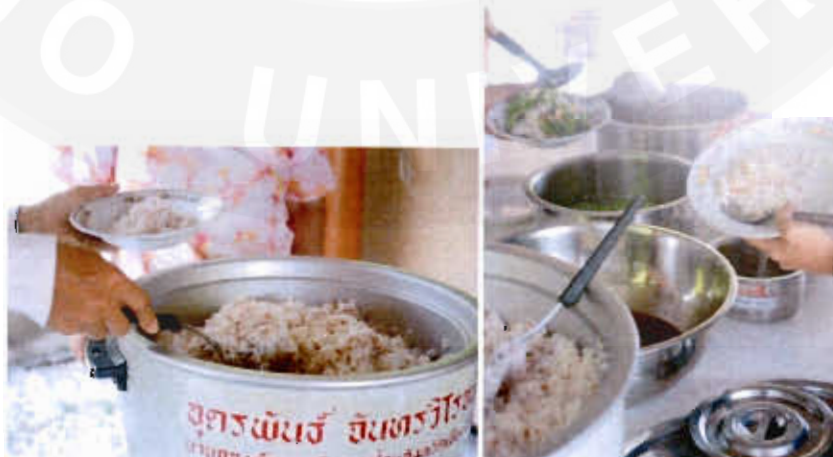
รูปที่ 10 ด้านอาหารและโภชนาการ