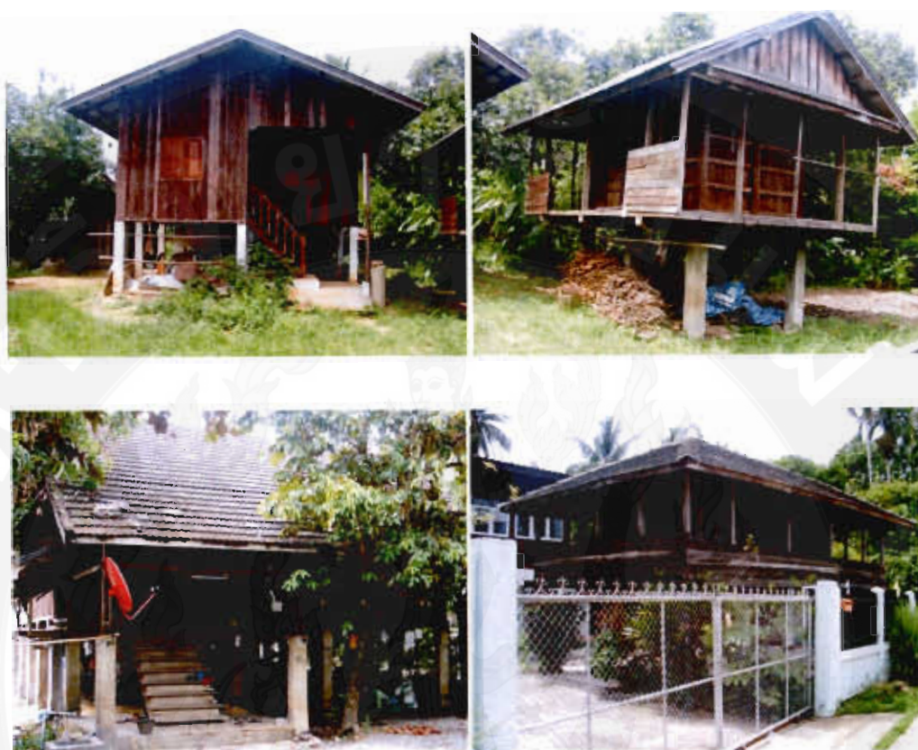
รูปที่ 6 บ้านที่ยังคงความเป็นเอกลักษณ์ตามวิถีชีวิตชุมชน

การพัฒนาวิสัยทัศน์ในการจัดการโฮมสเตย์ที่เหมาะสมกับศักยภาพด้านพื้นที่ทรัพยากรด้าน สิ่งแวดล้อมและทรัพยากรด้านวัฒนธรรมของชุมชน