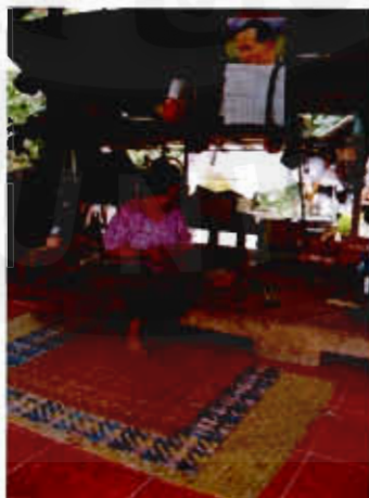
รูปที่ 5 วิธีการดำเนินชีวิตของคนในชุมชน