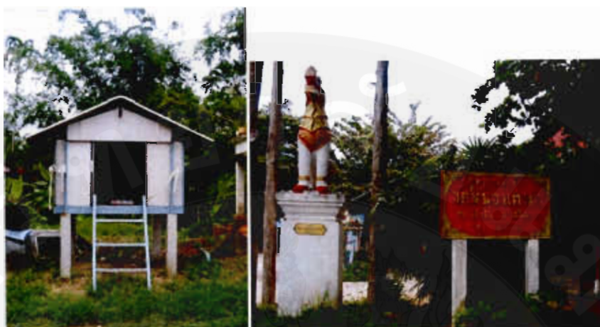
รูปที่ 12 ด้านวัฒนธรรม