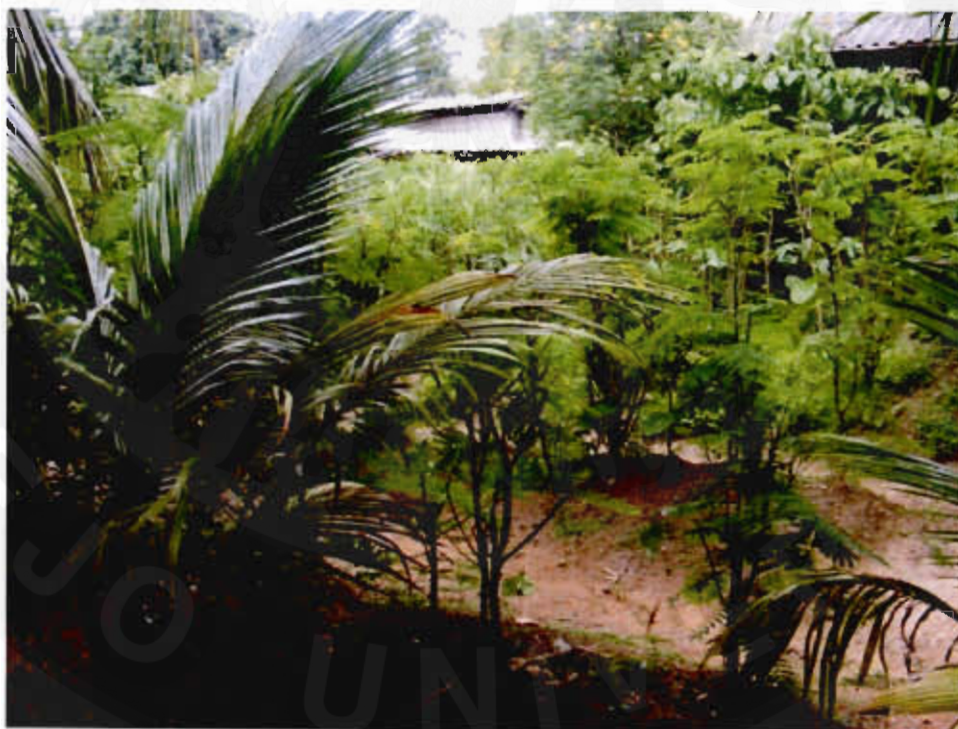
รูปที่ 11 หลักเศรษฐกิจพอเพียง

จากการสังเกตการนำเที่ยวภายในชุมชนของสมาชิกชุมชน นักวิจัยพบว่าชาวบ้านมีความเป็นกันเอง มีมนุษยสัมพันธ์ที่ดี อีกทั้งยังมีการแลกเปลี่ยนเรื่องราวเกี่ยวกับวิถีชีวิตในชุมชนและเปิดโอกาสให้เที่ยวภายในบริเวณชุมชน ซึ่งจุดเด่นของชุมชนบ้านหม้อ คือ การได้รับรางวัลหมู่บ้านเศรษฐกิจพอเพียง ดังนั้นชุมชนจึงมีกิจกรรมการแลกเปลี่ยนข้อมูลโดยเฉพาะ เช่น การไปดูสวนผักหลังบ้านที่ใช้หลักเศรษฐกิจพอเพียงมาจัดการ การเรียนรู้วิถีชีวิตกบ การจักสาน และการทำนา