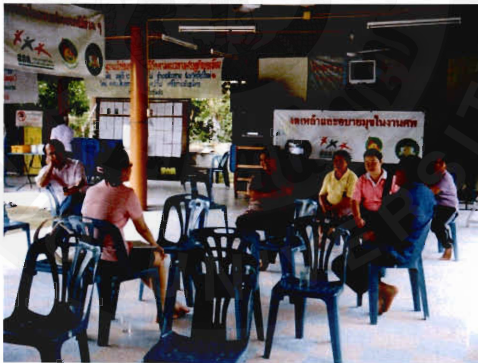
รูปที่ 2 เวทีหารือระหว่างผู้วิจัย ผู้นำชุมชน และผู้สนใจในชุมชน

จากการพูดคุยกับผู้นำชุมชนเบื้องต้น ทำให้ผู้วิจัยได้ทราบถึงประเด็นเกี่ยวกับความต้องการการจัดตั้งโฮมสเตย์ภายในชุมชน เนื่องจากได้สังเกตเห็นถึงรายได้ที่สามารถนำเข้าสู่ชุมชน รวมถึงเป็นการสร้างรายได้ในส่วนอื่นๆ เช่น การขายสินค้า OTOP ของชุมชน และรายได้ที่เพิ่มขึ้นของภาคเกษตรท้องถิ่น เป็นต้น จากความต้องการดังกล่าว ผู้วิจัยจึงมีแนวคิดในการหารูปแบบการจัดการโฮมสเตย์ที่เหมาะสมกับศักยภาพด้านพื้นที่ ทรัพยากรด้านสิ่งแวดล้อมและทรัพยากรด้านวัฒนธรรมของชุมชน