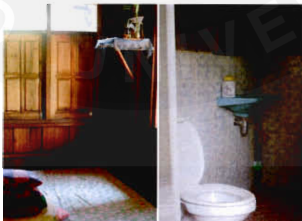
รูปที่ 9 ด้านที่พัก