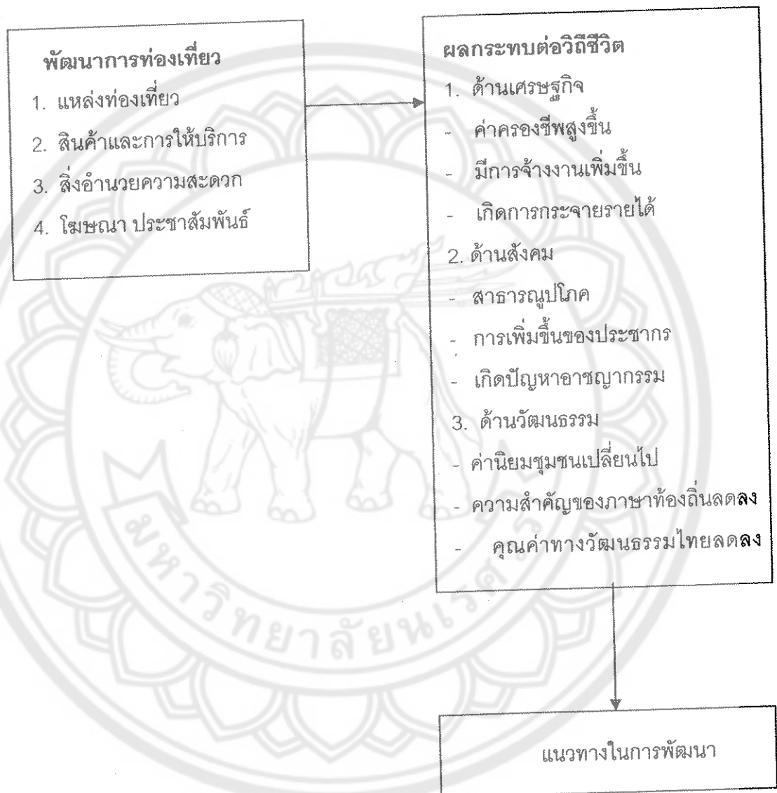
ภาพ 1 แสดงกรอบแนวคิดในการวิจัย