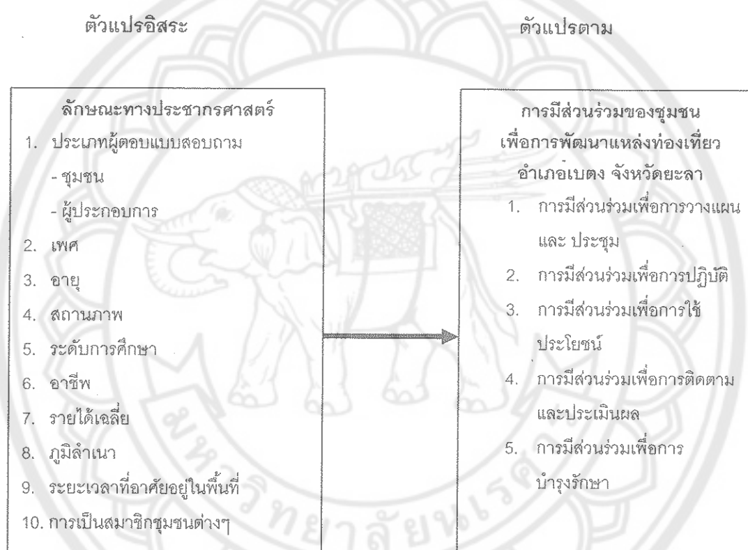
ภาพ 1 แสดงกรอบแนวคิดการวิจัย

มาจากภูมิหลังทางสังคม ความรู้ ประสบการณ์ คุณลักษณะและสภาพแวดล้อมของบุคคลนั้นๆ โดยไม่มีเกณฑ์ตายตัว ในการวิจัยครั้งนี้ผู้วิจัยได้นำองค์ประกอบ ด้านแหล่งท่องเที่ยว ด้านการบริหารจัดการ ด้านกิจกรรมและกระบวนการให้การเรียนรู้ และด้านการบริหารจัดการด้านการตลาด มาเป็นตัวแปรด้านการศึกษา โดยปัจจัยที่มีความสัมพันธ์กับความคิดเห็นของชุมชน ได้แก่ เพศ อายุ การศึกษา อาชีพ รายได้ เพื่อใช้เป็นแนวทางการมีส่วนร่วมของชุมชนเพื่อการพัฒนาการท่องเที่ยวในอำเภอเบตง จังหวัดยะลา เป็นกรอบแนวคิดในการวิจัย ได้ดังนี้