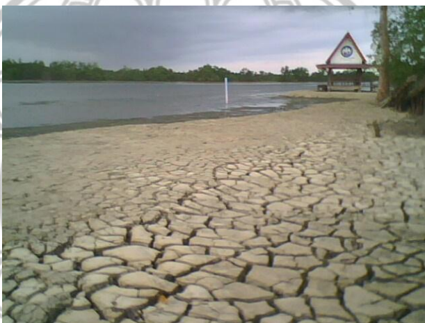
ภาพ 6 น้ำในทะเลสาบแห้งขอด จนไม่สามารถออกเรือนำเที่ยวได้

...น้ำตื้นเขินในช่วงหน้าแล้ง ออกเรือพานักท่องเที่ยวไปเที่ยวชมทะเลสาบไม่ได้ ขาดรายได้