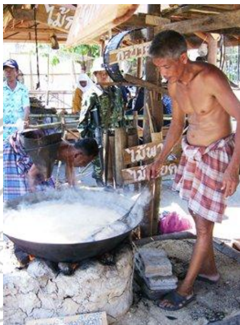
ภาพ 3 ชาวบ้านกำลังเคี้ยวน้ำตาลโตนดเพื่อมาใช้ทำน้ำตาลแว่น

(คำรพ เสาวคนธ์, ผู้ให้สัมภาษณ์, 28 ตุลาคม 2553)