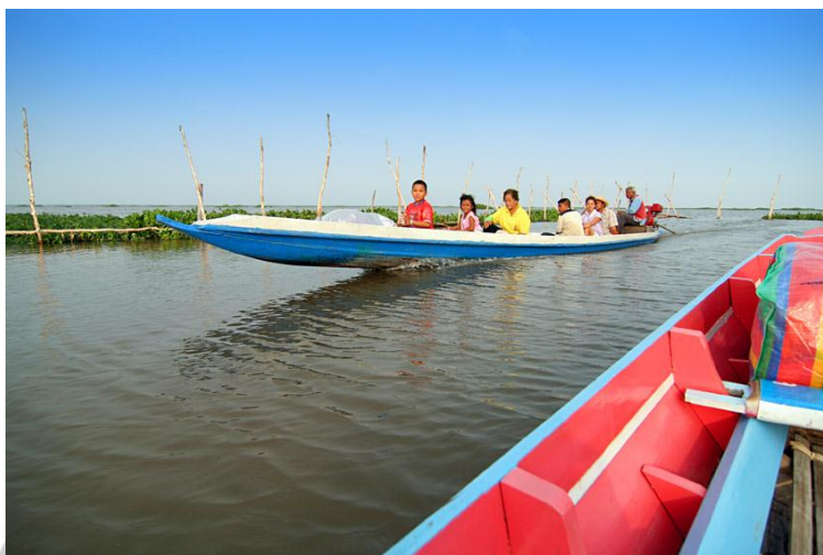
ภาพ 8 กิจกรรมเรือน้ำเที่ยว

ของมหาวิทยาลัยทักษิณมีการจัดกิจกรรมเสริม คือการเดินป่าพรุ ซึ่งเป็นแหล่งทรัพยากรที่สำคัญ อีกทั้งชมวิถีชีวิตชาวบ้านบริเวณใกล้เคียงที่ทำเขตห้ามล่าสัตว์ป่า