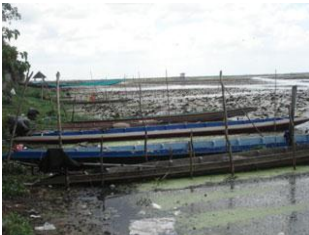
ภาพ 5 น้ำในทะเลสาบแห้งขอด จนไม่สามารถออกเรือนำเที่ยวได้