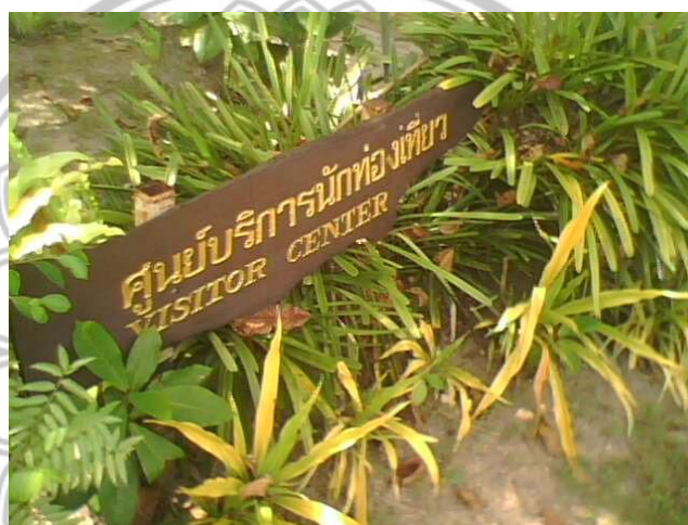
ภาพ 9 ป้ายบอกที่ตั้งศูนย์บริการนักท่องเที่ยว

4.1.1 ศูนย์บริการนักท่องเที่ยว ควรมีเจ้าหน้าที่ประจำศูนย์บริการนักท่องเที่ยวไว้บริการ 2 คน ซึ่งมีหน้าที่คอยตอบข้อซักถามและให้ข้อมูลเกี่ยวกับทะเลสาบสงขลา และการให้บริการข้อมูลสถานที่ท่องเที่ยว นอกจากนี้ให้คำปรึกษาหรืออธิบายข้อมูลต่าง ๆ แล้ว ศูนย์บริการนักท่องเที่ยวควรมีข้อมูลแผ่นพับให้กับนักท่องเที่ยว ที่เกี่ยวข้องกับทะเลสาบไว้บริการแก่นักท่องเที่ยว