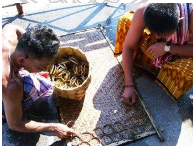
ภาพ 4 ชาวบ้านวางเรียงแว่นตาลรอการหยอดน้ำตาล