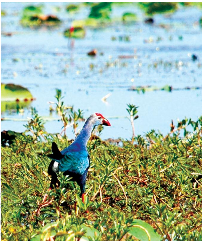
ภาพ 2 นกน้ำในบริเวณทะเลสาบสงขลา