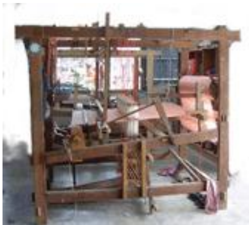
ภาพ 13 กี่ทอผ้าของกลุ่มราชวັถ์แสงส่องหล้า