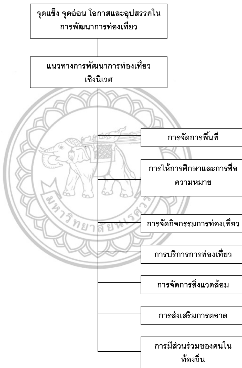
ภาพ 1 กรอบแนวคิดในการวิจัย

กรอบแนวคิด แนวทางการพัฒนาการท่องเที่ยวเชิงนิเวศในพื้นที่ทะเลสาบสงขลา มีดังนี้