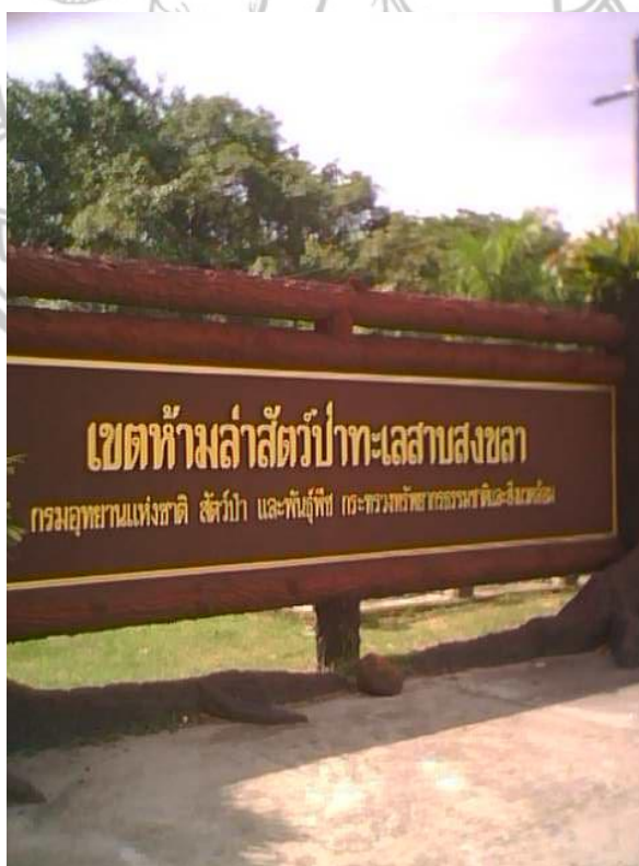
ภาพ 10 ป้ายบอกชื่อเขตห้ามล่าสัตว์ป่าทะเลสาบสงขลา

(สมพงษ์ หนูสงค์, ผู้ให้สัมภาษณ์, 7 พฤศจิกายน 2553)