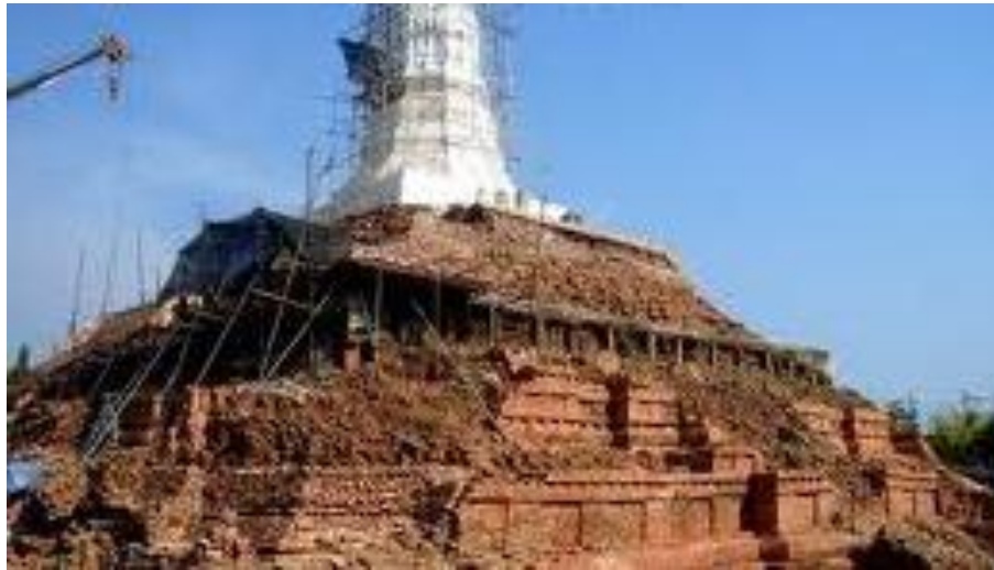
ภาพ 4 แสดงพระประทีปเจดีย์ ขณะทำการบูรณะซ่อมแซม