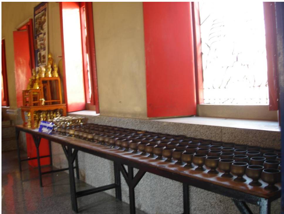
ภาพ 8 แสดงโต๊ะตักบาตรเหรียญในพระอุโบสถ