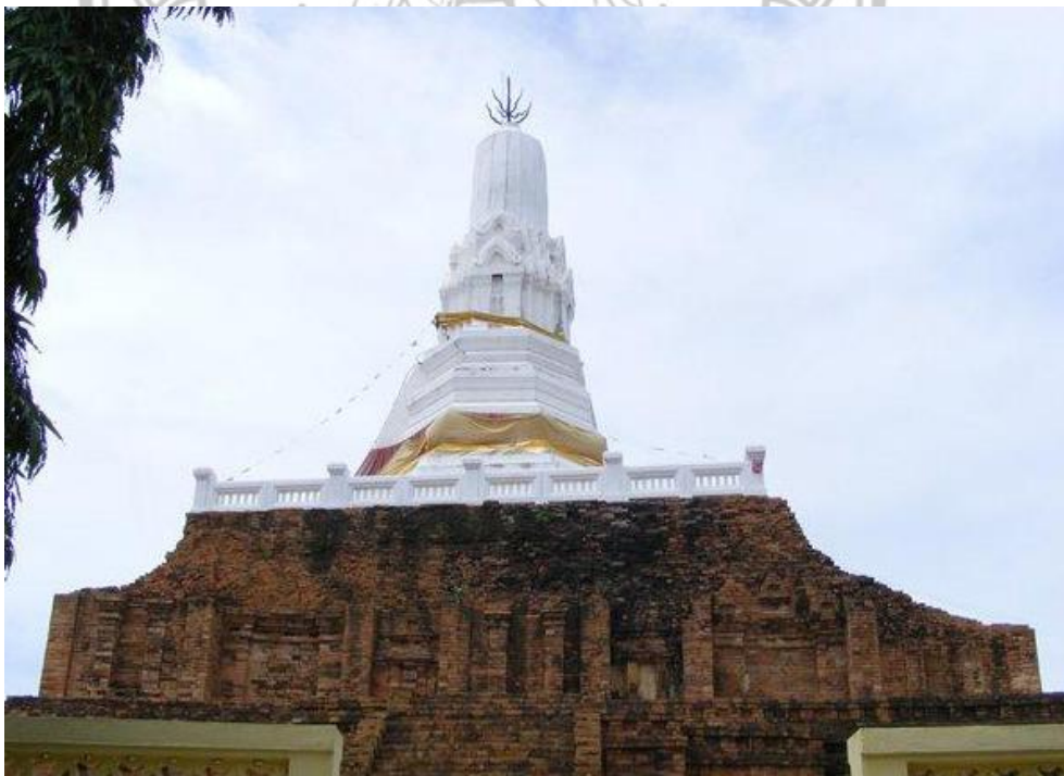
ภาพ 3 แสดงพระประโทนเจดีย์ หลังได้รับการบูรณะซ่อมแซม