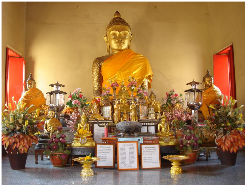
ภาพ 6 แสดงพระประธานและพระพุทธรูปอื่นๆ ภายในพระอุโบสถ