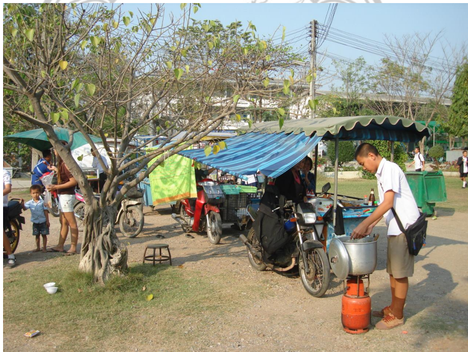
ภาพ 5 แสดงรถเข็นขายอาหารบริเวณวัดพระประทีปเจดีย์