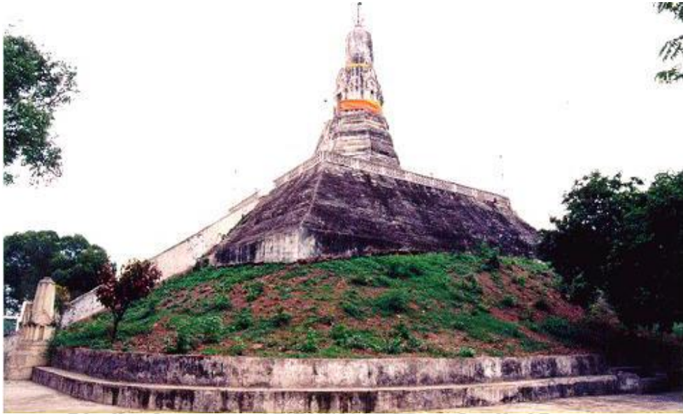
ภาพ 2 แสดงพระประโทนเจดีย์ ก่อนได้รับการบูรณะซ่อมแซม