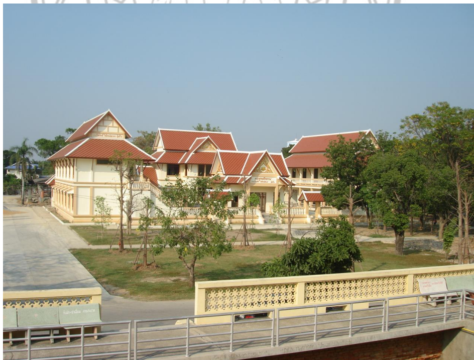
ภาพ 9 แสดงบริเวณภายในวัดพระประโทนเจดีย์