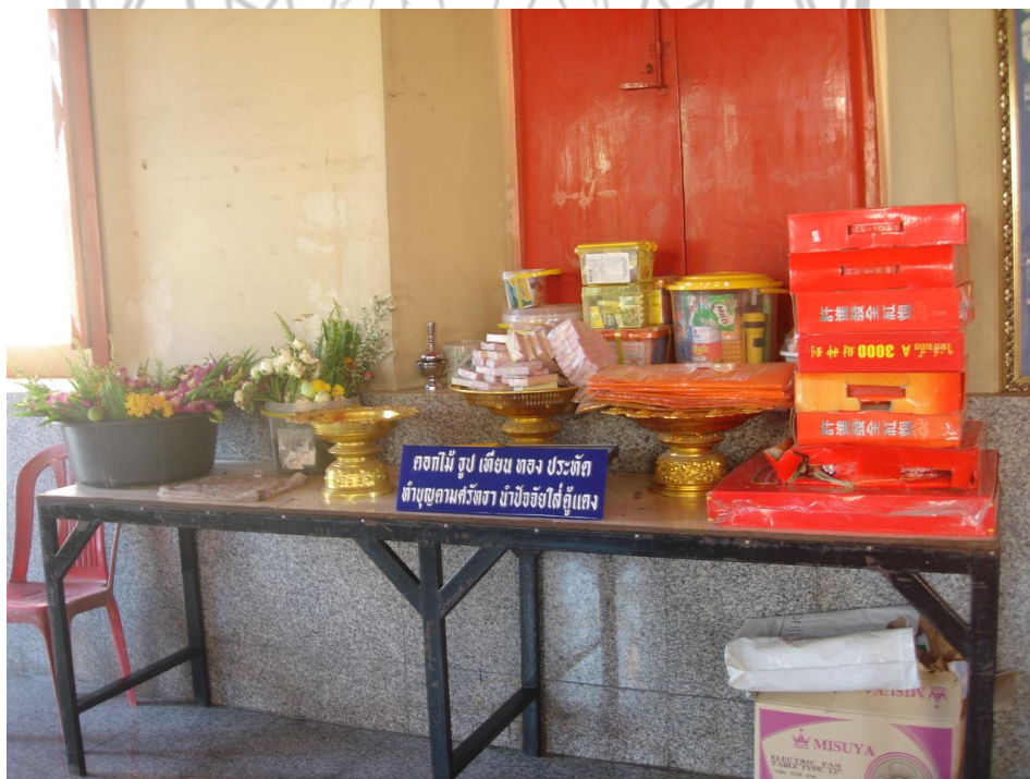
ภาพ 7 แสดงบริเวณทางเข้าพระอุโบสถ