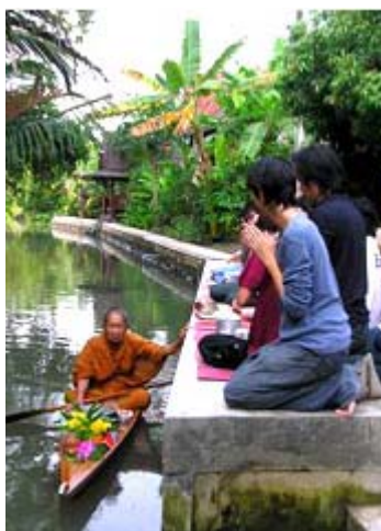
ภาพ 9 แสดงการใส่บาตรตอนเช้าของหมู่บ้านปลายโพงพาง