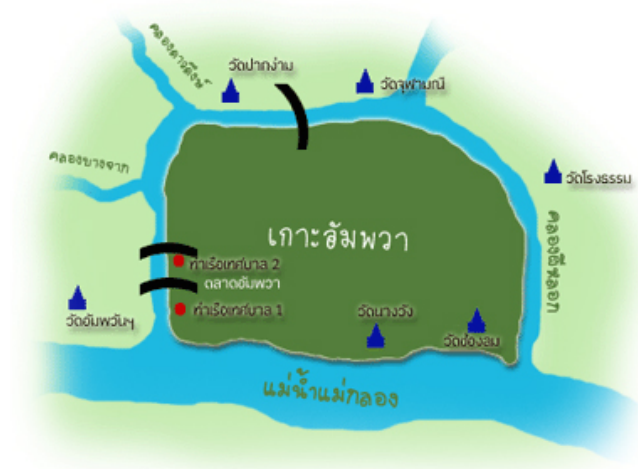
ภาพ 4 แสดงภาพพื้นที่รอบเกาะอัมพวา