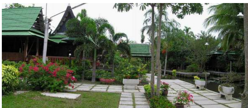
ภาพ 8 แสดงหมู่บ้านปลายโพงพาง