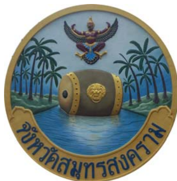
ภาพ 2 แสดงตราสัญลักษณ์ประจำจังหวัดสมุทรสงคราม