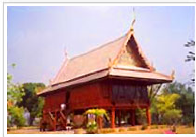
ภาพ 5 แสดงภาพลักษณะวัดภุมรินทร์กุฎีทอง