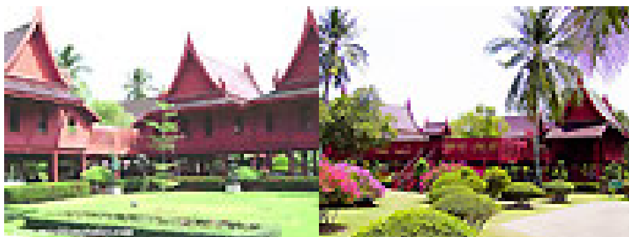
ภาพ 6 แสดงบริเวณอุทยานรัชกาลที่ 2

วัดภุมรินทร์กุฎีทอง ตั้งอยู่ริมแม่น้ำแม่กลอง ตรงปากคลองประชาชื่นฝั่งตะวันตก ตำบลสวนหลวง สิ่งที่น่าสนใจภายในวัดมีมากมาย ได้แก่ กุฎีทอง ทำด้วยไม้สัก ประวัติเล่าว่า เศรษฐีบิดาของคุณนาค (สมเด็จพระอมรินทราบรมราชินีในรัชกาลที่ 1) ให้สมภารวัดบางลี่ตรวจดูดวงชะตาคุณนาค สมภารทำนายว่าจะได้เป็นพระราชินี เศรษฐีบิดาคุณนาคจึงให้คำมั่นว่า ถ้าเป็นจริงจะสร้างกุฎีทองถวายให้วัด วัดบางลี่จึงได้ชื่อว่า วัดบางลี่กุฎีทอง ต่อมาวัดบางลี่ถูกน้ำเซาะที่ตื้นพังลง จึงรื้อกุฎีทองมาสร้างไว้ที่วัดภุมรินทร์ วัดนี้จึงได้ชื่อว่าวัดภุมรินทร์กุฎีทอง นอกจากนี้ ยังมีพิพิธภัณฑวัดภุมรินทร์และอุทยานการศึกษา เป็นสถานที่เก็บรวบรวมโบราณวัตถุล้ำค่าสมควรแก่การศึกษาและอนุรักษ์ไว้ เช่น พระพุทธรูป หนังสือไทย โถลายคราม และเครื่องทองเหลือง พระพุทธรูปเก่าแก่อายุกว่า 300 ปี เป็นพระพุทธรูปปูนปั้นปิดทอง ปางมารวิชัยชื่อ พระพุทธรัตนมงคลหรือหลวงพ่อดโต และ พระบรมราชานุสาวรีย์พระบาทสมเด็จพระพุทธเลิศหล้านภาลัย ประดิษฐาน