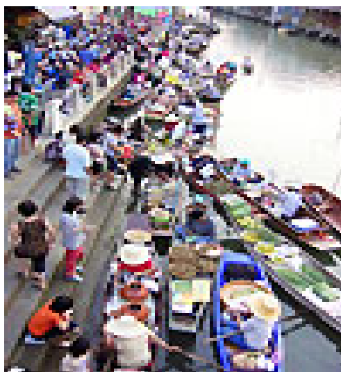
ภาพ 7 แสดงตลาดน้ำอัมพวา

ห้องครัวและห้องน้ำ จัดไว้ที่ชั้นล่างอาคารปีกซ้าย แสดงลักษณะครัวไทยและห้องน้ำของคนชั้นกลาง มีเครื่องหุงต้ม ถ้วยชาม สำหรับอาหาร เป็นต้น ตำแหน่งศิลาฤกษ์แสดงให้เห็นแบบจำลองศิลาฤกษ์ที่สมเด็จพระเทพรัตนราชสุดาฯ สยามบรมราชกุมารี ทรงประกอบพิธี