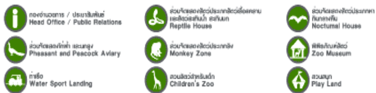
ภาพ 2 แสดงแผนผังภายในสวนสัตว์ดุสิต