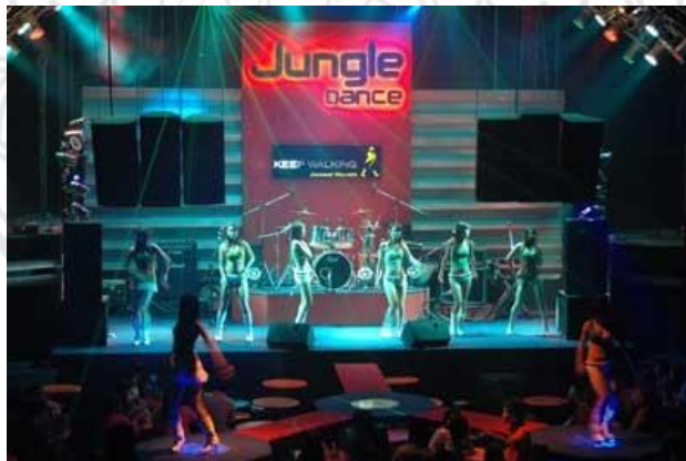
ภาพ 2 แสดงร้าน Jungle 88/5 ม.9 ถ.เกษตรนวมินทร์ อ.บึงกุ่ม ต.คลองกุ่ม กทม 10230