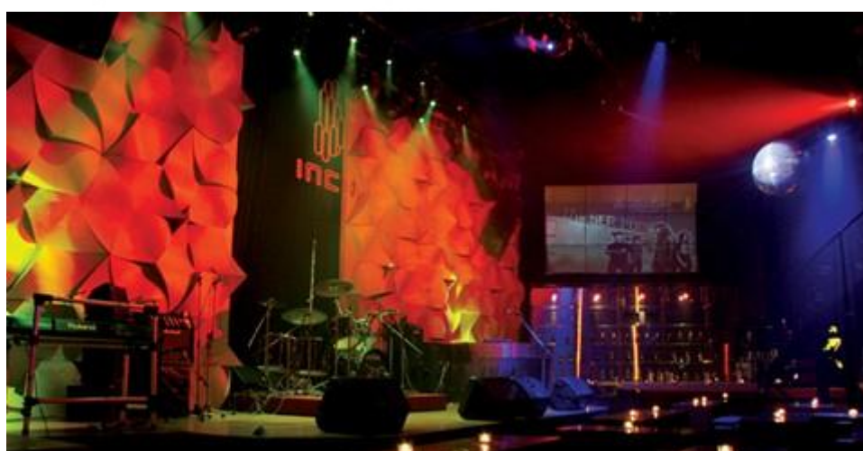
ภาพ 4 แสดงร้านมะลิลา 112/20 ถ.ลาดพร้าว จอมพล จตุจักร กรุงเทพฯ