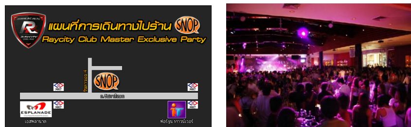
ภาพ 3 แสดงร้าน Snop 58/5 ถ.รัชดาภิเษก ซอย 4 ห้วยขวาง กทมฯ 10310