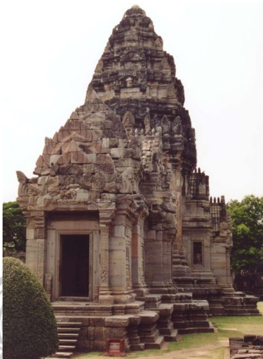
ภาพ 4 แสดงปราสาทประธาน