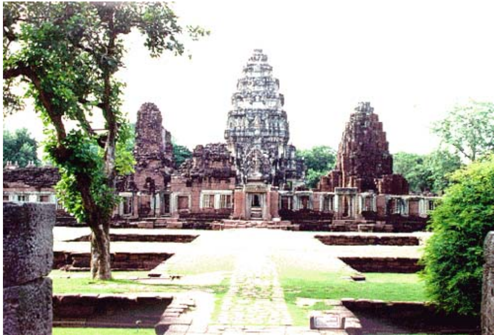
ภาพ 2 แสดงอุทยานประวัติศาสตร์พิมาย