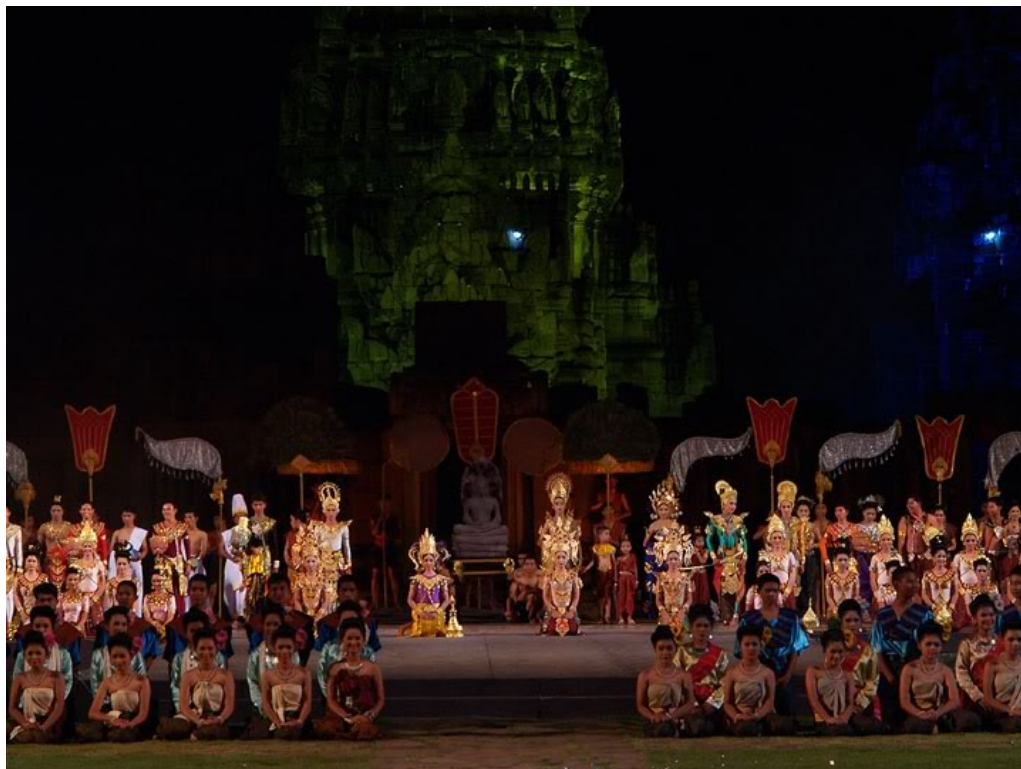
ภาพ 12 แสดงการจัดแสดงแสงและสี ณ อุทยานประวัติศาสตร์พิมาย