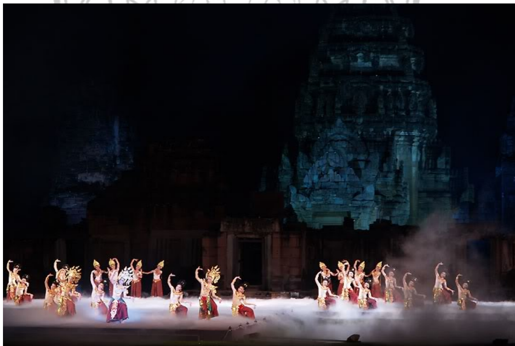
ภาพ 11 แสดงการจัดแสดงแสงและสี ณ อุทยานประวัติศาสตร์พิมาย