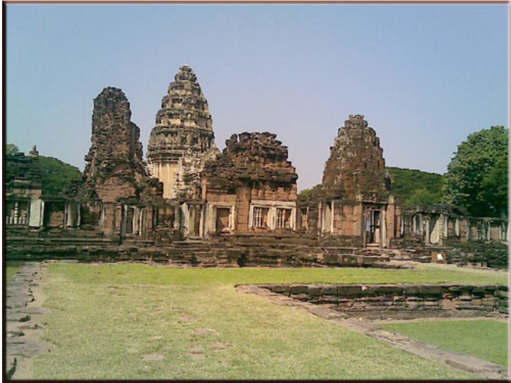
ภาพ 6 แสดงปราสาทหินแดง