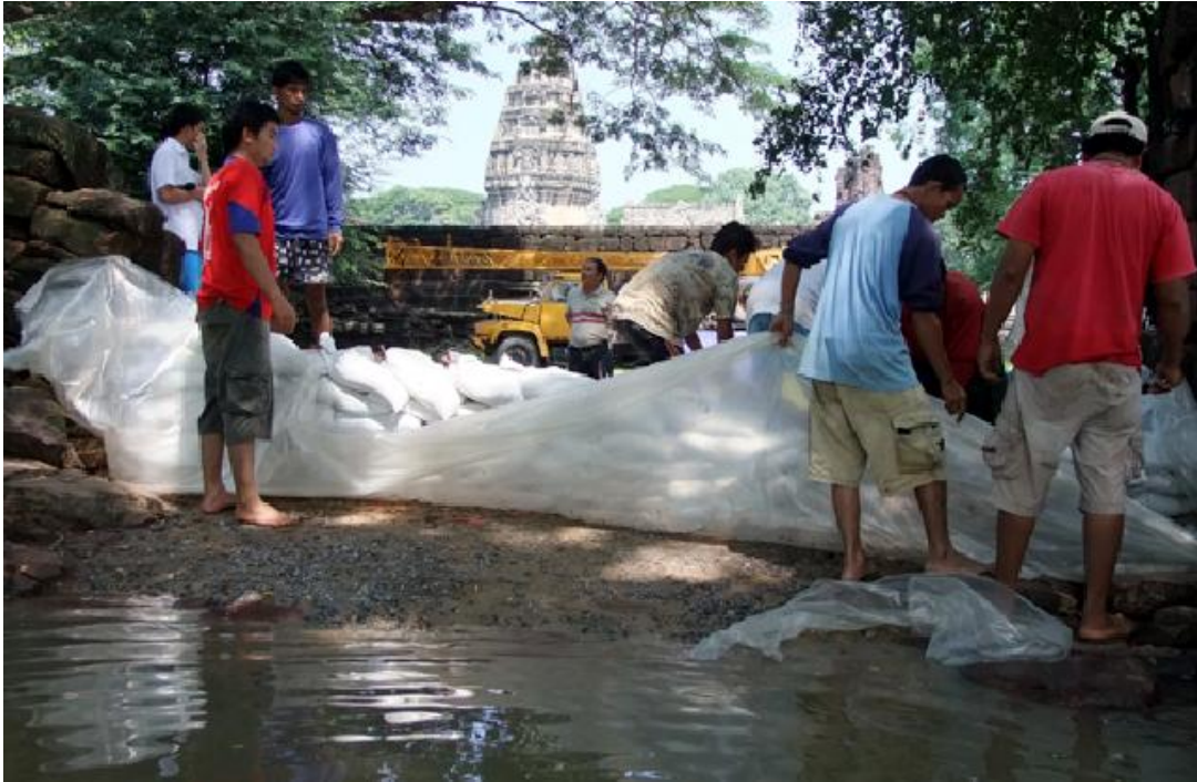
ภาพ 8 แสดงการตั้งกระสอบทรายเพื่อป้องกันน้ำทะเลลัก เข้าท่วมปราสาทประธาน