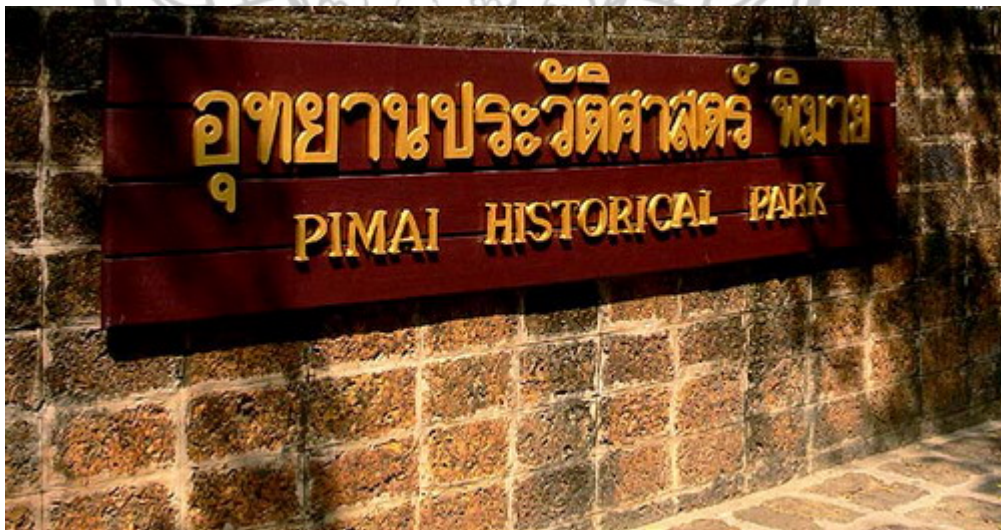
ภาพ 7 แสดงด้านหน้าอุทยานประวัติศาสตร์พิมาย