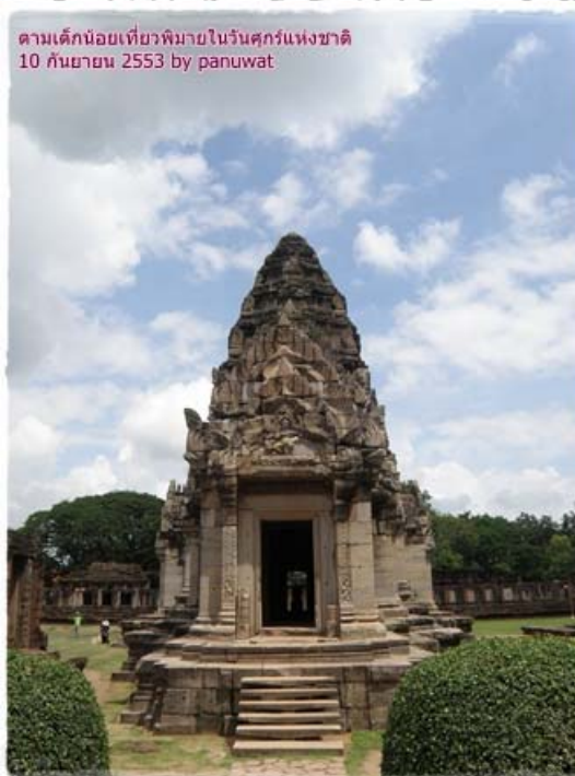
ภาพ 5 แสดงปราสาทพรมหัต