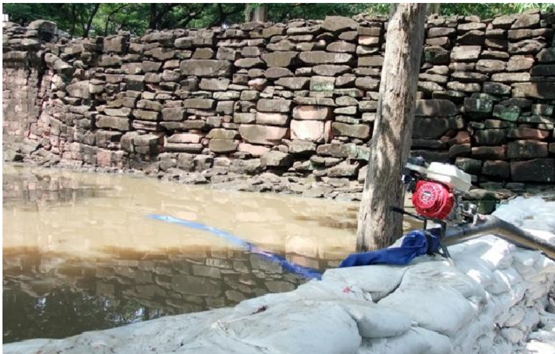
ภาพ 10 แสดงการใช้เครื่องสูบน้ำ สูบน้ำออกจากบริเวณปราสาท