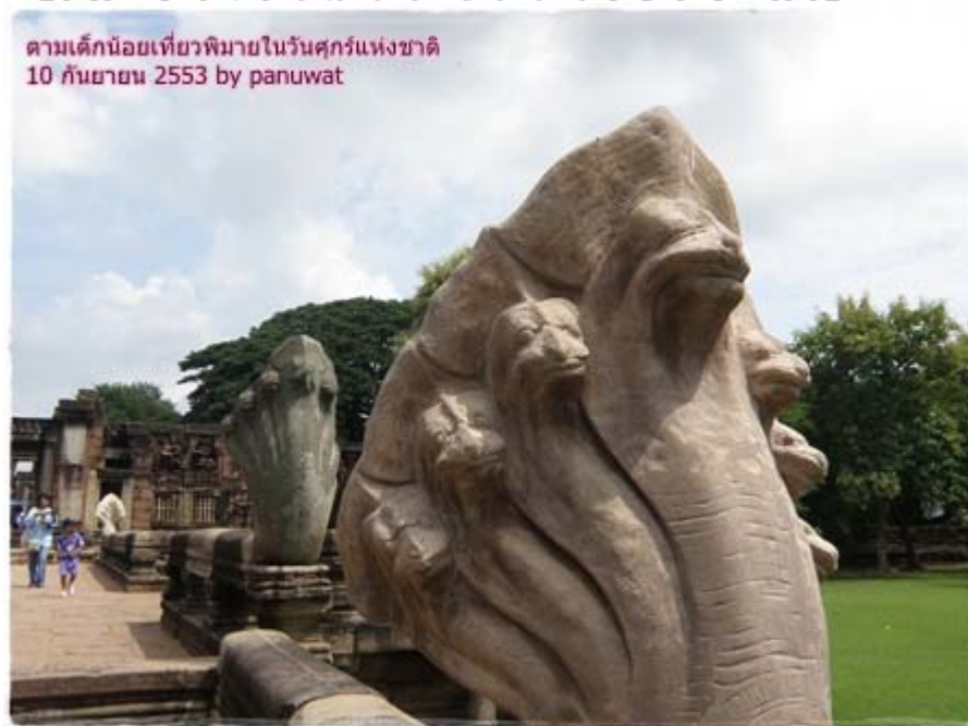
ภาพ 3 แสดงสะพานนาคราช