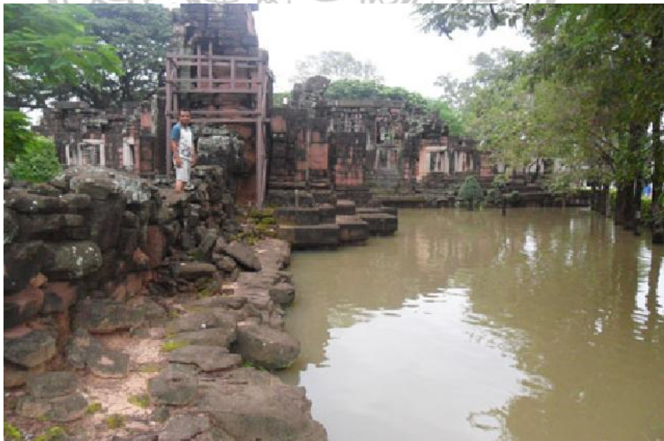
ภาพ 9 แสดงน้ำท่วมขังพื้นที่ชั้นนอก