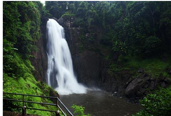
ภาพที่ ๔-๓ ป้ายบอกสถานที่น้ำตกเหวนรกและน้ำตกเหวนรก

(๒) จุดท่องเที่ยวประเภทชมทิวทัศน์ของอุทยานแห่งชาติเขาใหญ่ที่โดดเด่น ได้แก่