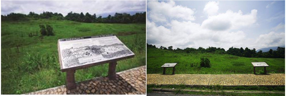
ภาพที่ ๔-๗ บริเวณจุดชมวิวโป่งกวาง และป้ายสื่อความหมาย

(๒.๔) จุดชมวิวโป่งกวาง เป็นจุดชมวิวทุ่งหญ้าใจกลางอุทยานแห่งชาติเขาใหญ่ อยู่บริเวณกิโลเมตรที่ ๓๙-๔๐ ถนนธนะรัชต์ ซึ่งเป็นแหล่งหากินที่สำคัญของกวางป่าและแก้งเป็นหลัก กวางป่าหลังจากมีความคุ้นเคยกับคนที่ไม่ทำร้ายก็มักออกมาให้เห็นเป็นจำนวนมากเป็นประจำ ส่วนใหญ่ เริ่มออกหากินตั้งแต่ตอนบ่ายเมื่อแดดในท้องทุ่งอ่อนลงและต่อไปจนถึงตอนกลางคืนจนถึงตอนเช้า ปัจจุบันอาจพบสัตว์ป่าได้ตลอดทั้งวัน (ภาพที่ ๔-๗)