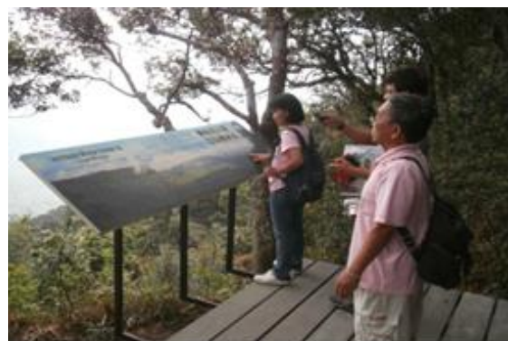
ภาพที่ ๔-๔ บริเวณจุดชมทิวทัศน์ผาเดียวดายและป้ายสื่อความหมายบริเวณเบื้องหน้าจุดชมวิว