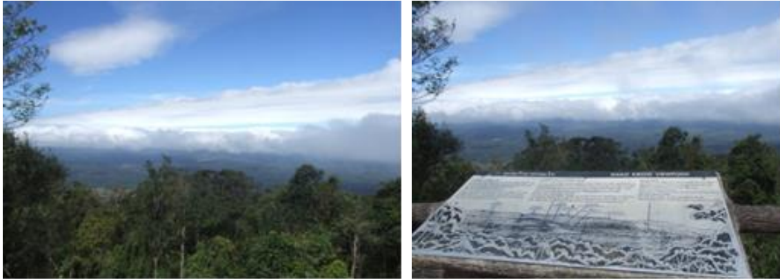
ภาพที่ ๔-๕ บริเวณจุดชมวิวิทิวทัศน์ เขาเขียว และป้ายสื่อความหมายวิวิทิวทัศน์ที่เห็นเบื้องหน้า

(๒.๒) จุดชมทิวทัศน์เขาเขียว (ผาตรอมใจ) เป็นจุดชมทิวทัศน์ที่อยู่เลยจุดชมวิวดาเดียวดาย ถึงทางเข้าของศูนย์เรดาร์ของกองทัพอากาศ เป็นจุดที่สามารถเห็นส่วนต่างๆ ของเขาใหญ่ทางด้านที่ทำการอุทยานฯ เช่น บ้านพักโซนธารน้ำร้อน หุบถ้ำมอสิงโต ค่ายเยาวชนสุรัสวดี และหุบถ้ำหนองผักชี ในฤดูฝนระหว่างกันยายน – ตุลาคม มักจะพบผีเสื้อกลางคืนมาชุมนุมกันให้เห็นมากมายตามต้นไม้ (ภาพที่ ๔-๕)