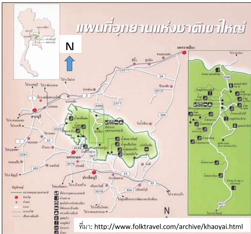
ภาพที่ ๔-๑ แผนที่อุทยานแห่งชาติเขาใหญ่และเส้นทางการเดินทาง

อุทยานแห่งชาติเขาใหญ่เป็นอุทยานแห่งชาติแห่งแรกของประเทศไทย โดยได้ประกาศในราชกิจจานุเบกษา เล่ม ๗๙ ตอน ๘๖ เมื่อวันที่ ๑๘ กันยายน พ.ศ. ๒๕๐๕ รวมเนื้อที่ประมาณ ๒,๑๖๘.๗๘ ตารางกิโลเมตรหรือประมาณ ๑,๓๕๕,๓๖๙.๙๖ ไร่ ครอบคลุมพื้นที่บางส่วนของ ๔ จังหวัด คือ จังหวัดนครราชสีมา จังหวัดนครนายก จังหวัดสระบุรี และจังหวัดปราจีนบุรี (กรมอุทยานแห่งชาติฯ, ๒๕๔๙) ตั้งอยู่บนเทือกเขาพนมดงรัก ระหว่างเส้นรุ้งที่ ๑๔ องศา ๗ ลิปดา ถึง ๑๔ องศา ๓๑ ลิปดาเหนือ และระหว่างเส้นแวงที่ ๑๐๑ องศา ๗ ลิปดา ถึง ๑๐๑ องศา ๕๔ ลิปดาตะวันออก หรือบริเวณขอบด้านทิศตะวันตกเฉียงใต้ของที่ราบสูงโคราช (ภาพที่ ๔-๑)