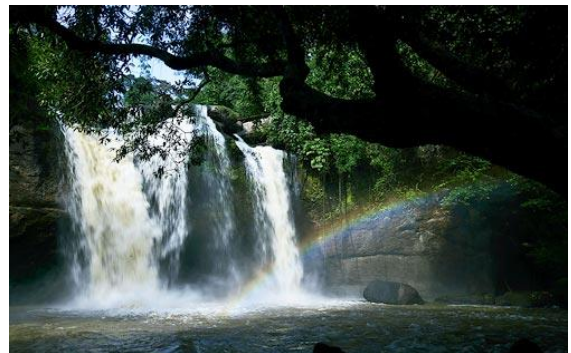
ภาพที่ ๔-๒ ป้ายบอกสถานที่น้ำตกเหวสุวัตและน้ำตกเหวสุวัต

(๑.๒) น้ำตกเหวนรก เป็นน้ำตกขนาดใหญ่และสูงที่สุดของภาคกลาง อยู่ตอนใต้ของอุทยานแห่งชาติเขาใหญ่ เป็นป่าต้นน้ำของเขื่อนขุนด่านปราการชล ไหลลงสู่จังหวัดนครนายก ไปรวมกับแม่น้ำปราจีนบุรี กลายเป็นแม่น้ำบางปะกง น้ำตกมีทั้งหมด ๓ ชั้น ความสูงรวมประมาณ ๑๘๐ เมตร เป็นแหล่งท่องเที่ยวที่มีศักยภาพและความพร้อมในการเป็นแหล่งท่องเที่ยวเชิงนิเวศสูงมาก พื้นที่อยู่ท่ามกลางผืนป่าดงดิบที่อุดมสมบูรณ์ มีความหลากหลายทางชีวภาพ สามารถพบเห็นสัตว์ป่า และนกได้ง่ายมาก สภาพโดยรวมมีการพัฒนาไปมากแล้ว ได้แก่ ลานจอดรถยนต์ ห้องน้ำ ห้องสุขา ร้านอาหารของที่ระลึก ศาลาเอนกประสงค์ และเส้นทางเดินป่าแบบเดินไปกลับทางเดิมที่มีบางช่วงมีความลาดชันสูง