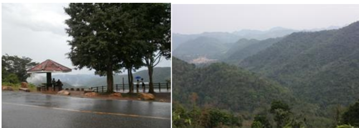
ภาพที่ ๔-๖ บริเวณจุดชมวิวิทิวทัศน์ กม. ๓๐ และวิวิทิวทัศน์เบื้องหน้าจากจุดชมวิวกม. ๓๐

(๒.๓) จุดชมวิวกม.ที่ ๓๐ ถนนธารน้ำร้อน เป็นจุดชมทิวทัศน์จุดแรกบนถนนธารน้ำร้อน ที่ขึ้นมาด้านอำเภอปากช่อง ถนนเส้นนี้สร้างขึ้นเมื่อ พ.ศ. ๒๕๐๓ แยกจากถนนมิตรภาพสู่อยอดเขาเขียว ซึ่งเป็นปีเดียวกับปีที่ก่อตั้งอุทยานแห่งชาติเขาใหญ่ จุดชมวิวยู่ที่ระดับความสูง ๖๘๐ เมตรจากระดับน้ำทะเลปานกลาง จุดชมทิวทัศน์แห่งนี้ก็คือช่วงรอยต่อทางนิเวศวิทยา (Ecotone) ระหว่างสังคมป่าเบญจพรรณกับสังคมป่าดงดิบแล้ง มองเห็นทิวทัศน์ด้านทิศเหนือของอุทยานแห่งชาติเขาใหญ่อยอดเขาต่างๆ ที่ปรากฏจากสายตาเป็นส่วนใหญ่ที่อยู่นอกพื้นที่อุทยานแห่งชาติเขาใหญ่ เรียงจากซ้ายไปขวา ได้แก่ เขาแผงม้า เขาวังหิน เขาผาแดง เขาริวหัว และเขาแสงดำ ส่วนด้านหน้าเป็นเขาตำดิน ชุมชนที่ปรากฏต่อสายตาก็คือ หมู่บ้านท่ามะปร่างอยู่เบื้องหน้า (ภาพที่ ๔-๖)