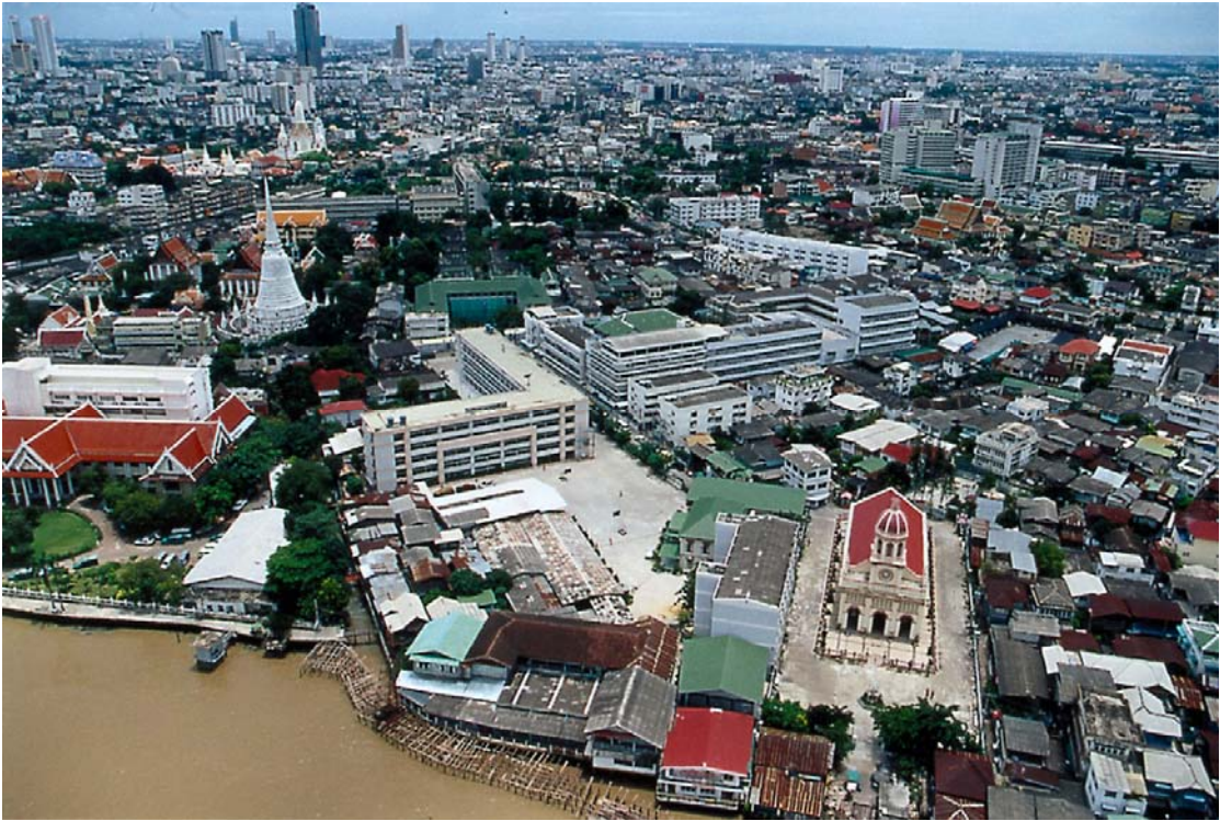
ภาพที่ 1 รูปถ่ายชุมชนกุฎีจีนทางอากาศ ที่มา : กองจัดรูปที่ดินและปรับปรุงฟื้นฟูเมือง, สำนักผังเมือง. แผนที่เขตบางกอกใหญ่