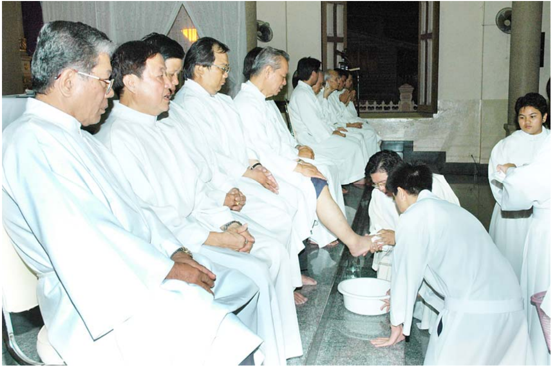
ภาพที่ 3.11 งานพิธีล้างเท้าวันพฤษภาคมที่สภาศักดิ์สิทธิ์