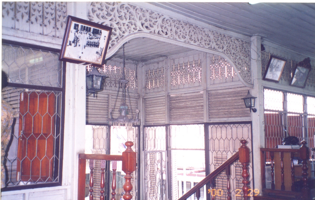
ภาพที่ 13 - 14 อาคารสมาคมสนธิอิสลาม