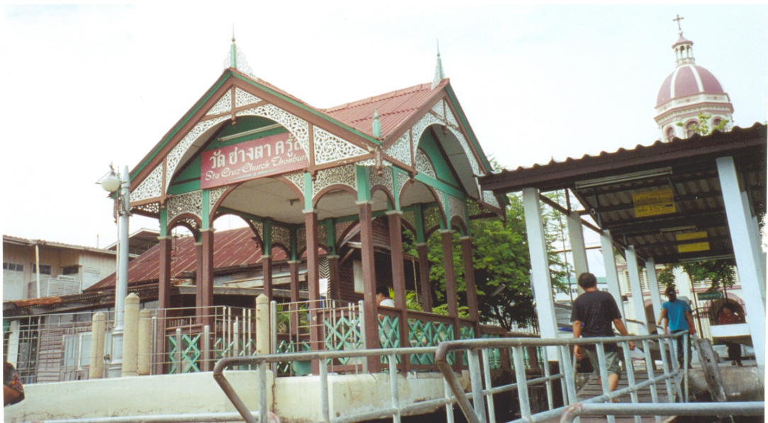
ภาพที่ 4.2 – 4.3 ท่าเรือวัดช่างศาครุฑ อยู่ติดกับ โรงเรียนอนุบาลแสลงอรุณ