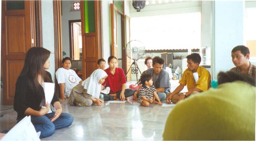
ภาพที่ 2.26 การประชุมเวทีชาวบ้านที่กุฎีเจริญพาศน์