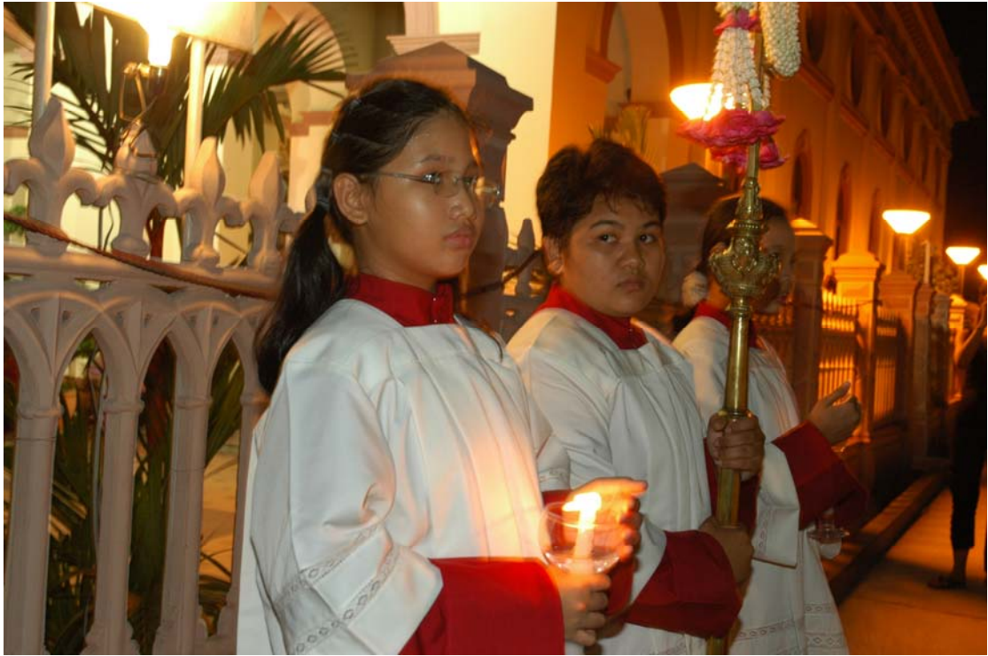
ภาพที่ 3.5 พิธีถอดพระวันศุกร์ศักดิ์สิทธิ์