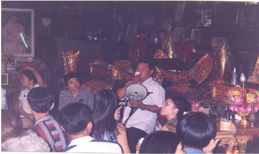
ภาพที่ 7 บ้านจางวางทั่ว หรือบ้านตระกูลพาทยโกศล