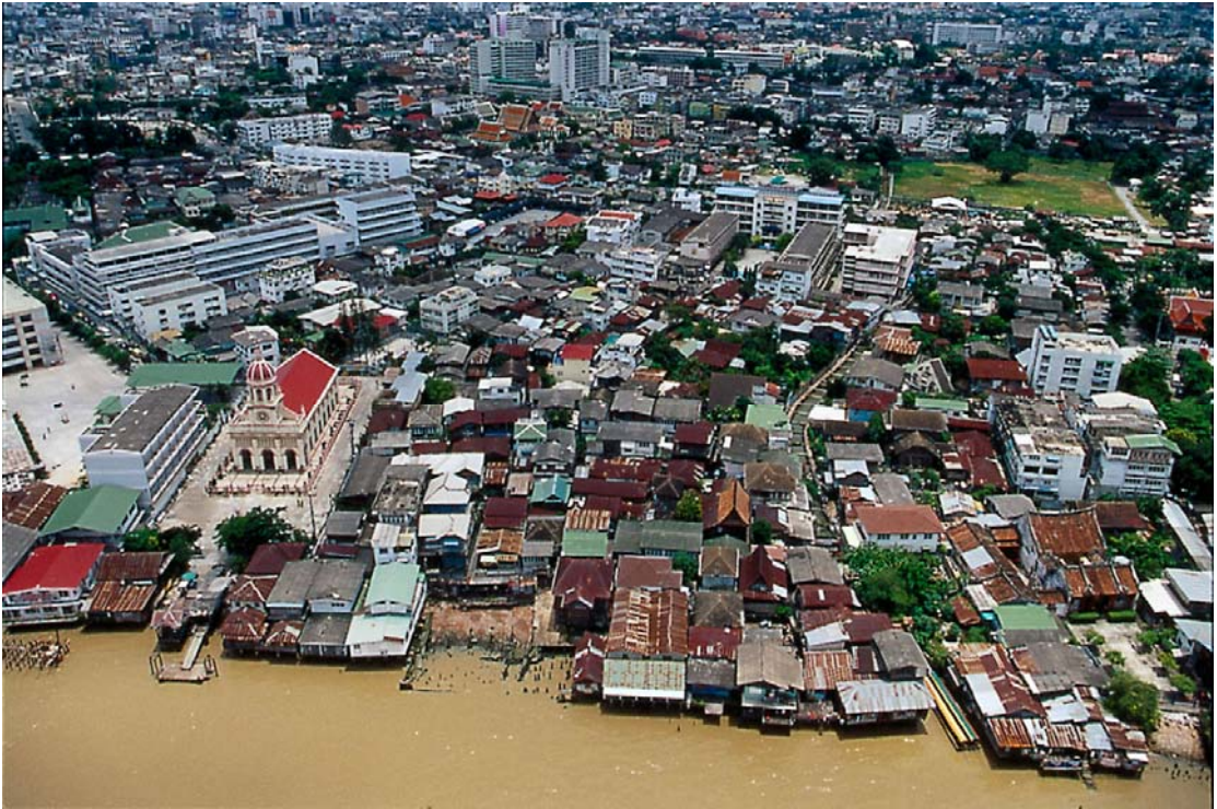
ภาพที่ 1 รูปถ่ายชุมชนกุฎีจีนทางอากาศ