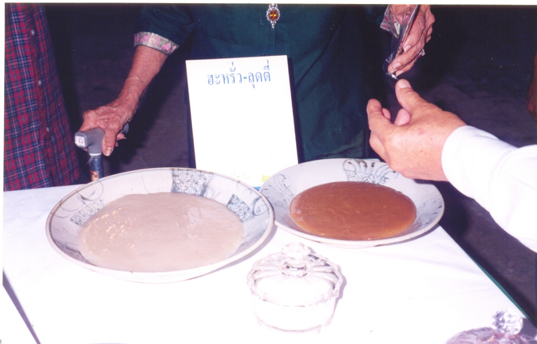
ภาพที่ 30 ชะหริ่มและลุดตี

ชะหริ่มห่อด้วยแผ่นลุดตีที่ทำจากแป้งข้าวเจ้า นำไปต้มพอสุก แบ่งแบ่งเป็นลูกกลม ๆ นำมานวดด้วย พลองเป็นแผ่นกลมบางเสมอกัน จากนั้นนำไปปิ้งบนกระทะจนสุก