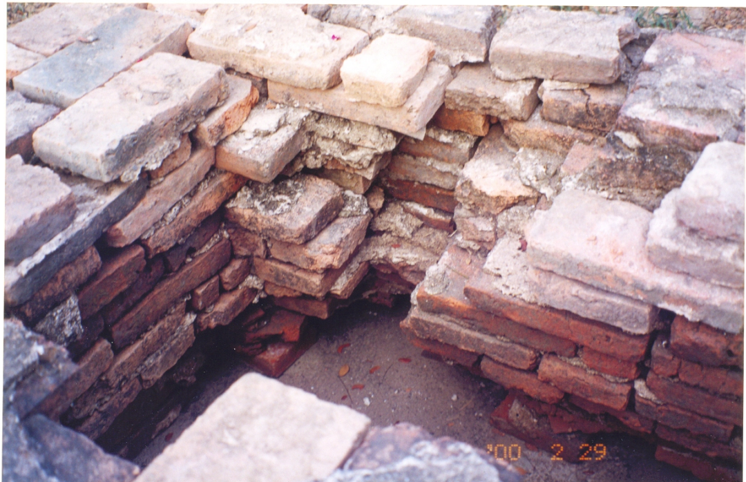
ภาพที่ 16 – 17 สุสานประวัติศาสตร์ สุสานหรือกุโบร์ของมัสยิดต้นสน เป็นสุสานประวัติศาสตร์ที่สำคัญของชาวมุสลิมสายสุหนี่และชีอะห์ในประเทศไทย ด้วยเป็นที่ฝังร่างของจุฬาราชมนตรีทั้ง 9 ท่าน ในสมัยต้นรัตนโกสินทร์ และบุคคลสำคัญ ๆ ชาวมุสลิมที่รับราชการในราชสำนัก ทั้งฝ่ายในและขุนนางกรมกองต่าง ๆ ไม่ว่าจะเป็นเจ้าจอมหงส์ ในรัชกาลที่ 1 เจ้าพระยาจักรี (หมุด) สมุหนายกสมัยกรุงธนบุรี พระยาราชบังสัน (ฉิม) แม่ทัพเรือสมัยรัชกาลที่ 1