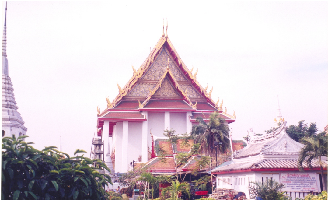
ภาพที่ 3 อุโบสถวัดกัลยาณมิตรวรมหาวิหาร