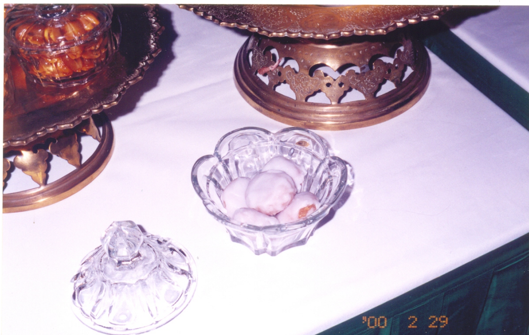
ภาพที่ 31 ขนมห

แป้งกรอกหรือขนมหกรอก ทำด้วยแป้งข้าวเจ้าผสมกับน้ำสุก เติมน้ำใบเตยให้เข้ากัน ใส่สี เหลืองจากหญ้าฝรั่นหรือขมิ้นผง แล้วตัดเป็นส่วนทลงร้อนในกระทะร้อนให้เป็นแผ่นกลม เมื่อแป้ง