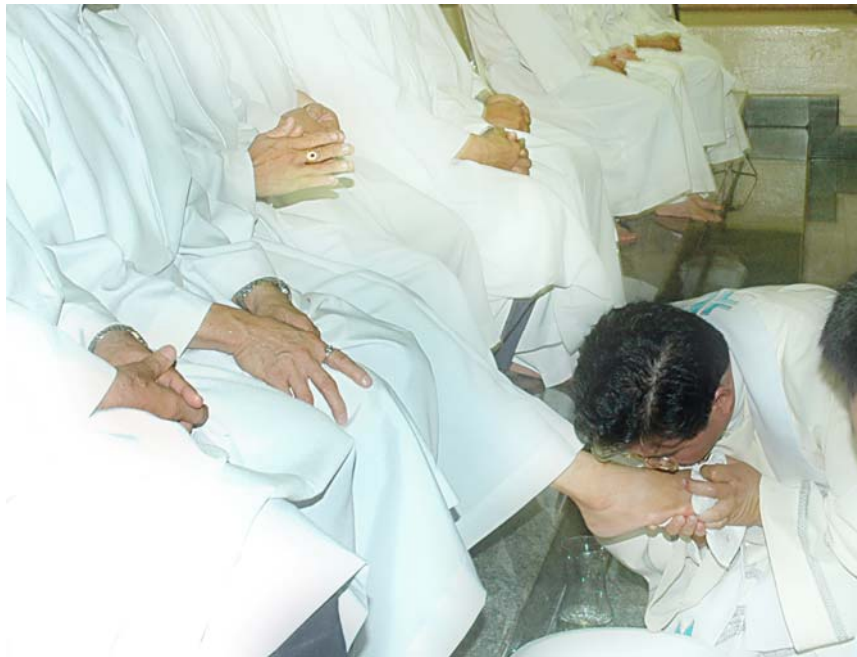
ภาพที่ 3.12 งานพิธีล้างเท้าวันพฤษภาคมที่สภาศักดิ์สิทธิ์