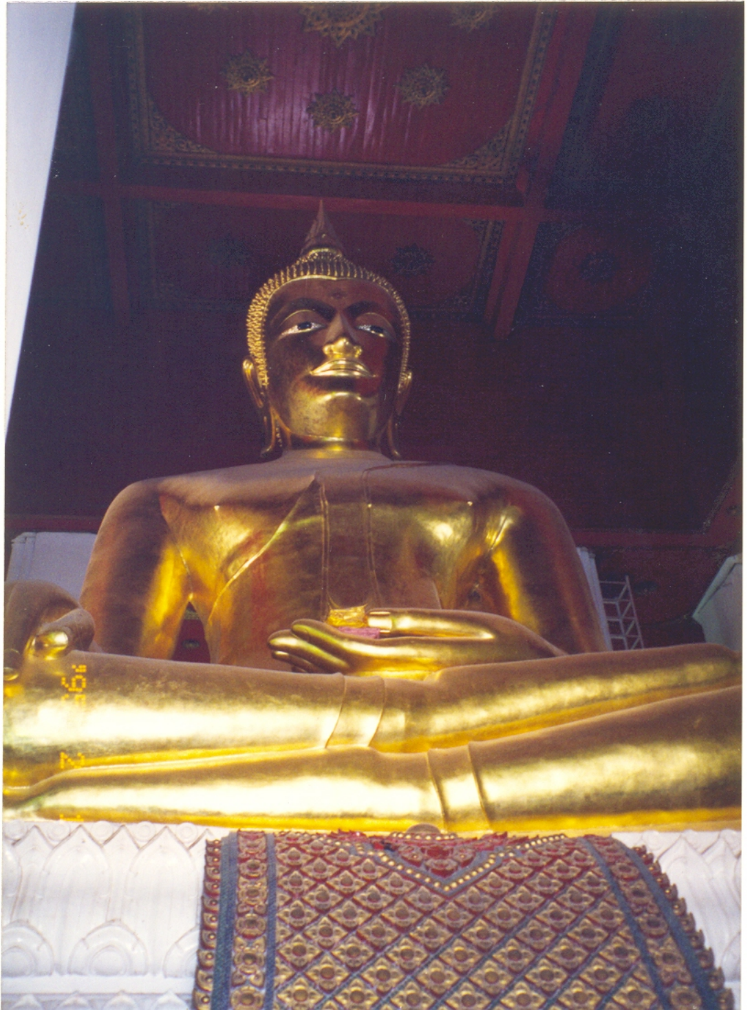
ภาพที่ 4.81 หลวงพ่อชาป่าอง