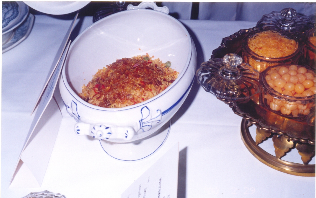
ภาพที่ 27 ข้าวหุง

ข้าวหุง ถ้าใส่ไก่หมกไว้ก้นหม้อ จะเรียกว่า ข้าวหมกไก่ ถ้าไม่ใส่ไก่ หุงอย่างเทศล้วน ๆ จะเรียกว่า ข้าวบุหรี หรือ ข้าวบุเหล่า