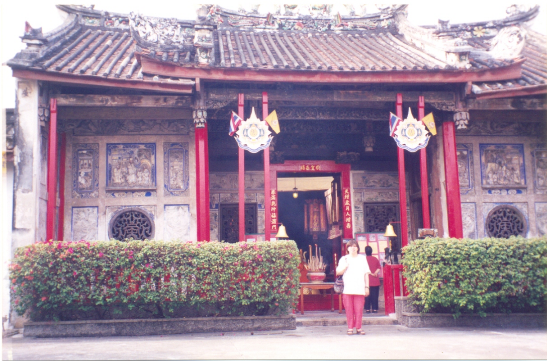
ภาพที่ 4 ศาลเจ้าเกียนอันกง หรือศาลเจ้าแม่กวงอิม