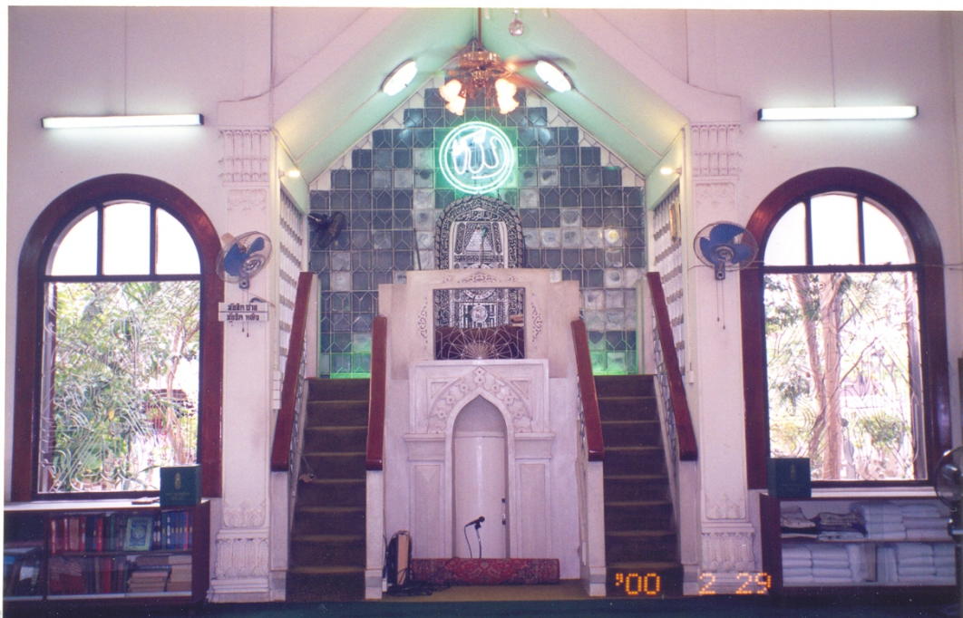
ภาพที่ 12 ที่สำหรับแสดงธรรม เรียกว่า มิมบ์ร