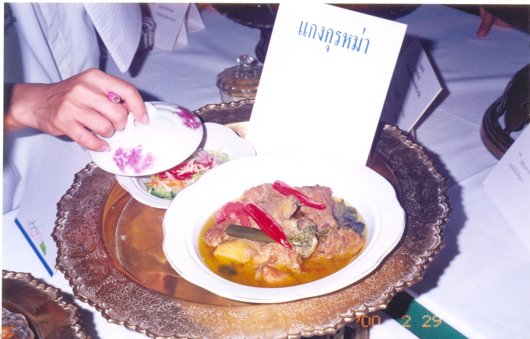
ภาพที่ 29 แกงกรุ่ม

แกงกรุ่ม เป็นแกงกะทิ คล้ายแกงมัสมั่น แต่รสชาติไม่เหมือนกัน เพราะใส่ผลอินทผลัมดิบ จึงมีรสชาติออกเปรี้ยว สีส้มเขียว พวกแขกเรียกผลอินทผลัมว่า กรุ่มว่า มีกรุ่มที่ทำจากไก่ แพะ แกะ ปลาอินทรี