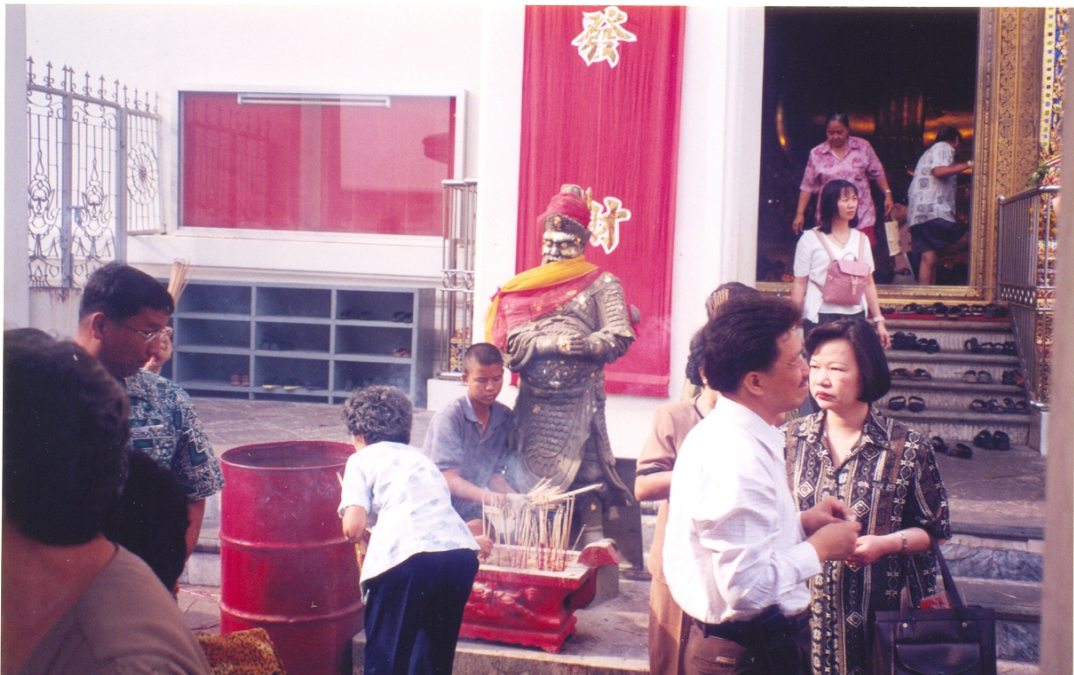
ภาพที่ 4.83 งานไหว้หลวงพ่พระพุทธรัตนนายก (เข้าปอกง) วัดกัลยาณมิตร