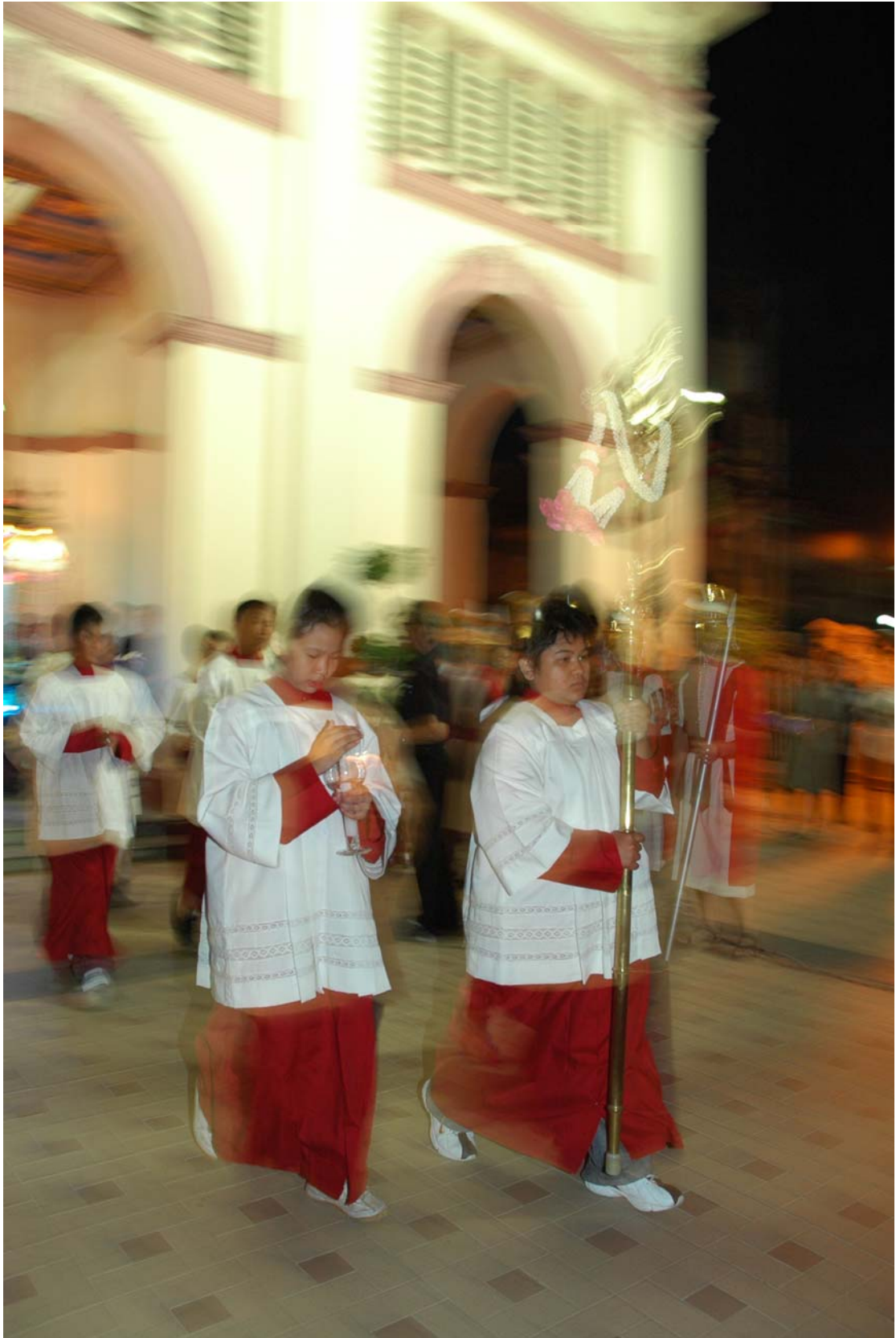
ภาพที่ 3.4 พิธีถอดพระวันศุกร์ศักดิ์สิทธิ์