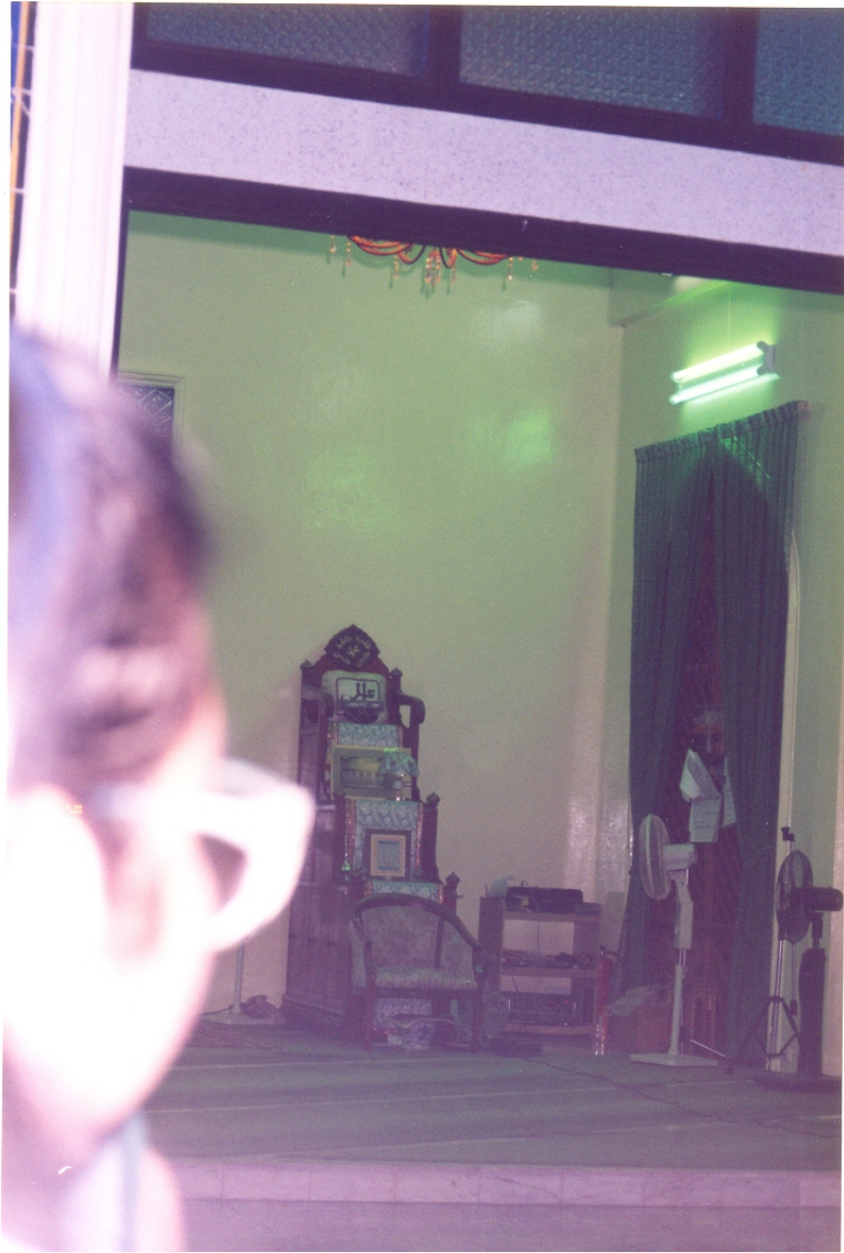
ภาพที่ 24 ภายในมัสยิดผดุงธรรมอิสลาม