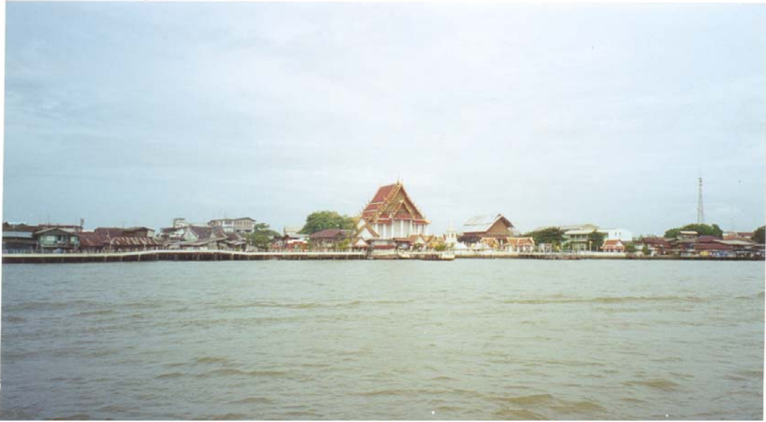
ภาพที่ 2 วัดกัลยาณมิตรวรมหาวิหาร