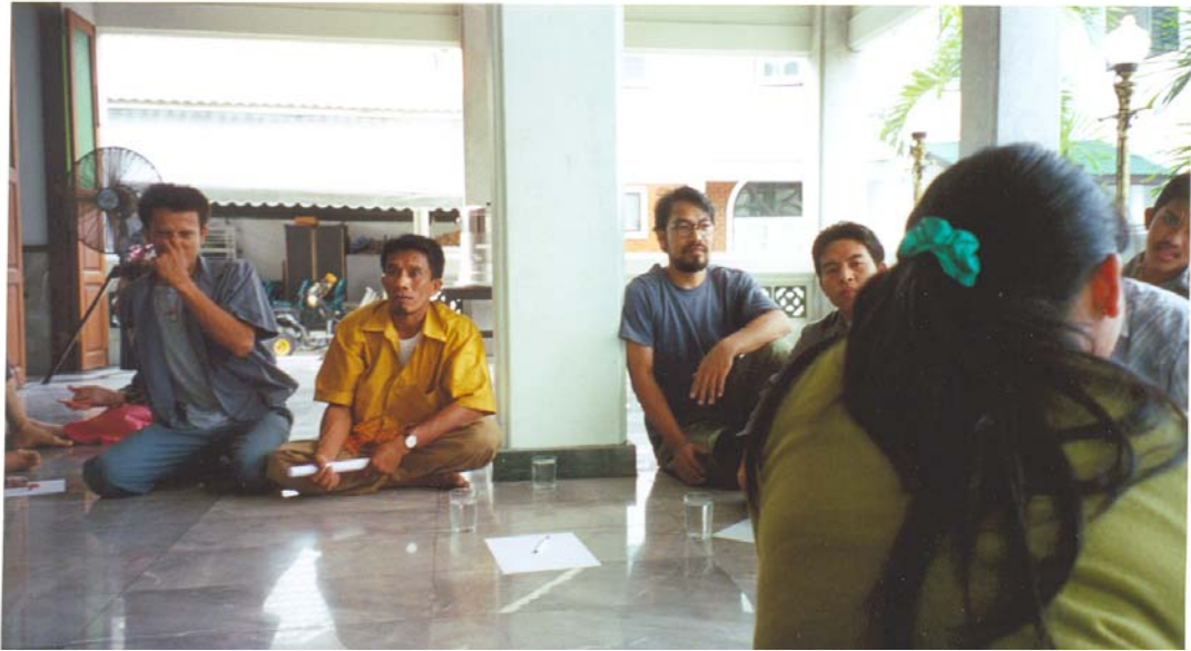
ภาพที่ 2.28 การประชุมเวทีชาวบ้านที่กุฎิเจริญพาศน์