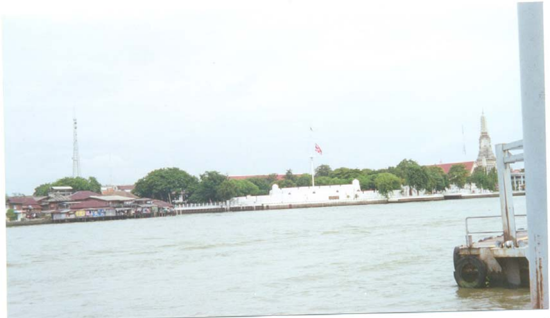
ภาพที่ 10 ป้อมวิชัยประสิทธิ์ เดิมชื่อ ป้อมวิชัยนทร์ หรือ ป้อมบางกอก