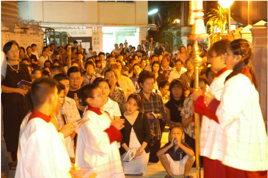
ภาพที่ 3.6 งานถอดพระวันศุกร์ศักดิ์สิทธิ์