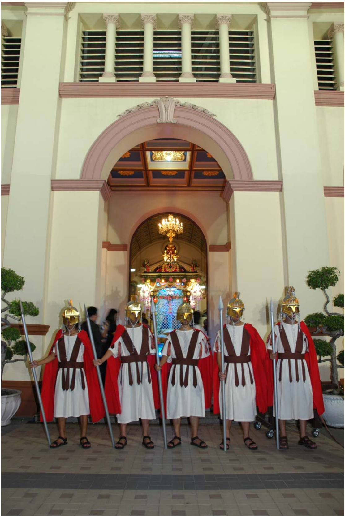
ภาพที่ 3.3 ทหารเฝ้าโบสถ์