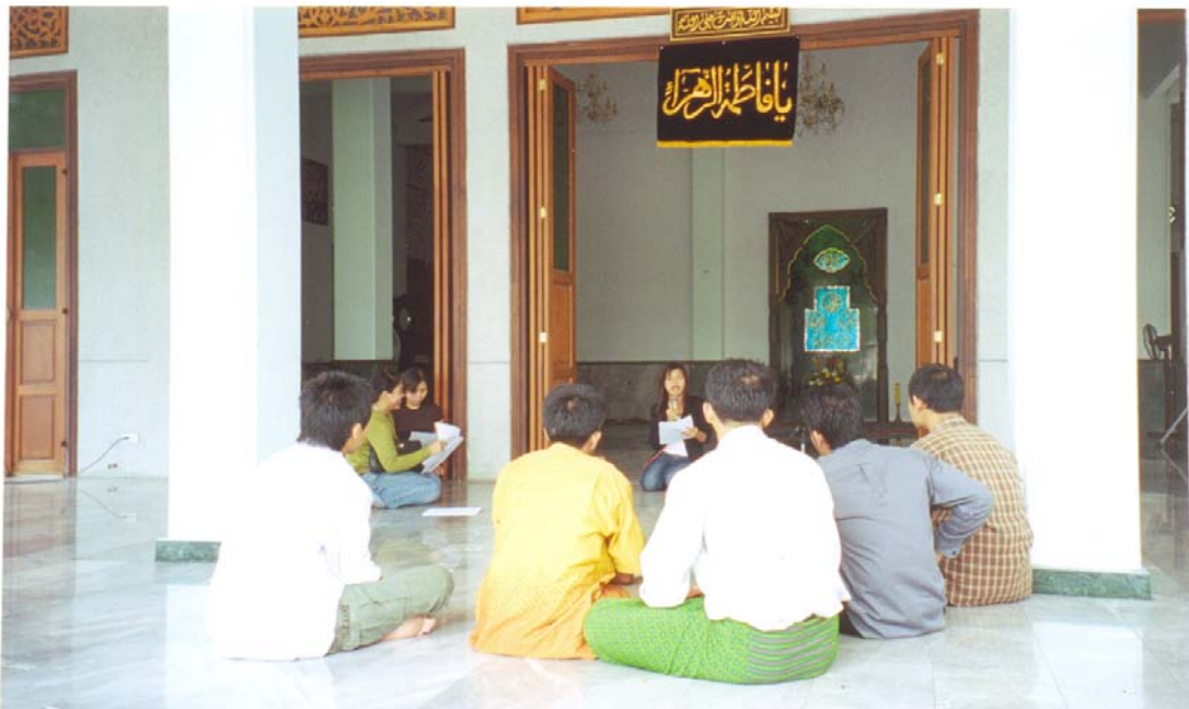
ภาพที่ 2.27 การประชุมเวทีชาวบ้านที่กุฎีเจริญพาศน์