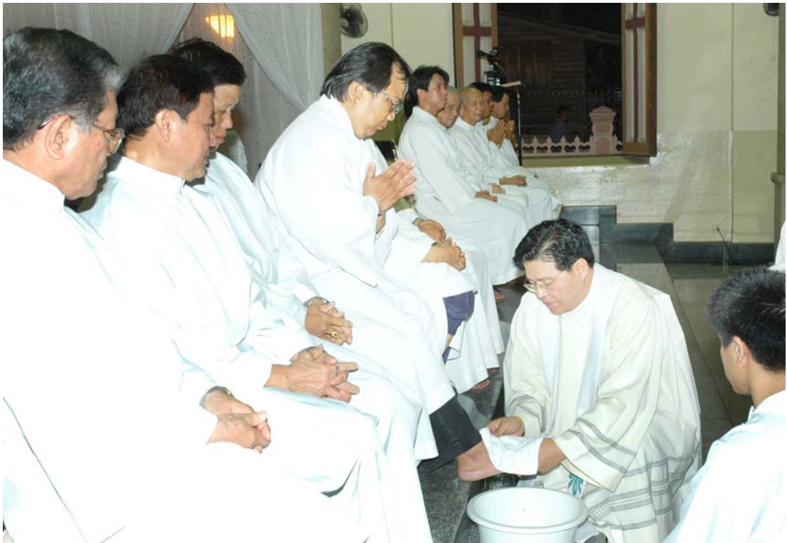
ภาพที่ 3.8 งานพิธีล้างเท้าวันพฤหัสบดีศักดิ์สิทธิ์