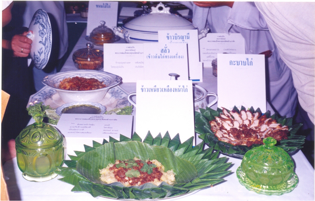
ภาพที่ 26 อาหารอิสลาม

ข้าวหุง ถ้าใส่ไก่หมกไว้ก้นหม้อ จะเรียกว่า ข้าวหมกไก่ ถ้าไม่ใส่ไก่ หุงอย่างเทศล้วน ๆ จะเรียกว่า ข้าวบุหรี หรือ ข้าวบุเหล่า