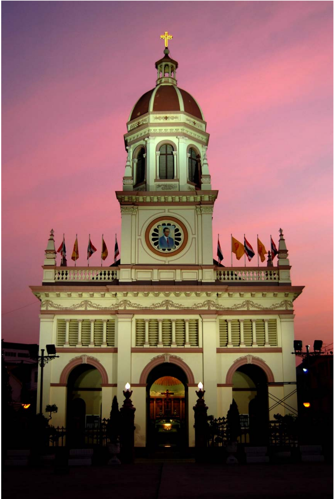
ภาพที่ 5 วัดซางตาครู้สสยามเย็น