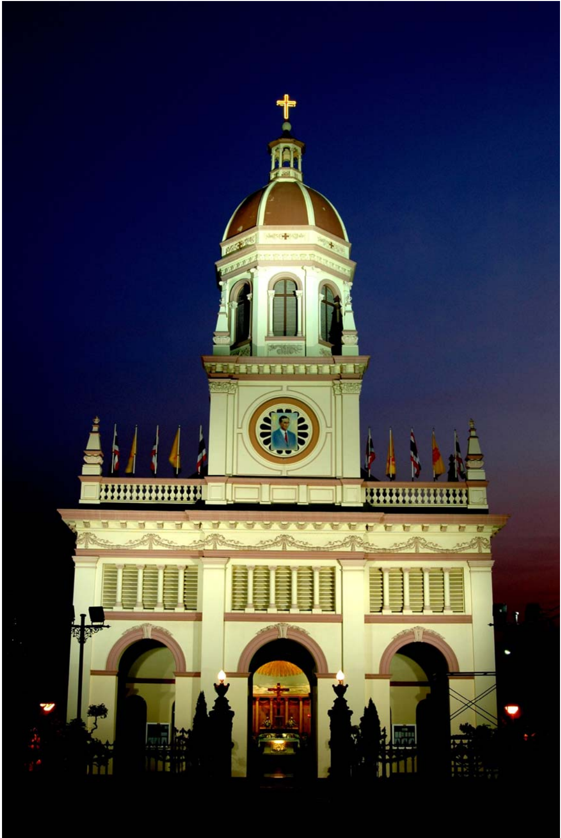
ภาพที่ 6 วัดซางตาครู้สสยามเก่า