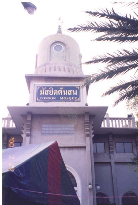
ภาพที่ 11 มัสยิดตันสน หรือกุฎีใหญ่