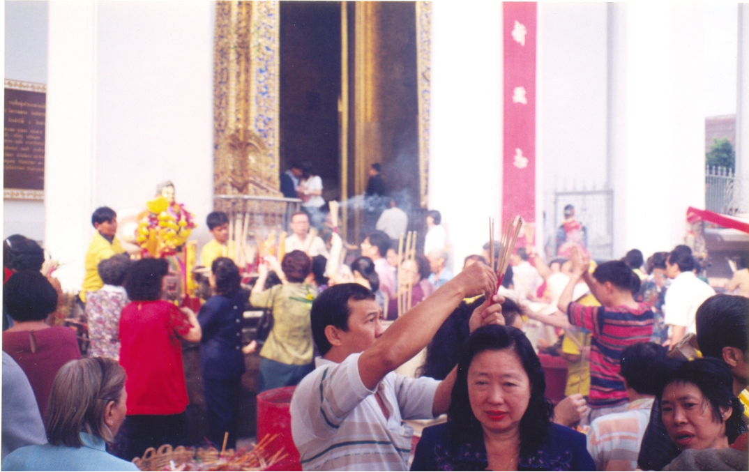
ภาพที่ 4.82 งานไหว้หลวงพ่พระพุทธรัตนนายก (เข้าปอกง) วัดกัลยาณมิตร