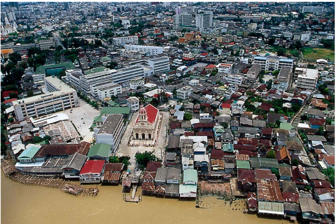
ภาพที่ 1 รูปถ่ายชุมชนกุฎีจีนทางอากาศ