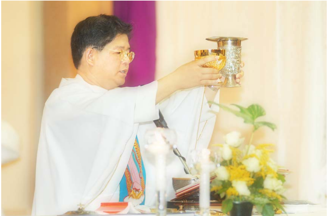
ภาพที่ 3.7 งานพิธีล้างเท้าวันพฤหัสบดีศักดิ์สิทธิ์