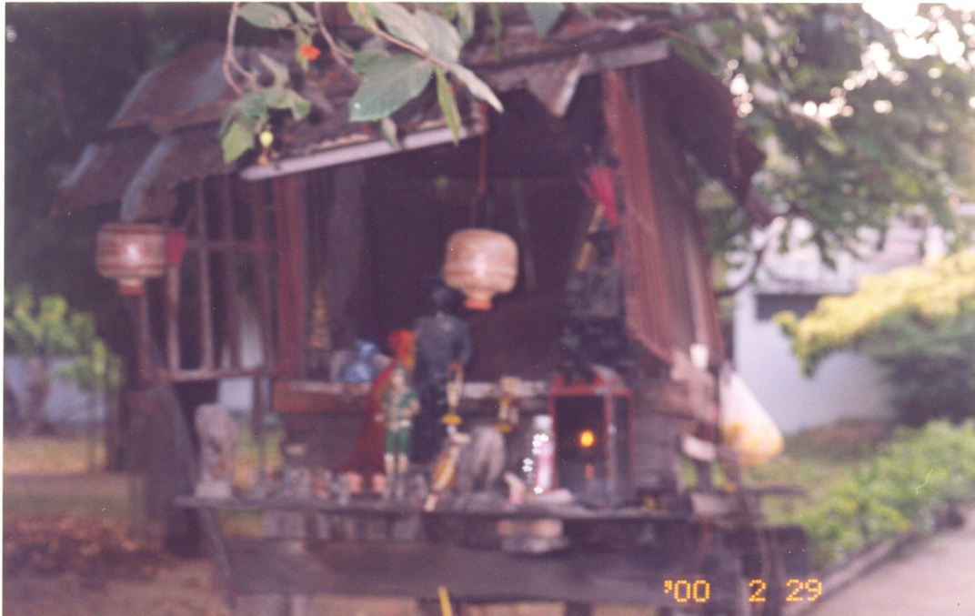
ภาพที่ 18 ศาลสมเด็จพระเจ้าตากสินมหาราช หรือ ศาลสมเด็จพระเจ้ากรุงธนบุรี มหาราช

ในปี พ. ศ. 2325 มีการสำเร็จโทษสมเด็จพระเจ้าตากสินที่บริเวณท้ายวัง (พระราชวังเดิม) ติดกับวัดท้ายตลาดและป้อมวิไชยประสิทธิ์ ได้มีการนำพระศพของพระองค์ไปลงบรรจุในขันสาครซึ่งเป็นขันน้ำขนาดใหญ่ ไปลงเรือที่คลองสุดเขตวัดหงสาวราม เพื่อนำพระศพไปยังวัดบางยี่เรือ ได้ เกิดเหตุพระโลหิตตกลงพื้น ตามคติโบราณเชื่อว่า พระโลหิตของพระเจ้าแผ่นดินตกลง ณ ที่ใด ก็จะต้องตั้งศาลขึ้นเพื่อแสดงความเคารพบูชา ในตอนนั้นจึงมีการตั้งศาลพระเจ้าตากสินขึ้นที่บริเวณริมคลองดังกล่าว ศาลพระเจ้าตากสินตั้งอยู่โคนต้นโพธิ์ริมคลอง ปัจจุบันศาลได้ถูกสร้างขึ้นใหม่โดยย้ายออกห่างจากตำแหน่งเดิม