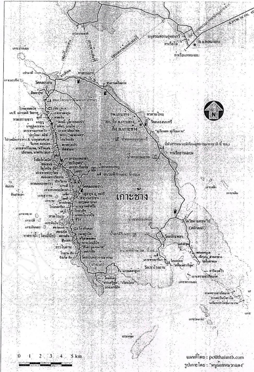
ภาพที่ 1.2 แผนที่ตั้งเกาะช้าง จังหวัดตราด