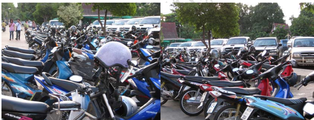
ภาพที่ 12 บรรยากาศที่จอดรถไม่เพียงพอ

นักท่องเที่ยวมีความคิดเห็นว่าสิ่งอำนวยความสะดวกบริเวณถนนคนเดินยังมีไม่เพียงพอ อย่างเช่น สถานที่จอดรถ ตู้ ATM จุดนั่งพักผ่อน และห้องสุขา