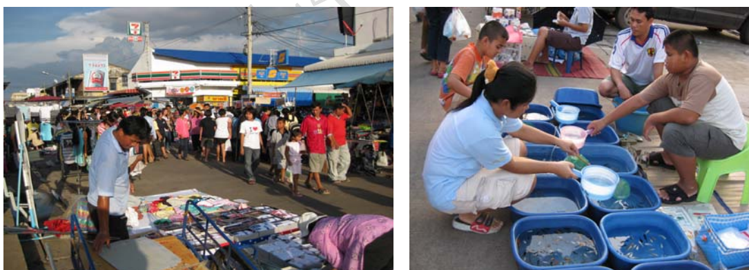
ภาพที่ 1 บรรยากาศการสร้างมูลค่าทางเศรษฐกิจ