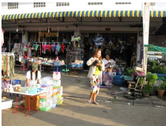
ภาพที่ 9 กลุ่มผู้ที่อาศัยอยู่ในพื้นที่เข้าร่วมโครงการ