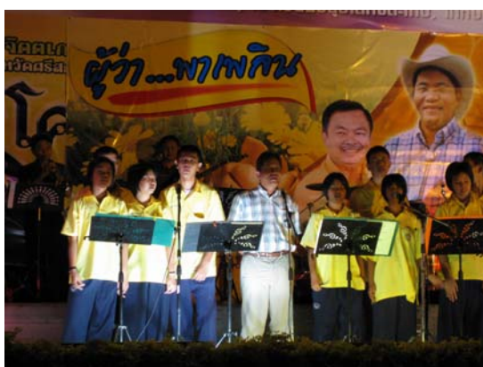
ภาพที่ 4 การแสดงผู้ว่า พาเพลิน

ถนนคนเดินศรีสะเกษจะมีกลุ่มนันทนาการช่วยสร้างสีสัน ให้แก่โครงการถนนคนเดิน ซึ่งกลุ่มนันทนาการส่วนใหญ่จะเป็นคนท้องถิ่นจังหวัดศรีสะเกษ ทุกเพศ ทุกวัย โดยนักเรียนและผู้สูงอายุส่วนใหญ่จะเป็นกลุ่มศิลปินพื้นเมือง ส่วนนักศึกษาและคนทำงานส่วนใหญ่จะเป็นกลุ่มศิลปินดนตรีสากล กลุ่มจิตรกร และกลุ่มนักแสดง ซึ่งสาเหตุหรือแรงจูงใจ ในการมาเข้าร่วมโครงการถนนคนเดินของศิลปินอิสระแต่ละกลุ่ม แต่ละคน ได้แก่ ต้องการรายได้ ต้องการนำเงินไปทำกิจกรรม ต้องการแสดงความสามารถ และต้องการขายผลงานของตน โดยศิลปินอิสระที่มาแสดงที่ถนนคนเดิน จะมีมาทั้งที่มาเป็นกลุ่มและมาเดี่ยว ซึ่งศิลปินอิสระที่มาเดี่ยวมักจะทำการแสดงที่ใช้อุปกรณ์หรือเครื่องดนตรีที่พกพามาง่าย ส่วนศิลปินอิสระที่มาเป็นกลุ่มมักจะจัดแสดงเป็นวงโดยใช้เครื่องดนตรีหลายชิ้นบรรเลงร่วมกัน ซึ่งศิลปินอิสระเหล่านี้มักจะทำการแสดงประเภทการเล่นดนตรีสากล การเล่นดนตรีพื้นเมือง การรำ การจัดแสดงผลงานและขายผลงานศิลปะ