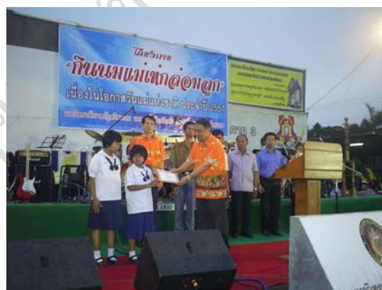
ภาพที่ 5 กิจกรรมวันแม่แห่งชาติ