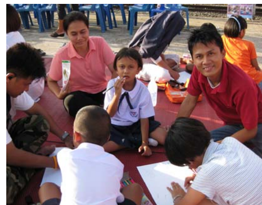
ภาพที่ 7 กิจกรรมวันครอบครัว