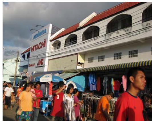
ภาพที่ 10 บรรยากาศบ้านเรือนผู้ที่อาศัยอยู่ในพื้นที่