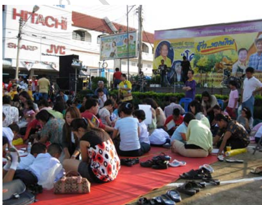
ภาพที่ 6 กิจกรรมการวาดภาพ