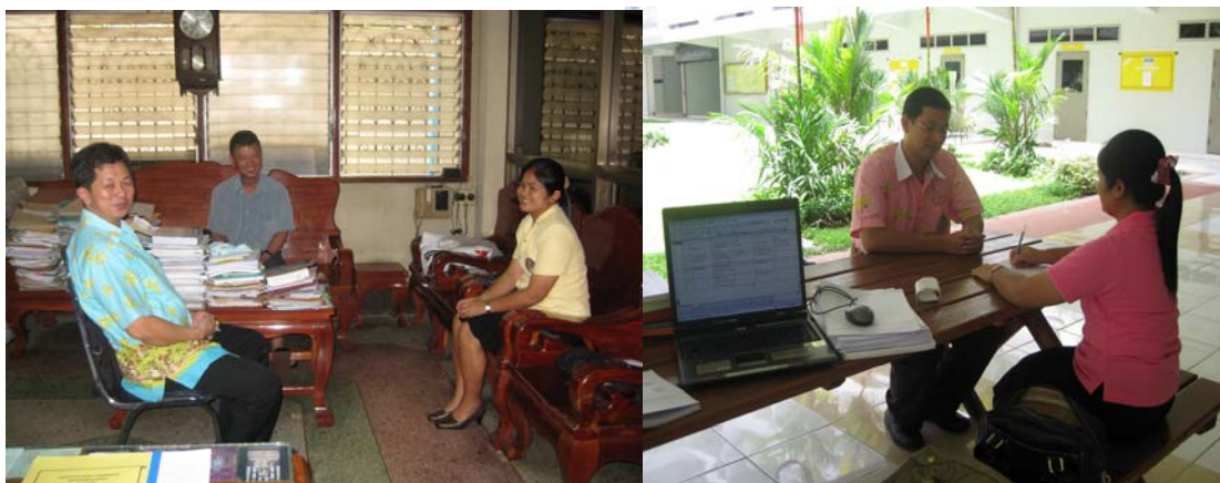
ภาพที่ 11 การสัมภาษณ์ คณะผู้บริหารจัดการโครงการถนนคนเดิน