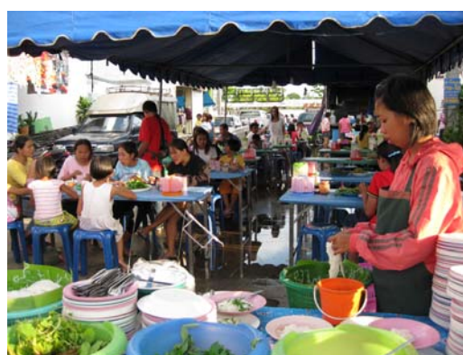
ภาพที่ 3 กลุ่มค้าขายอาหาร