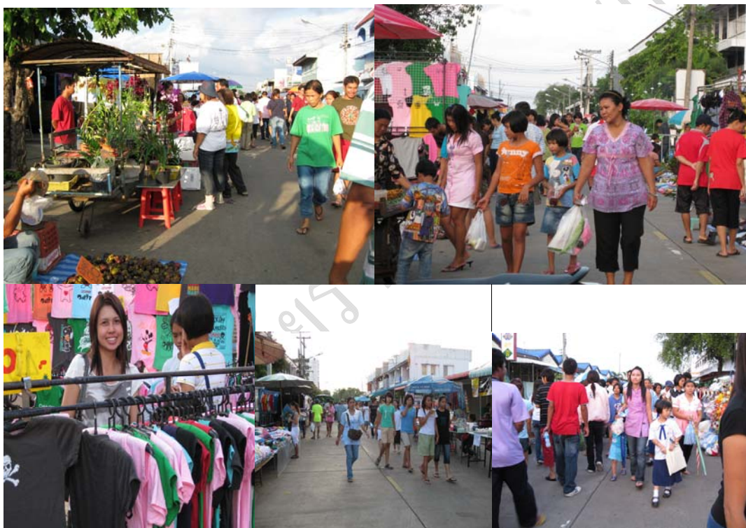
ภาพที่ 10 ประมวลภาพกลุ่มนักท่องเที่ยว และคนท้องถิ่นเดินเลือกซื้อสินค้า

นักท่องเที่ยวชอบบรรยากาศที่เป็นกันเองของผู้ประกอบการในถนนคนเดิน ชอบที่ได้เห็นวิถีชีวิต และวัฒนธรรมของคนท้องถิ่น และชอบบรรยากาศที่ดูสนุกสนานจากการสร้างสีสันของกลุ่มนันทนาการ