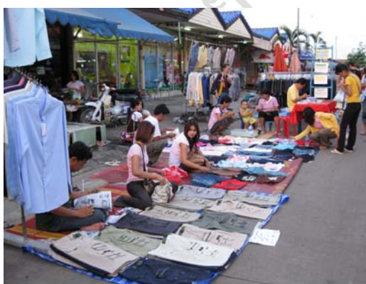
ภาพที่ 2 กลุ่มค้าขายเสื้อผ้าสำเร็จรูป

ในส่วนของ การมีส่วนร่วมในกิจกรรมนั้นจากการศึกษาพบว่า ผู้ประกอบการส่วนใหญ่มีส่วนร่วมในโครงการถนนคนเดิน โดยให้ความร่วมมือในทุก ๆ ด้านเป็นอย่างดี ทั้งด้านสินค้าที่นำมาจำหน่าย การร่วมแต่งกายให้สุภาพ และการเข้าร่วมประชุมกับทางคณะกรรมการ แต่ก็ยังมีผู้ประกอบการอีกส่วนหนึ่งที่ไม่ค่อยให้ความร่วมมือ และไม่ค่อยมีส่วนร่วมในการเข้าร่วมประชุมกับทางคณะกรรมการถนนคนเดิน