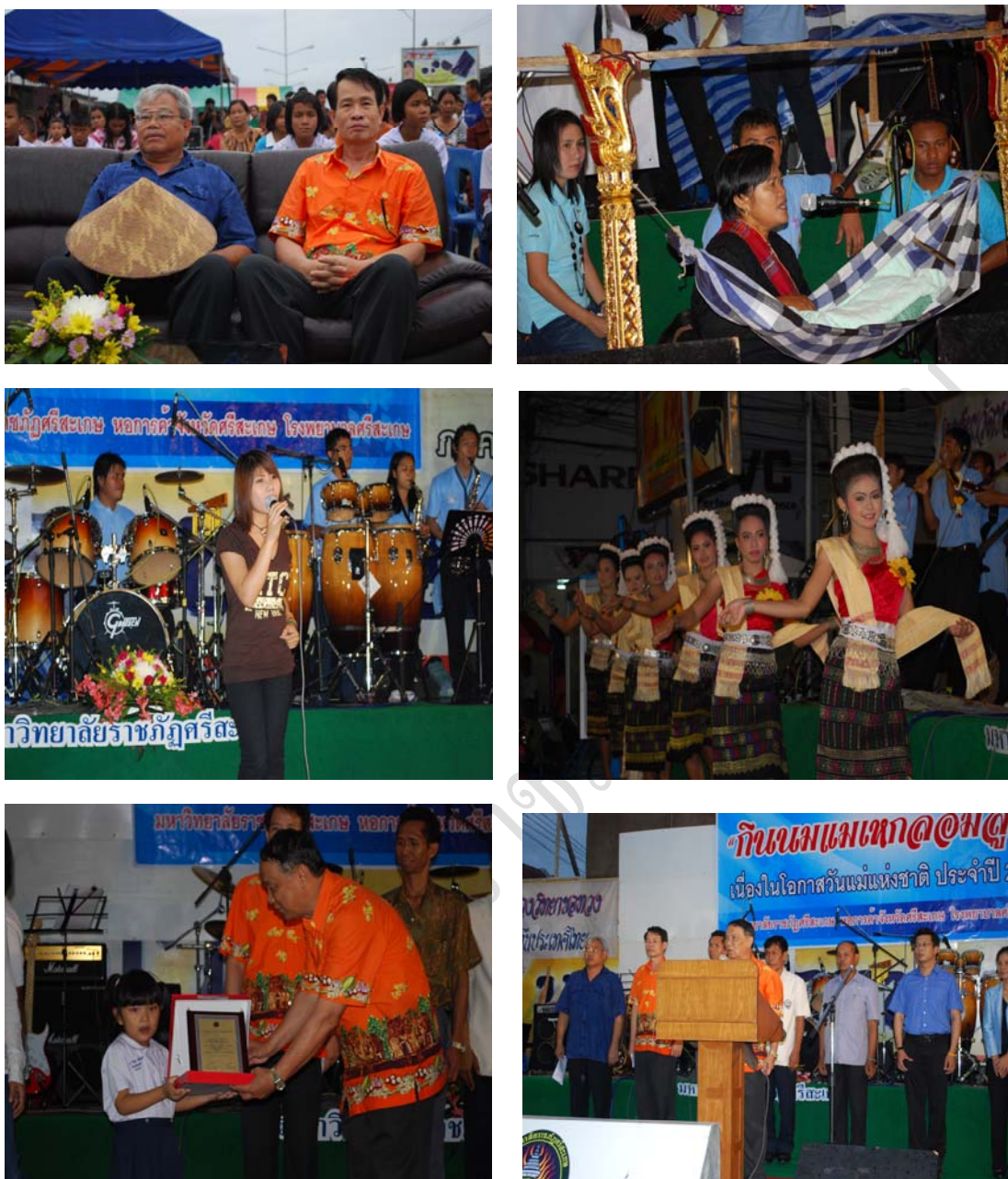
ภาพที่ 8 บรรยากาศการแสดงกิจกรรมสันตนาการบนเวที