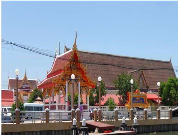
ภาพที่ 4.3 : บริเวณด้านหน้าวัดศาลวัน