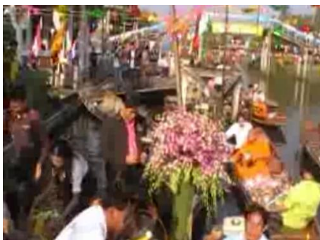
ภาพที่ 4.9 : การตักบาตรท้องน้ำ

พญง เอี่ยมเลื่อนาม สัมภาษณ์ 15 มกราคม 2555