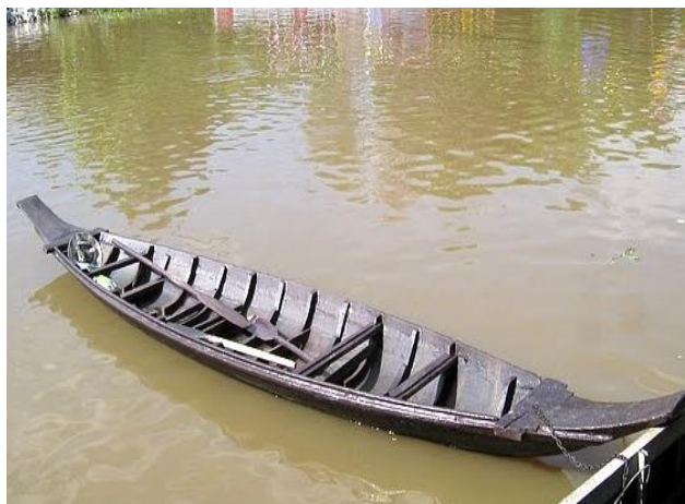
ภาพที่ 4.10 : เรือมาด

ศาลายา ได้เสนอให้กลับมาจัดอีกครั้ง ร่วมกับการแข่งขันกีฬาของชุมชน และได้มีการพัฒนาการแข่งขันจากการแข่งขันเฉพาะในชุมชนมาเป็นการแข่งขันแบบทีมซึ่งอาจมาจากต่างท้องถิ่นก็ได้ แต่สิ่งหนึ่งที่ชาวชุมชนยังคงสวมนไว้สำหรับชาวชุมชนศาลายาเท่านั้น คือการแข่งขันเรือประเพณีตลกขบขัน “หัวใบ้ท้ายบอด” ซึ่งเป็นการแข่งขันที่สร้างสีสัน ความตลกขบขัน ตลอดจนความรักความสามัคคีให้กับชาวชุมชน ทำให้ประเพณีนี้ยังคงสืบทอดกันมาและคงอยู่ต่อไป