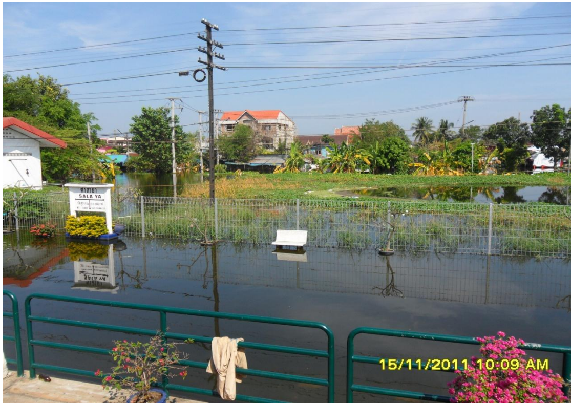
สภาพน้ำท่วมในพื้นที่ศาลายาเมื่อปลายปี 2554