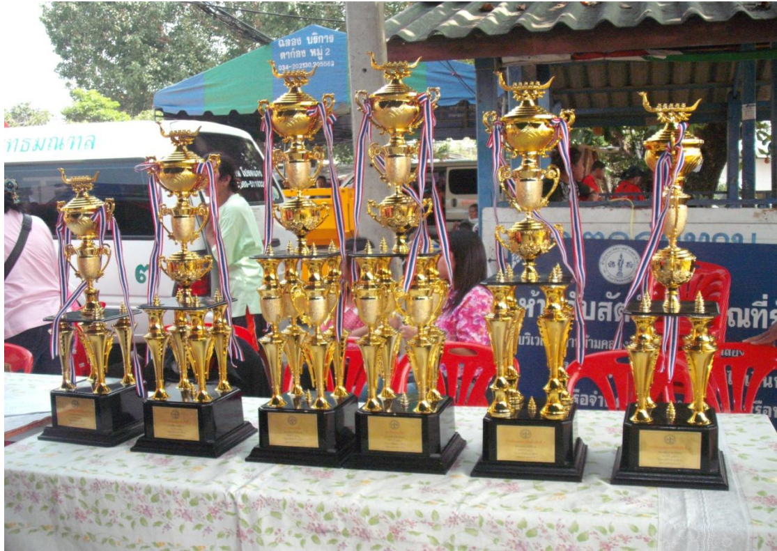
ประเพณีแข่งเรือ ประจำปี 2553