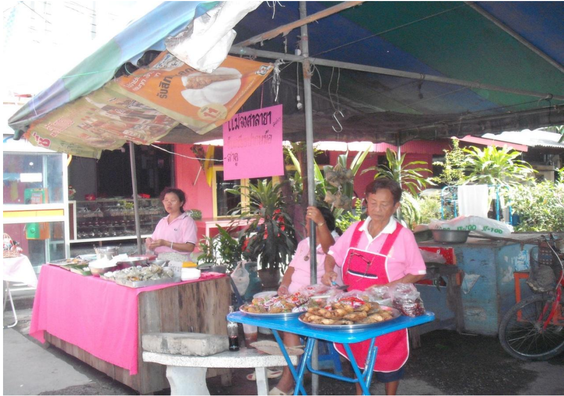
การออกร้านขายสินค้าของชาวมุขมณฑลสาละยาในประเพณีแข่งเรือ