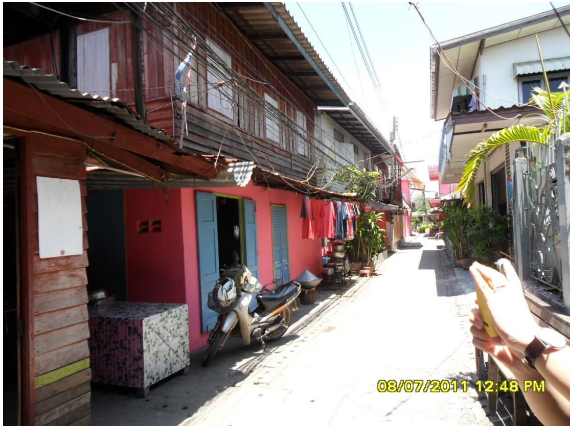
สภาพทั่วไปของชุมชนศาลายา