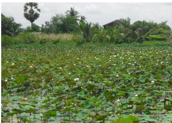
ภาพที่ 4.5 : นาบัว หนึ่งในอาชีพของชาวศาลายา

เนื่องจากในอดีตการสัญจรทางน้ำยังมีความสำคัญอยู่มาก โดยเฉพาะในพื้นที่ศาลายา บริเวณตลาดเก่าศาลายาจะเป็นท่าขนส่งผู้โดยสารที่เดินทางมาเพื่อต่อรถยนต์โดยสาร หรือรถไฟ แต่ในปัจจุบันเมื่อคนส่วนใหญ่มีการเปลี่ยนวิธีการสัญจรจากทางน้ำไปใช้การสัญจรทางบกทำให้ตลาดเก่าศาลายาแห่งนี้ซบเซา คนในชุมชนส่วนหนึ่ง จึงได้ย้ายกิจการไปขายในตลาดใหม่ที่มีผู้ซื้อมากกว่าและอยู่ติดถนนใหญ่ สะดวกต่อการมาจับจ่ายซื้อของ