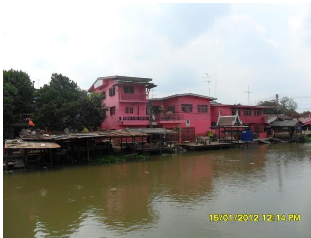
ภาพที่ 4.4 : บริเวณชุมชนศาลايا