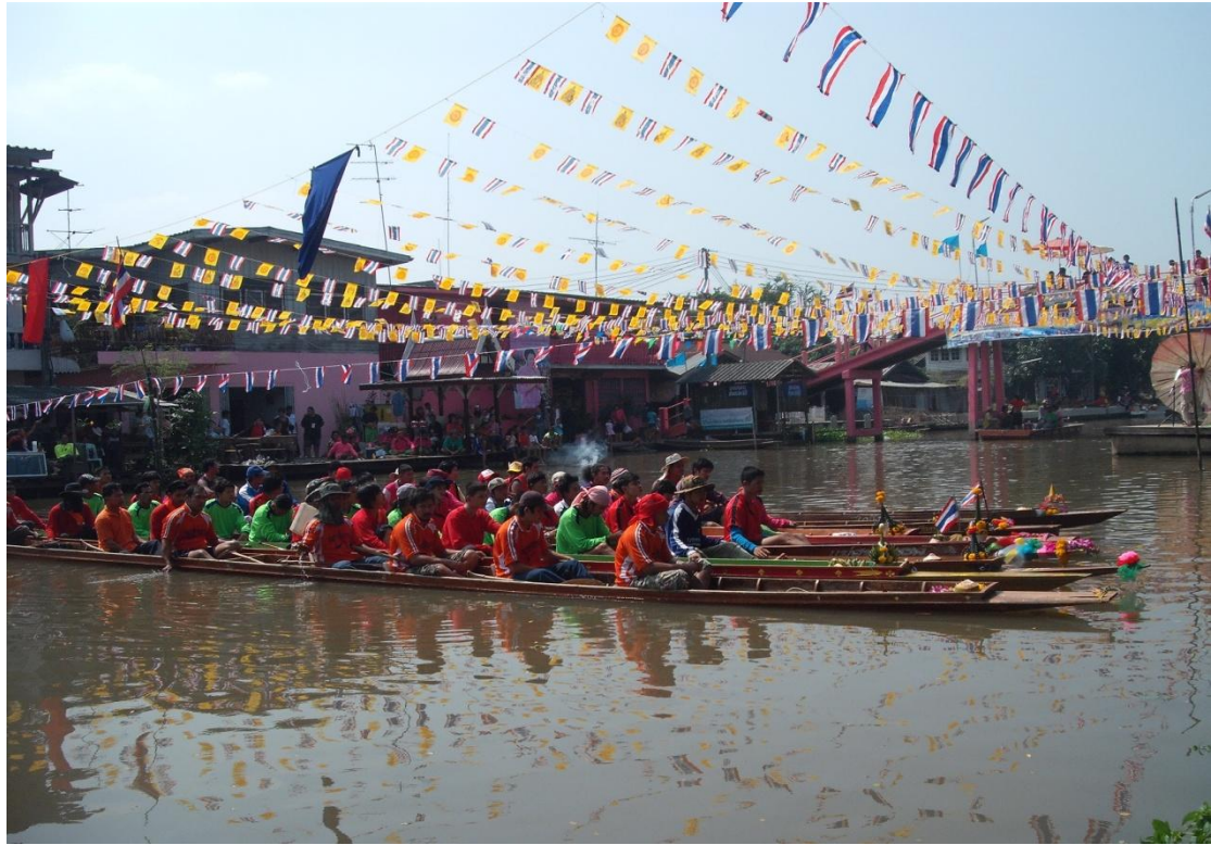
ประเพณีแข่งเรือ ประจำปี 2553