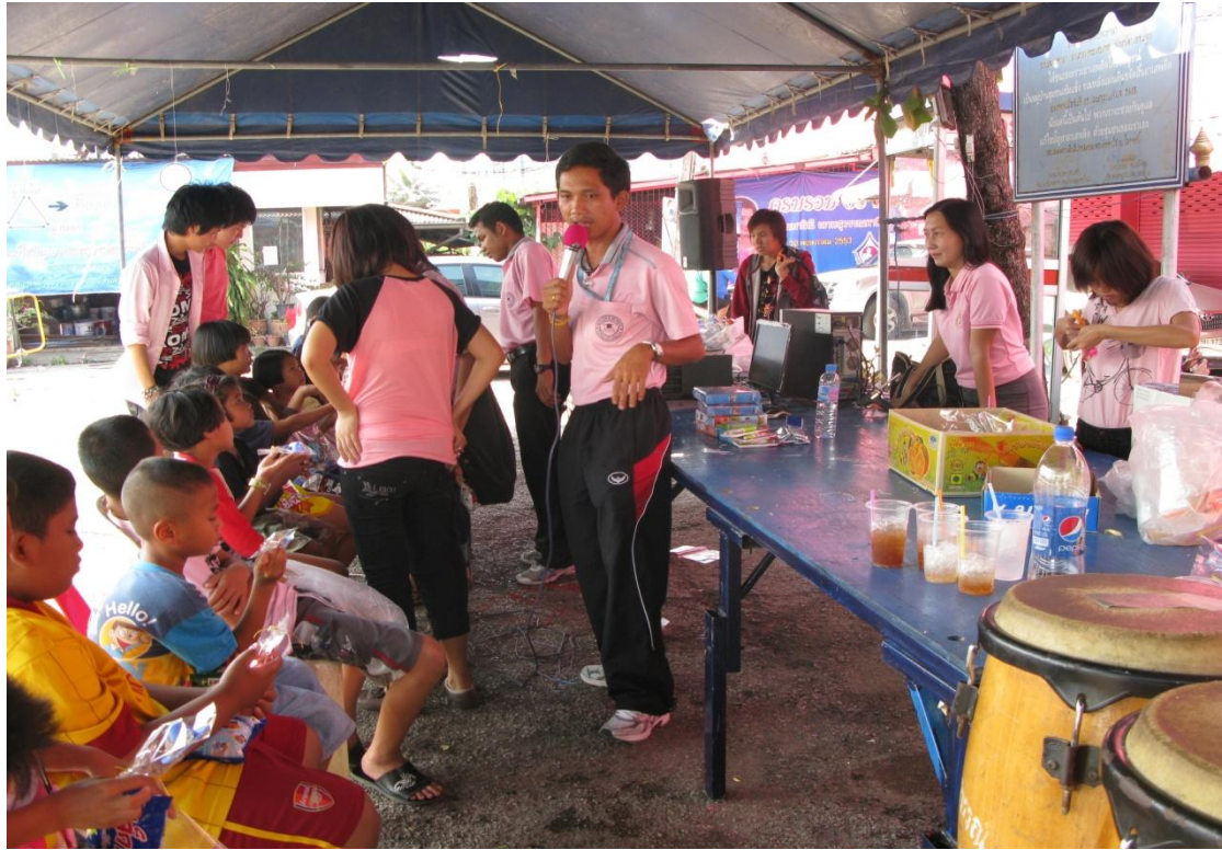
จัดกิจกรรมบริการวิชาการให้เยาวชนในชุมชนศาลายา