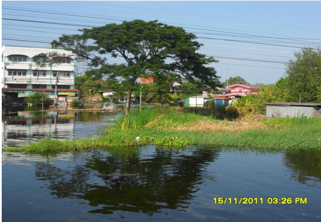
สภาพน้ำท่วมในพื้นที่ศาลาयाเมื่อปลายปี 2554