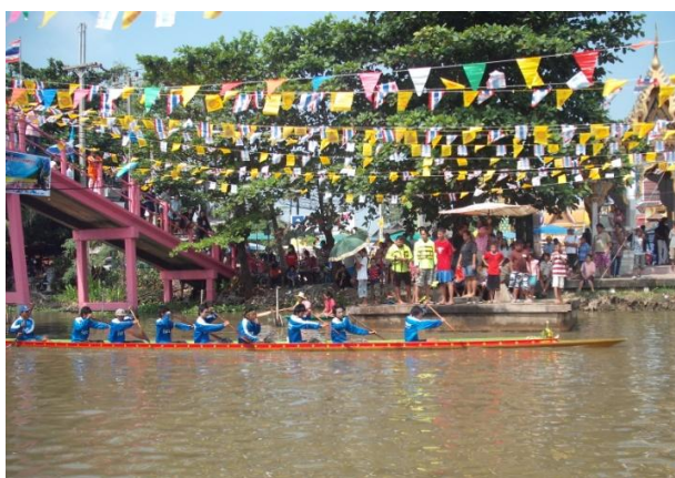
ภาพที่ 4.7 : ประเพณีการแข่งเรือในงานวันทอดกฐิน ณ คลองมหาสวัสดิ์ หน้าวัดศาลวัน

ดวงเดือน จิรสัตยาภรณ์ สัมภาษณ์ 15 มกราคม 2555