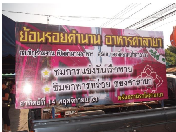
ภาพที่ 4.8 : ป้ายโฆษณาเชิญชวนเข้าร่วมงานประเพณีการแข่งเรือในงานวันทอดกฐิน ณ คลองมหาสวัสดิ์ หน้าวัดศาลวัน