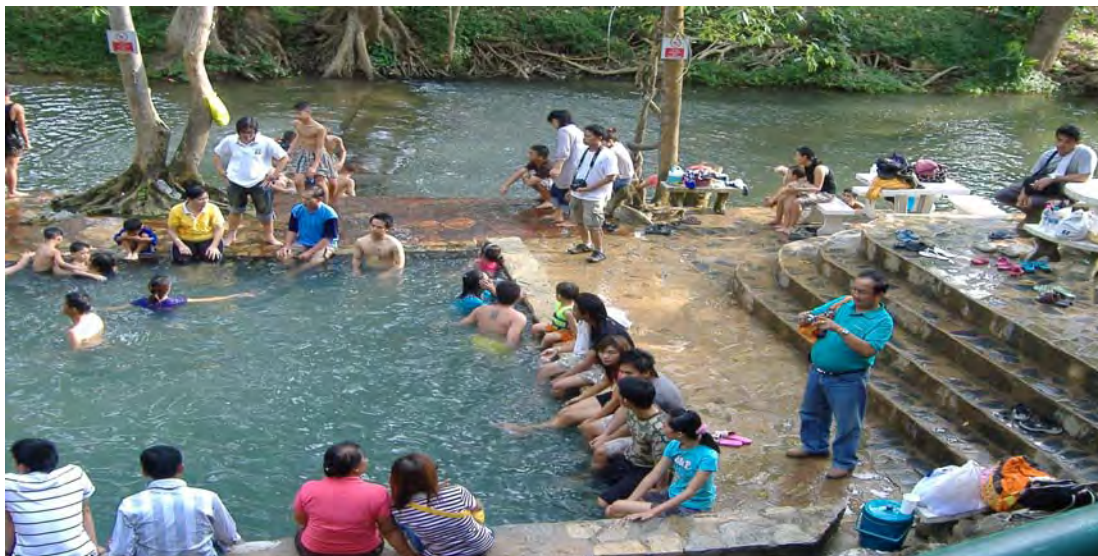
ภาพที่ 2 บ่อน้ำพุร้อนหินดาดซึ่งอยู่ติดลำธารน้ำจากน้ำตกผาดาด