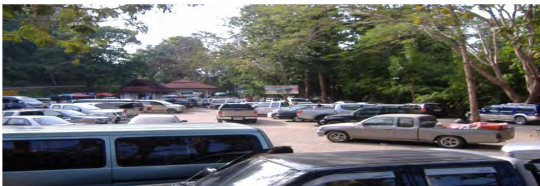
ภาพที่ 4 ลานจอดรถบริเวณแหล่งท่องเที่ยว น้ำพุร้อนหินดาด

6. ลานจอดรถ ตำแหน่งที่ตั้งของลานจอดรถบริเวณแหล่งท่องเที่ยว น้ำพุร้อนหินดาดมีความเหมาะสมในระดับปานกลาง เนื่องจากเป็นบริเวณที่มีเนื้อที่จำกัด ไม่สามารถขยายลานจอดรถได้ ทำให้ไม่เพียงพอต่อการให้บริการต่อนักท่องเที่ยว และไม่มีสิ่งอำนวยความสะดวกสำหรับผู้พิการบริเวณลานจอดรถ (ภาพที่ 4)