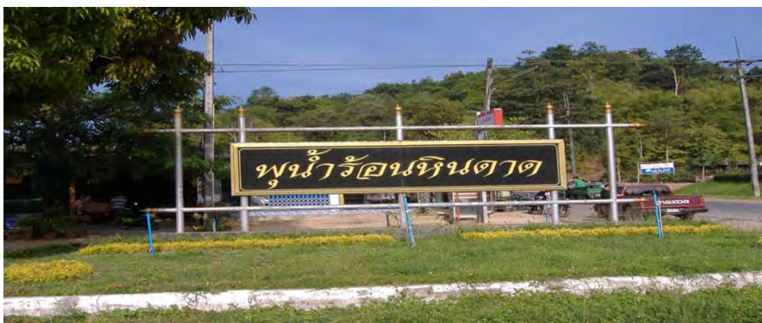
ภาพที่ 5 ป้ายบอกทางภายนอกแหล่งน้ำพุร้อนหินดาด

10. ป้ายบอกทางภายนอก พบว่าบริเวณแหล่งท่องเที่ยว น้ำพุร้อนหินดาดมีการออกแบบป้ายบอกทางภายนอกได้เหมาะสมกับพื้นที่ บริเวณที่ตั้งของป้ายบอกทางอยู่บริเวณติดถนนใหญ่ ปากทางเข้าน้ำพุร้อน 2 จุด ป้ายมีขนาดใหญ่ ขนาดตัวหนังสือเห็นได้ชัดเจน และสื่อความหมายได้ชัดเจน สำหรับบอกการเดินทางมายังแหล่งท่องเที่ยว น้ำพุร้อน ได้อย่างถูกต้อง (ภาพที่ 5)