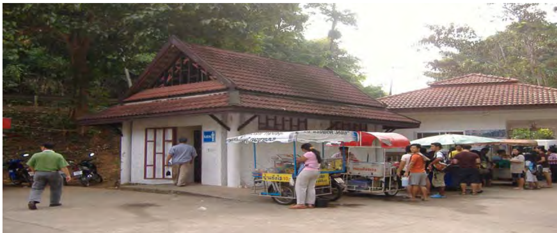
ภาพที่ 3 ห้องสุขาบริเวณลานจอดรถ ที่มา : จิรวรรณ กังน้อย, “ห้องสุขาบริเวณลานจอดรถ”, ภาพสีผสม, 5 ธันวาคม 2552.

5. ห้องสุขา ตั้งอยู่ติดกับลานจอดรถ สิ่งก่อสร้างทำจากปูน มีความคงทนถาวร สุขภัณฑ์ เป็นแบบตักราด มีจำนวนห้องสุขาไม่เพียงพอต่อการให้บริการต่อนักท่องเที่ยว คือมีจำนวนสุขาเพียง 1 แห่ง รวมห้องสุขาทั้งหมด 4 ห้อง ความสะอาดของห้องสุขาพบว่าห้องสุขาไม่สะอาด มีกลิ่นเหม็น อีกทั้งยังไม่มีห้องสุขาไว้ให้บริการสำหรับผู้พิการ ห้องสุขาบริเวณแหล่งน้ำพุร้อนหินดาดรวมทั้งหมดมี 3 จุด จุดละ 4 ห้อง (ภาพที่ 3)