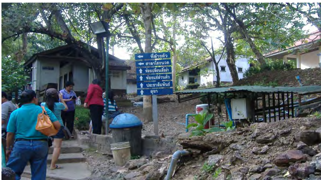
ภาพที่ 6 ห้องผลิตเปลี่ยนเสื้อผ้าบริเวณบ่อน้ำพุร้อนหินดาด

2. ห้องผลิตเปลี่ยนเสื้อผ้า พบว่าห้องผลิตเปลี่ยนเสื้อผ้าบริเวณแหล่งท่องเที่ยววน้ำพุร้อนหินดาดสร้างด้วยปูน มีความคงทนถาวร บริเวณที่ตั้งเหมาะสม อยู่ใกล้กับบ่อน้ำพุร้อน มีความสะอาด และความปลอดภัยในระดับปานกลางเนื่องจากไม่มีตู้สำหรับใส่สิ่งของไว้บริการสำหรับนักท่องเที่ยว ทำให้นักท่องเที่ยวต้องเป็นห่วงความปลอดภัยของทรัพย์สินส่วนตัว อีกทั้งจำนวนของห้องผลิตเปลี่ยนเสื้อผ้ามีเพียง 1 แห่ง รวมจำนวนห้องผลิตเปลี่ยนเสื้อผ้าทั้งหมด 8 ห้อง ไม่เพียงพอต่อการให้บริการแก่นักท่องเที่ยว (ภาพที่ 6)