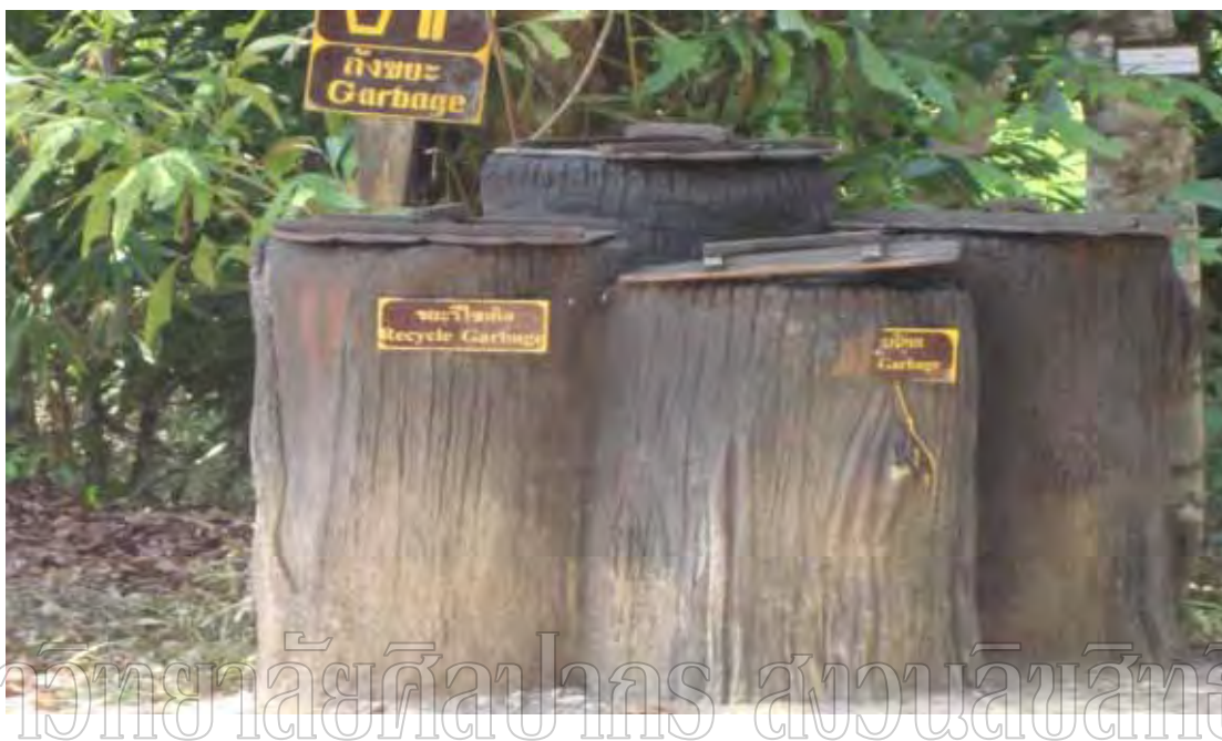
ภาพที่ 7 ถังขยะ 3 ประเภท

ส่วนเรื่องระบบการกำจัดขยะทางอุทยานแห่งชาติเขาสกได้ติดป้ายประกาศเตือนห้ามนักท่องเที่ยวนำภาชนะที่ทำด้วยโฟมเข้าไปในแหล่งท่องเที่ยว จัดแยกขยะเป็น 3 ประเภท คือ ขยะแห้ง ขยะเปียก และขยะรีไซเคิล และจัดให้มีการเก็บขยะทุกวัน โดยรถเก็บขยะ