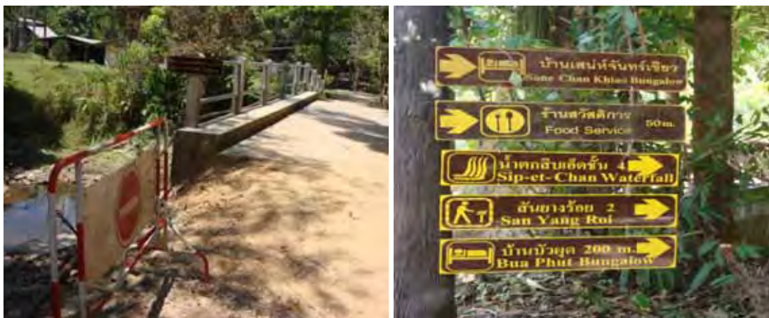
ภาพที่ 6 สะพานข้ามลำน้ำและป้ายบอกทางในอุทยานแห่งชาติเขาสก

บทวิจัยชาติศึกษาเชิงพื้นที่ สกว.คลังชีวิต