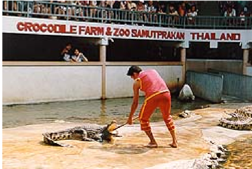
ฟาร์มจระเข้และสวนสัตว์สมุทรปราการ