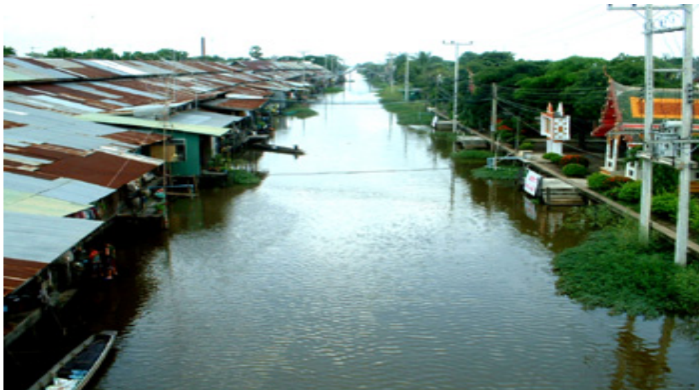
ตลาดคลองสวน 100 ปี