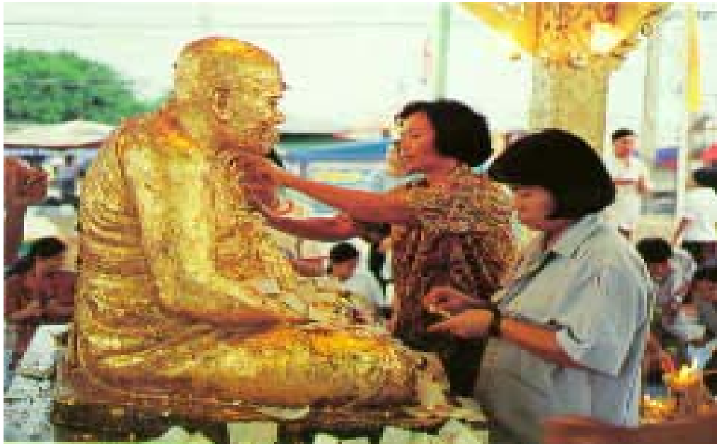
ประเพณีนมัสการหลวงพ่อบาน