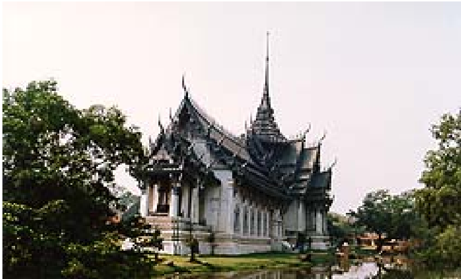
เมืองโบราณ