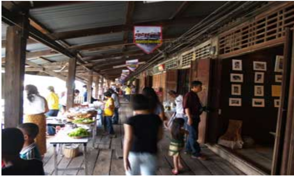
ตลาดบางพลีใหญ่