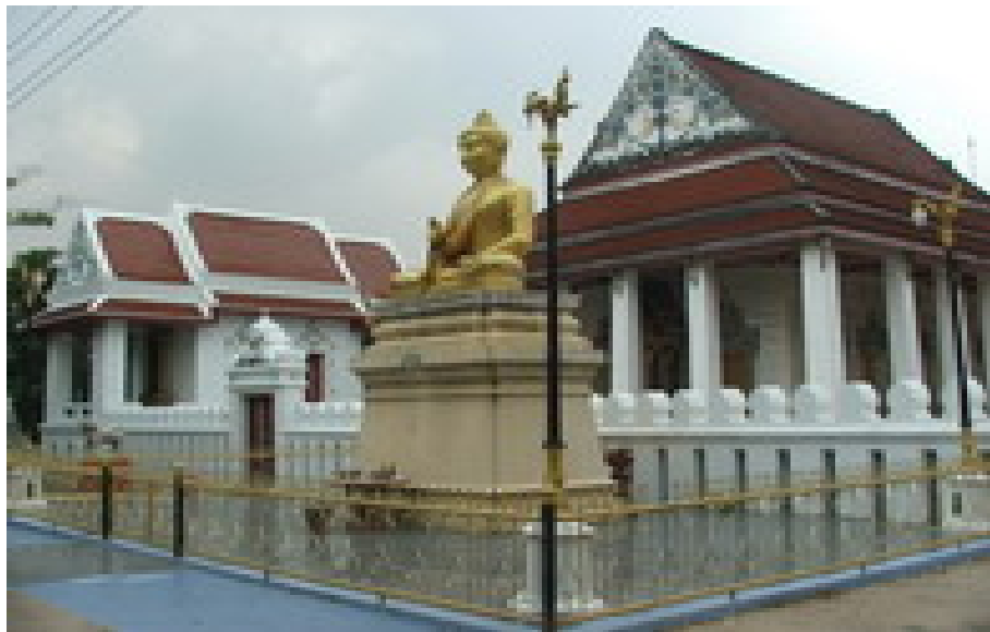
วัดไพชยนต์พลเสพย์ราชวรวิหาร