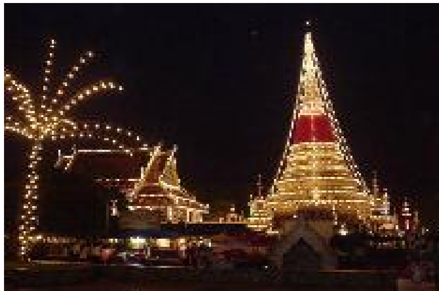
พระสมุทรเจดีย์