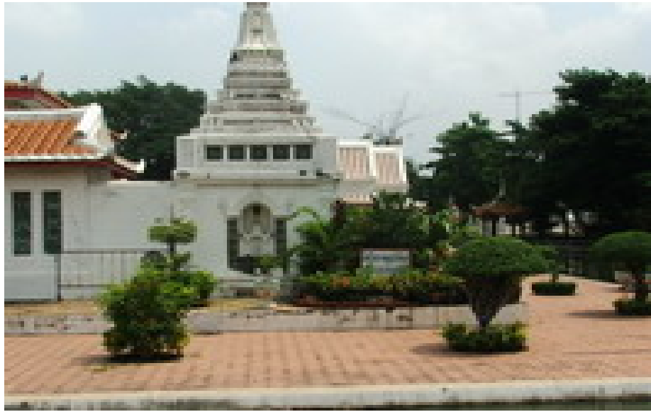
วัดโปรดเกศเชษฐาราม