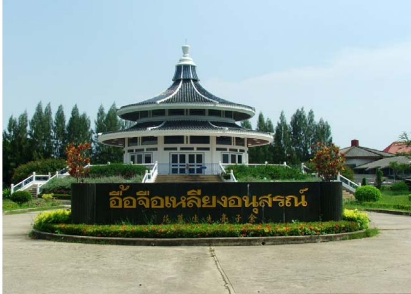
สวางคินิวาส