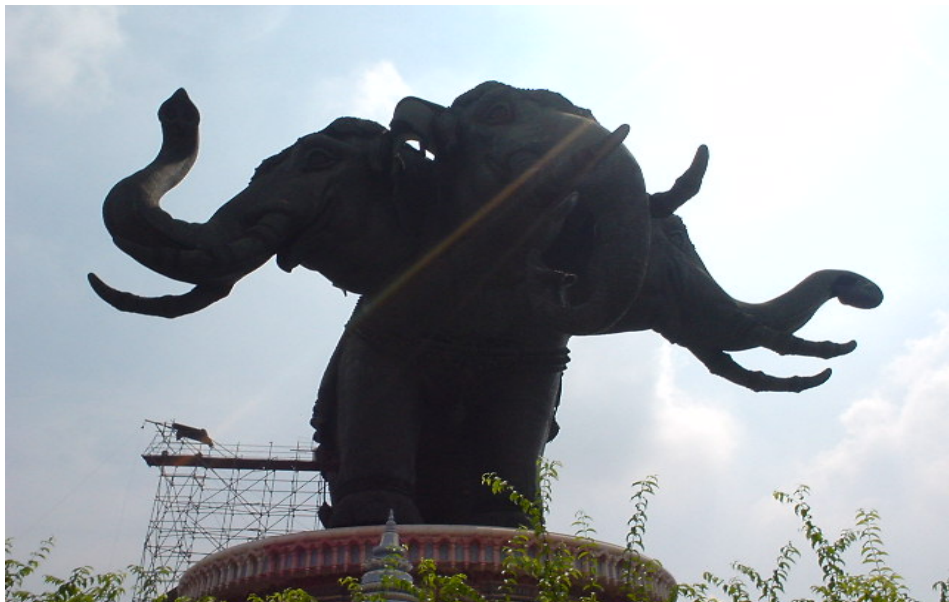
พิพิธภัณฑ์ช้างเอราวัณ