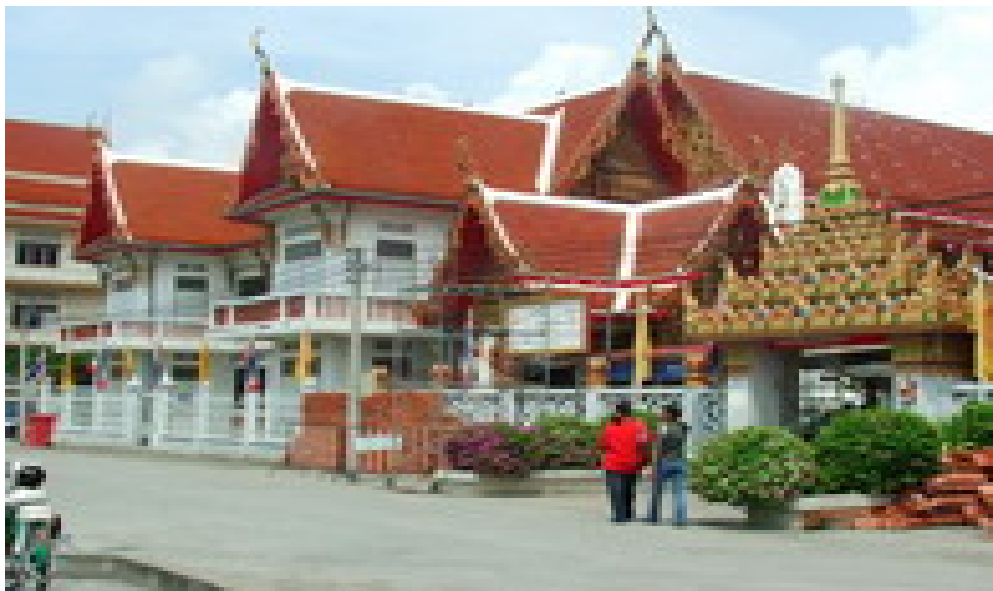
วัดบางพลีใหญ่ใน