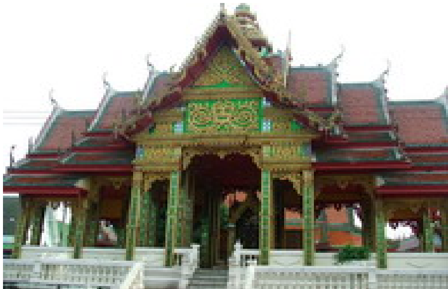
วัดกลางวรวิหาร