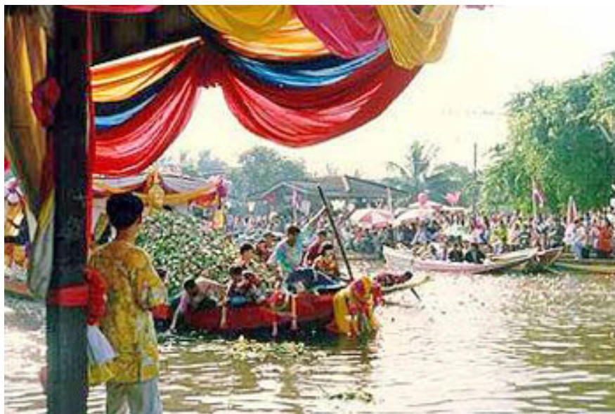
ประเพณีรับบัว(ประเพณีโยนบัว)