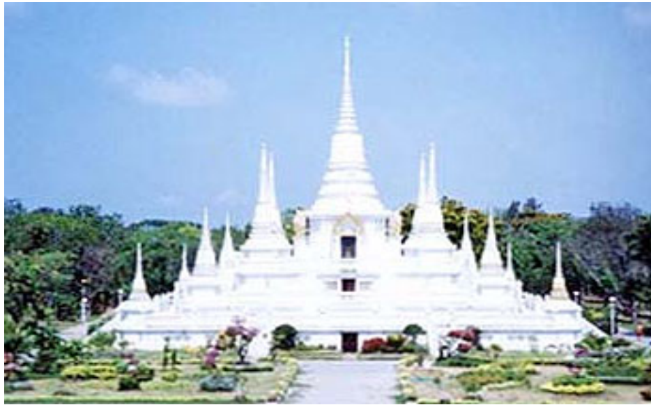
วัดอโศการาม