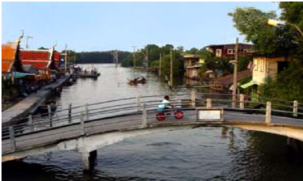
บ้านสาขา