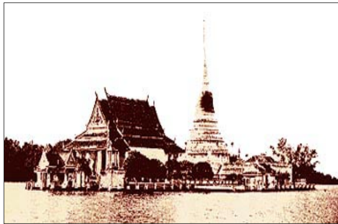
ภาพประกอบ 4 พระสมุทรเจดีย์ในอดีต

นกกิ่งขุมขึ้น ที่จริงนกนางนวลนี้งามจริง ๆ ดีกว่านกยางมาก ... 1