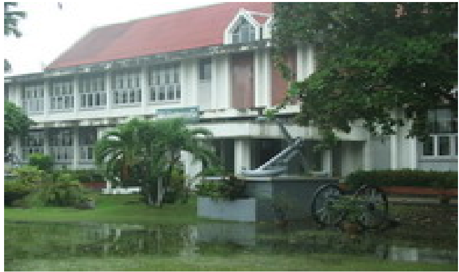
พิพิธภัณฑ์ทหารเรือ