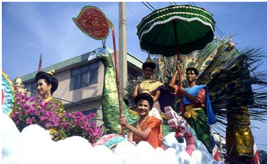
สงกรานต์พระประแดง(สงกรานต์ปากลัด)

ภาพแหล่งท่องเที่ยว ประเภทศิลปวัฒนธรรม ประเพณี และกิจกรรม