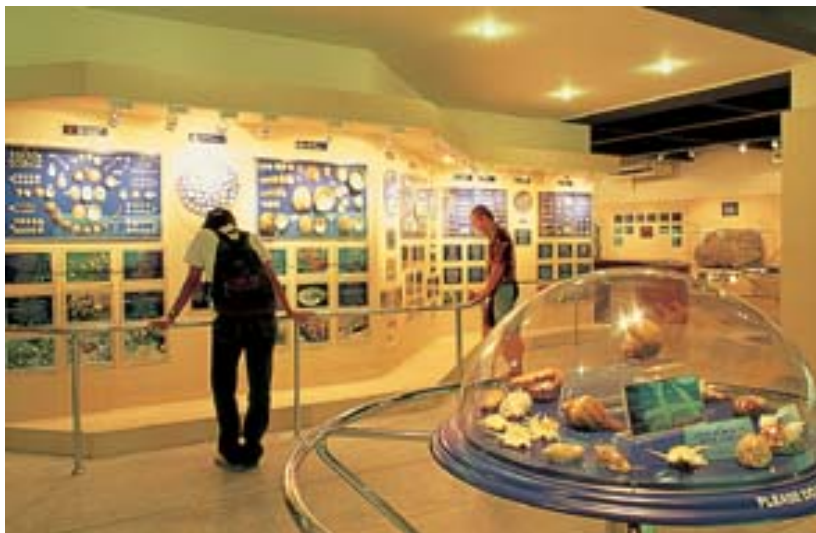
พิพิธภัณฑ์เปลือกหอย