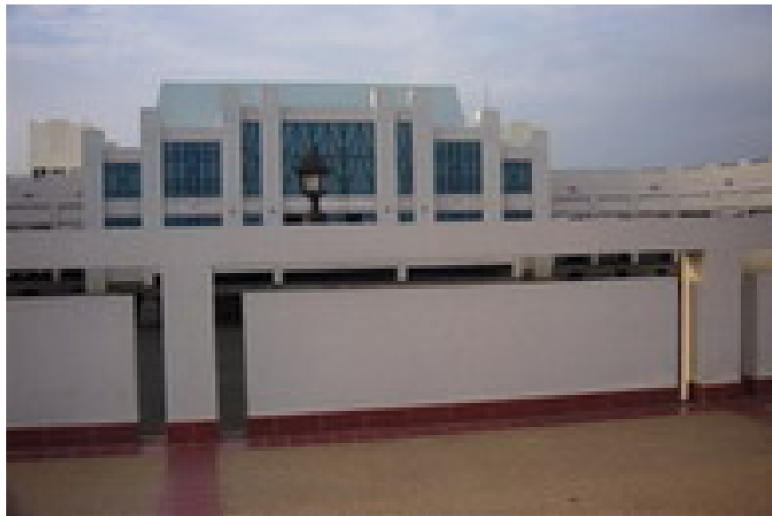
สถานตากอากาศบางปู