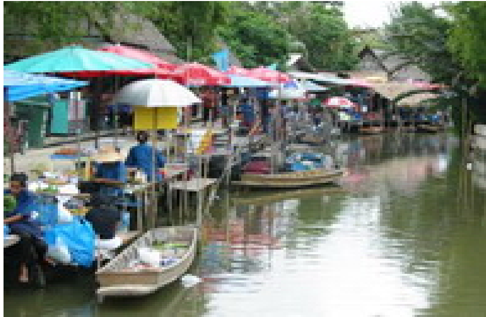
ตลาดน้ำบางน้ำผึ้ง