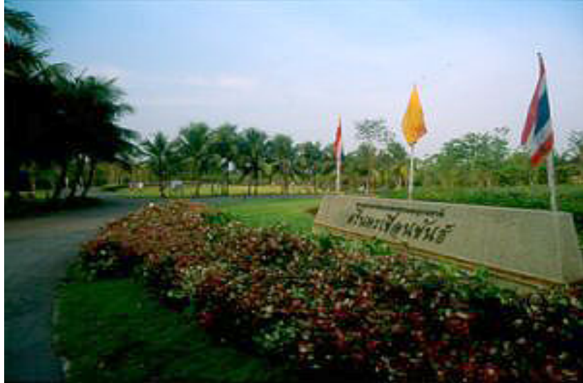
สวนศรีนครเขื่อนขันธ์