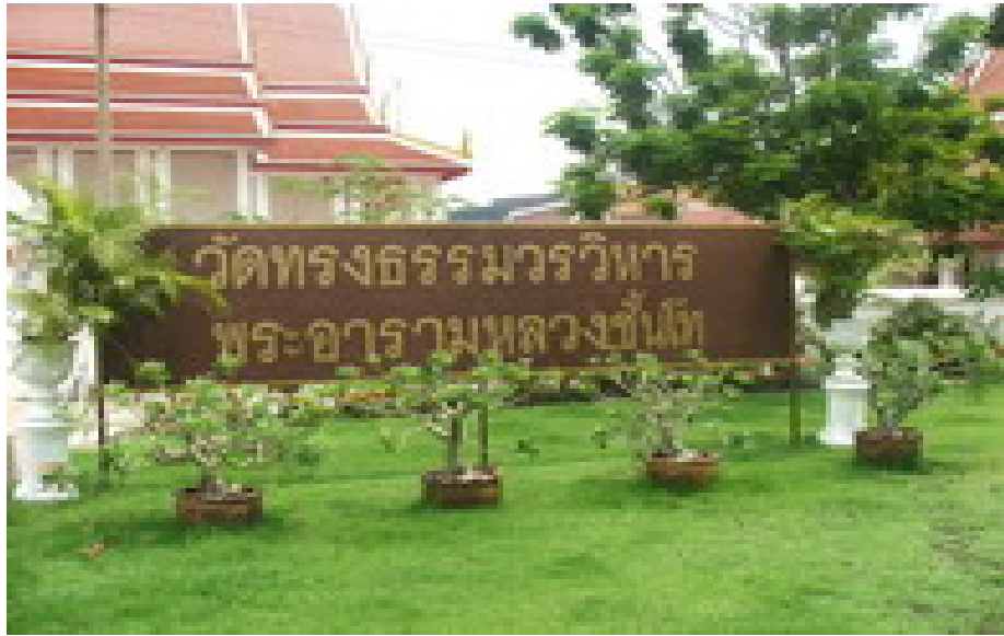
วัดทรงธรรมวรวิหาร