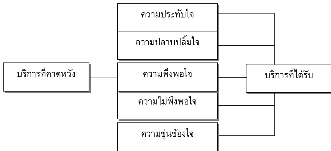
ภาพประกอบ 4 ความพึงพอใจของผู้รับบริการ

2. ความพึงพอใจที่เกินความคาดหวังเป็นการแสดงความรู้สึกปลาบปลื้มใจหรือประทับใจของผู้รับบริการ เมื่อได้รับการบริการตรวจรถยนต์และเติมลมฟรี