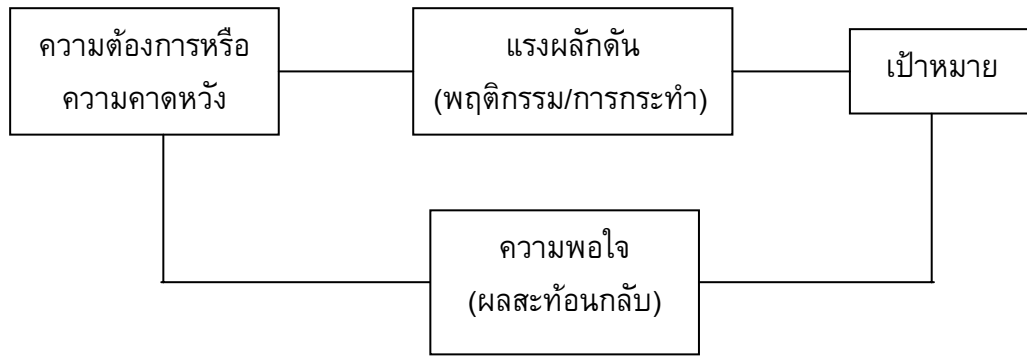
ภาพประกอบ 2 การเกิดความพอใจของบุคคล