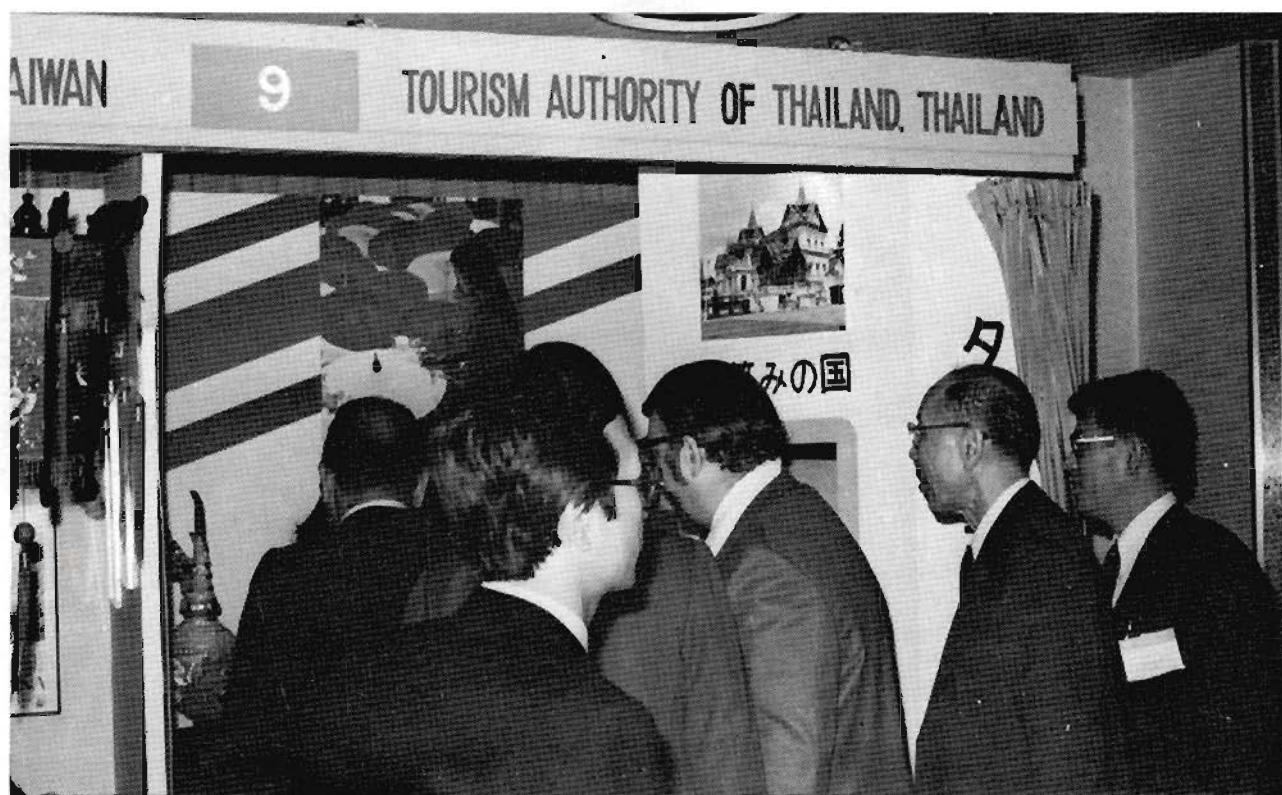
การท่องเที่ยวแห่งประเทศไทย (ททท.) สำนักงานโตเกียว เข้าร่วมงานนิทรรศการออกฐาน เผยแพร่ประเทศไทยในงานประชุมสมาพันธ์ตัวแทนธุรกิจท่องเที่ยวโลกที่ญี่ปุ่นครั้งที่ 2 (The Japan 2 nd World Congress of Travel Agent)