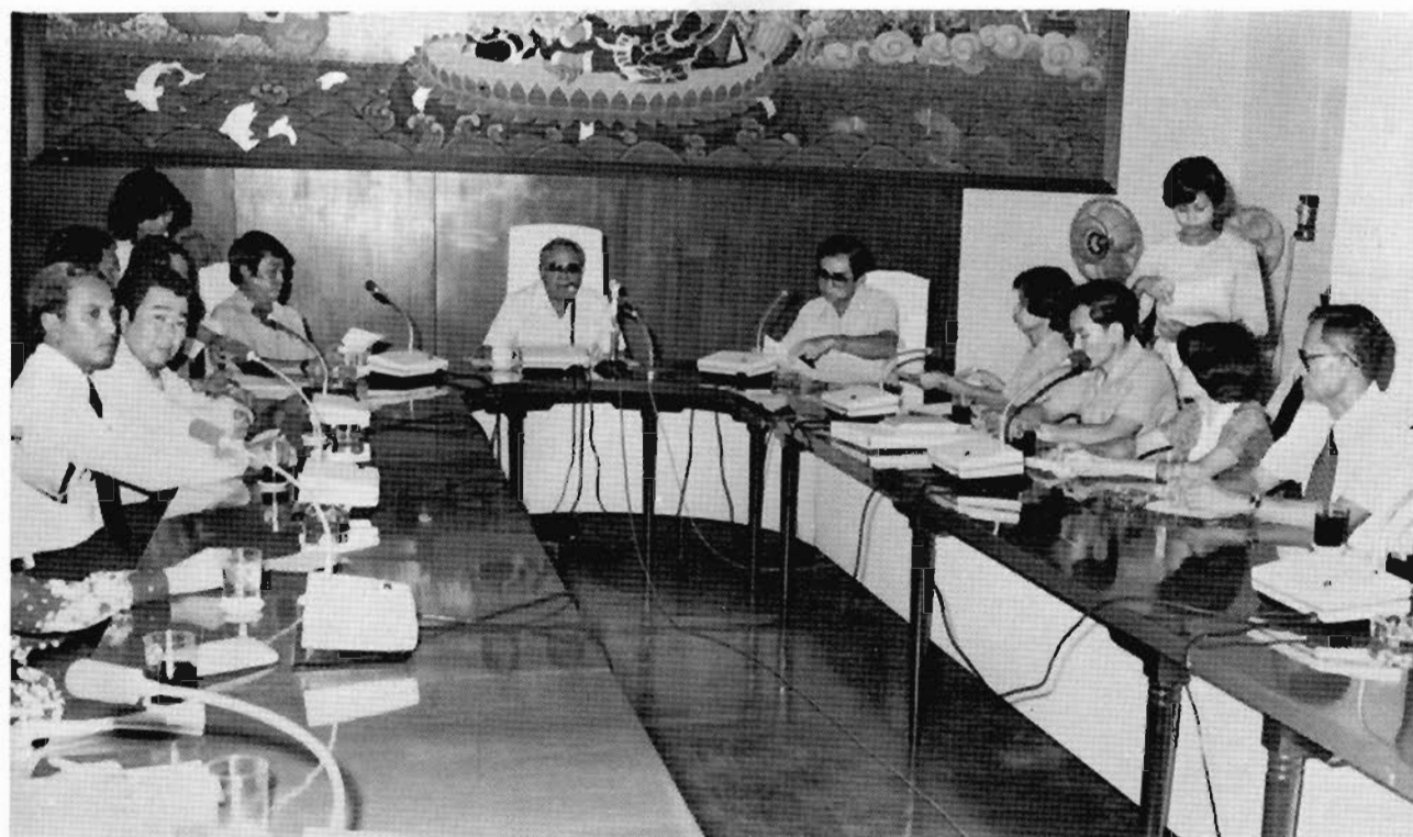
พลโท เฉลิมชัย จารุวัตร รัฐมนตรีประจำสำนักนายกรัฐมนตรี ในฐานะประธานกรรมการการท่องเที่ยวแห่งประเทศไทย ได้เป็นประธานประชุมพนักงานระดับสูงของการท่องเที่ยวแห่งประเทศไทย เพื่อชี้แจงให้ทราบถึงนโยบายในการส่งเสริมการท่องเที่ยวของรัฐบาลที่จะดำเนินการต่อไป ณ ห้องประชุมการท่องเที่ยวแห่งประเทศไทย