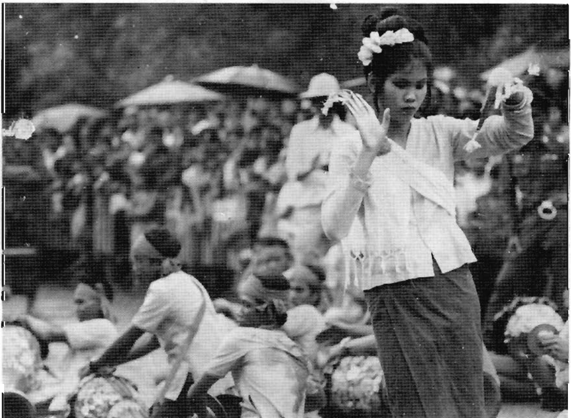
การท่องเที่ยวแห่งประเทศไทยและจังหวัดยโสธร จะร่วมกันจัดงานประเพณีบุญบั้งไฟขึ้น ที่จังหวัดยโสธรในระหว่างวันที่ 9-13 พฤษภาคม เพื่อเป็นการอนุรักษ์และฟื้นฟูประเพณี ที่ดั้งเดิมของภาคอีสานให้คงอยู่ต่อไป และส่งเสริมให้มีการเดินทางท่องเที่ยวไปสู่จังหวัดยโสธร และภาคอีสานโดยส่วนรวมอย่างกว้างขวางยิ่งขึ้น