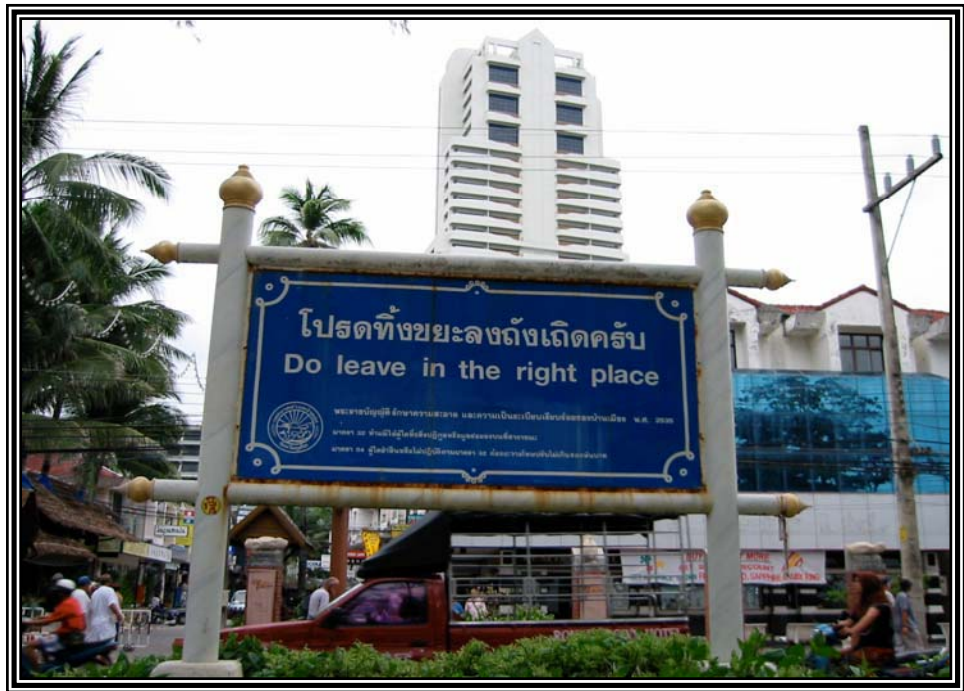
ประกาศเทศบาลป่าตอง เดือนมกราคม 2545