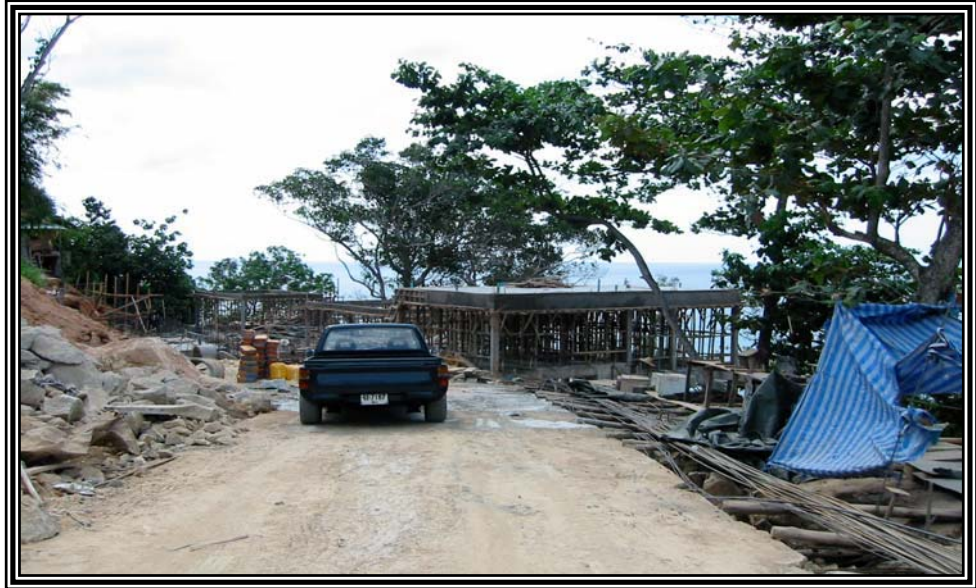
การก่อสร้างบ้านถนนสายลายิ-นาคาเล เมื่อวันที่ 16 ธันวาคม 2545