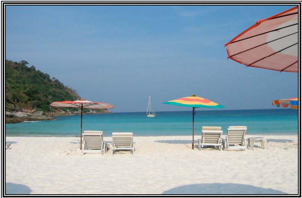
ชายหาดเกาะราชาใหญ่ เดือนพฤษภาคม 2545