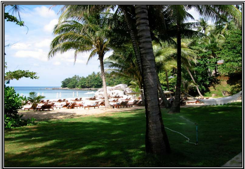
หน้าโรงแรมมันปรี เมื่อวันที่ 16 ธันวาคม 2545