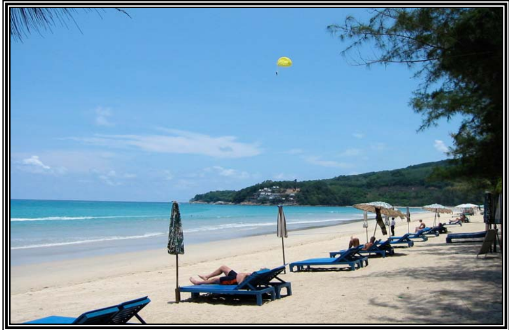
หาดกมลา เมื่อวันที่ 12 มกราคม 2545