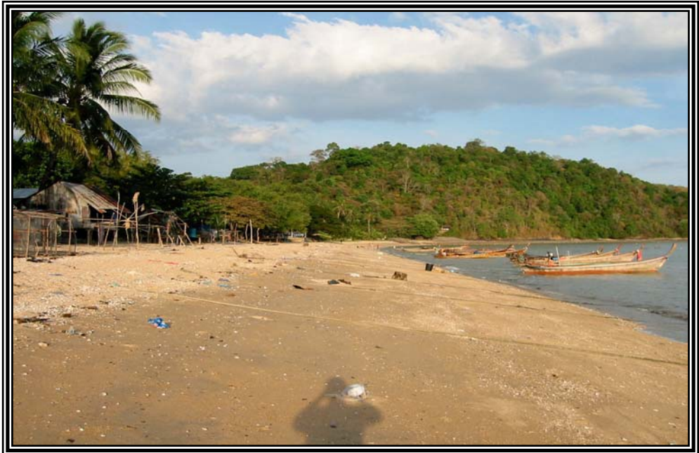
ชายหาดที่อาศัยชาวเลที่เกาะสิเหร่ เดือนมกราคม 2545