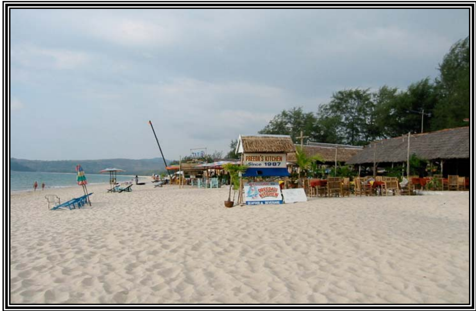
ลากูน่าบีช ด้านเหนือ หน้า Sheraton Laguna เมื่อวันที่ 13 มกราคม 2545