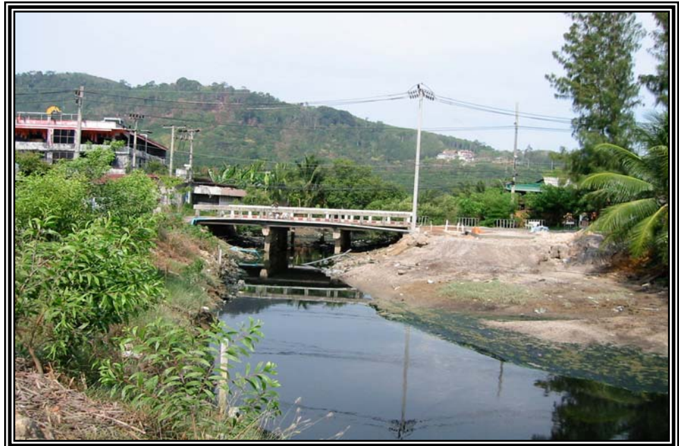
คลองป่าตอง เมื่อเดือนมกราคม 2545