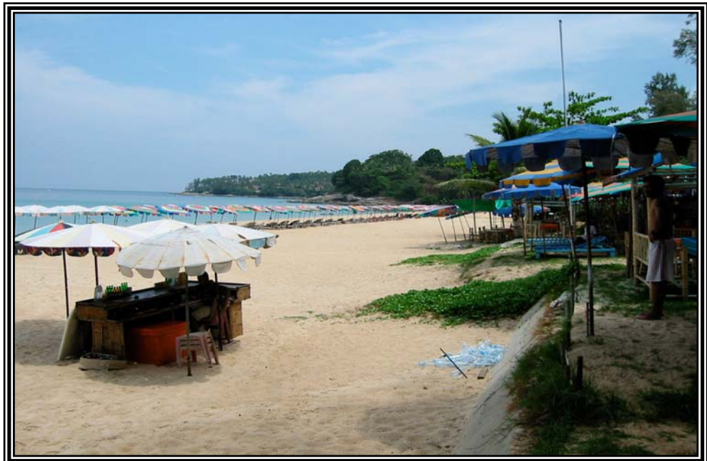
หาดสุรินทร์ เมื่อวันที่ 13 มกราคม 2545