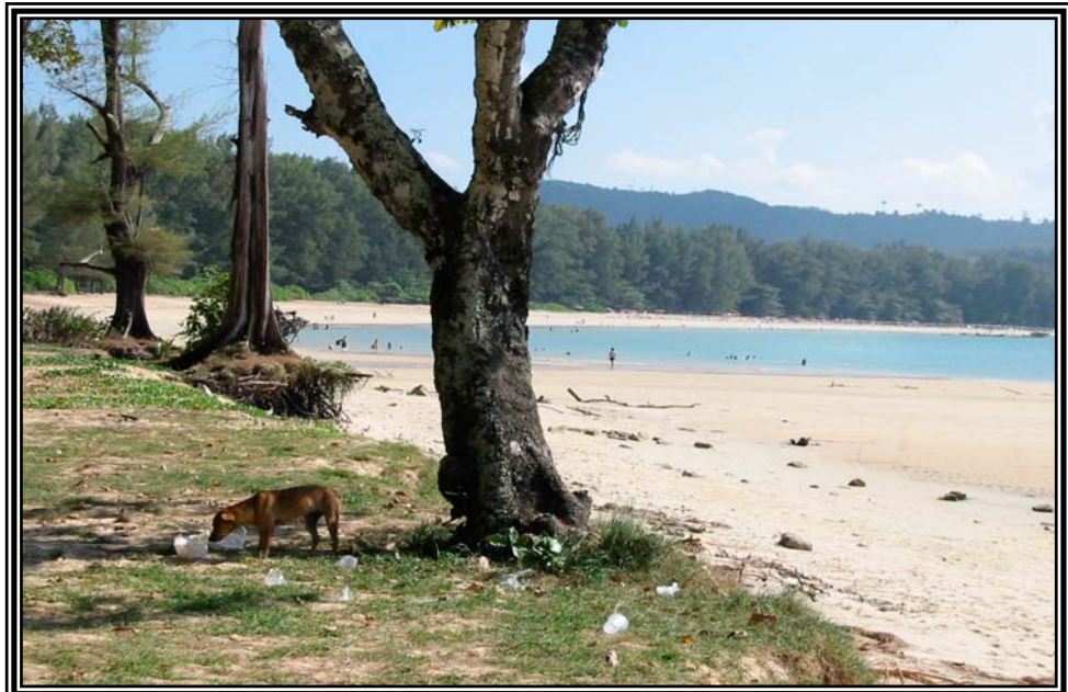
บริเวณอุทยานสิรินาถ เมื่อวันที่ 12 มกราคม 2545