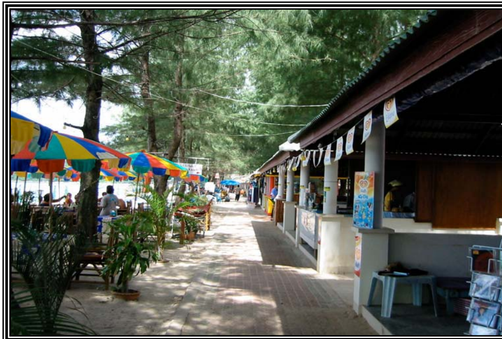
หาดกมลาเมื่อวันที่ 16 ธันวาคม 2545 หลังการจัดระเบียบ