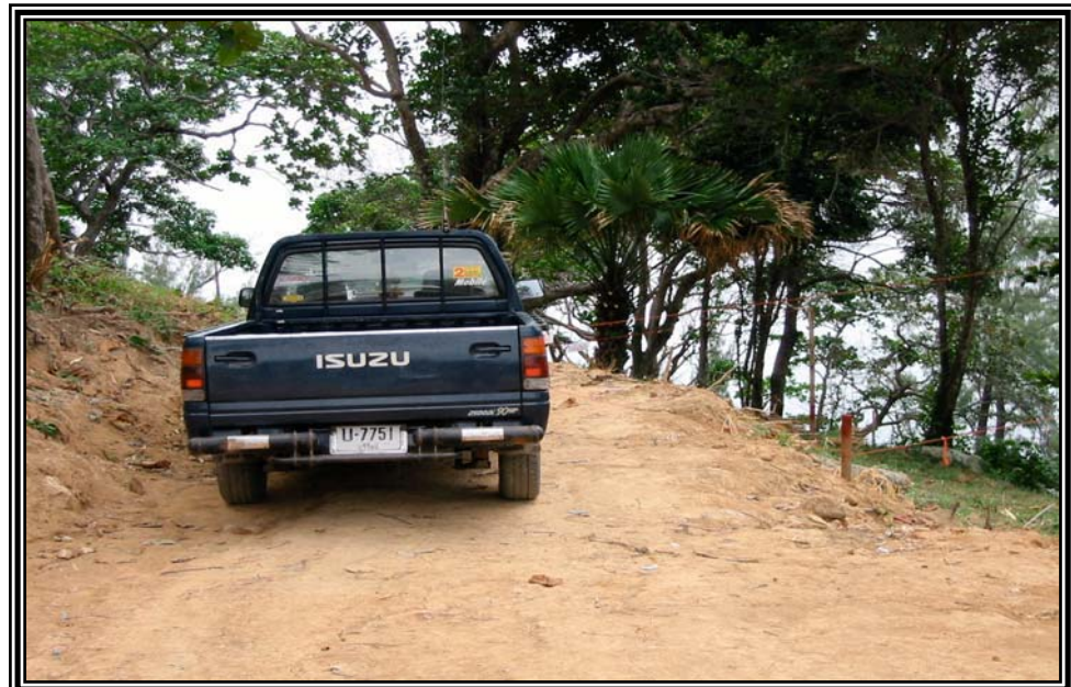
การเตรียมการก่อสร้างบ้าน ถนนสายลาอี-นาคาเล เมื่อวันที่ 12 มกราคม 2545