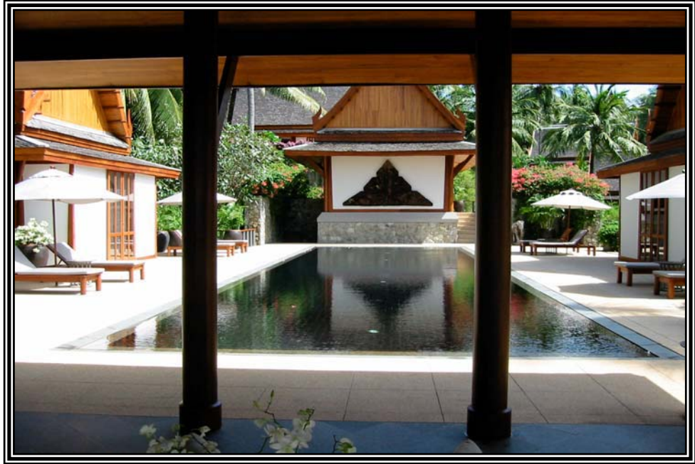
บรรยากาศห้องพัก โรงแรมที่มีอัตราค่าห้องพักสูง เมื่อวันที่ 16 ธันวาคม 2545