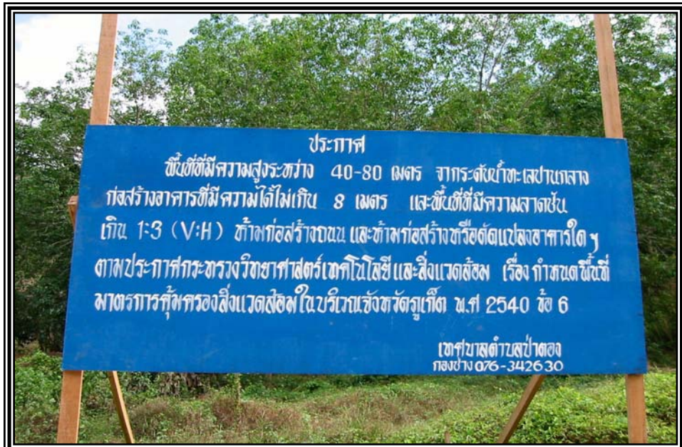
ป้ายประกาศถนนขึ้นเขาป่าตอง เดือนมกราคม 2545