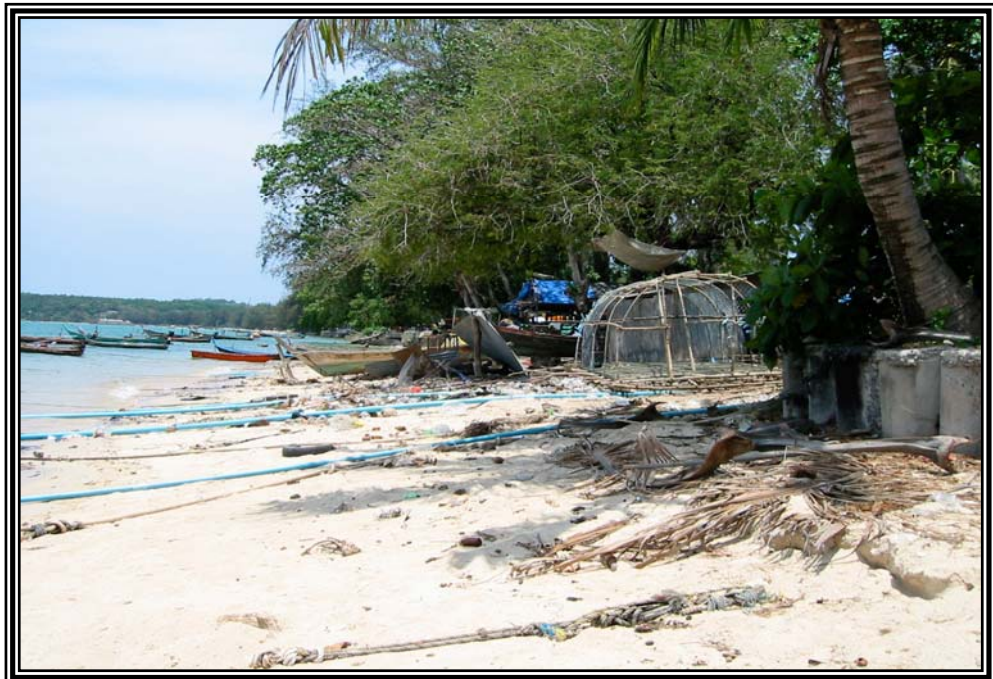
หาดราไวย์ที่อาศัยชาวเล เดือนมกราคม 2545