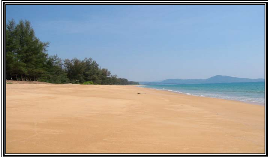
หาดไม้ขาว เมื่อวันที่ 12 มกราคม 2545

ตัวอย่างภาพถ่ายสภาพแหล่งท่องเที่ยวที่สำคัญจังหวัดภูเก็ต ระหว่างปี พ.ศ. 2545