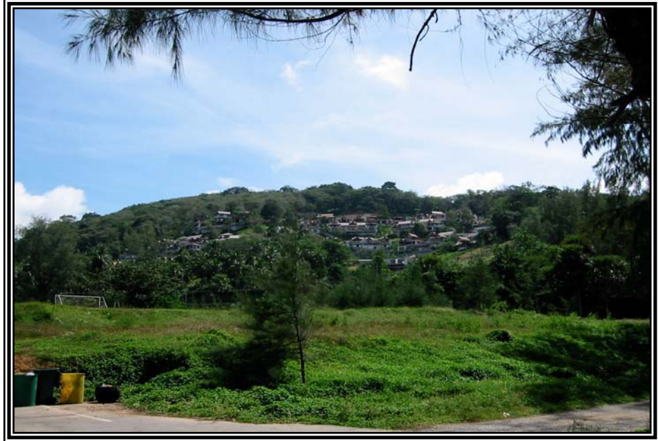
โครงการบ้านพักหาดสุรินทร์ เมื่อวันที่ 16 ธันวาคม 2545