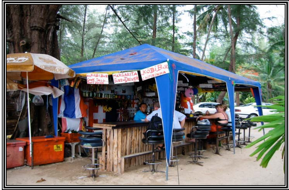
หาดในยาง เมื่อวันที่ 12 มกราคม 2545