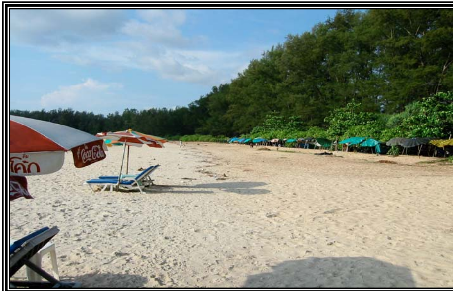
หาดในยาง เมื่อวันที่ 12 มกราคม 2545 ชุมการพักผ่อนคนไทย