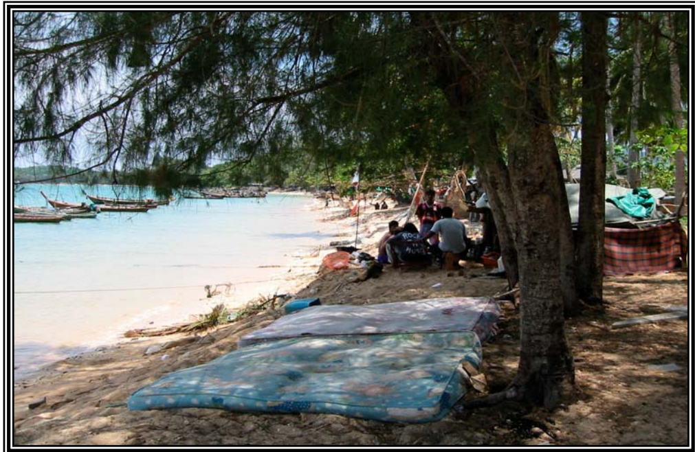
ชาวเลที่อาศัยหาดราไวย์เป็นที่พัก เดือนมกราคม 2545