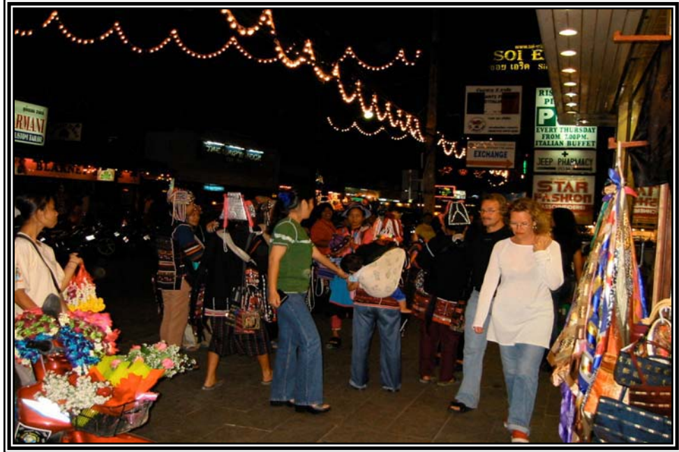
การขายของที่ระลึกชาวเขา ซอยบางลา ป่าตอง เดือนมกราคม 2545