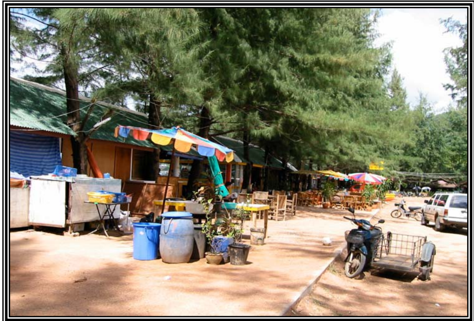
หาดกมลา เมื่อวันที่ 12 มกราคม 2545