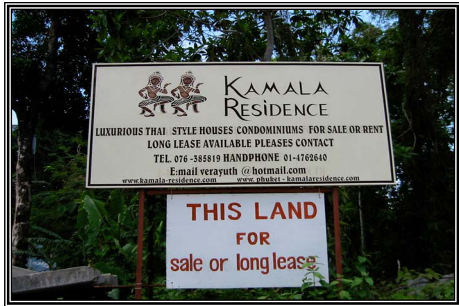
โครงการบ้านพักบริเวณหาดกมลา เมื่อวันที่ 12 มกราคม 2545