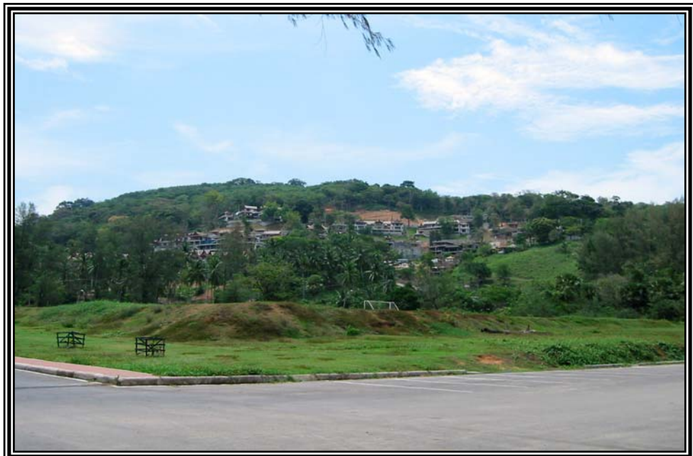
การก่อสร้างที่หาดสุรินทร์ เมื่อวันที่ 13 มกราคม 2545