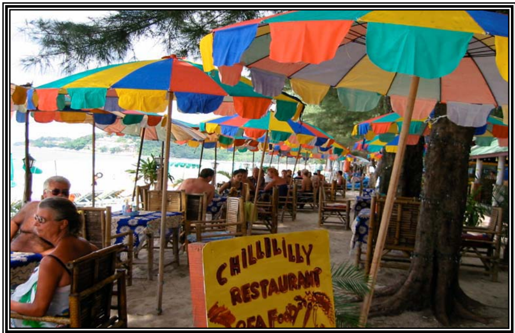
หาดกมลา เมื่อวันที่ 16 มกราคม 2545