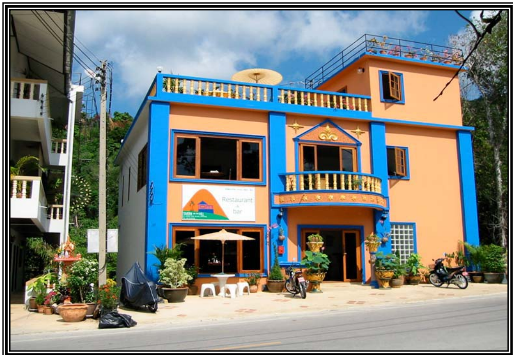
Pub บนเขาหลังหาดป่าตอง เดือนมกราคม 2545