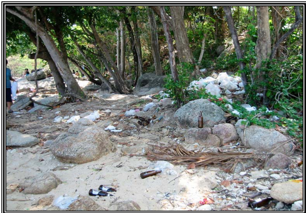
สภาพหาดแหลมกา หลังสงกรานต์ ปี 2545