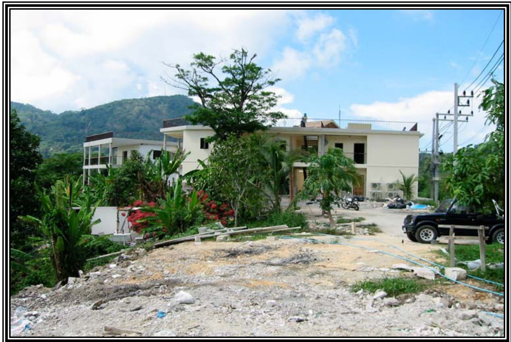
การก่อสร้างอาคารบนเขาหลังหาดป่าตอง เดือนมกราคม 2545