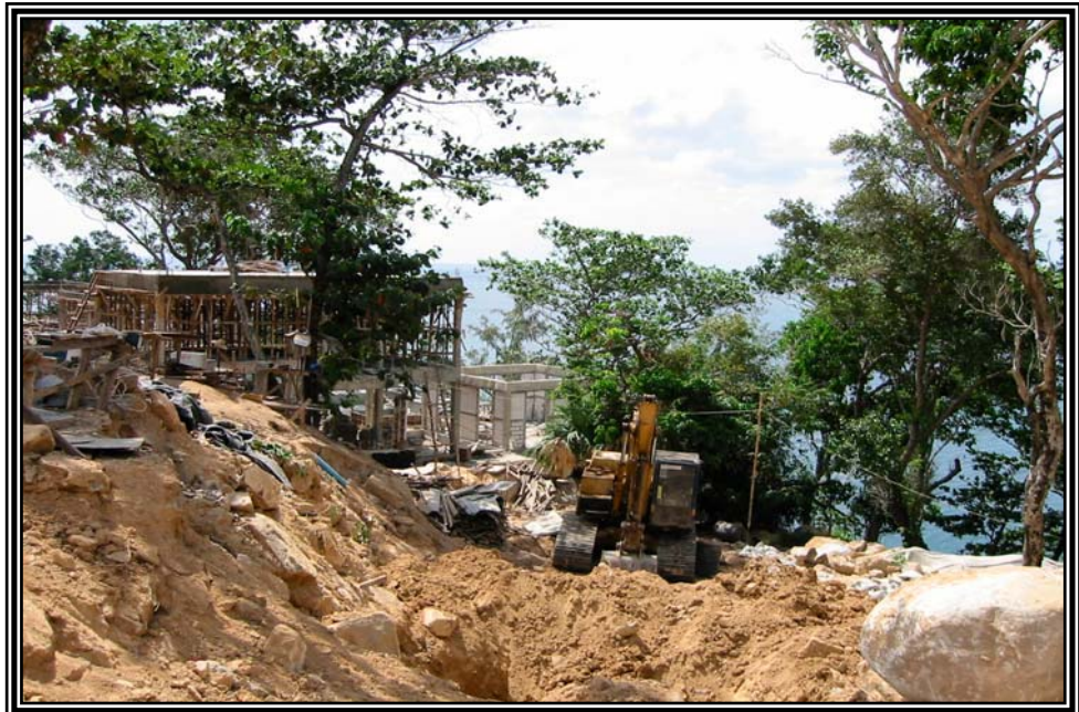
การขุดพื้นที่ลาดชัน ถนนสายลายิ-นาคาเล เมื่อวันที่ 16 ธันวาคม 2545