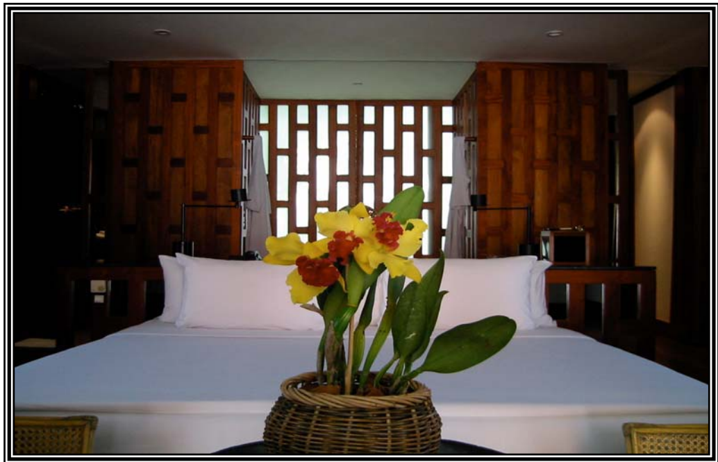
ห้องนอนของโรงแรมคุณภาพสูง เมื่อวันที่ 16 ธันวาคม 2545