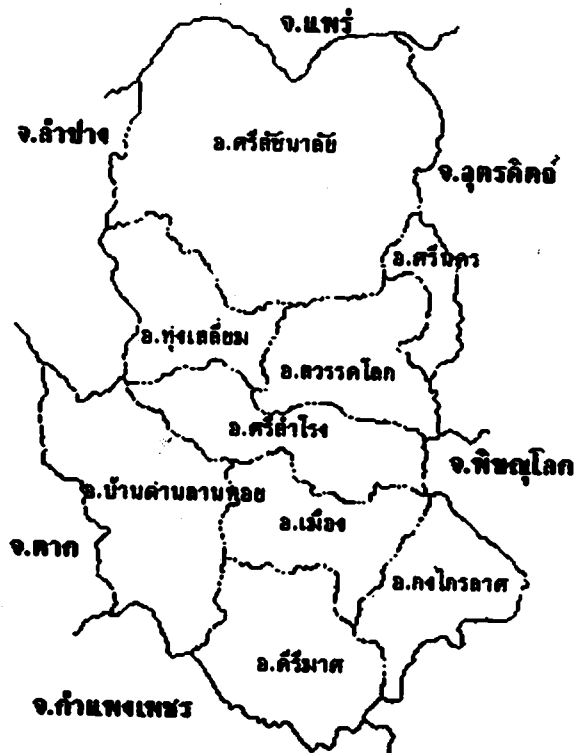
ภาพที่ 1 แผนที่แสดงที่ตั้งจังหวัดสุโขทัยและอาณาเขตติดต่อ