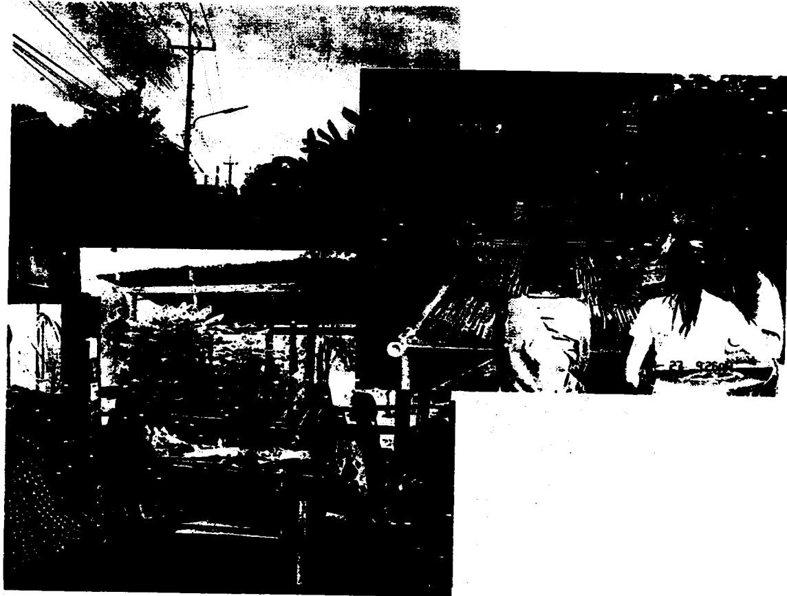
ภาพที่ 3 แสดงการสัมภาษณ์ผู้ให้ข้อมูลในพื้นที่

ประมาณปี พ.ศ.2549 รัฐได้เวนคืนที่ดินจากชาวบ้านเพื่อนำมาใช้ประโยชน์ ที่ดินที่มีโฉนดจะได้ค่าเวนคืนที่ดินไร่ละ 36,000 บาท ที่ดินที่ไม่มีโฉนดได้ราคาไร่ละ 28 000 บาท หลังจากเวนคืนที่ดินมีการปรับปรุงสภาพพื้นที่ ขุดแอ่งหรือที่ลุ่มเป็นบึงใหญ่ และทำคลองส่งน้ำ ชาวบ้านเรียกพื้นที่นี้ว่า “ทุ่งทะเลหลวง”