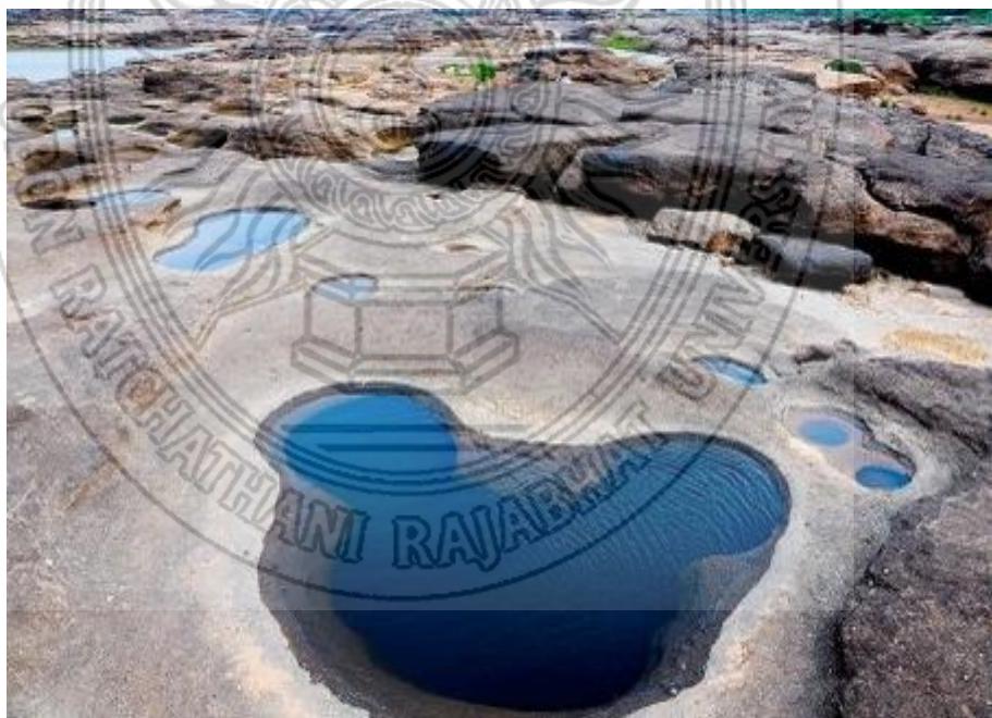
ภาพที่ 2.3 สภาพแอ่งหินบริเวณแหล่งท่องเที่ยวสามพัน โบก