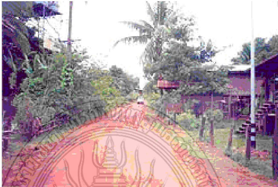
ภาพที่ 2.2 สภาพเส้นทางการเข้าไปยังสถานที่แหล่งท่องเที่ยวสามพัน โบก