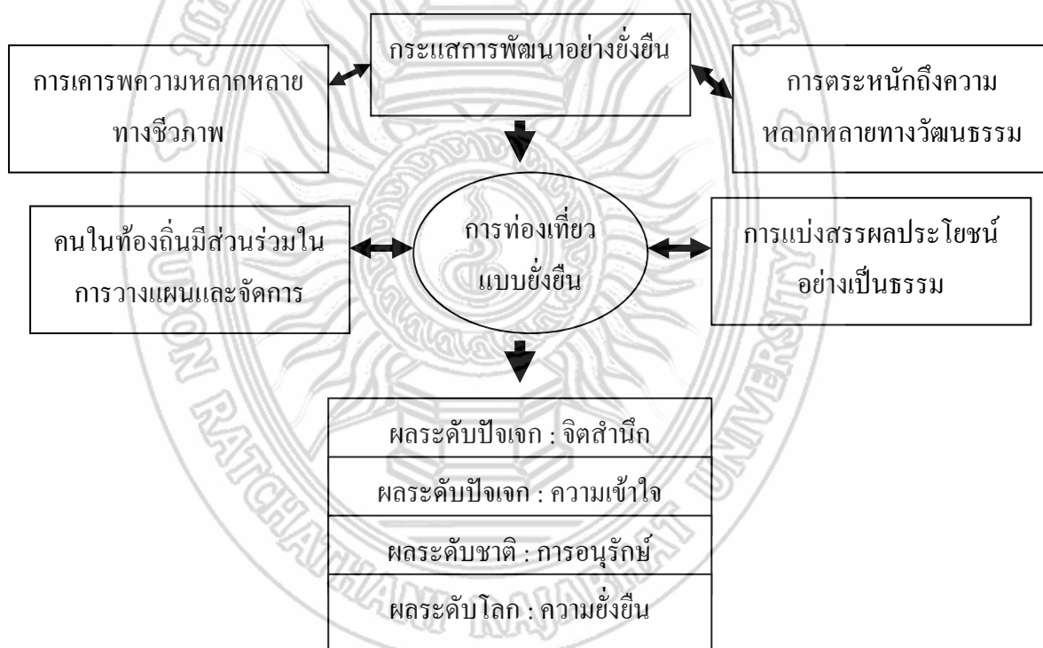
ภาพที่ 2.1 กรอบแนวคิดการท่องเที่ยวแบบยั่งยืน

จากแนวคิดการท่องเที่ยวแบบยั่งยืน ดังกล่าว ได้ชี้ให้เห็นถึงประโยชน์จากการท่องเที่ยวภายใต้บริบทของกระแสการพัฒนาทั้งในระดับจุลภาคและมหภาค นับตั้งแต่การสร้างรายได้ให้กับคนในท้องถิ่นในการเป็นเจ้าของที่พัก อันนำไปสู่การยกระดับความเป็นอยู่ของคนในท้องถิ่นโดยรวม และยังเป็นการสร้างความเข้าใจอันดีระหว่างคนภายนอกกับคนในท้องถิ่นอย่างเท่าเทียมอันนำไปสู่การเป็นน้ำหนึ่งใจเดียวกันของคนในสังคม อันจะนำไปสู่การพัฒนาแบบยั่งยืนต่อไป ซึ่งสามารถแสดงความสัมพันธ์ของกรอบแนวคิดการท่องเที่ยวแบบยั่งยืนได้ ดังรูปที่ 2.1