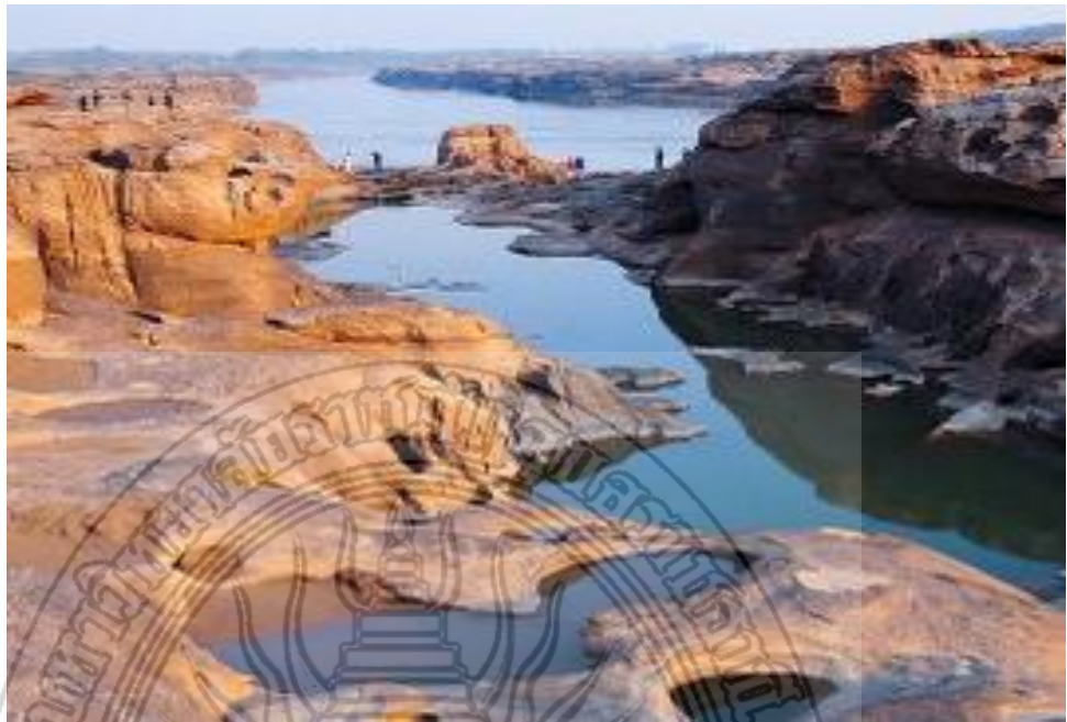
ภาพที่ 2.4 สภาพร่องน้ำบริเวณแหล่งท่องเที่ยวสามพันโบก