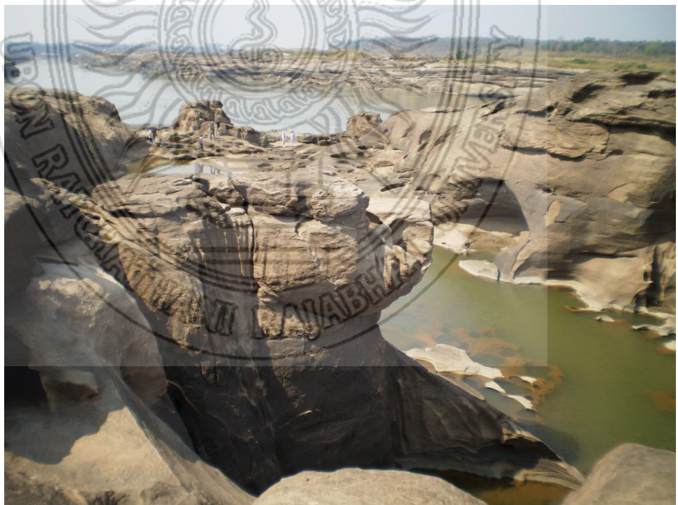
ภาพที่ 2.5 สภาพโกดหินบริเวณแหล่งท่องเที่ยวสามพันโบก