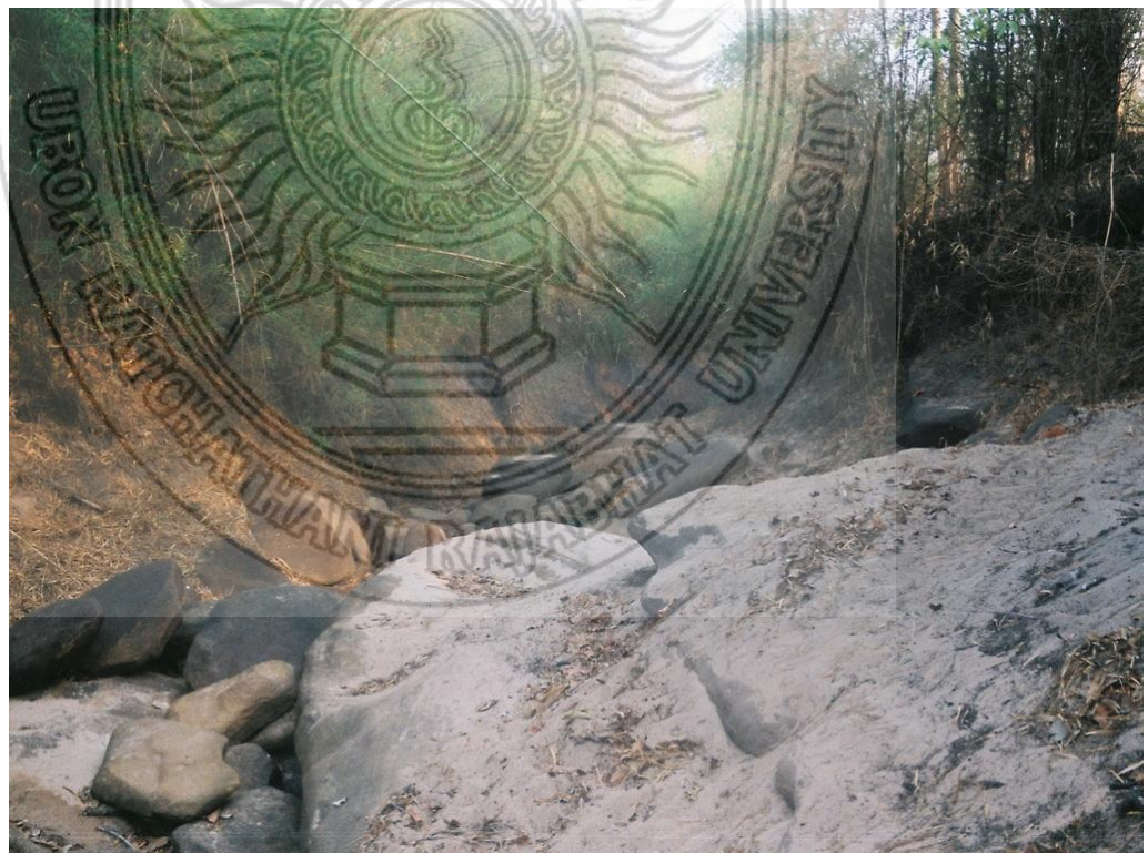
แผนภาพที่ 4.10 สภาพธารน้ำที่ชาวบ้านทำสั้งใช้ดื่มมานาน ถึงแม้ว่าจะมีประปาแต่ ปัจจุบันยังคงเป็นปัญหาหนักกับชาวบ้านทำสั้ง