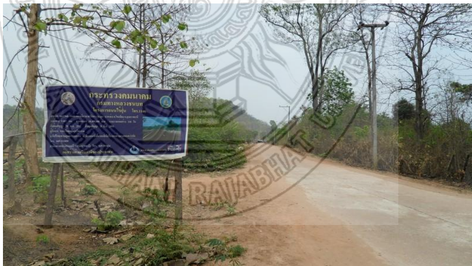
แผนภาพที่ 4.4 สภาพถนนที่กระทรวงคมนาคมกำลังจะทำการปรับปรุงให้หมู่บ้านในโครงการถนนไร้ฝุ่น