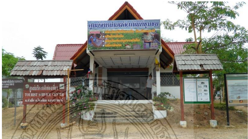
แผนภาพที่ 4.9 สภาพที่ตั้งศูนย์จำหน่ายผลิตภัณฑ์ชุมชนขององค์การบริหารส่วนตำบล ห้วยไผ่