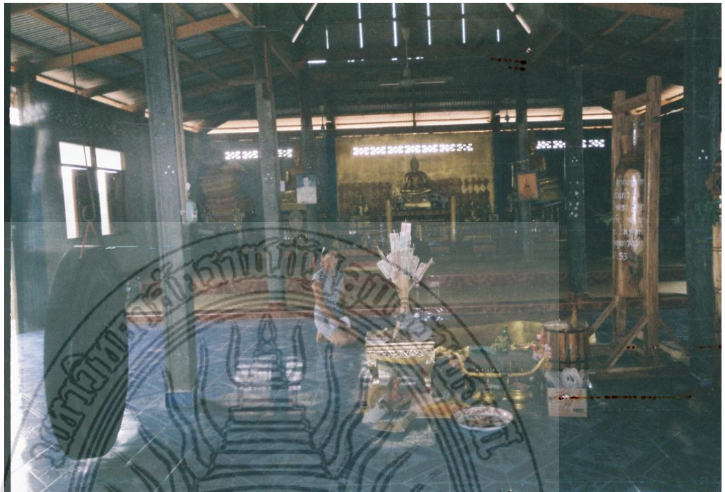
แผนภาพที่ 4.11 สถาปัตยกรรมวัดที่มีรอยพระพุทธรบาทจำลอง ซึ่งเป็นสถานที่ท่องเที่ยวที่มีชื่อเสียงของหมู่บ้านท่าลี่