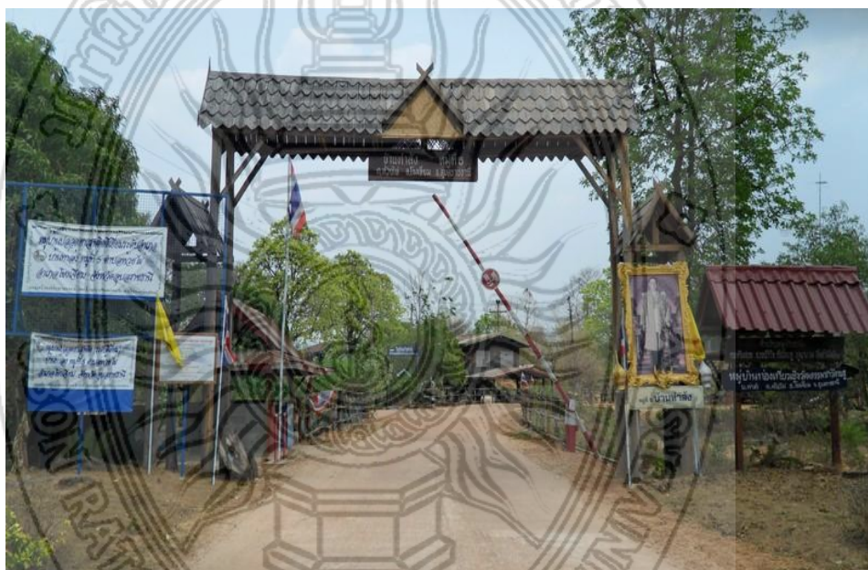
แผนภาพที่ 4.2 สภาพเส้นทางเข้าหมู่บ้านท่าลั้ง

ในปัจจุบัน โครงสร้างขั้นพื้นฐานภายในชุมชนบ้านท่าลั้งได้รับการพัฒนาเป็นอย่างมาก เช่น การเดินทางเข้ามาในชุมชนก็ได้รับความสะดวกสบาย มีถนนลาดยางผ่านหลายสาย ตลอดทั้งมีการพัฒนาสถานที่ต่าง ๆ ทั้งโบราณสถาน/โบราณวัตถุ ซึ่งนอกจากผู้วิจัยจะใช้ข้อมูลเชิงคุณภาพทั้งจากการศึกษาเอกสารและสัมภาษณ์กลุ่มผู้ให้ข้อมูลหลัก ดังกล่าวแล้ว ผู้วิจัยยังได้เก็บหลักฐานที่เป็นรูปภาพ เพื่อใช้ประกอบการวิเคราะห์และยืนยันผลการศึกษาเกี่ยวกับสภาพบริบททั่ว ๆ ของชุมชนในปัจจุบัน ผู้วิจัยนำภาพสภาพพื้นที่ขณะทำการศึกษา ที่สำคัญ ๆ มาประกอบและยืนยันผลการวิเคราะห์ข้อมูล ดังกล่าวข้างต้น ดังรายละเอียดตามแผนภาพที่ 4.2 – 4.16 ดังนี้