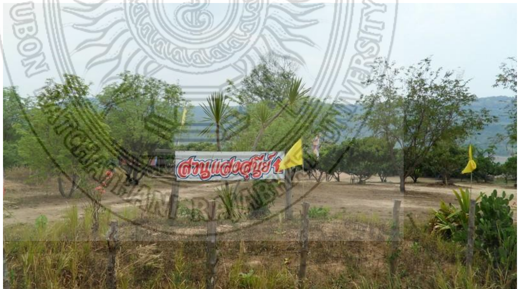
แผนภาพที่ 4.12 บริเวณพื้นที่ที่เป็นจุดชมบั้งไฟพญานาค สถานที่ท่องเที่ยวที่ขึ้นชื่อของหมู่บ้านท่าลี่