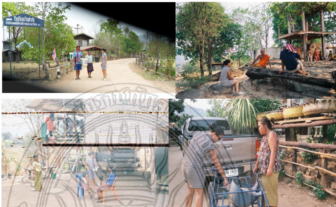
แผนภาพที่ 4.13 สภาพวิถีชีวิตของประชาชนในชุมชนบ้านท่าล้ง