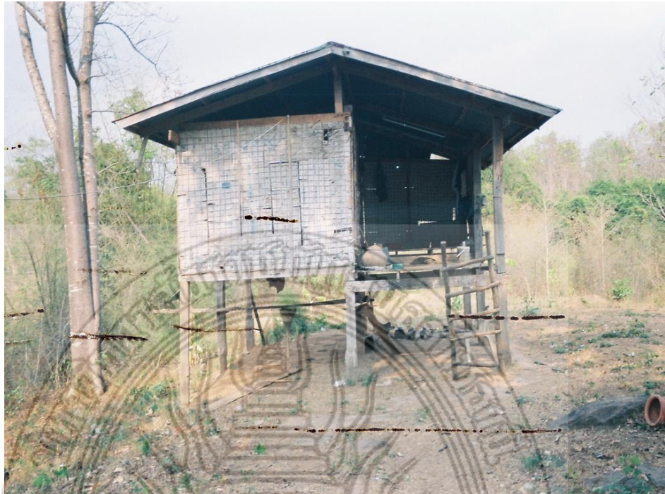
แผนภาพที่ 4.5 สภาพบ้านที่ชาวบ้านทำลั้งเก่าแก่ใช้พักอาศัย ที่ยังคงสภาพเดิมๆยังไม่ค่อยเปลี่ยนแปลงมากนัก