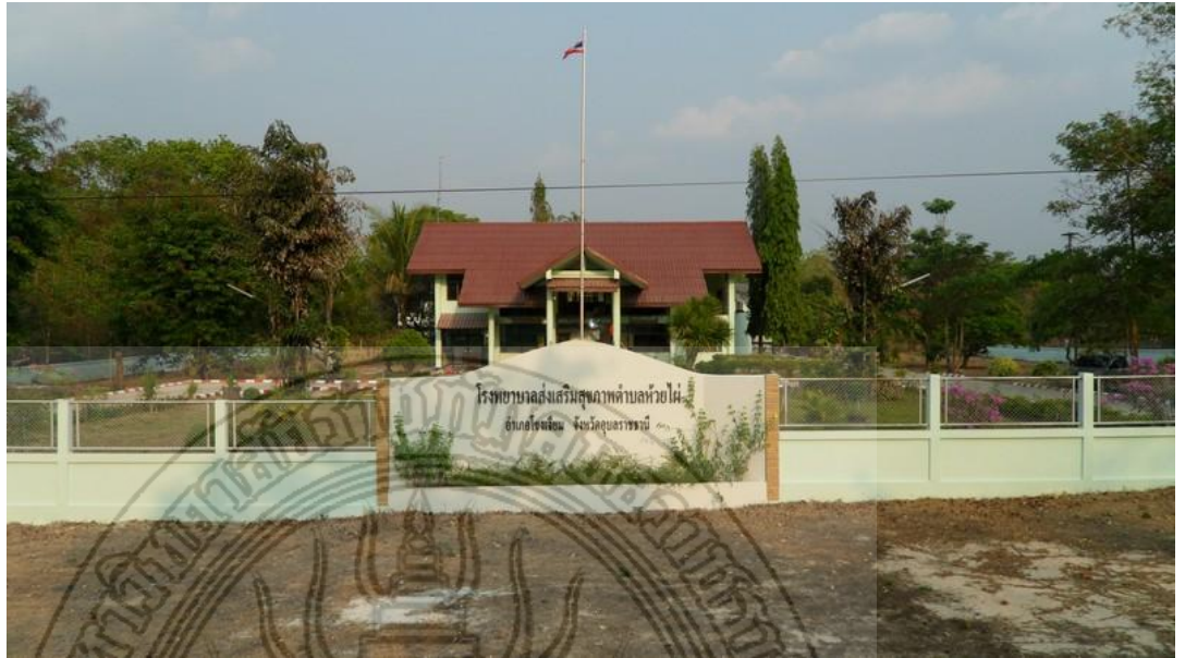
แผนภาพที่ 4.7 สภาพที่ตั้งโรงพยาบาลส่งเสริมสุขภาพตำบลห้วยไผ่ ที่ชาวบ้านมาใช้ บริการในยามเจ็บป่วย