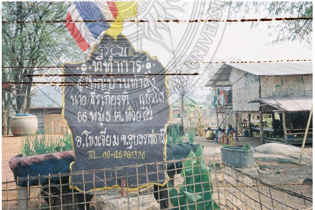
แผนภาพที่ 4.6 สภาพบ้านที่เป็นที่ทำการผู้ใหญ่บ้านท่าลั้ง