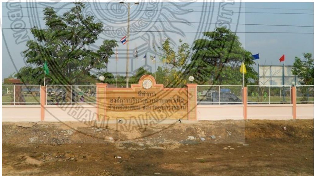
แผนภาพที่ 4.8 สภาพที่ตั้งที่ทำการองค์การบริหารส่วนตำบลห้วยไผ่