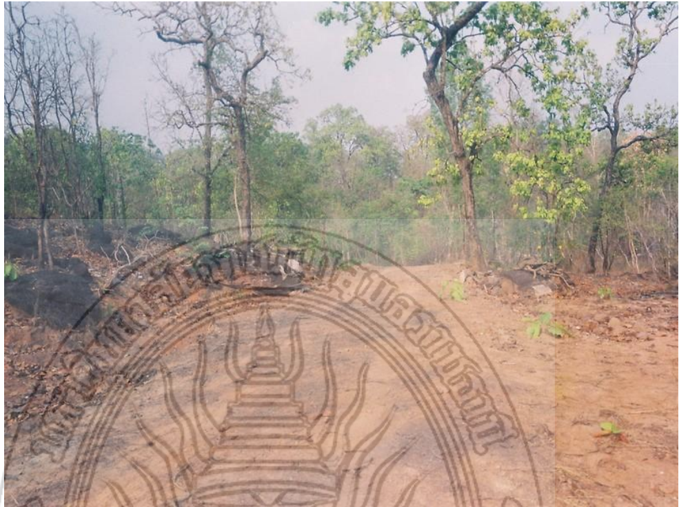
แผนภาพที่ 4.3 สภาพถนนในหมู่บ้านท่าลั้งที่ยังไม่ได้รับการปรับปรุง