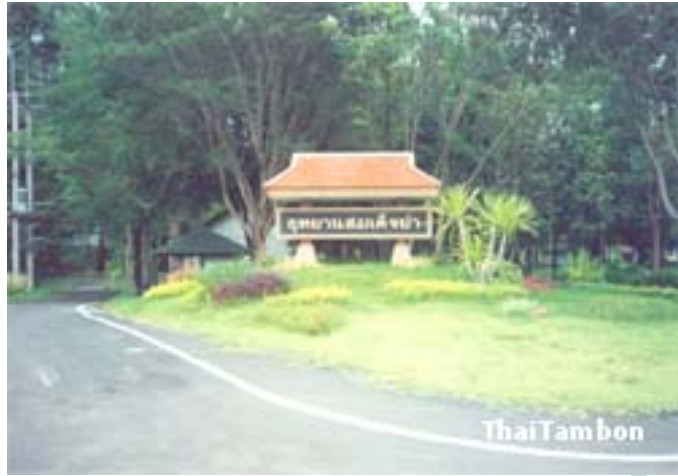
อุทยานสมเด็จพระเจ้า ฐานปฏิบัติการวรรณ