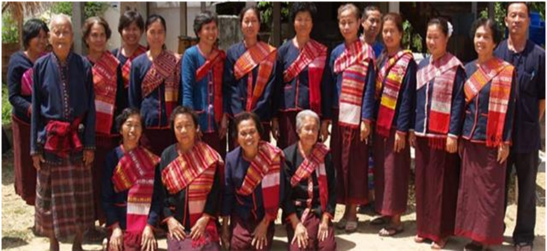
โฮมสเตย์บ้านภู.