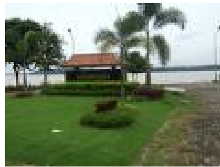
แก่งกะเบา