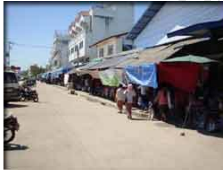
ตลาดอินโดจีน