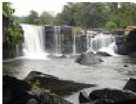
น้ำตกตาดโตน