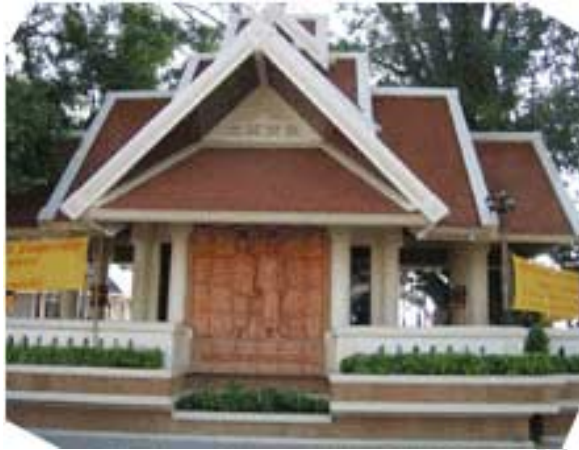
ศาลเจ้าแม่สองนาง