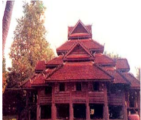
วัดพระศรีมหาโพธิ (วัดโพธิ์ศรี).