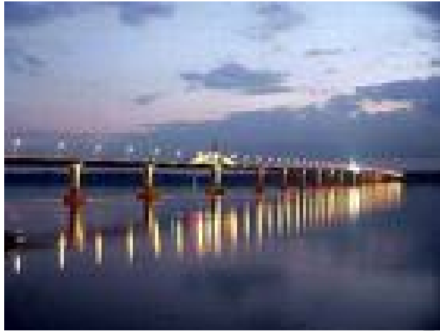
สะพานมิตรภาพไทยลาว