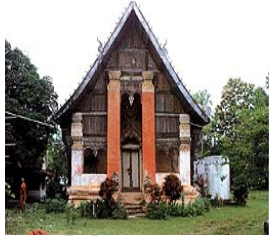
วัดพระศรีมหาโพธิ (วัดโพธิ์ศรี).