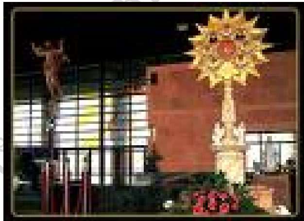
สักการสถานพระมรดาแห่งมรณสักขีสองดอน.