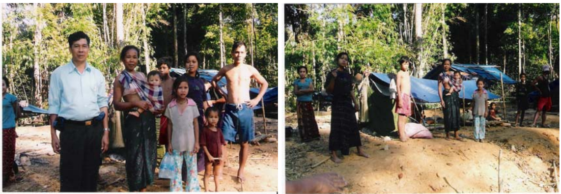
ภาพที่ 4.8 ชาวละแวก เมืองไซเซษฐา ขณะออกเก็บขี้ชันอยู่ระหว่างทางจากแขวงอัตปือไปด่านภูเกือชายแดนเวียดนาม