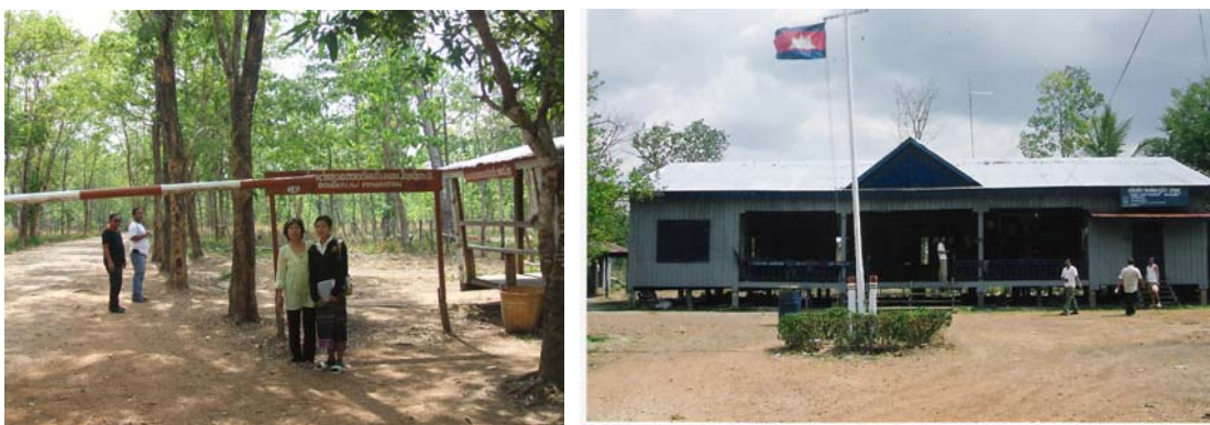
ภาพที่ 4.13 ด่านชายแดนดงกะลอฝั่งลาวและฝั่งกัมพูชา ทางผ่านไปจังหวัดเชียงแตง ของกัมพูชา

หลังจากนั้นในวันที่ 24 เมษายน 2550 ได้เดินทางไปยังชายแดนของประเทศกัมพูชา ที่บริเวณด่านถาวรดงกะลอ แขวงเมืองแตง เพื่อที่จะไปค้นหาเมืองแสนปาง ซึ่งอยู่ห่างจากตัวเมืองปากเซ แขวงจำปาสักประมาณ 180 กิโลเมตร เมื่อไปถึงพบว่าสภาพทางเป็นลูกรัง แต่มีร่องรอยของถนนลาดยางสมัยฝรั่งเศสอยู่บ้างเป็นช่วง ๆ ซึ่งเข้าไปค่อนข้างลำบาก เมื่อไปถึงด่านชายแดน กัมพูชาต้องทำวีซ่า (VISA) ผ่านแดนด้วย ซึ่งไทยยังไม่ได้มีข้อตกลงกับกัมพูชา ประกอบกับไม่มีรถประจำทาง ส่วนรถที่นำไปจากลาวจะนำเข้าไปไม่ได้ จึงได้แต่ถามข้อมูล ซึ่งได้ความว่า เมืองแสนปางเป็นเมืองเล็ก ๆ อยู่ในเขตพื้นที่ของจังหวัดเชียงแตง (เรียกในภาษาลาว) หรือจังหวัดสตริงตรง (เรียกในเขตกัมพูชา) ห่างจากด่านไปประมาณ 3 หลัก จะมีถนน เลี้ยวซ้ายไปอีก 5 หลัก ก็ถึง จึงสรุปความได้ว่า ที่เอกสารทางประวัติศาสตร์ ได้พูดถึงชาวทวยหรือชาวส่วยว่าอพยพมาจากเมืองอัตปือแสนปางนั้น สามารถยืนยันได้ว่า เมืองดังกล่าวมีอยู่จริง และเป็นเมืองที่เป็นดินแดนแห่งชนเผ่าในอดีต และบางส่วนในปัจจุบันด้วย