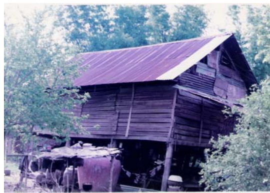
ภาพที่ 4.1 สภาพบ้านเรือนของชาวกวยหรือส่วยหมู่บ้านตากกลาง ตำบลกะโพ อำเภอท่าตูม จังหวัดสุรินทร์

ส่วนในด้านความเชื่อนั้นชาวกวย มีความเชื่อในเรื่องภูติผีปีศาจอยู่มากเช่นกันกับชาวไทยกลุ่มอื่นส่วนใหญ่จะเป็นความเชื่อเกี่ยวกับพิธีกรรมอันผูกพันกับชีวิตประจำวัน การประกอบอาชีพและความสัมพันธ์ทางสังคม เช่น ความเชื่อเรื่องปะกำ ผีปู่ตา ผีเจ้าเข้าทรง ผีปอบ เสน่ห์ ยาแฝด เครื่องรางของขลัง เป็นต้น แต่ปัจจุบันความเชื่อดังกล่าวกำลังถูกแทนที่ด้วยความเชื่อและค่านิยมสมัยใหม่ที่เข้ามาพร้อมกับการพัฒนาแผนใหม่ จึงทำให้ชาวกวยบางส่วนละเลยความ