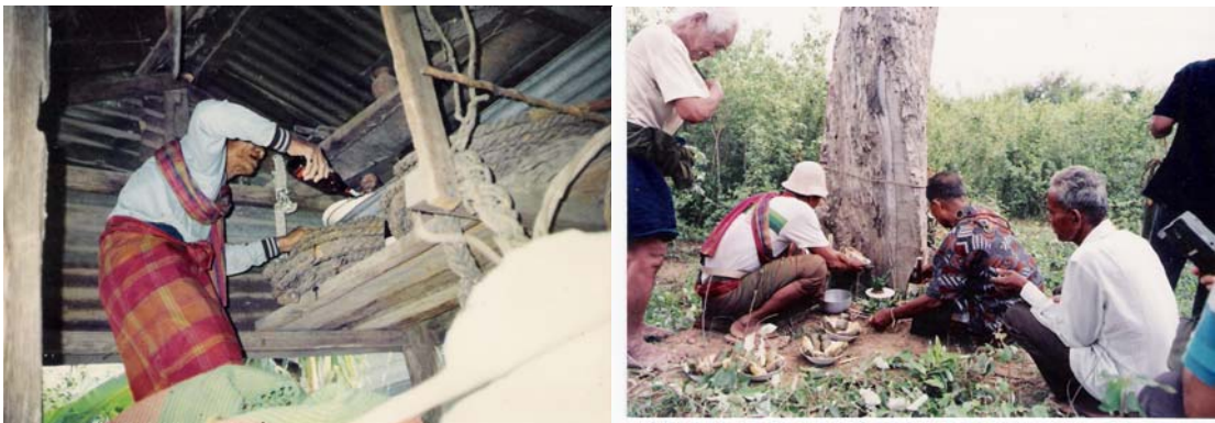
ภาพที่ 4.15 การเซ่นไหว้ผีของชาวทวยหมู่บ้านช้าง ในเขตอีสานใต้ของประเทศไทย

สิ่งที่ยืนยันถึงความเชื่อมโยงทางวัฒนธรรมได้ดีที่สุด คือ วิถีชีวิต ความเชื่อ และภาษาพูด จากหลักฐานที่ได้นำเสนอมาให้เห็นแล้วว่า ชาวทวยหรือส่วยทั้งในลาวใต้และอีสานใต้มีความเชื่อในเรื่องผี และสิ่งเหนือธรรมชาติ เป็นหลักการในการประกอบพิธีกรรมใด ๆ ในชีวิต จะผูกพันกับผีแทบทั้งหมด ด้วยความยึดมั่นในความเชื่อและประเพณีพิธีกรรมดังกล่าว จึงทำให้กลุ่มชนชาวทวยหรือส่วยทั้งในลาวใต้อีสานใต้พัฒนาได้ช้ากว่าคนกลุ่มอื่นในด้านการดำรงชีวิตก็จะอยู่ตามพื้นที่ห่างไกลที่เป็นป่าเขา ซึ่งปลอดภัยจากการรบกวนของคนกลุ่มอื่นเป็นหลัก ยกเว้นจะหลีกเลี่ยงไม่ได้ มีอาชีพหลักในการเก็บของป่าล่าสัตว์ และทอผ้า โดยจะมีความชำนาญในการจับช้างและฝึกช้างไว้ใช้งานเป็นพิเศษ ทั้งชาวทวยในลาวใต้และเขตอีสานใต้ จะใช้ภาษาที่ใช้กับช้างเหมือนกัน นับถือผีปะกำ เหมือนกัน และที่สำคัญคือ ใช้ภาษาพูดเหมือนกัน และก็ไม่มีอักษรเป็นของตนเองเช่นกัน