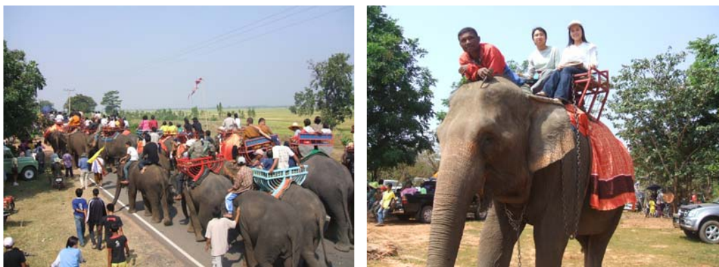
ภาพที่ 4.17 การนำช้างมาใช้เพื่อการท่องเที่ยวของหมู่บ้านช้างตำบลกระโพ อำเภอท่าตูม จังหวัดสุรินทร์ ประเทศไทย

2) การเลี้ยงช้างและนำช้างมาใช้เพื่อการท่องเที่ยว ทั้งในอีสานใต้และลาวใต้ ต่างมีการนำช้างมาฝึกและนำมาใช้เพื่อการท่องเที่ยวเช่นกัน โดยที่หมู่บ้านช้างจังหวัดสุรินทร์ของประเทศไทยได้มีการนำช้างมาแสดงกิจกรรมต่าง ๆ เช่น ตะเตะฟุตบอล ชักกะเยอกับคน เก็บของ เป็นต้น ที่ศูนย์คชศาสตร์ ซึ่งเป็นศูนย์บริการการท่องเที่ยวประจำของหมู่บ้านที่ดูแล โดยองค์การบริหารส่วนจังหวัดสุรินทร์ ในทำนองเดียวกันที่บ้านเกียดไฉ้ เมืองปะทุมพร แขวงจำปาสัก ของ ส.ป.ป.ลาว ก็ได้มีการนำช้างมาบริการให้นักท่องเที่ยวนั่งขึ้นไปท่องเที่ยวบนภูอาสา ซึ่งเป็นภูเขาสูงในป่าสงวนแห่งชาติเซเปียนและเป็นภูเขาที่มีแหล่งโบราณสถานตั้งอยู่ นอกจากนี้ที่หมู่บ้านพะโพและบ้านเครือข่ายยังมีการเลี้ยงช้างอยู่หลายหมู่บ้าน รวมแล้วมีช้างไม่น้อยกว่า 20 เชือก