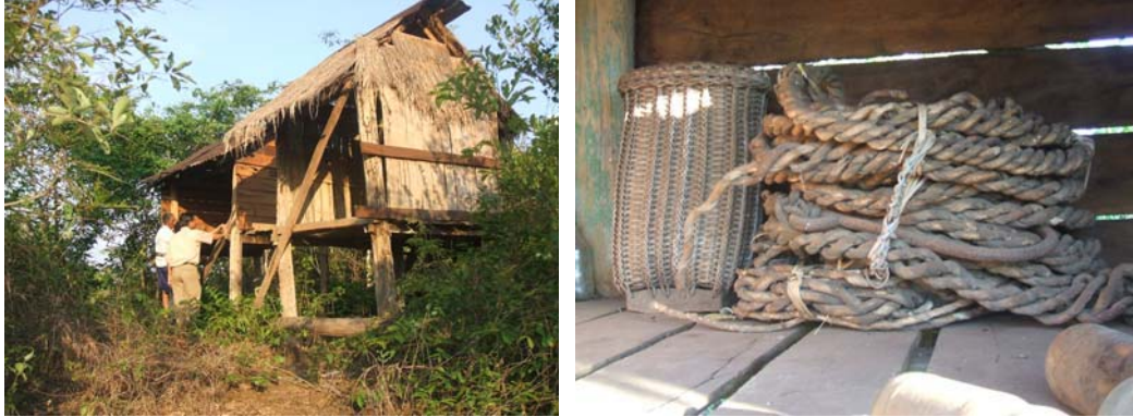
ภาพที่ 4.16 ศาลปะกำหมู่บ้านพะโพ เมืองปะทุมพอน แขวงจำปาสัก ส.ป.ป.ลาว

2) การเลี้ยงช้างและนำช้างมาใช้เพื่อการท่องเที่ยว ทั้งในอีสานใต้และลาวใต้ ต่างมีการนำช้างมาฝึกและนำมาใช้เพื่อการท่องเที่ยวเช่นกัน โดยที่หมู่บ้านช้างจังหวัดสุรินทร์ของประเทศไทยได้มีการนำช้างมาแสดงกิจกรรมต่าง ๆ เช่น ตะเตะฟุตบอล ชักกะเยอกับคน เก็บของ เป็นต้น ที่ศูนย์คชศาสตร์ ซึ่งเป็นศูนย์บริการการท่องเที่ยวประจำของหมู่บ้านที่ดูแล โดยองค์การบริหารส่วนจังหวัดสุรินทร์ ในทำนองเดียวกันที่บ้านเกียดไฉ้ เมืองปะทุมพร แขวงจำปาสัก ของ ส.ป.ป.ลาว ก็ได้มีการนำช้างมาบริการให้นักท่องเที่ยวนั่งขึ้นไปท่องเที่ยวบนภูอาสา ซึ่งเป็นภูเขาสูงในป่าสงวนแห่งชาติเซเปียนและเป็นภูเขาที่มีแหล่งโบราณสถานตั้งอยู่ นอกจากนี้ที่หมู่บ้านพะโพและบ้านเครือข่ายยังมีการเลี้ยงช้างอยู่หลายหมู่บ้าน รวมแล้วมีช้างไม่น้อยกว่า 20 เชือก