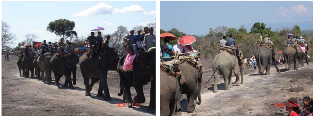
ภาพที่ 4.12 การนำช้างมาใช้ในการท่องเที่ยวของบ้านเกียดโง้ง เมืองปทุมพอน แขวงจำปาสัก ส.ป.ป.ลาว

หลังจากนั้นในวันที่ 24 เมษายน 2550 ได้เดินทางไปยังชายแดนของประเทศกัมพูชา ที่บริเวณด่านถาวรดงกะลอ แขวงเมืองแตง เพื่อที่จะไปค้นหาเมืองแสนปาง ซึ่งอยู่ห่างจากตัวเมืองปากเซ แขวงจำปาสักประมาณ 180 กิโลเมตร เมื่อไปถึงพบว่าสภาพทางเป็นลูกรัง แต่มีร่องรอยของถนนลาดยางสมัยฝรั่งเศสอยู่บ้างเป็นช่วง ๆ ซึ่งเข้าไปค่อนข้างลำบาก เมื่อไปถึงด่านชายแดน กัมพูชาต้องทำวีซ่า (VISA) ผ่านแดนด้วย ซึ่งไทยยังไม่ได้มีข้อตกลงกับกัมพูชา ประกอบกับไม่มีรถประจำทาง ส่วนรถที่นำไปจากลาวจะนำเข้าไปไม่ได้ จึงได้แต่ถามข้อมูล ซึ่งได้ความว่า เมืองแสนปางเป็นเมืองเล็ก ๆ อยู่ในเขตพื้นที่ของจังหวัดเชียงแตง (เรียกในภาษาลาว) หรือจังหวัดสตริงตรง (เรียกในเขตกัมพูชา) ห่างจากด่านไปประมาณ 3 หลัก จะมีถนน เลี้ยวซ้ายไปอีก 5 หลัก ก็ถึง จึงสรุปความได้ว่า ที่เอกสารทางประวัติศาสตร์ ได้พูดถึงชาวทวยหรือชาวส่วยว่าอพยพมาจากเมืองอัตปือแสนปางนั้น สามารถยืนยันได้ว่า เมืองดังกล่าวมีอยู่จริง และเป็นเมืองที่เป็นดินแดนแห่งชนเผ่าในอดีต และบางส่วนในปัจจุบันด้วย