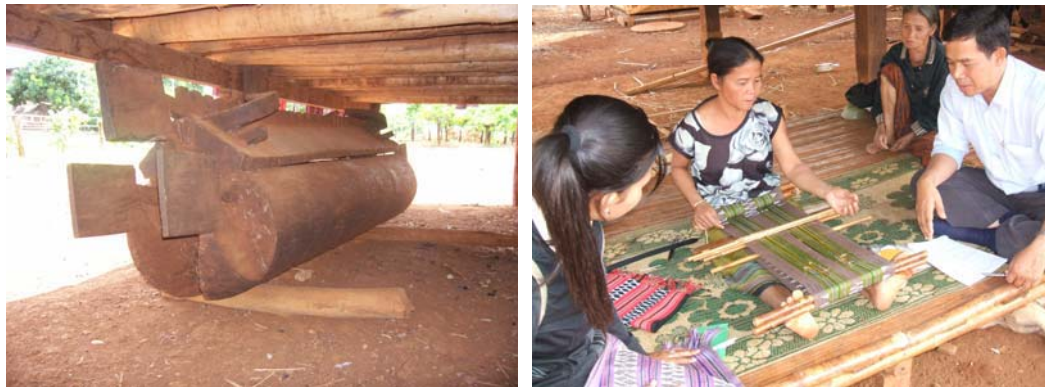
ภาพที่ 4.10 โรงศพที่จัดเตรียมไว้ก่อนตายและการทอผ้าด้วยมือของชาวบ้านห้วยหนุตี้ เมือง เลางาม แขวงสาละวัน

ซึ่งสืบทอดมาจากบ้านเก่า เมืองกะลิม เป็นผู้ประกอบพิธีกรรม นอกจากนี้คนในหมู่บ้าน ยังมี ความเชื่ออีกว่า คนเราอาจตายได้ทุกเมื่อ เพื่อไม่ให้คนอื่นต้องลำบากในการจัดทำโลงศพ จึงมี การเตรียมหาโลงศพไว้ให้ตนเอง ดังนั้นจึงพบเห็นโลงศพตามหน้าบ้านหรือใต้ถุนบ้านอยู่ทั่วไป