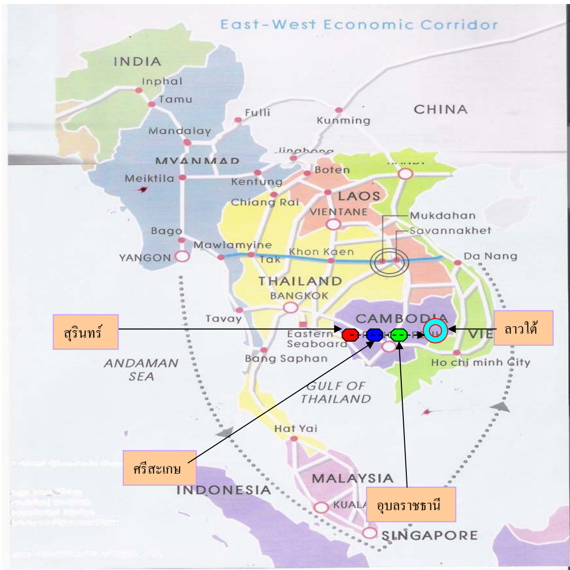
ภาพที่ 4.18 แสดงแผนที่ความเชื่อมโยงระหว่างอีสานใต้และลาวใต้

(2) การประสานร่วมมือระหว่างธุรกิจท่องเที่ยวในเขตอีสานใต้และลาวใต้ โดยมีหน่วยงานส่งเสริมการท่องเที่ยวของรัฐเป็นผู้ประสานให้เกิดความร่วมมือกันอย่างจริงจัง ทั้งในด้านข่าวสารข้อมูล การดูแลและส่งต่อนักท่องเที่ยวในรูปของบัตรเดียวเที่ยวได้ทั่วทั้งอีสานใต้และลาวใต้