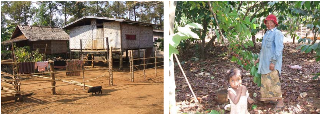
ภาพที่ 4.7 สภาพบ้านเรือนและสวนกาแฟหมู่บ้านชาวละเวหลักชาวแปด เมืองปากเซ แขวงจำปาสัก ส.ป.ป.ลาว

ในระหว่างวันที่ 2-4 กุมภาพันธ์ 2550 ได้เดินทางไปเก็บข้อมูลภาคสนาม ในหมู่บ้าน 2 แห่ง คือ หมู่บ้านชาวบราว หรือในเผ่าบราว บ้านหลักชาวแปด ทางไปเมืองปากซ่อง เป็นชุมชนใหม่ที่เพิ่งตั้งขึ้นเมื่อประมาณ 30 ปีก่อน เนื่องจากทางรัฐบาลมีนโยบายส่งเสริมให้คนเผ่าต่าง ๆ ที่อยู่ตามป่าเขามารวมกันเป็นชุมชนเพื่อสะดวกในการควบคุมพื้นที่ไม่ให้ทำไร่เลื่อนลอย และอีกส่วนหนึ่งจะเป็นกำลังสำคัญในการพัฒนาเศรษฐกิจของประเทศเนื่องจากบริเวณพื้นที่ดังกล่าวเป็นเขตภูเพียงบอละเวณ หรือพื้นที่ราบเชิงเขา ซึ่งเป็นพื้นที่ที่มีการปลูกกาแฟเป็นพืชเศรษฐกิจหลัก ในหมู่บ้านนั้น