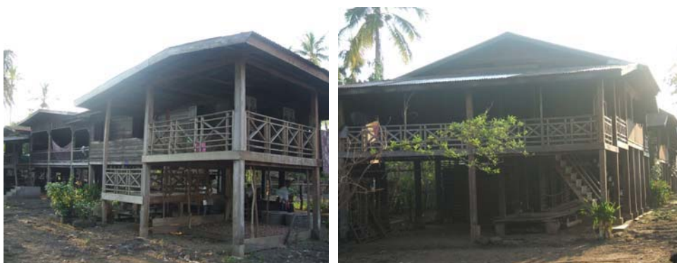
ภาพที่ 4.14 สภาพบ้านเรือนของหมอช้างที่เป็นนายฮ้อยช้างแห่งบ้านพะโพ เมืองปะทุมพอน แขวงจำปาศักดิ์ ส.ป.ป.ลาว

นอกจากหลักฐานที่เป็นเอกสารดังกล่าวแล้ว ยังมีข้อมูลที่ได้จากการสัมภาษณ์ของนายบ้านของบ้านบก เมืองสุขุมา ซึ่งท่านได้ให้ข้อมูลว่า ในสมัยที่ลาวยังเป็นเมืองขึ้นของไทย คนในท้องถิ่นนี้ได้มีการไปมาหาสู่กันเป็นปกติ แม้ปัจจุบันยังได้มีเวลาไปเยี่ยมญาติพี่น้องอยู่ฝั่งไทยอยู่บ้าง และสามารถพูดภาษาส่วยกันได้ทุกคำ จนบางครั้งคนไทยก็อดสงสัยไม่ได้ว่า คนลาวรู้ภาษาส่วยได้อย่างไร ส่วนพ่อสุข ขุนมะนุ หมอช้างใหญ่แห่งบ้านพะโพ เมืองปะทุมพอน ก็บอกว่าแต่ก่อนได้ไปมาหาสู่กันของคนเลี้ยงช้างเป็นปกติ พึ่งมาเห็นห่างจากกันในสมัยที่มีการเปลี่ยนแปลงการปกครองนี้เอง และปัจจุบันนี้ยังมีนายฮ้อยช้างจากฝั่งไทยเข้ามาหาซื้อช้างอยู่ บางครั้งพ่อเองก็ไปส่งช้างให้กับคนไทยบ้าง โดยส่งไปที่เมืองไซยะบุรี แล้วค่อยข้ามไปทางภาคเหนือของไทยจึงส่งต่อไปกรุงเทพฯ ฯ และจังหวัดสุรินทร์ตามความประสงค์ (พ่อสุข ขุนมะนุ, สัมภาษณ์ 24 เมษายน 2550)