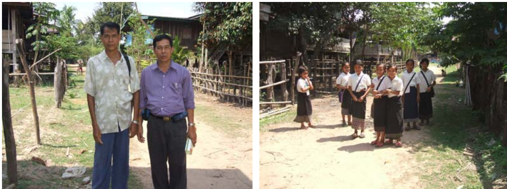
ภาพที่ 4.6 ครูและเด็ก ๆ บ้านสวยเมืองสุขุมมา แขวงจำปาสัก ส.ป.ป.ลาว

เมืองสุขุมมาตั้งอยู่ที่ราบกลางทุ่ง เลยเมืองจำปาสักไปทางใต้ประมาณ 20 หลีก การไปมาระหว่างเมืองเป็นทางแดง แต่ระหว่างหมู่บ้านต่อหมู่บ้านยังเป็นทางดิน และส่วนใหญ่เป็นทางดินลูกรัง เมื่อถึงหน้าฝนจะถูกตัดขาด กัดเซาะ ถือว่าเป็นถิ่นทุรกันดารของแขวงจำปาสัก โดยเฉพาะในหมู่บ้านสวยจะลำบากยิ่งกว่ามาก ไม่ว่าจะเป็นเรื่อง อาชีพ การใช้ชีวิต การศึกษา สุขภาพอนามัย ยังนิยมกินสุก ๆ ดิบ ๆ และเชื่อถือธรรมเนียมเดิม ๆ จึงเปลี่ยนแปลงได้ค่อนข้างยาก และอีกอย่างการศึกษาต่อมีน้อยมาก การไปหางานทำต่างถิ่นก็น้อยกว่าคนลาว เพราะไม่กล้าและขาดความสัมพันธ์กับคนภายนอก (กิตเดด คำสอน, สัมภาษณ์ 22 มีนาคม 2550) ประชากรวัยเด็ก จะพบว่า มีเยอะมิดปกติในหมู่บ้าน จากการสัมภาษณ์นายบ้าน (คำสิงห์ ศรีธรรมวงค์, สัมภาษณ์ 22 มีนาคม 2550) ได้ทราบว่า บ้านบกมี 130 หลังคาเรือน ประชากร 759 คน พ่อแม่เคยเล่าให้ฟังว่าสวยแถบนี้เคยไปมาหาสู่กันกับสวยเมืองสุรินทร์ ครั้งหนึ่งเคยไปสุรินทร์ ฟังคนสุรินทร์พูดกันแล้วรู้เรื่องเกือบทุกคำ จนคนสุรินทร์สงสัยว่ารู้ได้อย่างไร นอกจากนี้พวกหนุ่มสาวที่ไปทำงานที่กรุงเทพฯ บางคนได้มีโอกาสพบกับคนสวยจากไทย ว่าเป็นพวกเดียวกันคุยกันได้ โดยคนในบ้านนี้ไปทำงานในไทยประมาณ 24 คน หมู่บ้านแถบนี้ยังเคยเลี้ยงช้างให้เจ้าบุญอุ้ม ณ จำปาสัก ช้างได้หายไปพร้อมกับการเปลี่ยนแปลงการปกครองในลาว ในปี พ.ศ.2518 ปัจจุบันไม่มีเหลือแล้ว