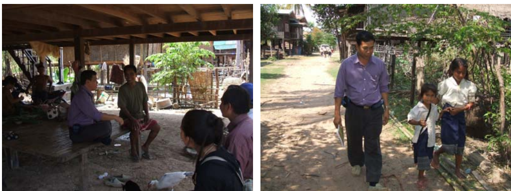
ภาพที่ 4.5 สัมภาษณ์ผู้นำส่วยและเด็กนักเรียนชาวส่วยบ้านบก เมืองสุขุมมา แขวงจำปาสัก ส.ป.ป.ลาว

หมู่บ้านที่ 2 คือ บ้านบก เมืองสุขุมมา แขวงจำปาสัก เมืองสุขุมมาได้ชื่อว่าเป็นเมืองส่วย เพราะมีชาวส่วยอาศัยอยู่มากที่สุดในลาวใต้ มีทั้งหมด 12 หมู่บ้าน จาก 50 หมู่บ้าน หมู่บ้านที่อยู่ใกล้เมือง และอยู่ใกล้หมู่บ้านลาวก็จะกลายเป็นลาว การพูดจาของคนรุ่นใหม่จะเป็นภาษาลาวไปเกือบหมด เหลือเฉพาะคนรุ่นเก่าที่มีอายุ 50 ปีขึ้นไปเท่านั้นที่ยังคงสภาพเป็นส่วยอยู่ ทั้งนี้ด้วยเหตุผลสำคัญ คือ ไม่มีการส่งเสริมให้มีการอนุรักษ์ศิลปวัฒนธรรมชนเผ่า แต่มีนโยบายหลอมรวมเป็นหนึ่งเดียวภายใต้รัฐบาลลาวที่พูดถึงเอกภาพ อิศรภาพ และเอกราช ด้วยเหตุนี้ความภูมิใจในความเป็นส่วยจึงไม่ได้รับการกระตุ้น เพื่อการยอมรับและความกลมกลืนส่วนใหญ่ซึ่งเป็นคนลาว คนส่วยต้องปรับตัวเป็นลาว คล้ายๆ กับชนเผ่าอื่นๆ ในลาว