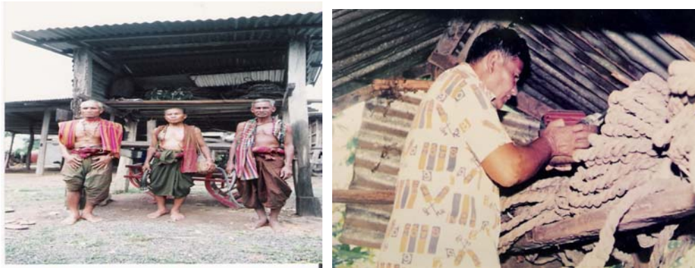
ภาพที่ 4.2 ศาลปะกำและการเช่นผีประจำของชาวทวายหรือส่วยหมู่บ้านช้าง จังหวัดสุรินทร์

เชื่อและประเพณีเดิมของตน หันมายอมรับนับถือวัฒนธรรมใหม่เช่นเดียวกับชาวไทยกลุ่มอื่น ๆ จะมีชาวทวายเพียงส่วนน้อยเท่านั้นที่ยังคงรักษารูปแบบความเชื่อและวิถีชีวิตแบบเดิมของตนไว้ เพียงแต่มีการปรับตัวเพื่อให้สอดคล้องกับสภาพแวดล้อมทางสังคมที่เปลี่ยนแปลงไปบ้างเท่านั้น ซึ่งชาวทวายเหล่านี้เกือบทั้งหมดจะอาศัยอยู่ในเขตพื้นที่ห่างไกลจากสังคมเมือง เช่น ที่หมู่บ้านตากกลาง บ้านศาลา และบ้านโคกไทร จังหวัดสุรินทร์ เป็นต้น ซึ่งในหมู่บ้านดังกล่าวยังมีความเชื่อและพิธีกรรมเกี่ยวกับความเชื่อในเรื่องเหล่านั้นอยู่ ถ้าหากเข้าไปในหมู่บ้านก็จะพบสภาพบ้านเรือนแบบดั้งเดิม และศาลปะกำ ตลอดจนเครื่องมือเครื่องใช้ที่เกี่ยวกับช้าง เช่น หนั่งปะกำ ไซ้ และเสลียง หรือแฉ่งช้าง เป็นต้น