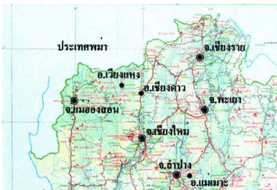
ภาพที่ 2.1 แผนที่อำเภอเวียงแหง จังหวัดเชียงใหม่

คำขวัญของอำเภอเวียงแหง คือ พระธาตุแสนไหเป็นศรี ประเพณีหลายเผ่า ชมทิวเขาสุดสยาม งามล้ำค่าฟ้าเวียงแหง