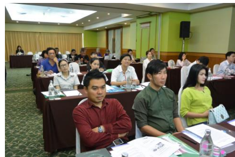
ภาพกิจกรรมวันที่ 14 กรกฎาคม 2558