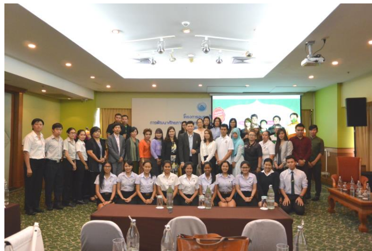
ภาพกิจกรรมวันที่ 14 กรกฎาคม 2558