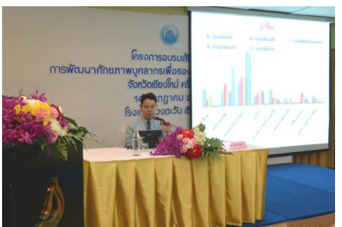
ภาพกิจกรรมวันที่ 14 กรกฎาคม 2558