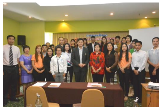
การจัดการอบรมวันที่ 28-29 เมษายน 2558