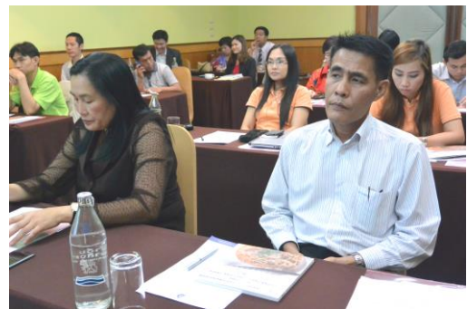
การจัดการอบรมวันที่ 28-29 เมษายน 2558