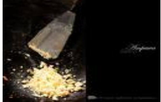
ภาพที่ 2.2 การขึ้นตาล และการเคี้ยวตาล