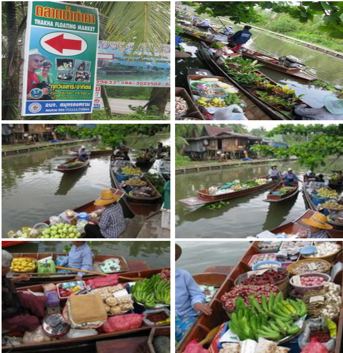
ภาพที่ 1.1 บรรยากาศตลาดน้ำท่าคา

กันมาจนถึงยุคของตลาดน้ำท่าคาในปัจจุบัน “ตลาดน้ำท่าคา” จึงยังเป็นตลาดน้ำที่คงสภาพของชุมชนริมน้ำที่มีวิถีชีวิตของการหาเลี้ยงชีพที่ดำเนินไปอย่างเรียบง่าย ตามครรลองของธรรมชาติ ที่มีสายน้ำเป็นตัวกำหนดดังเช่นในอดีต วัตถุประสงค์ของตลาดน้ำยังคงเป็นไปเพื่อการซื้อขายแลกเปลี่ยนระหว่างผู้คนในท้องถิ่นเป็นสำคัญ