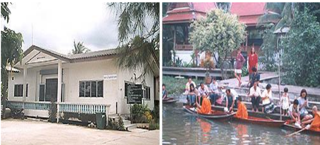
ภาพที่ 2.1 ที่ทำการชุมชน และบรรยากาศการทำบุญตักบาตรยามเช้าที่ท่าคา

ท่าคามีการบริหารของ อบต. ในรูปสภา อบต. มีประธานสภา รองประธานสภา นายก อบต. ปลัด อบต. ประธานกรรมการบริหาร อบต. และกรรมการ จำนวน 2 คน รวมทั้งหมด 7 คน ที่มาจากการเลือกตั้งของชุมชน ส่วนการจัดเครือข่ายองค์กรและกลุ่มต่างๆในตำบลท่าคา มีองค์กรและกลุ่มต่างๆ จำนวนทั้งหมด 8 กลุ่ม ประกอบด้วย กลุ่มออมทรัพย์ กลุ่มกองทุนหมู่บ้าน กลุ่มประเพณีวัฒนธรรม กลุ่มสตรี กลุ่มเรือพาย กลุ่มท่องเที่ยวและ โฮมสเตย์ กลุ่มขนมไทย กลุ่มจักสาน ก้านมะพร้าว และกลุ่มวิสาหกิจชุมชนท่าคา ที่ทำการชุมชนตั้งอยู่เลขที่ 1 หมู่ที่ 2 ตำบลท่าคา อำเภออัมพวา จังหวัดสมุทรสงคราม 75110 ผู้นำชุมชนและกลุ่มในปัจจุบัน คือ นางอุไร สีเหลือง สถานที่สำคัญในตำบลท่าคา ได้แก่ วัดฉิมฉัตร วัดเทพประสิทธิ์คณาวาส อนามัยท่าคา อนามัยคลองพลับ โรงเรียนวัดฉิมฉัตรไสวประชนสรณ์ โรงเรียนวัดเทพประสิทธิ์คณาวาส โรงเรียนเทพสุวรรณชาญวิทยา และที่สำคัญยิ่งคือ ตลาดน้ำท่าคา ซึ่งเป็นแหล่งท่องเที่ยวที่สำคัญที่สุดของท่าคา มีลักษณะเป็นตลาดนัดที่ชาวบ้านได้พายเรือ นำอาหาร ผัก และผลไม้ท้องถิ่นมาขายตลอดจนมีบริการท่องเที่ยว เช่น การพายเรือเที่ยวชมหมู่บ้านและสวนผลไม้รอบๆ ตลาดน้ำท่าคา